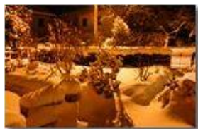
La neve della Befana

Guido Marcheselli - Canon EOS 300D 2009 - Inverno - Savignone - Altro