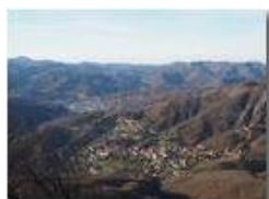
Savingone dal Monte Maggio

Guido Marcheselli - Olympus OM-D E-M10 Mark III 2019 - Inverno - Savignone - Paesi