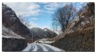
Neve tra Costa di Montemaggio e Sorrivi

Guido Marcheselli - HTC One S Nokia C7-00 (o altro cell) 2016 - Inverno - Savignone - Panorami