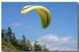
Parapendio fase 3: la decisione è presa, si va!

Pietro Marcheselli - Canon EOS 300D 2006 - Estate - Savignone - Altro