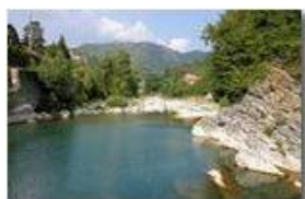
Fiume Scrvia a metà settembre

Pietro Marcheselli - Canon EOS 300D 2009 - Estate - Savignone - Panorami