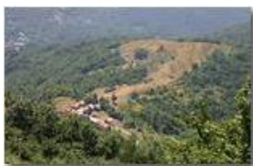
Pascoli a Costa di Montemaggio

Pietro Marcheselli - Canon EOS 300D 2005 - Estate - Savignone - Fiori&Fauna