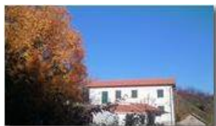
Autunno alla Maggetta

Pietro Marcheselli - Canon Ixus 980 IS 2013 - Inverno - Savignone - Panorami