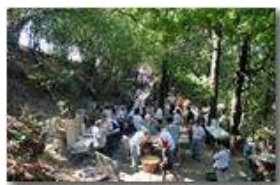
Festa del Monte Pianetto (prima domenica settembre)

Pietro Marcheselli - Canon EOS 300D 2009 - Estate - Savignone - Paesi