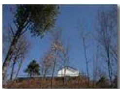
La cappella sulla vetta di M. Maggio

Pietro Marcheselli - Olympus Camedia 3000 2005 - Inverno - Savignone - Paesi