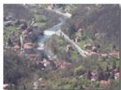
Fiume scrivia in località Ponte di Savignone

Pietro Marcheselli - Panasonic nv-gs70 (VideoCam) 2004 - Estate - Savignone - Paesi