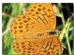
Una farfalla argynnis aglaia

Pietro Marcheselli - Canon Ixus 980 IS 2010 - Estate - Savignone - Fiori&Fauna