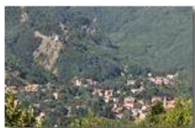
Teleobiettivo su Savignone e Castello Fieschi

Pietro Marcheselli - Canon EOS 300D 2008 - Estate - Savignone - Panorami