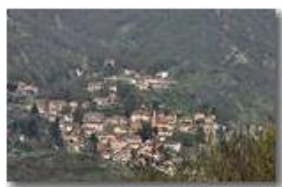
Variazioni stagionali: il paese di Savignone in marzo

Pietro Marcheselli - Canon EOS 300D 2007 - Estate - Savignone - Paesi