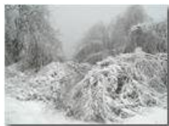
Neve e galaverna

Pietro Marcheselli - Olympus Camedia 3000 2004 - Inverno - Savignone - Boschi