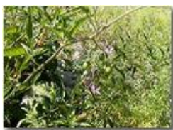
Solanum dulcamara: fiori e frutti

Pietro Marcheselli - Canon EOS 300D 2005 - Estate - Savignone - Panorami