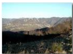
Savignone dal M. Cappellino

Pietro Marcheselli - Olympus Camedia 3000 2002 - Inverno - Savignone - Boschi