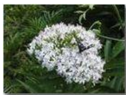
Farfalla Amata Phegea su infiorescenza

Pietro Marcheselli - Olympus Camedia 3000 2004 - Estate - Savignone - Fiori&Fauna