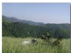
Il mio cane, Brina

Pietro Marcheselli - Olympus Camedia 3000 <2001 - Estate - Savignone - Panorami