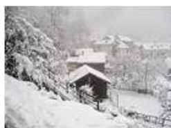
6 Febbraio: prima neve a Savignone

Pietro Marcheselli - Canon Ixus 980 IS 2018 - Inverno - Savignone - Altro