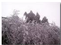
Siepe di ghiaccio

Pietro Marcheselli - Canon Ixus 980 IS 2011 - Inverno - Savignone - Panorami