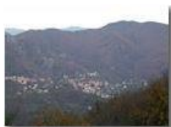
Savignone in novembre al tramonto

Pietro Marcheselli - Olympus Camedia 3000 2002 - Inverno - Savignone - Panorami