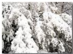
6 Febbraio: prima neve a Savignone

Pietro Marcheselli - HTC One S Nokia C7-00 (o altro cell) 2018 - Inverno - Savignone - Boschi