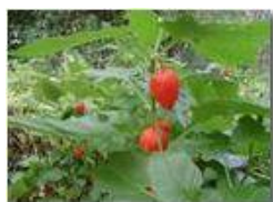
Frutto di alkekengi

Pietro Marcheselli - Olympus Camedia 3000 2002 - Inverno - Savignone - Boschi