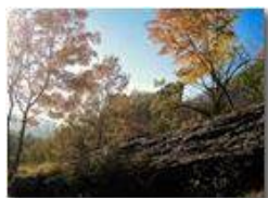
Autunno al Castello

Pietro Marcheselli - Canon Ixus 980 IS 2017 - Estate - Savignone - Boschi