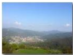
Casella nella foschia serale, vista dai prati di Gualdrà

Pietro Marcheselli - HTC One S Nokia C7-00 (o altro cell) 2018 - Estate - Savignone - Boschi