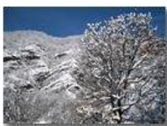
Sulle pendici del Castello Fieschi

Pietro Marcheselli - Canon Ixus 980 IS 2012 - Inverno - Savignone - Paesi