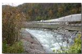
Crollo diga e frana strada provinciale a Ponte di Savignone: il nuovo corso

Guido Marcheselli - Canon Ixus 980 IS 2012 - Inverno - Savignone - Paesi