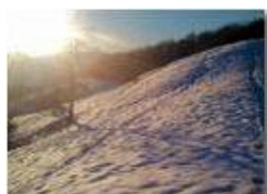
Neve sul Monte Cappellino

Pietro Marcheselli - Canon Ixus 980 IS 2013 - Estate - Savignone - Panorami