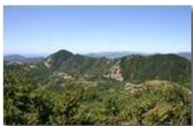
Il Monte Maggio con la Costa Suia

Pietro Marcheselli - Canon EOS 300D 2005 - Estate - Savignone - Fiori&Fauna