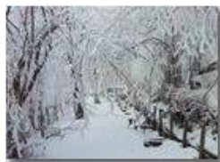
Brinata sul Monte Pianetto

Pietro Marcheselli - Canon Ixus 980 IS 2013 - Inverno - Savignone - Altro