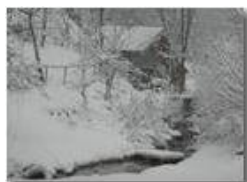
Savignone: nei boschi di Piambertone nella neve

Pietro Marcheselli - Olympus Camedia 3000 2005 - Inverno - Savignone - Boschi