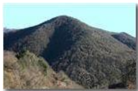
Il monte Fueba

Pietro Marcheselli - Canon EOS 300D 2009 - Inverno - Savignone - Panorami