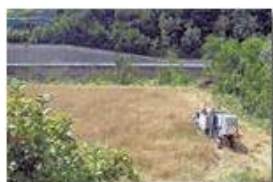
Tra un acquazzone e l'altro: la mietitura

Pietro Marcheselli - Canon Ixus 980 IS 2014 - Estate - Savignone - Fiori&Fauna