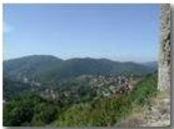
La frazione Gabbie di Savignone e la valle scriviva vista dal castello

Pietro Marcheselli - Olympus Camedia 3000 <2001 - Estate - Savignone - Paesi