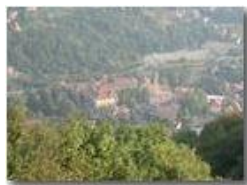
La piazza di Savignone ripresa verso sera a fine agosto dal M. Pianetto

Pietro Marcheselli - Olympus Camedia 3000 <2001 - Estate - Savignone - Paesi