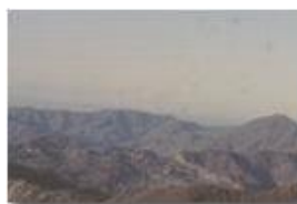
Bastia e Monte Reale (m. 902) dal M. Maggio

Guido Marcheselli - Olympus Camedia 3000 <2001 - Foto varie - Savignone - Paesi