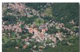
Savignone dal Monte Maggio

Pietro Marcheselli - Canon EOS 300D 2010 - Estate - Savignone - Paesi