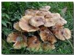
Un fungo del genere armillaria

Pietro Marcheselli - Olympus Camedia 3000 2005 - Inverno - Savignone - Panorami