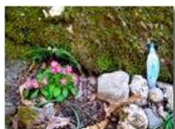
Un'apparizione nel bosco

Pietro Marcheselli - Canon Ixus 980 IS 2016 - Estate - Savignone - Fiori&Fauna