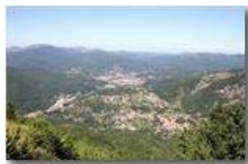
Savignone e Busalla dal Monte Maggio

Pietro Marcheselli - Canon Ixus 980 IS 2010 - Estate - Savignone - Paesi