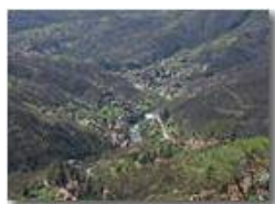
Savignone: frazioni Ponte e San Bartolomeo

Pietro Marcheselli - Canon EOS 300D 2005 - Estate - Savignone - Panorami