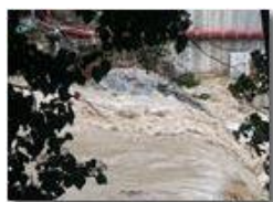
Cantiere nello Scrivia il 2 ottobre

Pietro Marcheselli - HTC One/Nokia C7/Samsung S7/S10 2020 - Estate - Savignone - Altro