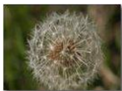
Pappi di tarassaco

Pietro Marcheselli - Olympus Camedia 3000 2004 - Inverno - Savignone - Paesi