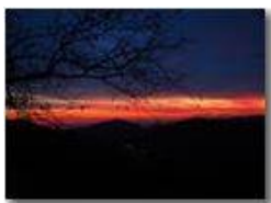
Tramonto invernale verso i forti di Genova e il mare

Guido Marcheselli - Olympus OM-D E-M10 Mark III 2019 - Inverno - Savignone - Fiori&Fauna