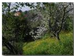
Angolo fiorito alla Vittoria ranuncoli ecc.

Pietro Marcheselli - Olympus Camedia 3000 2002 - Estate - Savignone - Fiori&Fauna