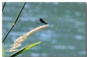
Libellula della specie Calopteryx virgo

Pietro Marcheselli - Canon EOS 300D 2007 - Estate - Savignone - Fiori&Fauna