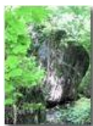
Resti di antica frana nel bosco

Pietro Marcheselli - Canon EOS 300D 2010 - Estate - Savignone - Altro