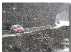
Fiocca la neve, lenta, lenta, lenta...

Pietro Marcheselli - Canon Ixus 980 IS 2010 - Inverno - Savignone - Altro