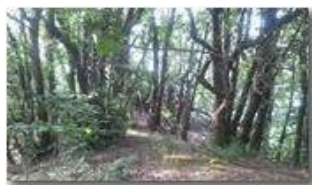
La boscosa sommità del Monte Moro (detto anche Monte Crosi)

Pietro Marcheselli - Canon Ixus 980 IS 2013 - Estate - Savignone - Altro