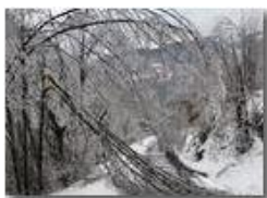
Gelicidio/galaverna: mi piego ma mi spezzo...

Pietro Marcheselli - Canon Ixus 980 IS 2010 - Inverno - Savignone - Paesi