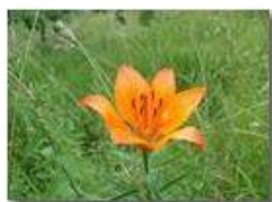
Giglio rosso (lilium bulbiferum)

Pietro Marcheselli - Olympus Camedia 3000 <2001 - Estate - Savignone - Fiori&Fauna