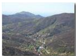
Da Savignone: i Forti di Genova e il Mar Ligure

Pietro Marcheselli - Canon EOS 300D 2005 - Estate - Savignone - Panorami