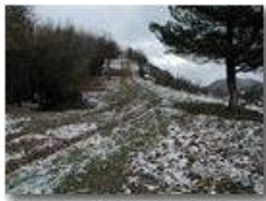
Novembre: si rivede la neve

Pietro Marcheselli - Olympus Camedia 3000 2005 - Inverno - Savignone - Panorami