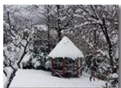
Neve a Savignone

Pietro Marcheselli - Canon Ixus 980 IS 2015 - Inverno - Savignone - Panorami