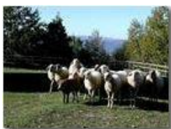
Foto di gruppo sul M. Maggio