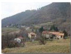
Savignone: frazione Inastr di M.Maggio

Pietro Marcheselli - Olympus Camedia 3000 2005 - Inverno - Savignone - Panorami