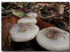
Fungo pevein ( Clitocybe nebularis )

Pietro Marcheselli - Olympus Camedia 3000 2005 - Inverno - Savignone - Boschi