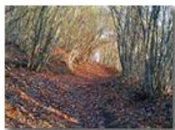
Sentieri in autunno

Pietro Marcheselli - Altro/Other 2017 - Inverno - Savignone - Boschi