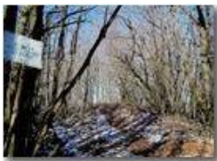
Pianetto: la vetta cartografica

Pietro Marcheselli - Altro/Other 2014 - Inverno - Savignone - Boschi