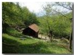
Un angolo della valle del rio Maggione

Pietro Marcheselli - HTC One S Nokia C7-00 (o altro cell) 2018 - Estate - Savignone - Boschi