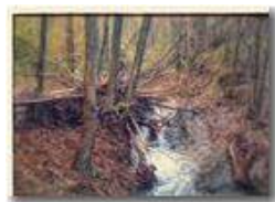
Effetti collaterali delle piogge autunnali

Pietro Marcheselli - Canon Ixus 980 IS 2015 - Inverno - Savignone - Fiori&Fauna