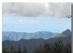
Ombre e luci verso il Monte Reale e la pianura padana

Pietro Marcheselli - Canon Ixus 980 IS 2011 - Inverno - Savignone - Fiori&Fauna