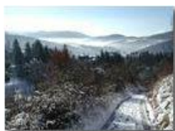
Debole nevicata su Savignone

Guido Marcheselli - Olympus Camedia 3000 2003 - Inverno - Savignone - Panorami