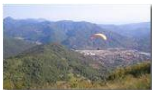
In volo verso la piana di Casella

Pietro Marcheselli - Altro/Other 2012 - Estate - Savignone - Panorami