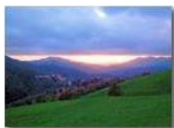
Contrasti di luce sulla Val Polcevera

Pietro Marcheselli - Canon Ixus 980 IS 2013 - Inverno - Savignone - Altro