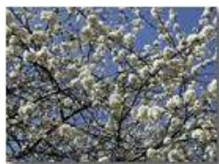
Amareno in fiore

Pietro Marcheselli - Olympus Camedia 3000 2002 - Estate - Savignone - Fiori&Fauna