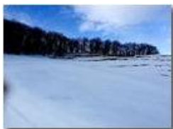
Neve di Marzo: i pascoli del Monte Cappellino

Pietro Marcheselli - HTC One S Nokia C7-00 (o altro cell) 2018 - Inverno - Savignone - Panorami