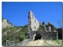
Castello Fieschi: rovine

Pietro Marcheselli - Canon Ixus 980 IS 2012 - Estate - Savignone - Altro