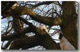
Gatto e cane

Pietro Marcheselli - Canon EOS 300D 2006 - Inverno - Savignone - Panorami