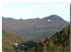
Frazione Vallecaldà di Savignone: a fronte Colonia e M. Maggio

Pietro Marcheselli - Olympus Camedia 3000 2002 - Inverno - Savignone - Panorami