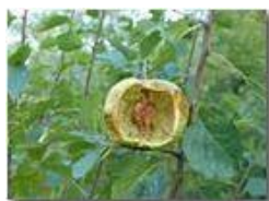
Mela cava: quel che lasciano le vespe

Pietro Marcheselli - Canon Ixus 980 IS 2016 - Estate - Savignone - Fiori&Fauna