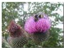
Bombice su fiore di cardo (Cirsium eriophorum)

Pietro Marcheselli - Olympus Camedia 3000 <2001 - Estate - Savignone - Altro