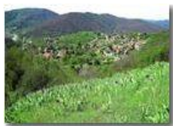
Le Gabbie di Savignone, dal Castello Fieschi

Pietro Marcheselli - Canon Ixus 980 IS 2014 - Estate - Savignone - Paesi