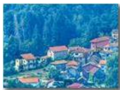
Zoomata sulla frazione Prelo

Pietro Marcheselli - Altro/Other 2016 - Estate - Savignone - Fiori&Fauna