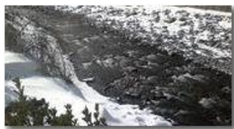
Fiume Scrivia a Ponte di Savignone

Guido Marcheselli - Nokia C7-00 (o altro Smartphone) 2013 - Inverno - Savignone - Panorami