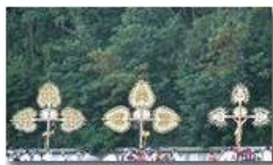
Tradizionale processione festa NS di Lourdes

Pietro Marcheselli - Altro/Other 2013 - Estate - Savignone - Altro