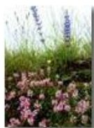
Fioriture di inizio estate

Pietro Marcheselli - Canon Ixus 980 IS 2016 - Estate - Savignone - Fiori&Fauna