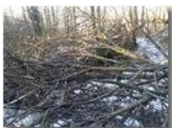
Effetto gelo: sentieri invernali

Guido Marcheselli - Olympus OM-D E-M10 Mark III 2019 - Inverno - Savignone - Panorami