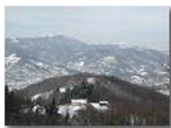
Costalovaia con neve

Pietro Marcheselli - Olympus Camedia 3000 2004 - Inverno - Savignone - Boschi