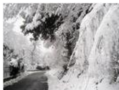
6 Febbraio: prima neve a Savignone

Pietro Marcheselli - Canon Ixus 980 IS 2018 - Inverno - Savignone - Altro