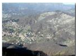
Savignone dal M. Maggio ad inizio inverno

Pietro Marcheselli - Olympus Camedia 3000 2002 - Inverno - Savignone - Panorami