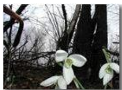
Galantus nivalis bucaneve

Pietro Marcheselli - Olympus Camedia 3000 2002 - Estate - Savignone - Fiori&Fauna