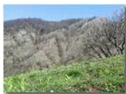
Primi accenni di primavera al Castello Fieschi

Pietro Marcheselli - HTC One S Nokia C7-00 (o altro cell) 2018 - Inverno - Savignone - Panorami