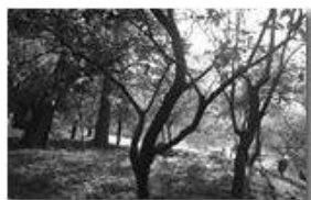
Alba a Vaccarezza

Guido Marcheselli - Olympus Camedia 3000 2006 - Inverno - Savignone - Boschi