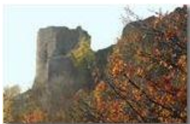
Castello Fieschi: particolare

Pietro Marcheselli - Canon EOS 300D 2007 - Inverno - Savignone - Boschi