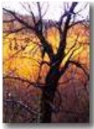
Bosco d'inverno: luci al tramonto (cellulare Nokia 70)

Pietro Marcheselli - Altro/Other 2007 - Inverno - Savignone - Boschi