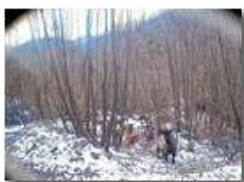
Incontri nella Valle Rio Maggione

Pietro Marcheselli - Altro/Other 2015 - Inverno - Savignone - Altro