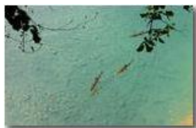
Trote(?) nel fiume Scrivia, Ponte di Savignone

Guido Marcheselli - Canon EOS 300D 2014 - Estate - Savignone - Fiori&Fauna