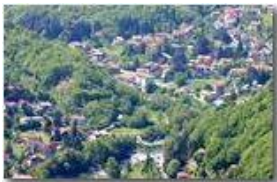
Savignone : frazioni Ponte e San Bartolomeo di Vallecaldà

Pietro Marcheselli - Canon EOS 300D 2007 - Estate - Savignone - Fiori&Fauna