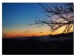
Tramonto da Montemaggio

Guido Marcheselli - Olympus OM-D E-M10 Mark III 2020 - Inverno - Savignone - Boschi