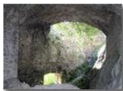
Castello fieschi: Interno

Pietro Marcheselli - Canon Ixus 980 IS 2012 - Estate - Savignone - Altro