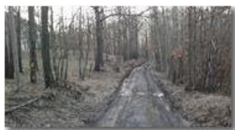
Da Ramà a Ponte di Savignone

Guido Marcheselli - Nokia C7-00 (o altro Smartphone) 2013 - Inverno - Savignone - Boschi