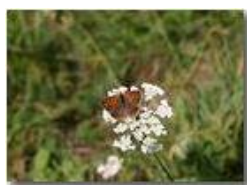
Farfalla aglais urticae

Pietro Marcheselli - Canon EOS 300D 2005 - Estate - Savignone - Fiori&Fauna