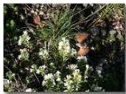
Rifornimento in volo: farfalla che succhia il nettare

Pietro Marcheselli - Canon EOS 300D 2005 - Estate - Savignone - Fiori&Fauna