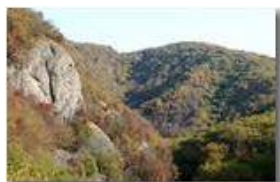
Valle del Rio Maggione: boschi e Monte Crosi

Pietro Marcheselli - Canon EOS 300D 2009 - Inverno - Savignone - Boschi