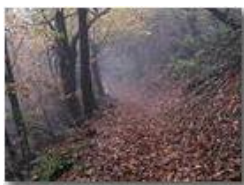
Autunno nel bosco

Pietro Marcheselli - Olympus Camedia 3000 2005 - Inverno - Savignone - Boschi