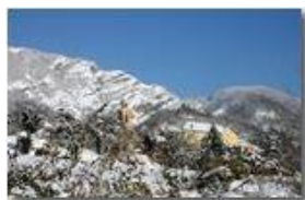
Savignone sotto la neve: Parrocchia San Pietro e ruderi del Castello

Pietro Marcheselli - Canon EOS 300D 2009 - Inverno - Savignone - Panorami