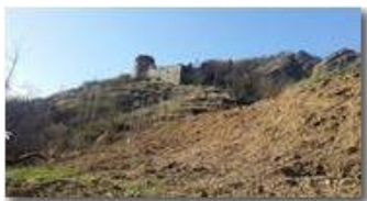
Castello Fieschi a fine inverno

Pietro Marcheselli - Canon Ixus 980 IS 2017 - Inverno - Savignone - Panorami