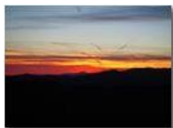
Tramonto da Montemaggio

Guido Marcheselli - Olympus OM-D E-M10 Mark III 2016 - Inverno - Savignone - Panorami