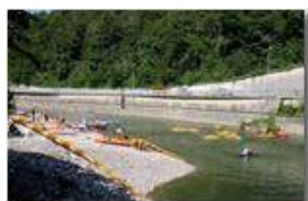
Parco fluviale di Savignone

Pietro Marcheselli - Altro/Other 2011 - Estate - Savignone - Fiori&Fauna