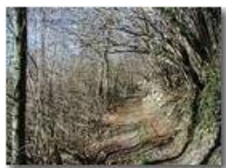
Prime luci della primavera nei boschi

Pietro Marcheselli - Olympus Camedia 3000 2002 - Inverno - Savignone - Panorami