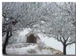
Brinata sul Monte Pianetto

Pietro Marcheselli - Canon Ixus 980 IS 2013 - Inverno - Savignone - Altro