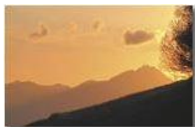
Santuario N.S. Guardia: luci al tramonto

Pietro Marcheselli - Canon Ixus 980 IS 2011 - Inverno - Savignone - Altro