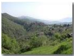
La frazione Vittoria vista dai prati del M. Cappellino

Pietro Marcheselli - Olympus Camedia 3000 <2001 - Estate - Savignone - Fiori&Fauna