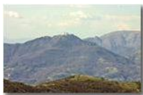
Il santuario della Madonna della Guardia sul monte Figogna

Pietro Marcheselli - Canon EOS 300D 2007 - Estate - Savignone - Panorami