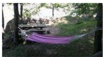
Un invito alla siesta

Pietro Marcheselli - Altro/Other 2017 - Estate - Savignone - Fiori&Fauna