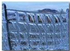
Recinzione di ghiaccio

Pietro Marcheselli - Canon Ixus 980 IS 2011 - Inverno - Savignone - Altro