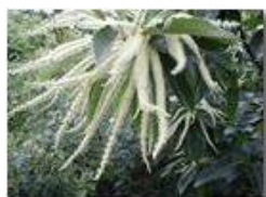
Amenti di castagno

Pietro Marcheselli - Olympus Camedia 3000 <2001 - Estate - Savignone - Fiori&Fauna