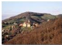
Il santuario della Vittoria

Pietro Marcheselli - Canon Ixus 980 IS 2010 - Inverno - Savignone - Paesi