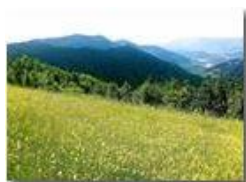
Valpolcevera (da Costa Fontanini)

Pietro Marcheselli - Altro/Other 2014 - Estate - Savignone - Altro