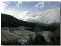
Prima neve in Valle Scrivia

Guido Marcheselli - HTC One S Nokia C7-00 (o altro cell) 2014 - Inverno - Savignone - Panorami