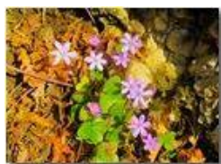
Fiori di epatica

Pietro Marcheselli - Canon Ixus 980 IS 2016 - Estate - Savignone - Fiori&Fauna