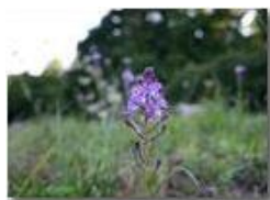
Fiore di Scilla autumnalis

Pietro Marcheselli - Canon EOS 300D 2005 - Estate - Savignone - Fiori&Fauna