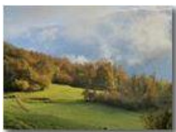
Colori autunnali a Montemaggio

Guido Marcheselli - HTC One/Nokia C7/Samsung S7/S10 2020 - Estate - Savignone - Panorami