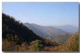
Autunno a Savignone

Pietro Marcheselli - Canon EOS 300D 2009 - Estate - Savignone - Panorami