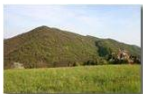
Il santuario e il Monte Vittoria

Pietro Marcheselli - Canon EOS 300D 2007 - Inverno - Savignone - Panorami