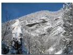
Pendii del Monte Pianetto

Pietro Marcheselli - Canon Ixus 980 IS 2012 - Inverno - Savignone - Altro