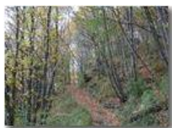
Autunno nel bosco

Pietro Marcheselli - Olympus Camedia 3000 2002 - Inverno - Savignone - Fiori&Fauna