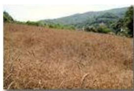
Grano a Savignone: varietà antica d'Abruzzo

Pietro Marcheselli - Canon Ixus 980 IS 2014 - Estate - Savignone - Fiori&Fauna