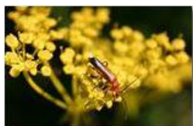
Coleottero (Rhagonyca fulva)

Pietro Marcheselli - Canon EOS 300D 2005 - Estate - Savignone - Panorami