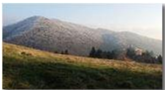
Timidi accenni d'inverno sul Monte Fuea

Pietro Marcheselli - Canon Ixus 980 IS 2017 - Inverno - Savignone - Panorami