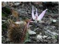
Dente di cane

Pietro Marcheselli - Olympus Camedia 3000 2002 - Estate - Savignone - Fiori&Fauna