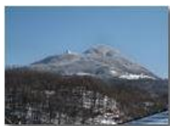
Un brizzolato Monte Maggio

Pietro Marcheselli - Canon EOS 300D 2010 - Inverno - Savignone - Panorami