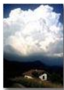
Cumulo pomeridiano temporalesco

Pietro Marcheselli - Altro/Other 2015 - Estate - Savignone - Fiori&Fauna