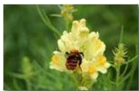
Ape su Bocca di leone gialla (antirrhinum latifolium)

Pietro Marcheselli - Canon EOS 300D 2009 - Estate - Savignone - Fiori&Fauna