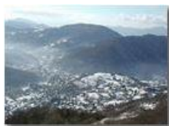
Alta Valle Scrivia: Savignone sotto la neve

Pietro Marcheselli - Olympus Camedia 3000 2003 - Inverno - Savignone - Panorami