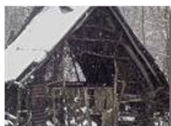
Seconda casa o pertinenza? IMU o NO_IMU?

Pietro Marcheselli - Altro/Other 2014 - Inverno - Savignone - Altro