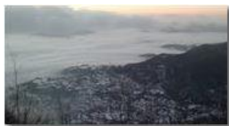
Savignone aggredita dalla nebbia

Guido Marcheselli - Nokia C7-00 (o altro Smartphone) 2013 - Inverno - Savignone - Paesi