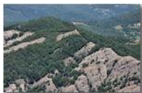
Conglomerato e cappella del Monte Pianetto

Pietro Marcheselli - Canon Ixus 980 IS 2010 - Estate - Savignone - Panorami