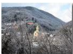
La gelata del 22 dicembre

Pietro Marcheselli - Canon Ixus 980 IS 2010 - Inverno - Savignone - Boschi