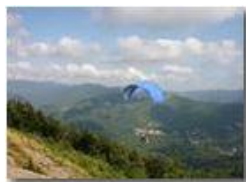
Parapendio in volo

Pietro Marcheselli - Canon EOS 300D 2005 - Estate - Savignone - Altro