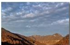
Monte Maggio al tramonto

Pietro Marcheselli - Altro/Other 2015 - Inverno - Savignone - Boschi