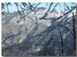
Le Rocche Reopasso schermate dalla brina del monte Pianetto

Pietro Marcheselli - Canon EOS 300D 2010 - Inverno - Savignone - Fiori&Fauna