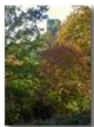
Autunno al Castello Fieschi

Pietro Marcheselli - Canon Ixus 980 IS 2018 - Inverno - Savignone - Boschi