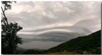
Ufo tra le nuvole?

Guido Marcheselli - Nokia C7-00 (o altro Smartphone) 2014 - Inverno - Savignone - Paesi