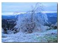
Veduta invernale sulla Valpolcevera

Pietro Marcheselli - Canon Ixus 980 IS 2011 - Inverno - Savignone - Boschi