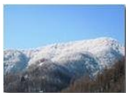
Monte Fuea: ultimi brividi dell inverno

Pietro Marcheselli - Canon Ixus 980 IS 2010 - Inverno - Savignone - Altro