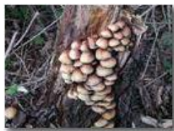
Famigliola di funghi

Pietro Marcheselli - Olympus Camedia 3000 2003 - Inverno - Savignone - Fiori&Fauna