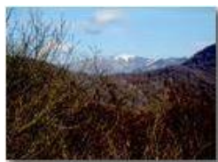
Il Monte Buio visto dalla Cappelletta del Pianetto

Pietro Marcheselli - Altro/Other 2015 - Inverno - Savignone - Panorami