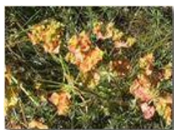
Una euforbia cipressina

Pietro Marcheselli - Olympus Camedia 3000 2004 - Estate - Savignone - Fiori&Fauna