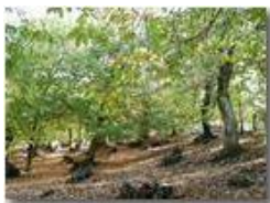
Bosco a Montemaggio

Pietro Marcheselli - Olympus Camedia 3000 2004 - Inverno - Savignone - Panorami