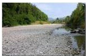
Fiume Scrvia a metà settembre

Pietro Marcheselli - Canon EOS 300D 2009 - Estate - Savignone - Altro