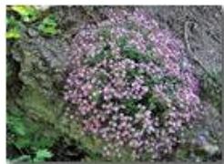
Cuscinetto di silene rupestris

Pietro Marcheselli - Canon EOS 300D 2010 - Estate - Savignone - Fiori&Fauna