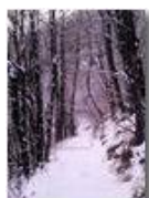
Costalovaia: la prima lieve nevicata

Pietro Marcheselli - Altro/Other 2014 - Inverno - Savignone - Fiori&Fauna