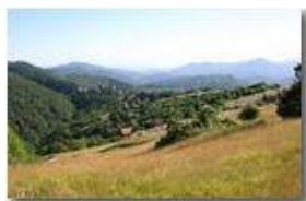
Uno sguardo verso il lontano mare dal Monte Cappellino

Pietro Marcheselli - Canon EOS 300D 2007 - Estate - Savignone - Panorami