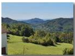
Vista su Forti e mar Ligure da Montemaggio

Guido Marcheselli - HTC One/Nokia C7/Samsung S7/S10 2020 - Estate - Savignone - Panorami