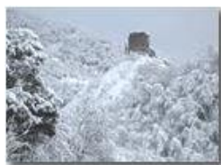
La torre del Castello

Pietro Marcheselli - Canon EOS 300D 2013 - Inverno - Savignone - Altro