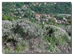
Fiori di timo

Pietro Marcheselli - Olympus Camedia 3000 2002 - Estate - Savignone - Fiori&Fauna