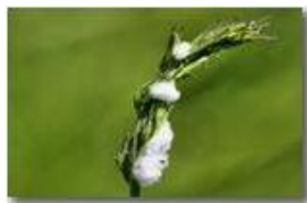
Schiuma depositata da un insetto per la difesa delle uova

Pietro Marcheselli - Canon EOS 300D 2009 - Estate - Savignone - Fiori&Fauna