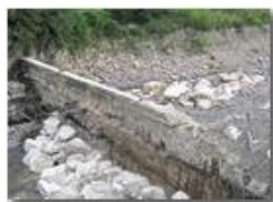
Diga: avanzamento lavori

Canon Ixus 980 IS 2013 - Estate - Savignone - Altro