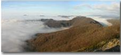
Panorama con nebbia dal Monte Maggio

Pietro Marcheselli - Canon EOS 300D 2006 - Inverno - Savignone - Panorami