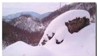
Valle del rio Maggione

Pietro Marcheselli - Canon Ixus 980 IS 2012 - Inverno - Savignone - Altro