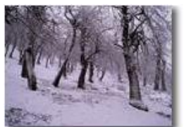
Il bosco della Colonia di Montemaggio

Pietro Marcheselli - Canon Ixus 980 IS 2015 - Inverno - Savignone - Panorami