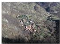
Sorrivi fraz. di Savignone dal M. Maggio (dic. 2001)

Pietro Marcheselli - Olympus Camedia 3000 2002 - Inverno - Savignone - Boschi