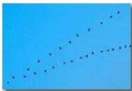
Altri migranti dall'Africa: gru accolte dal nord Europa

Pietro Marcheselli - HTC One S Nokia C7-00 (o altro cell) 2019 - Inverno - Savignone - Boschi