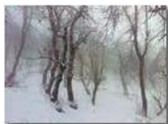
Nel Bosco della Colonia di Montemaggio

Pietro Marcheselli - Canon Ixus 980 IS 2013 - Inverno - Savignone - Altro