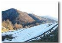
Veduta dal Monte Cappellino

Pietro Marcheselli - Canon Ixus 980 IS 2015 - Inverno - Savignone - Panorami