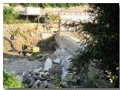
Diga: avanzamento lavori

Pietro Marcheselli - Canon Ixus 980 IS 2013 - Estate - Savignone - Altro