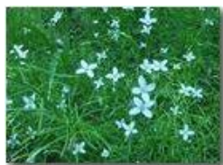
Una piccola crucifera dei boschi

Pietro Marcheselli - Olympus Camedia 3000 2004 - Estate - Savignone - Fiori&Fauna