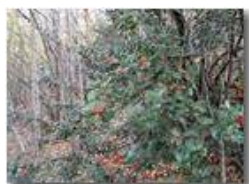
Si avvicina Natale: l agrifoglio pronto nei boschi

Pietro Marcheselli - Olympus Camedia 3000 2002 - Inverno - Savignone - Boschi