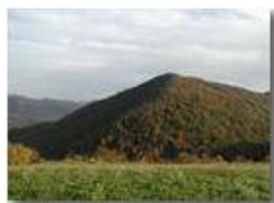
Tramonto sul M. Vittoria

Pietro Marcheselli - Olympus Camedia 3000 2002 - Inverno - Savignone - Panorami