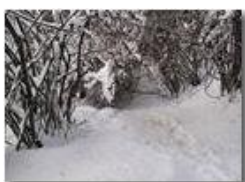
Sentiero Casella-Monte Maggio: chiuso per neve

Pietro Marcheselli - Canon Ixus 980 IS 2010 - Inverno - Savignone - Boschi