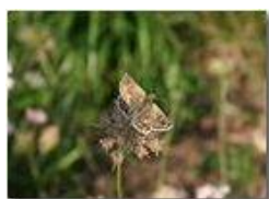
Una farfalla della famiglia hespenidae

Pietro Marcheselli - Canon EOS 300D 2005 - Estate - Savignone - Fiori&Fauna