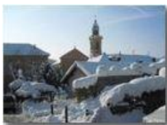
Savignone: neve in centro

Pietro Marcheselli - Canon Ixus 980 IS 2012 - Inverno - Savignone - Altro