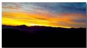
Tramonto al solstizio d'inverno: profilo dei monti a ovest della Val Polcevera (NS della Guardia, M. Pennello, M. Poimio, Piani di Dossio, M. Boggio)

Pietro Marcheselli - Altro/Other 2017 - Inverno - Savignone - Boschi