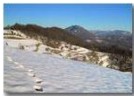
Veduta dal Monte Cappellino

Pietro Marcheselli - Canon Ixus 980 IS 2015 - Inverno - Savignone - Panorami