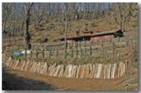
Lavori nel bosco

Pietro Marcheselli - Canon EOS 300D 2007 - Inverno - Savignone - Boschi