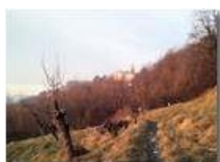
Santuario della Vittoria

Pietro Marcheselli - Altro/Other 2013 - Inverno - Savignone - Panorami