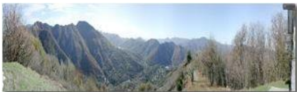
Valle Scivia dal M. Pianetto

Pietro Marcheselli - Olympus Camedia 3000 2005 - Inverno - Savignone - Fiori&Fauna