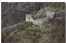
Una zoomata sulle rovine del Castello Fieschi di Savignone

Pietro Marcheselli - Canon EOS 300D 2008 - Inverno - Savignone - Panorami