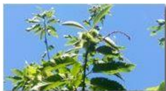
Castagni: i primi ricci

Pietro Marcheselli - Altro/Other 2017 - Estate - Savignone - Fiori&Fauna