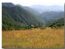
Prato estivo in località Fontanini

Pietro Marcheselli - Canon EOS 300D 2005 - Estate - Savignone - Fiori&Fauna