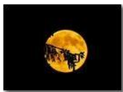
La luna d'Agosto

Pietro Marcheselli - Altro/Other 2016 - Estate - Savignone - Altro