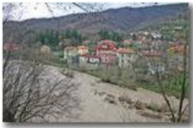
Frazione San Bartolomeo di Savignone e fiume Scrivia

Pietro Marcheselli - Canon EOS 300D 2007 - Inverno - Savignone - Altro