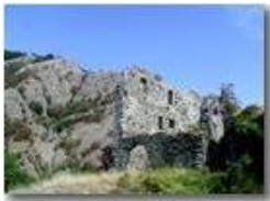
Savignone: ruderi del Castello Fieschi

Pietro Marcheselli - Olympus Camedia 3000 <2001 - Estate - Savignone - Paesi