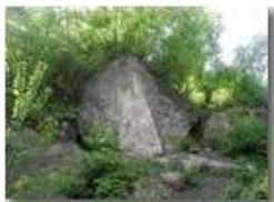
Masso di puddinga nei boschi di Savignone

Pietro Marcheselli - Olympus Camedia 3000 <2001 - Estate - Savignone - Fiori&Fauna