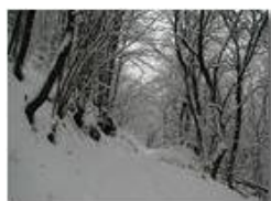
Savignone: nei boschi di Piambertone nella neve

Pietro Marcheselli - Olympus Camedia 3000 2005 - Inverno - Savignone - Boschi