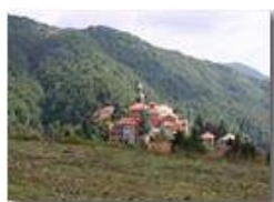
Santuario della Vittoria a fine estate

Pietro Marcheselli - Canon EOS 300D 2005 - Estate - Savignone - Fiori&Fauna