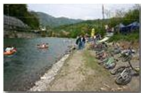
Manifestazione sportiva lungo il fiume Scrivia

Pietro Marcheselli - Canon EOS 300D 2006 - Estate - Savignone - Paesi