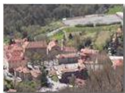
Savignone: La Piazza della Chiesa

Pietro Marcheselli - Olympus Camedia 3000 2004 - Estate - Savignone - Fiori&Fauna