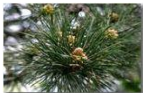
Fiore di conifera

Pietro Marcheselli - Canon EOS 300D 2009 - Estate - Savignone - Fiori&Fauna