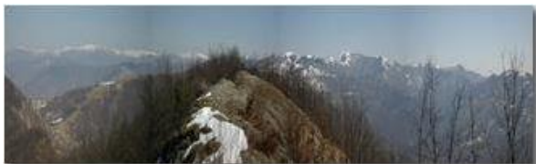
La catena dei Monti Liguri dal Giarolo all' Antola

Pietro Marcheselli - Olympus Camedia 3000 2005 - Inverno - Savignone - Boschi