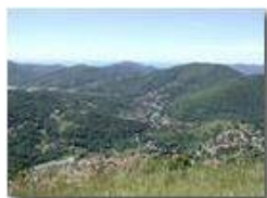
Savignone le sue frazioni e l'Alta Valle Scrivia dal M. Pianetto

Pietro Marcheselli - Olympus Camedia 3000 <2001 - Estate - Savignone - Panorami