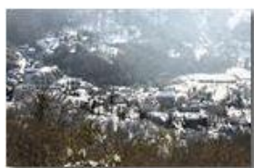
Neve novembrina sui tetti di Savignone

Pietro Marcheselli - Canon EOS 300D 2006 - Inverno - Savignone - Panorami