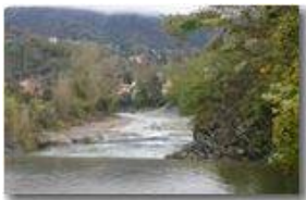
Autunno lungo il fiume Scrivia a Ponte di Savignone

Pietro Marcheselli - Canon EOS 300D 2006 - Inverno - Savignone - Boschi