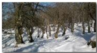
Boschi dietro la colonia di Montemaggio

Guido Marcheselli - Nokia C7-00 (o altro Smartphone) 2013 - Inverno - Savignone - Panorami