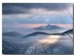
I forti di Genova tra nebbie e sole, dal Monte Maggio

Pietro Marcheselli - Canon Ixus 980 IS 2010 - Inverno - Savignone - Paesi