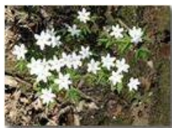
Fiori di anemone nemorosa

Pietro Marcheselli - Canon EOS 300D 2010 - Estate - Savignone - Fiori&Fauna