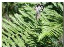
Farfalla del genere arctia su felci

Guido Marcheselli - Olympus Camedia 3000 <2001 - Estate - Savignone - Boschi