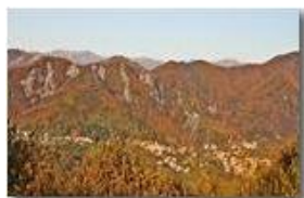
Autunno in Savignone 2

Pietro Marcheselli - Canon EOS 300D 2008 - Inverno - Savignone - Paesi