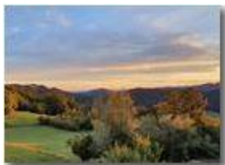
Tramonto da Montemaggio

Guido Marcheselli - HTC One/Nokia C7/Samsung S7/S10 2020 - Estate - Savignone - Paesi