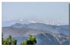
Appennino di Ponente (Monti Rama, Reixa e Beigua) e Alpi Liguri

Pietro Marcheselli - Canon EOS 300D 2011 - Estate - Savignone - Panorami