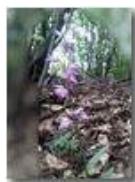
Cefalantera rossa (orchidacea)

Pietro Marcheselli - Altro/Other 2011 - Estate - Savignone - Fiori&Fauna