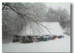
Ovile sotto la neve

Pietro Marcheselli - Olympus Camedia 3000 2004 - Inverno - Savignone - Boschi