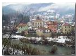
San Bartolomeo di Vallecaldà

Guido Marcheselli - Canon EOS 300D 2010 - Inverno - Savignone - Paesi