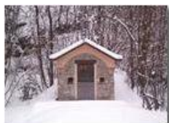
La cappelletta del Castello

Pietro Marcheselli - Canon Ixus 980 IS 2011 - Inverno - Savignone - Boschi