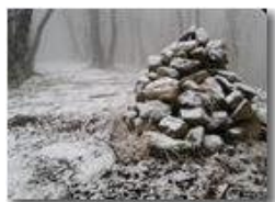
Neve nei boschi del M. Maggio

Pietro Marcheselli - HTC One S Nokia C7-00 (o altro cell) 2019 - Inverno - Savignone - Paesi