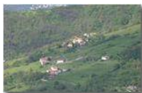
I prati di Gualdrà da Montemaggio (Chiappazza)

Guido Marcheselli - Canon EOS 300D 2014 - Estate - Savignone - Panorami