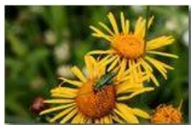
Coleottero: maschio di oedemera nobilis su fiore di inula

Pietro Marcheselli - Canon EOS 300D 2009 - Estate - Savignone - Fiori&Fauna