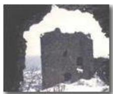
Castello Fieschi con neve, Savignone

Pietro Marcheselli - Scanner <2001 - Inverno - Savignone - Paesi