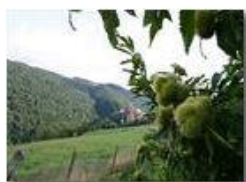
Ricci di castagno: l'autunno è alle porte

Pietro Marcheselli - Canon EOS 300D 2005 - Estate - Savignone - Fiori&Fauna