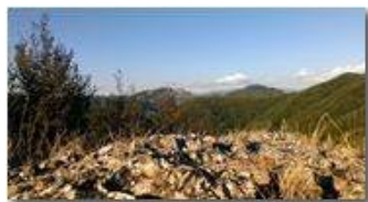
Rocche del reopasso dal monte Pianetto

Guido Marcheselli - Nokia C7-00 (o altro Smartphone) 2013 - Estate - Savignone - Panorami