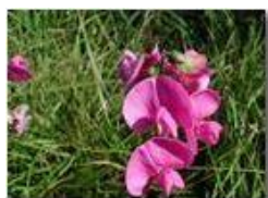
Lathirus silvestris (Cicerchione Pisello odoroso)

Pietro Marcheselli - Olympus Camedia 3000 <2001 - Estate - Savignone - Fiori&Fauna