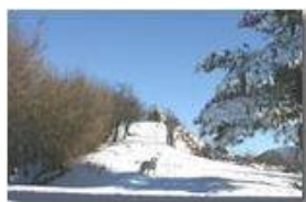
Neve sul M. Pianetto

Canon EOS 300D 2006 - Inverno - Savignone - Paesi