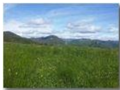
Monte Maggio dalle pendici del Monte Cappellino

Pietro Marcheselli - Canon Ixus 980 IS 2016 - Estate - Savignone - Panorami