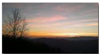
Tramonto da Montemaggio

Guido Marcheselli - Canon EOS 300D 2013 - Inverno - Savignone - Boschi