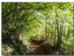
Autunno a Savignone

Pietro Marcheselli - HTC One S Nokia C7-00 (o altro cell) 2018 - Estate - Savignone - Boschi