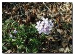
Il fiore della Dentaria

Pietro Marcheselli - Olympus Camedia 3000 2002 - Estate - Savignone - Fiori&Fauna