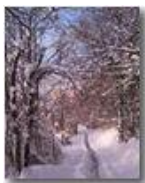
La Vittoria: Via Monte Rombon

Pietro Marcheselli - Altro/Other 2012 - Inverno - Savignone - Boschi