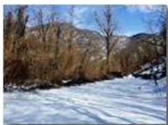
Neve di Marzo: crinale monti Pianetto-Brughea-Carmo

Pietro Marcheselli - HTC One S Nokia C7-00 (o altro cell) 2018 - Inverno - Savignone - Panorami