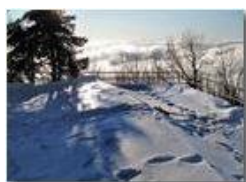
Monte Maggio: sopra le nuvole

Pietro Marcheselli - Canon Ixus 980 IS 2010 - Inverno - Savignone - Panorami