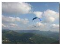
Parapendio in volo

Pietro Marcheselli - Canon EOS 300D 2005 - Estate - Savignone - Altro