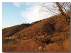
Tramonto invernale alla frazione Montemaggio

Guido Marcheselli - Olympus OM-D E-M10 Mark III 2019 - Inverno - Savignone - Panorami