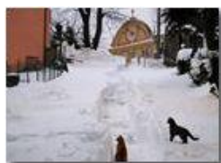
Neve di primavera alla Vittoria

Pietro Marcheselli - Canon Ixus 980 IS 2013 - Inverno - Savignone - Paesi