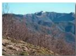
Monte Antola: neve autunnale

Pietro Marcheselli - Canon Ixus 980 IS 2010 - Inverno - Savignone - Paesi