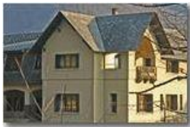
Savignone: Villa Solaro

Pietro Marcheselli - Canon EOS 300D 2007 - Inverno - Savignone - Altro