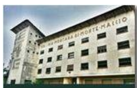
La Colonia abbandonata: la facciata

Pietro Marcheselli - Canon Ixus 980 IS 2014 - Estate - Savignone - Fiori&Fauna