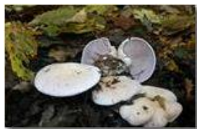
Un fungo del genere clitocybe

Pietro Marcheselli - Canon EOS 300D 2006 - Inverno - Savignone - Fiori&Fauna