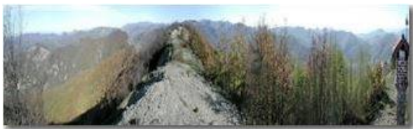
Panorama da M. Maggio

Pietro Marcheselli - Olympus Camedia 3000 2005 - Inverno - Savignone - Fiori&Fauna