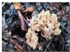
Fungo clavaria (ditola)

Pietro Marcheselli - Canon Ixus 980 IS 2011 - Inverno - Savignone - Fiori&Fauna