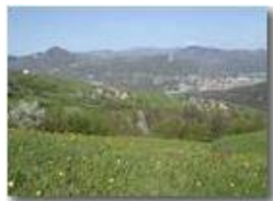
Un'altra primavera a Gualdrà

Pietro Marcheselli - Olympus Camedia 3000 2002 - Estate - Savignone - Fiori&Fauna