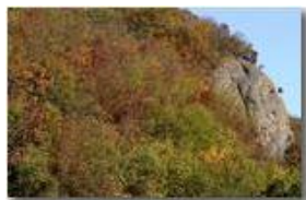
Autunno 2008: Boschi e conglomerato di Savignone

Pietro Marcheselli - Canon EOS 300D 2009 - Inverno - Savignone - Boschi