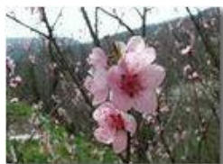
Arriva una nuova primavera

Pietro Marcheselli - Olympus Camedia 3000 2004 - Estate - Savignone - Fiori&Fauna