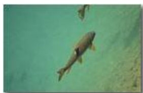
Trota(?) nel fiume Scrivia, Ponte di Savignone

Guido Marcheselli - Canon EOS 300D 2014 - Estate - Savignone - Fiori&Fauna