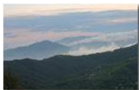
La frazione Gualdrà e il Santuario della Guaria tra le nebbie al tramonto. Da Montemaggio (Chiappazza)

Pietro Marcheselli - Canon Ixus 980 IS 2014 - Estate - Savignone - Panorami