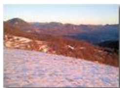
Neve sul Monte Cappellino

Pietro Marcheselli - Canon Ixus 980 IS 2013 - Inverno - Savignone - Panorami