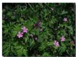
Geranio selvatico (g. robertianum)

Pietro Marcheselli - Olympus Camedia 3000 2002 - Estate - Savignone - Fiori&Fauna