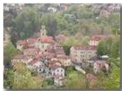
Savignone Genoa Italy

Pietro Marcheselli - Panasonic nv-gs70 (VideoCam) 2004 - Estate - Savignone - Paesi