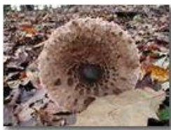
Mazza di tamburo

Pietro Marcheselli - Olympus Camedia 3000 2005 - Inverno - Savignone - Fiori&Fauna