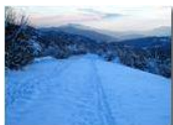
Vista sulla Val Polcevera

Pietro Marcheselli - Canon Ixus 980 IS 2013 - Inverno - Savignone - Panorami