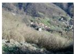
Il torrione del Castello Fieschi di Savignone

Pietro Marcheselli - Olympus Camedia 3000 2002 - Estate - Savignone - Fiori&Fauna