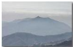
Veduta verso i forti di Genova da Monte Maggio

Pietro Marcheselli - Canon Ixus 980 IS 2011 - Estate - Savignone - Boschi