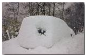
Blocco della circolazione per polveri sottili... bianche

rattoPernugo - Canon EOS 300D 2006 - Inverno - Savignone - Boschi