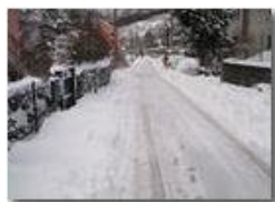
Nevicata a Ponte di Savignone

Pietro Marcheselli - Canon Ixus 980 IS 2010 - Inverno - Savignone - Panorami