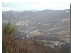
Savignone e alcune sue frazioni dal M. Vittoria

Guido Marcheselli - Olympus Camedia 3000 2002 - Inverno - Savignone - Paesi