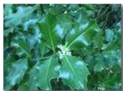
Fiori di agrifoglio

Pietro Marcheselli - Olympus Camedia 3000 2004 - Estate - Savignone - Fiori&Fauna