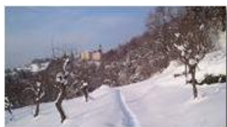
La Vittoria: il santuario

Pietro Marcheselli - Altro/Other 2012 - Inverno - Savignone - Altro