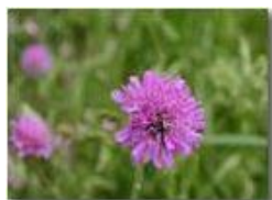
Fiore di knautia

Pietro Marcheselli - Canon EOS 300D 2005 - Estate - Savignone - Fiori&Fauna