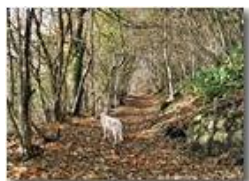
Salendo al Monte Maggio

Pietro Marcheselli - Canon EOS 300D 2011 - Inverno - Savignone - Boschi