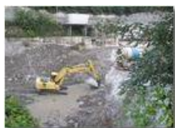
Lavori diga: ultimo atto

Pietro Marcheselli - Canon Ixus 980 IS 2013 - Estate - Savignone - Altro