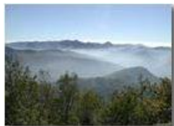
Panorama autunnale sulla Valle Scrivia da M. Maggio

Pietro Marcheselli - Olympus Camedia 3000 2002 - Inverno - Savignone - Panorami