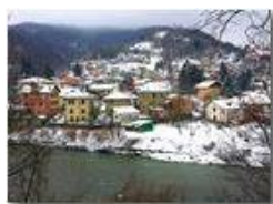
Neve di Marzo: Il Prelo

Guido Marcheselli - HTC One S Nokia C7-00 (o altro cell) 2018 - Inverno - Savignone - Panorami