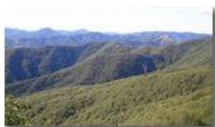
Ritornano verdi i boschi di Savignone

Pietro Marcheselli - Canon Ixus 980 IS 2013 - Estate - Savignone - Boschi