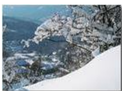
Savignone: uno sguardo dall'alto

Pietro Marcheselli - Canon Ixus 980 IS 2012 - Inverno - Savignone - Panorami