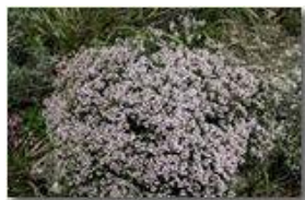
Cuscinetto di timo serpillio

Pietro Marcheselli - Canon EOS 300D 2008 - Estate - Savignone - Fiori&Fauna