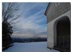
M.Maggio: la cappella "Maria Immacolata"

Pietro Marcheselli - Altro/Other 2014 - Inverno - Savignone - Altro