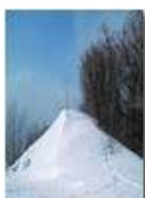
Salendo al Monte Pianetto

Pietro Marcheselli - Altro/Other 2012 - Inverno - Savignone - Altro