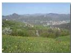
Un'altra primavera a Gualdrà

Pietro Marcheselli - Olympus Camedia 3000 2002 - Estate - Savignone - Panorami