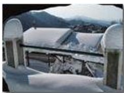
La Vittoria: Case Maggetta

Pietro Marcheselli - Altro/Other 2012 - Inverno - Savignone - Boschi