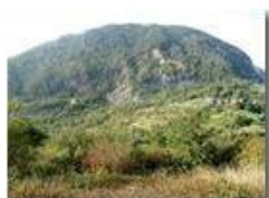
Monte Maggio visto dal M. Albarino

Pietro Marcheselli - Olympus Camedia 3000 <2001 - Estate - Savignone - Fiori&Fauna