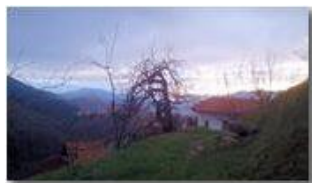
Albero alla Maggetta deformato dal gelo

Pietro Marcheselli - Altro/Other 2013 - Inverno - Savignone - Altro