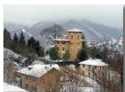
Savignone: numerose le ville per residenza estiva di inizio novecento in stile vagamente liberty

Pietro Marcheselli - Olympus Camedia 3000 2006 - Inverno - Savignone - Altro