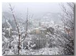
Nevicata al Prelo

Pietro Marcheselli - Canon Ixus 980 IS 2019 - Inverno - Savignone - Boschi