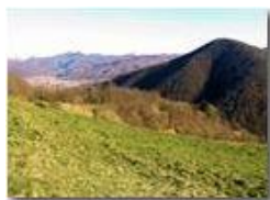
Casella e l'Appennino: Monte Acuto, Monte Bano, Monte Vittoria

Pietro Marcheselli - Canon Ixus 980 IS 2014 - Inverno - Savignone - Panorami