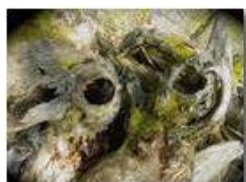
Le occhiaie vuote di un vecchio ceppo di castagno

Pietro Marcheselli - Canon Ixus 980 IS 2018 - Estate - Savignone - Fiori&Fauna