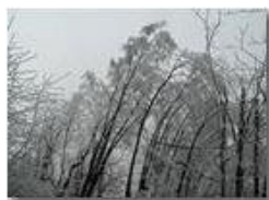
Brinata nel bosco

Pietro Marcheselli - Panasonic nv-gs70 (VideoCam) 2005 - Inverno - Savignone - Panorami