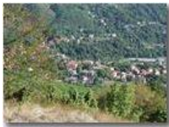
Agosto 2003: Savignone

Pietro Marcheselli - Olympus Camedia 3000 2003 - Estate - Savignone - Panorami