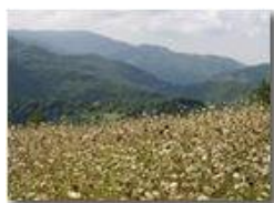
Prati d'agosto: l'invasione delle ombrellifere

Pietro Marcheselli - Canon EOS 300D 2005 - Estate - Savignone - Fiori&Fauna