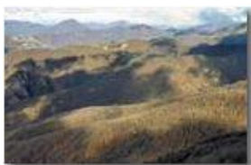
Luci ed ombre sui boschi spogli di Savignone in dicembre

Pietro Marcheselli - Canon EOS 300D 2008 - Inverno - Savignone - Paesi