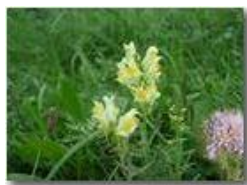
Una scrophulariaceae e una scabiosa a fine estate

Pietro Marcheselli - Olympus Camedia 3000 <2001 - Estate - Savignone - Panorami