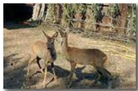
Centro accoglienza caprioli abbandonati (maschio e femmina)

Pietro Marcheselli - Canon EOS 300D 2009 - Estate - Savignone - Fiori&Fauna