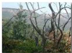
Siccità agosto 2001. Sullo sfondo M. Proventino e Buio

Pietro Marcheselli - Olympus Camedia 3000 <2001 - Estate - Savignone - Paesi