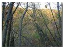
Ombre e luci al tramonto nel bosco

Pietro Marcheselli - Olympus Camedia 3000 2002 - Inverno - Savignone - Boschi