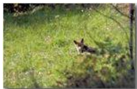
Volpe sorpresa sopra la frazione Cerisola

Pietro Marcheselli - Canon EOS 300D 2008 - Inverno - Savignone - Boschi