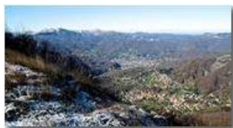
Panorama ovest da Monte Maggio: Savignone, Busalla

Pietro Marcheselli - Altro/Other 2016 - Inverno - Savignone - Boschi