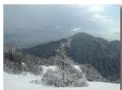
Monte Vittoria ricoperto di neve

Pietro Marcheselli - Olympus Camedia 3000 2005 - Inverno - Savignone - Panorami