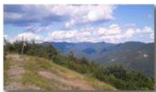
Val Brevenna da Monte Maggio

Pietro Marcheselli - Canon Ixus 980 IS 2013 - Estate - Savignone - Panorami