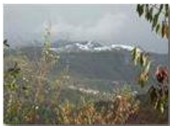
Un breve anticipo di inverno

Pietro Marcheselli - Olympus Camedia 3000 2005 - Inverno - Savignone - Panorami