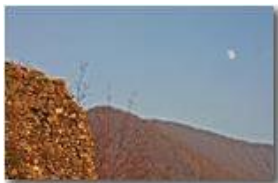
Che fai tu luna in ciel, dimmi che fai silenziosa luna?...

Pietro Marcheselli - Canon EOS 300D 2007 - Inverno - Savignone - Altro