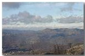
Veduta sulle Alpi dal Monte Maggio

Pietro Marcheselli - Canon EOS 300D 2008 - Inverno - Savignone - Panorami