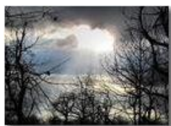
Luci ed ombre in paesaggio invernale

Pietro Marcheselli - Canon Ixus 980 IS 2010 - Inverno - Savignone - Panorami