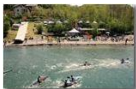
Savignone Campionati nazionali canoa Polo

Pietro Marcheselli - Canon EOS 300D 2009 - Inverno - Savignone - Paesi