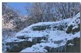
Ghiaccio e neve salendo al M. Pianetto

Guido Marcheselli - Olympus Camedia 3000 2006 - Inverno - Savignone - Panorami