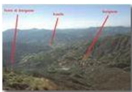
Panorama dal Monte Maggio m. 978

Pietro Marcheselli - Olympus Camedia 3000 <2001 - Estate - Savignone - Fiori&Fauna