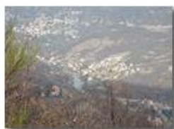
Il Ponte di Savignone dal M. Vittoria

Pietro Marcheselli - Olympus Camedia 3000 2002 - Inverno - Savignone - Panorami