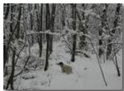
Savignone: nei boschi di Piambertone nella neve

Pietro Marcheselli - Olympus Camedia 3000 2005 - Inverno - Savignone - Boschi