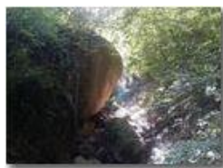
Sentiero della valletta Rio Piambertone

Pietro Marcheselli - Altro/Other 2016 - Estate - Savignone - Panorami