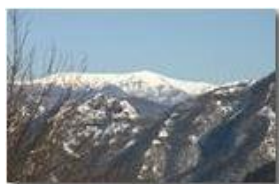
Monte Ebro con neve

Pietro Marcheselli - Canon EOS 300D 2006 - Inverno - Savignone - Boschi