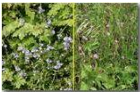
Fiori di campo: Veronica chamaedris e geranium robertianum

Pietro Marcheselli - Canon EOS 300D 2007 - Estate - Savignone - Fiori&Fauna