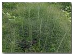
Coda di cavallo (equisetum arvensis)

Pietro Marcheselli - Altro/Other 2015 - Estate - Savignone - Fiori&Fauna