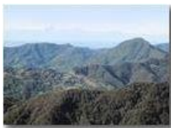
Monte Reale e Monte Rosa

Pietro Marcheselli - Canon Ixus 980 IS 2011 - Estate - Savignone - Panorami