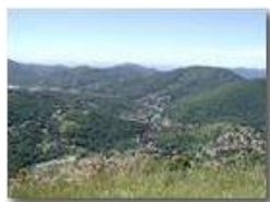
Questo il paesaggio di casa mia accanto alla diga sul fiume.

Pietro Marcheselli - Olympus Camedia 3000 <2001 - Estate - Savignone - Fiori&Fauna