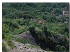
Il Castello dei Fieschi (Savignone) visto dal Pianetto

Pietro Marcheselli - Olympus Camedia 3000 <2001 - Estate - Savignone - Paesi