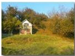
Autunno a Savignone

Pietro Marcheselli - HTC One S Nokia C7-00 (o altro cell) 2018 - Estate - Savignone - Panorami