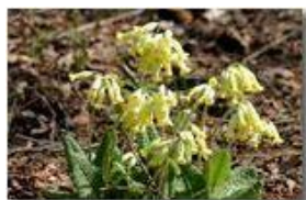
Fiori di primula officinalis

Pietro Marcheselli - Canon Ixus 980 IS 2010 - Estate - Savignone - Fiori&Fauna