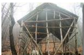
Tracce di un mondo contadino scomparso

Pietro Marcheselli - Canon EOS 300D 2008 - Inverno - Savignone - Paesi