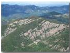
Una zoomata sul Monte Pianetto

Pietro Marcheselli - Canon Ixus 980 IS 2011 - Estate - Savignone - Panorami