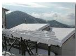
Pendici Monte Cappellino innevate

Pietro Marcheselli - Olympus Camedia 3000 2005 - Inverno - Savignone - Boschi