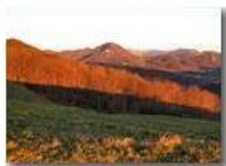
Pendici Monte Cappellino

Pietro Marcheselli - Canon Ixus 980 IS 2010 - Inverno - Savignone - Paesi