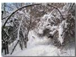
Sentiero Casella-Monte Maggio: chiuso per neve

Pietro Marcheselli - Altro/Other 2010 - Inverno - Savignone - Panorami