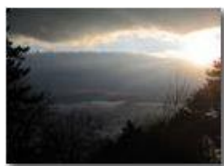
Ombre e luci in paesaggio invernale

Guido Marcheselli - Canon Ixus 980 IS 2010 - Inverno - Savignone - Panorami