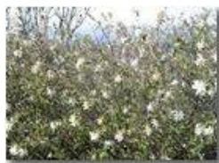
Caprifogliacea fiorita sul Monte Maggio

Pietro Marcheselli - Canon Ixus 980 IS 2011 - Estate - Savignone - Paesi