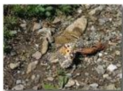
Il mimetismo di una farfalla

Pietro Marcheselli - Canon EOS 300D 2005 - Estate - Savignone - Fiori&Fauna