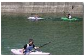
Gara di kayak nel parco acquatico di Ponte di Savignone

Guido Marcheselli - Canon EOS 300D 2007 - Estate - Savignone - Altro