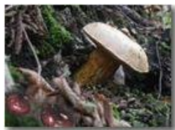
Esemplari di russule e boletus satana

Pietro Marcheselli - Olympus Camedia 3000 2002 - Inverno - Savignone - Fiori&Fauna