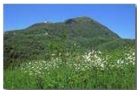
Monte Maggio versione estate

Pietro Marcheselli - Canon EOS 300D 2010 - Estate - Savignone - Panorami