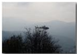
Manutenzione Castello Fieschi: trasporto materiali

Pietro Marcheselli - Altro/Other 2016 - Inverno - Savignone - Altro