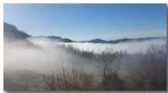
Nebbie di fine inverno

Guido Marcheselli - HTC One S Nokia C7-00 (o altro cell) 2016 - Inverno - Savignone - Panorami