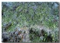
Siepe con decorazioni di ghiaccio

Guido Marcheselli - Canon Ixus 980 IS 2011 - Inverno - Savignone - Altro