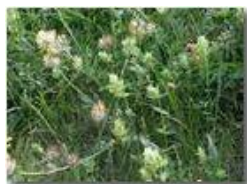
Cresta di gallo e vulneraria

Pietro Marcheselli - Olympus Camedia 3000 2002 - Estate - Savignone - Fiori&Fauna