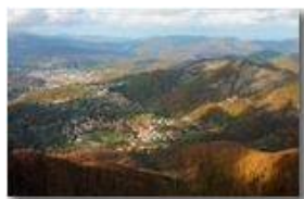
Luci ed ombre dal Monte Maggio

Pietro Marcheselli - Canon EOS 300D 2009 - Estate - Savignone - Paesi