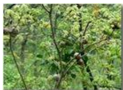
Galle su roverella

Pietro Marcheselli - Olympus Camedia 3000 2002 - Estate - Savignone - Fiori&Fauna