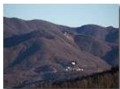
Frazione Costalovaia e il monte Pianetto

Pietro Marcheselli - HTC One S Nokia C7-00 (o altro cell) 2019 - Inverno - Savignone - Paesi