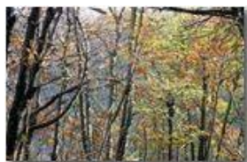
Aspetti del bosco (autunno 2010)

Pietro Marcheselli - Canon Ixus 980 IS 2011 - Inverno - Savignone - Panorami