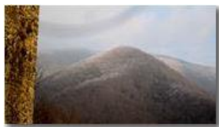
Monte Carmo di Piambertone

Pietro Marcheselli - HTC One S Nokia C7-00 (o altro cell) 2019 - Inverno - Savignone - Boschi