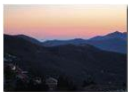
Corsica: c'è...non c'è?

Pietro Marcheselli - Canon Ixus 980 IS 2013 - Inverno - Savignone - Altro