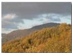
Monte Maggio in autunno

Pietro Marcheselli - Olympus Camedia 3000 2005 - Inverno - Savignone - Panorami