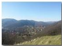
Veduta dal Castello Fieschi

Pietro Marcheselli - Canon Ixus 980 IS 2014 - Inverno - Savignone - Panorami