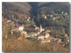
Veduta di Savignone da NO

Pietro Marcheselli - HTC One S Nokia C7-00 (o altro cell) 2019 - Inverno - Savignone - Paesi