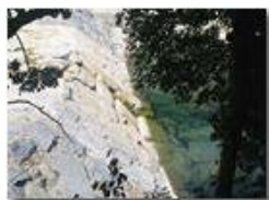
Fiume Scrivia in secca a Ponte di Savignone

Pietro Marcheselli - Altro/Other 2017 - Estate - Savignone - Panorami