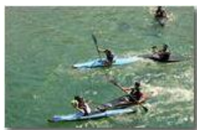
Savignone Campionati nazionali canoa Polo

Pietro Marcheselli - Canon EOS 300D 2009 - Estate - Savignone - Altro