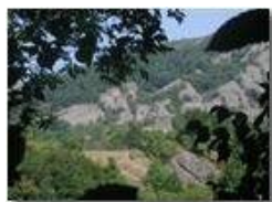
Mimetizzazione del cast. Fieschi di Savignone con il conglomerato

Pietro Marcheselli - Scanner <2001 - Estate - Savignone - Paesi