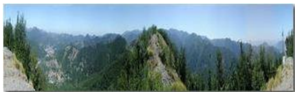
Savignone e dintorni dal M. Maggio

Pietro Marcheselli - Scanner <2001 - Inverno - Savignone - Panorami