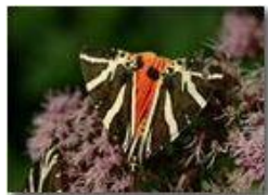
Farfalla callymorpha quadripunctaria

Pietro Marcheselli - Canon EOS 300D 2005 - Estate - Savignone - Altro