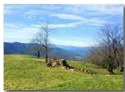
Dov'era l'ombra or sè la quercia spande morta, ne più coi turbini tenzona...

Pietro Marcheselli - Altro/Other 2015 - Inverno - Savignone - Panorami