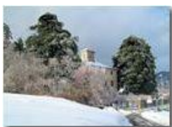
La gelata del 22 dicembre

Pietro Marcheselli - Canon Ixus 980 IS 2010 - Inverno - Savignone - Panorami