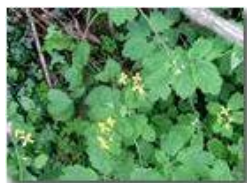
Fiori e foglie di chelidonia

Pietro Marcheselli - Olympus Camedia 3000 2002 - Estate - Savignone - Fiori&Fauna