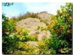
Colori d'autunno, tra siccità e cambio di stagione

Pietro Marcheselli - Canon Ixus 980 IS 2017 - Estate - Savignone - Boschi