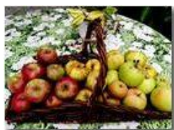
Diverse varietà di mele del frutteto di Antonio (nonostante i danni della vespa vellutina)

Pietro Marcheselli - Altro/Other 2016 - Estate - Savignone - Panorami