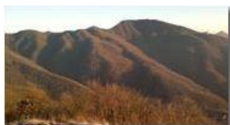
Montemaggio dal Pianetto

Guido Marcheselli - Nokia C7-00 (o altro Smartphone) 2013 - Inverno - Savignone - Panorami