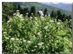
Fioritura di corniolo (cornus mas)

Pietro Marcheselli - Olympus Camedia 3000 2002 - Estate - Savignone - Fiori&Fauna