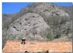
Rocce di conglomerato di Savignone

Pietro Marcheselli - Canon EOS 300D 2010 - Estate - Savignone - Panorami