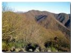
Salendo al M. Pianetto: Il M. Carmo, La Suia e sullo sfondo il M. Buio

Pietro Marcheselli - Canon Ixus 980 IS 2016 - Inverno - Savignone - Panorami