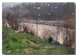
Pioggia oltre i vetri

Pietro Marcheselli - Canon Ixus 980 IS 2010 - Inverno - Savignone - Panorami