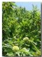
In attesa delle castagne

Pietro Marcheselli - Canon Ixus 980 IS 2016 - Estate - Savignone - Fiori&Fauna