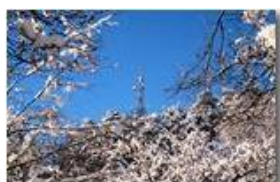
Montemaggio: antenna nel bosco

Pietro Marcheselli - Canon Ixus 980 IS 2013 - Inverno - Savignone - Altro