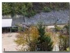
La statale 226 prima della frana

Guido Marcheselli - Canon EOS 300D 2012 - Inverno - Savignone - Altro