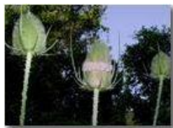
Infiorescenze di dipsacus silvester

Pietro Marcheselli - Olympus Camedia 3000 2002 - Estate - Savignone - Fiori&Fauna