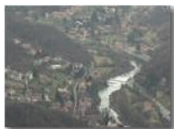
Riflessi del fiume Scrivia in inverno

Pietro Marcheselli - Olympus Camedia 3000 2002 - Inverno - Savignone - Panorami