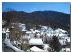
C'è del bianco a Castello Rosso

Pietro Marcheselli - Canon Ixus 980 IS 2013 - Inverno - Savignone - Paesi