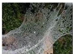
Decorazioni: Tela di ragno

Pietro Marcheselli - Olympus Camedia 3000 2005 - Inverno - Savignone - Altro