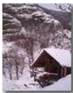
Nella valle del rio Maggione

Pietro Marcheselli - Altro/Other 2012 - Inverno - Savignone - Altro