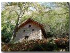
Autunno a Savignone

Pietro Marcheselli - HTC One S Nokia C7-00 (o altro cell) 2018 - Estate - Savignone - Boschi