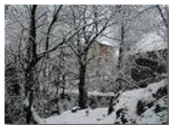
La casa nel bosco dopo una nevicata

Pietro Marcheselli - Olympus Camedia 3000 2004 - Inverno - Savignone - Panorami