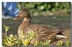
Papera (femmina di germano reale)

Pietro Marcheselli - Canon EOS 300D 2005 - Estate - Savignone - Fiori&Fauna