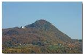
Il Monte Maggio e la Colonia (arch. Nardi Greco, 1933)

Pietro Marcheselli - Canon EOS 300D 2008 - Inverno - Savignone - Panorami