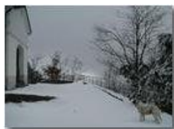
Un' altra visita a M. Maggio innevato

Pietro Marcheselli - Olympus Camedia 3000 2004 - Inverno - Savignone - Boschi