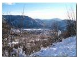
Veduta verso Casella e il mare

Pietro Marcheselli - Canon EOS 300D 2013 - Inverno - Savignone - Altro