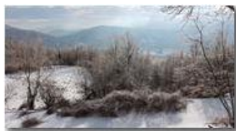
Neve, ghiaccio, sole.. forti di Genova, Madonna della Guardia e monte Vittoria

Guido Marcheselli - HTC One S Nokia C7-00 (o altro cell) 2018 - Inverno - Savignone - Panorami