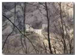
Mimetismo: Conglomerato e rovine del castello

Pietro Marcheselli - Canon Ixus 980 IS 2011 - Inverno - Savignone - Altro