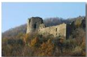
Castello Fieschi: una veduta d'insieme

Pietro Marcheselli - Canon EOS 300D 2007 - Inverno - Savignone - Boschi