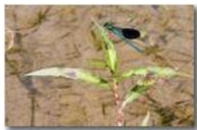
Libellula della specie Calopteryx virgo

Pietro Marcheselli - Canon EOS 300D 2007 - Estate - Savignone - Panorami