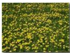
L'invasione del tarassaco

Pietro Marcheselli - Canon Ixus 980 IS 2018 - Estate - Savignone - Fiori&Fauna