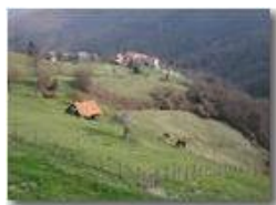
Pascoli a Gualdrà

Pietro Marcheselli - Canon EOS 300D 2005 - Estate - Savignone - Fiori&Fauna