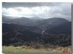
Luci ed ombre dal M. Pianetto

Pietro Marcheselli - Olympus Camedia 3000 2002 - Inverno - Savignone - Paesi