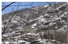
Rovine del Castello Fieschi e Monte Pianetto

Pietro Marcheselli - Canon Ixus 980 IS 2011 - Inverno - Savignone - Altro