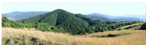
Panoramica dal Monte Cappellino: da Casella al Santuario della Vittoria

Pietro Marcheselli - Canon EOS 300D 2008 - Estate - Savignone - Altro