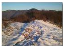
Neve sul Monte Cappellino

Pietro Marcheselli - Canon Ixus 980 IS 2013 - Inverno - Savignone - Altro