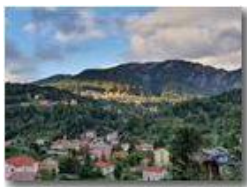
Ultimo raggio di sole al tramonto su Savignone

Guido Marcheselli - HTC One/Nokia C7/Samsung S7/S10 2020 - Estate - Savignone - Paesi