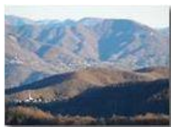
Montemaggio, Gabbie e Tegli da Fraconalto

Guido Marcheselli - Olympus OM-D E-M10 Mark III 2019 - Inverno - Savignone - Panorami