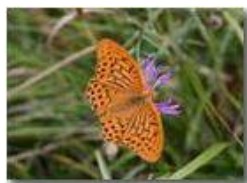
Farfalla argynnis aglais

Pietro Marcheselli - Canon EOS 300D 2005 - Estate - Savignone - Fiori&Fauna