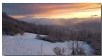
Tramonto sulla neve, da Montemaggio verso i forti di Genova

Pietro Marcheselli - HTC One S Nokia C7-00 (o altro cell) 2018 - Inverno - Savignone - Boschi