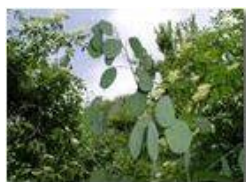
I frutti della Lunaria

Pietro Marcheselli - Olympus Camedia 3000 2004 - Estate - Savignone - Fiori&Fauna