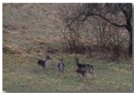
Daini che chiacchierano

Guido Marcheselli - Olympus OM-D E-M10 Mark III 2019 - Inverno - Savignone - Panorami