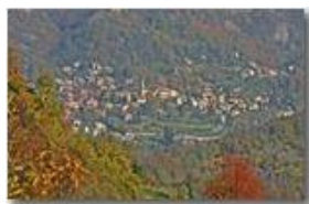
Autunno in Savignone 1

Pietro Marcheselli - Canon EOS 300D 2008 - Inverno - Savignone - Panorami