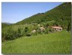
Inastrà di Montemaggio

Pietro Marcheselli - Canon EOS 300D 2005 - Estate - Savignone - Panorami