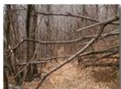
Bosco d' inverno

Pietro Marcheselli - Olympus Camedia 3000 2002 - Inverno - Savignone - Boschi