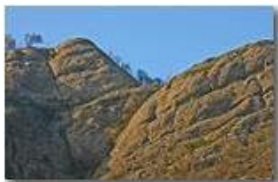
Conglomerato di Savignone: rocce sedimentarie depositate nell'Oligocene (circa 25 milioni di anni fa)

Pietro Marcheselli - Canon EOS 300D 2007 - Inverno - Savignone - Altro