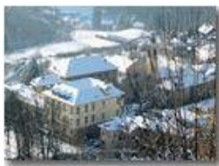
Savignone: Palazzo Fieschi e Parrocchia di San Pietro

Pietro Marcheselli - Canon Ixus 980 IS 2010 - Inverno - Savignone - Paesi