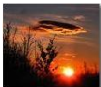
Il tramonto del solstizio

Pietro Marcheselli - Altro/Other 2013 - Inverno - Savignone - Altro