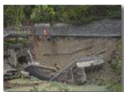
Crollo diga e strada provinciale a Ponte di Savignone: la frana

Guido Marcheselli - Canon EOS 300D 2012 - Inverno - Savignone - Paesi