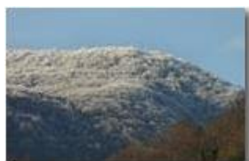
Brinata sul Monte Vittoria

Pietro Marcheselli - Canon EOS 300D 2009 - Inverno - Savignone - Boschi