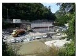
Cantiere per centrale idroelettrica sullo Scrivia. Ponte di Savignone

Pietro Marcheselli - HTC One/Nokia C7/Samsung S7/S10 2020 - Estate - Savignone - Paesi