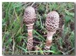
Fungo del genere lepiota

Pietro Marcheselli - Canon Ixus 980 IS 2011 - Inverno - Savignone - Fiori&Fauna