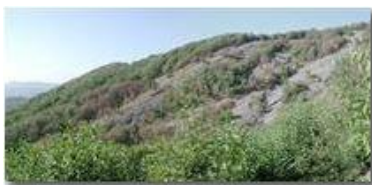
Siccità 2003: Savignone: I boschi del Pianetto

Pietro Marcheselli - Olympus Camedia 3000 2003 - Estate - Savignone - Panorami