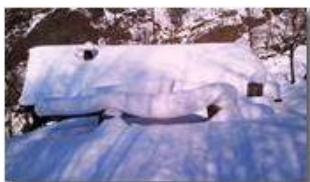
Nella valle del rio Maggione

Pietro Marcheselli - Altro/Other 2012 - Inverno - Savignone - Altro