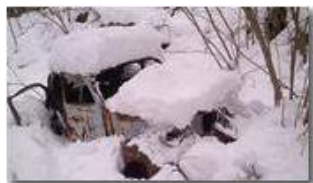
Divieto di sosta...

Pietro Marcheselli - Altro/Other 2012 - Inverno - Savignone - Altro