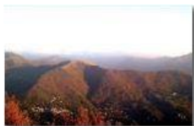
Ternano e Monte Banca

Pietro Marcheselli - Canon EOS 300D 2014 - Inverno - Savignone - Panorami