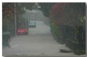
Via Ponte di Savignone durante il nubifragio del 4 novembre 2011

Guido Marcheselli - Canon Ixus 980 IS 2012 - Inverno - Savignone - Altro