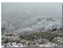
I boschi del monte Pianetto brizzolati dal freddo

Pietro Marcheselli - Olympus Camedia 3000 2006 - Inverno - Savignone - Boschi