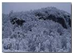
Tra Sorrivi e Crocefieschi

Pietro Marcheselli - Altro/Other 2014 - Inverno - Savignone - Boschi