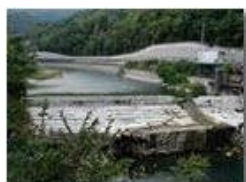
Agosto 2003: il fiume Scrivia con portata minima

Pietro Marcheselli - Olympus Camedia 3000 2003 - Estate - Savignone - Panorami