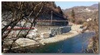
Lavori di consolidamento argine Scrivia, a Ponte di Savignone

Pietro Marcheselli - Canon Ixus 980 IS 2017 - Inverno - Savignone - Altro