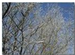
Galaverna: I fiori dell'inverno

Pietro Marcheselli - Olympus Camedia 3000 2003 - Inverno - Savignone - Panorami