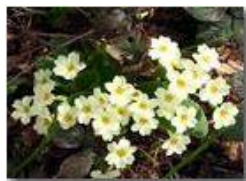
Fiori di primula acaulis

Pietro Marcheselli - Canon Ixus 980 IS 2010 - Estate - Savignone - Fiori&Fauna