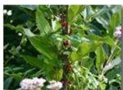
Bacche di tamus communis su castagno

Pietro Marcheselli - Canon EOS 300D 2005 - Estate - Savignone - Panorami