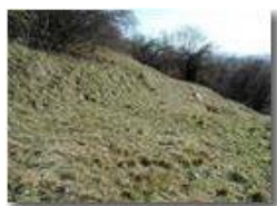
Prato con crochi

Pietro Marcheselli - Olympus Camedia 3000 2002 - Estate - Savignone - Fiori&Fauna