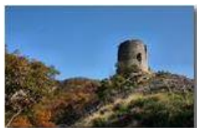
Savignone (Castello Fieschi)

Pietro Marcheselli - Canon EOS 300D 2009 - Estate - Savignone - Boschi