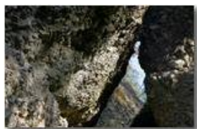
Il ruscello tra blocchi di conglomerato

Pietro Marcheselli - Canon EOS 300D 2009 - Inverno - Savignone - Panorami