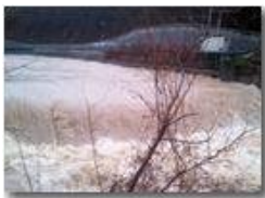
La pioggia di Natale

Guido Marcheselli - HTC One S Nokia C7-00 (o altro cell) 2014 - Inverno - Savignone - Panorami