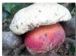
Autunno 2010: fungo boletus satanas (Ferrando)

Pietro Marcheselli - Canon Ixus 980 IS 2010 - Estate - Savignone - Fiori&Fauna