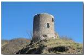
Castello Fieschi: la torre restaurata

Pietro Marcheselli - Altro/Other 2014 - Inverno - Savignone - Altro