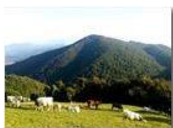
Alpeggio sul M. Cappellino

Pietro Marcheselli - Altro/Other 2014 - Estate - Savignone - Fiori&Fauna