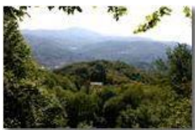
Boschi a Costalovaia

Pietro Marcheselli - Canon EOS 300D 2006 - Estate - Savignone - Boschi