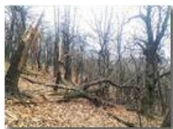
Natura matrigna: continua il degrado dei boschi per il gelo

Pietro Marcheselli - HTC One S Nokia C7-00 (o altro cell) 2018 - Inverno - Savignone - Boschi