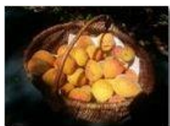
Le mie albicocche

Pietro Marcheselli - Canon Ixus 980 IS 2016 - Estate - Savignone - Fiori&Fauna