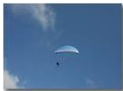
Parapendio in volo

Pietro Marcheselli - Canon EOS 300D 2005 - Estate - Savignone - Altro