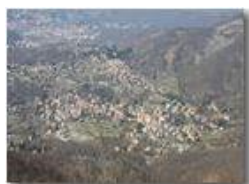
Savignone da M. Maggio

Pietro Marcheselli - Canon EOS 300D 2005 - Estate - Savignone - Fiori&Fauna