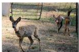
Centro accoglienza caprioli abbandonati (in libertà momentaneamente vigilata)

Pietro Marcheselli - Canon EOS 300D 2009 - Estate - Savignone - Altro