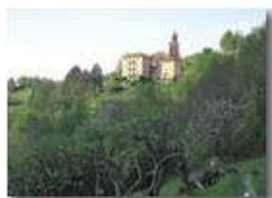
Frazione La Vittoria in luce serale

Pietro Marcheselli - Canon Ixus 980 IS 2011 - Estate - Savignone - Panorami