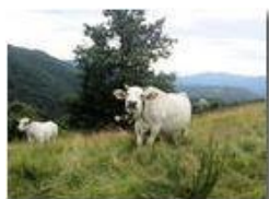
Alpeggio sul M. Cappellino

Pietro Marcheselli - Altro/Other 2014 - Estate - Savignone - Altro