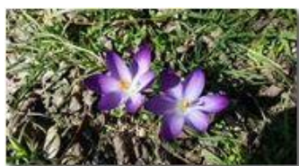
Primavera - Crocus viola

Guido Marcheselli - HTC One S Nokia C7-00 (o altro cell) 2018 - Inverno - Savignone - Panorami