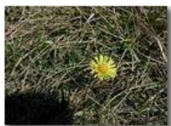
Fiore di Farfara

Pietro Marcheselli - Olympus Camedia 3000 2002 - Estate - Savignone - Boschi