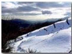
Neve di Marzo: veduta sulla Val Polcevera

Pietro Marcheselli - HTC One S Nokia C7-00 (o altro cell) 2018 - Inverno - Savignone - Panorami