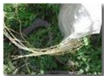
Sorpresa raccogliendo i lamponi.. una biscia

Guido Marcheselli - Olympus Camedia 3000 2005 - Estate - Savignone - Fiori&Fauna