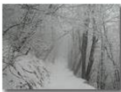
Il vento spolvera la brina dagli alberi

Pietro Marcheselli - Canon EOS 300D 2006 - Inverno - Savignone - Boschi