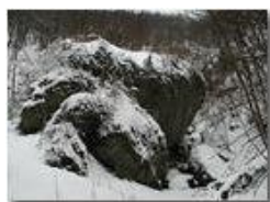
Masso di conglomerato spruzzato di neve

Pietro Marcheselli - Olympus Camedia 3000 2004 - Inverno - Savignone - Paesi