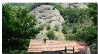
Nella valle del Rio Maggione

Pietro Marcheselli - Altro/Other 2017 - Inverno - Savignone - Altro