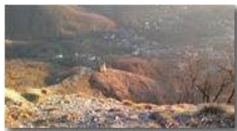
Castello di Savignone dal Pianetto

Guido Marcheselli - Nokia C7-00 (o altro Smartphone) 2013 - Inverno - Savignone - Paesi