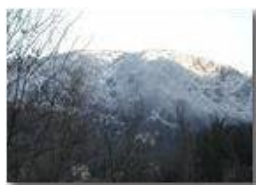
Neve sul Pianetto

Pietro Marcheselli - Olympus Camedia 3000 2004 - Inverno - Savignone - Panorami