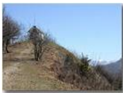
Cappella del M. Pianetto

Pietro Marcheselli - Olympus Camedia 3000 2005 - Inverno - Savignone - Paesi