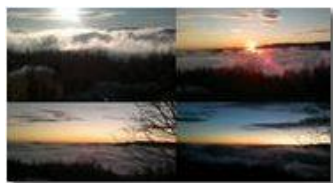
Fasi del tramonto con nebbie, da Montemaggio-Chiapazza

Guido Marcheselli - Nokia C7-00 (o altro Smartphone) 2013 - Inverno - Savignone - Panorami