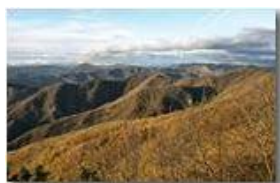
Boschi di Savignone in tardo autunno

Pietro Marcheselli - Canon EOS 300D 2009 - Inverno - Savignone - Boschi