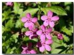
Particolare di Silene rupestris

Canon EOS 300D 2010 - Estate - Savignone - Fiori&Fauna