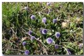
Fiori di globularia

Pietro Marcheselli - Canon EOS 300D 2006 - Estate - Savignone - Fiori&Fauna