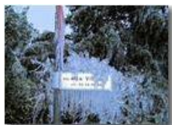
Segnaletica nell' Era glaciale

Guido Marcheselli - Canon Ixus 980 IS 2011 - Inverno - Savignone - Boschi