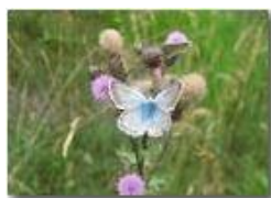
Farfalla su fiore di cirsium arvensis

Pietro Marcheselli - Altro/Other 2016 - Estate - Savignone - Fiori&Fauna