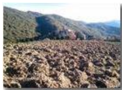
Aratura alla frazione Vittoria

Pietro Marcheselli - Canon Ixus 980 IS 2013 - Inverno - Savignone - Panorami