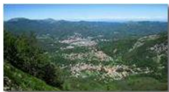
Savignone e Busalla: accorpamento comuni fase 1

Pietro Marcheselli - Canon Ixus 980 IS 2014 - Estate - Savignone - Paesi