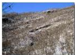
Bosco su conglomerato

Pietro Marcheselli - Altro/Other 2012 - Inverno - Savignone - Altro