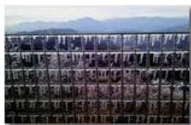
Ghiaccio alla Vittoria

Pietro Marcheselli - Altro/Other 2013 - Inverno - Savignone - Altro