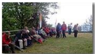
Centenario CAI ULE: si commemora la prima gita al M. Maggio del 1914

Pietro Marcheselli - Altro/Other 2014 - Estate - Savignone - Panorami