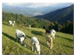
Alpeggio sul M. Cappellino

Pietro Marcheselli - Altro/Other 2014 - Estate - Savignone - Fiori&Fauna