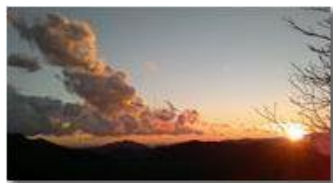
Tramonto da Montemaggio

Guido Marcheselli - Nokia C7-00 (o altro Smartphone) 2013 - Inverno - Savignone - Panorami