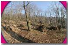
Lavori nel bosco in attesa della ripresa vegetativa

Pietro Marcheselli - Canon EOS 300D 2006 - Inverno - Savignone - Altro