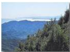
Controluce su Riviera di Ponente

Pietro Marcheselli - Canon Ixus 980 IS 2011 - Estate - Savignone - Panorami