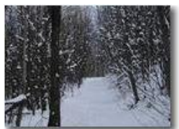
Passeggiata nel bosco con neve

Pietro Marcheselli - Olympus Camedia 3000 2004 - Inverno - Savignone - Panorami