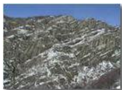
Le rocce del M. Pianetto spolverate di neve

Pietro Marcheselli - Olympus Camedia 3000 2002 - Inverno - Savignone - Paesi