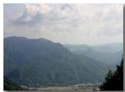
Parapendii in discesa sulla piana di Casella

Pietro Marcheselli - Canon EOS 300D 2005 - Estate - Savignone - Altro