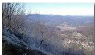
Tra autunno e inverno sul Monte Maggio

Guido Marcheselli - Canon EOS 300D 2013 - Inverno - Savignone - Paesi