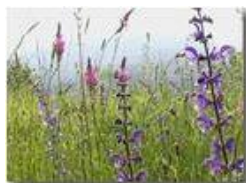
Prati in maggio

Pietro Marcheselli - Panasonic nv-gs70 (VideoCam) 2004 - Estate - Savignone - Fiori&Fauna