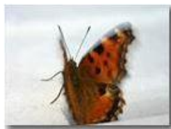
Battito d'ali di farfalla

Pietro Marcheselli - Canon EOS 300D 2005 - Estate - Savignone - Fiori&Fauna