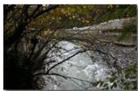
Crollo diga e strada provinciale a Ponte di Savignone

Guido Marcheselli - Canon EOS 300D 2012 - Inverno - Savignone - Paesi