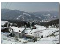
Panorama inenvato da Costalovaia

Pietro Marcheselli - Olympus Camedia 3000 2005 - Inverno - Savignone - Boschi