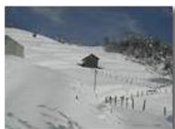
Pendici Monte Cappellino innevate

Pietro Marcheselli - Olympus Camedia 3000 2005 - Inverno - Savignone - Paesi