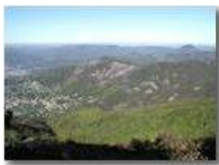
Boschi di Savignone Ottobre 2003

Pietro Marcheselli - Olympus Camedia 3000 2004 - Inverno - Savignone - Altro