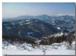
La Vittoria: uno sguardo sulla Val Polcevera

Pietro Marcheselli - Canon Ixus 980 IS 2012 - Inverno - Savignone - Panorami