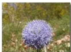
Globularia (videocamera Panasonic nv-gs70)

Pietro Marcheselli - Panasonic nv-gs70 (VideoCam) 2004 - Estate - Savignone - Paesi