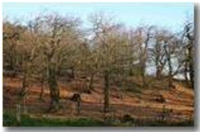
Il castagneto, ormai spoglio, della Colonia di Montemaggio

Pietro Marcheselli - Canon EOS 300D 2006 - Inverno - Savignone - Fiori&Fauna