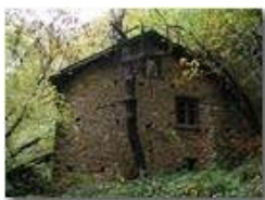
Autunno a Case Crosi - Savignone

Pietro Marcheselli - Olympus Camedia 3000 2004 - Estate - Savignone - Fiori&Fauna