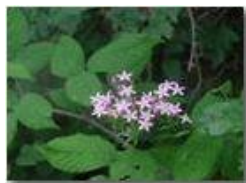
Centaura minore (erythraea centaurium)

Pietro Marcheselli - Olympus Camedia 3000 <2001 - Estate - Savignone - Fiori&Fauna