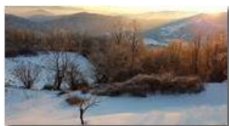
Neve e tramonto

Guido Marcheselli - HTC One S Nokia C7-00 (o altro cell) 2018 - Inverno - Savignone - Panorami