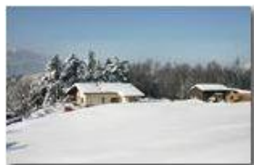
Neve a Costalovaia

Pietro Marcheselli - Canon EOS 300D 2009 - Inverno - Savignone - Altro