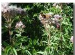
Canapa acquatica (eupatorium)

Pietro Marcheselli - Olympus Camedia 3000 <2001 - Estate - Savignone - Panorami