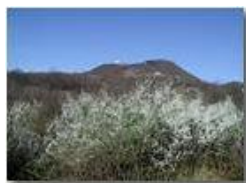
Prunus spinosa e M. Maggio

Pietro Marcheselli - Olympus Camedia 3000 2002 - Estate - Savignone - Boschi