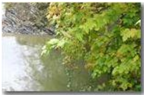
Un angolo pescoso del fiume Scrivia

Pietro Marcheselli - Canon EOS 300D 2006 - Inverno - Savignone - Panorami