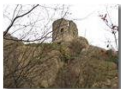
Castello Fieschi Savignone

Pietro Marcheselli - Canon Ixus 980 IS 2010 - Inverno - Savignone - Panorami