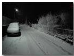
Prima timida nevicata

Pietro Marcheselli - HTC One S Nokia C7-00 (o altro cell) 2019 - Inverno - Savignone - Paesi