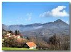
Cerisola, frazione di Savignone

Pietro Marcheselli - Canon Ixus 980 IS 2010 - Inverno - Savignone - Paesi