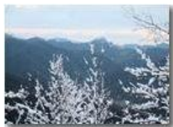
Alpe Sisa: prospettiva conica

Pietro Marcheselli - Canon Ixus 980 IS 2015 - Inverno - Savignone - Panorami