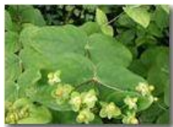
Una euphorbia erbacea

Pietro Marcheselli - Canon Ixus 980 IS 2014 - Estate - Savignone - Fiori&Fauna