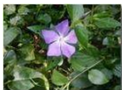
Fiore di pervinca

Guido Marcheselli - HTC One S Nokia C7-00 (o altro cell) 2016 - Inverno - Savignone - Panorami