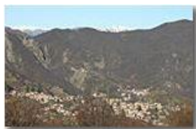
Savignone nel mese di marzo

Pietro Marcheselli - Canon EOS 300D 2009 - Inverno - Savignone - Paesi