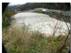
Piena del fiume Scrivia del 24-11

Pietro Marcheselli - Olympus Camedia 3000 2003 - Inverno - Savignone - Panorami