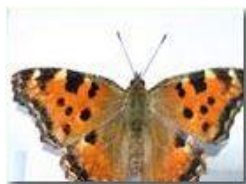
Una farfalla vanessa (aglais urticae)

Guido Marcheselli - Olympus Camedia 3000 2005 - Estate - Savignone - Fiori&Fauna