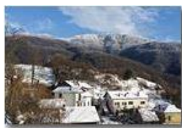
Neve di Marzo: Castello Rosso e Monte Maggio

Pietro Marcheselli - HTC One S Nokia C7-00 (o altro cell) 2018 - Inverno - Savignone - Paesi