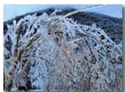
Ghiaccio sul Monte Fueba

Pietro Marcheselli - Canon Ixus 980 IS 2009 - Estate - Savignone - Altro