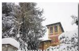
Nevicata sul "mirador"

Pietro Marcheselli - Olympus Camedia 3000 2006 - Inverno - Savignone - Paesi