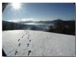
Controluce invernale con neve

Pietro Marcheselli - Olympus Camedia 3000 2003 - Inverno - Savignone - Panorami