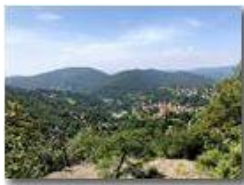
Savignone vista dal crinale di un Monte Carmo

Pietro Marcheselli - HTC One S Nokia C7-00 (o altro cell) 2018 - Estate - Savignone - Altro