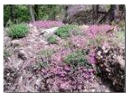
Silene rupestris su conglomerato

Pietro Marcheselli - Canon Ixus 980 IS 2011 - Estate - Savignone - Fiori&Fauna