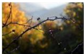
Rovo e rugiada

rattopernugo - Canon EOS 300D 2006 - Inverno - Savignone - Boschi