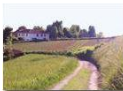
Campo di patate alla Vittoria

Guido Marcheselli - HTC One S Nokia C7-00 (o altro cell) 2015 - Estate - Savignone - Fiori&Fauna