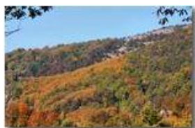
Autunno a Savignone

Pietro Marcheselli - Canon EOS 300D 2009 - Estate - Savignone - Panorami