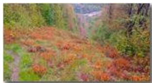
Danni al bosco dopo una tardiva gelata in aprile

Pietro Marcheselli - Altro/Other 2017 - Inverno - Savignone - Altro