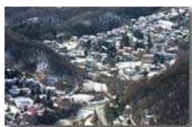
Frazioni Ponte, San Bartolomeo e Prelo sotto la neve

Guido Marcheselli - Webcam 2017 - Foto varie - Savignone - Panorami