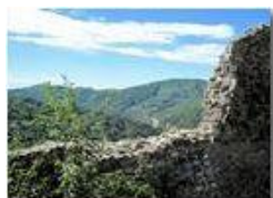
Castello fieschi: vista dalle mura

Pietro Marcheselli - Canon Ixus 980 IS 2012 - Estate - Savignone - Altro