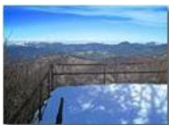
Dal balcone del Monte Maggio

Pietro Marcheselli - Altro/Other 2015 - Inverno - Savignone - Fiori&Fauna