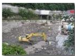
Chiusura della diga

Pietro Marcheselli - Altro/Other 2013 - Estate - Savignone - Panorami