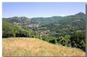
La Valle Scrivia a Savignone

Pietro Marcheselli - Canon EOS 300D 2007 - Estate - Savignone - Panorami