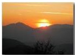
Santuario della Guardia: il tramonto al solstizio d'inverno

Pietro Marcheselli - Canon Ixus 980 IS 2010 - Inverno - Savignone - Paesi