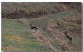
Daini: salto in alto

Guido Marcheselli - Olympus OM-D E-M10 Mark III 2019 - Inverno - Savignone - Fiori&Fauna