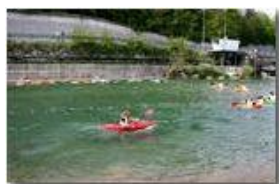
Kajak in gara

Pietro Marcheselli - Canon EOS 300D 2006 - Estate - Savignone - Altro