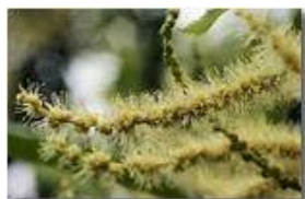
Gli amenti (fiori maschili) del castagno

Pietro Marcheselli - Canon EOS 300D 2009 - Estate - Savignone - Fiori&Fauna