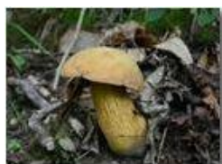
Fungo boletus luridus (tossico)

Pietro Marcheselli - Canon EOS 300D 2005 - Estate - Savignone - Fiori&Fauna