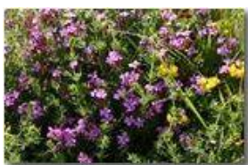
Silene rupestris fiorita sul conglomerato di Monte Maggio

Pietro Marcheselli - Canon EOS 300D 2006 - Estate - Savignone - Boschi