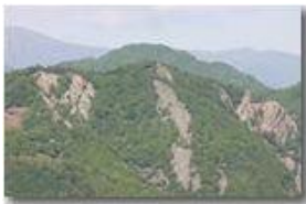
Il conglomerato del Monte Pianetto

Pietro Marcheselli - Canon EOS 300D 2007 - Estate - Savignone - Panorami