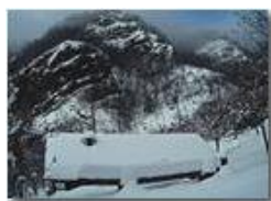
Dopo la nevicata

Pietro Marcheselli - Altro/Other 2014 - Inverno - Savignone - Altro