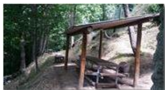
Un invito alla sosta

Pietro Marcheselli - Altro/Other 2017 - Estate - Savignone - Altro