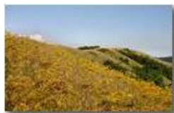
Libellula: Calopteryx virgo

Pietro Marcheselli - Canon EOS 300D 2010 - Estate - Savignone - Fiori&Fauna