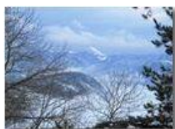
Monte Alpesisa con nebbie e neve

Pietro Marcheselli - Canon Ixus 980 IS 2010 - Inverno - Savignone - Panorami