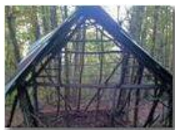
Antica struttura antisismica

Pietro Marcheselli - Altro/Other 2013 - Inverno - Savignone - Altro