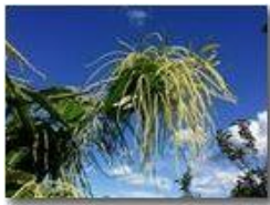
Copiosa fioritura di castagno

Pietro Marcheselli - HTC One S Nokia C7-00 (o altro cell) 2018 - Estate - Savignone - Fiori&Fauna