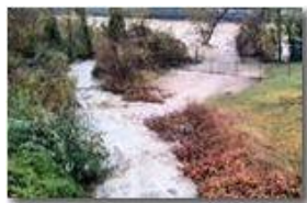
Contributo del ruscello Ramà alla piena del fiume Scivia

Pietro Marcheselli - Altro/Other 2011 - Inverno - Savignone - Altro