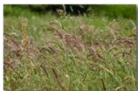
Prati di maggio: l'angolo delle graminacee

Pietro Marcheselli - Canon EOS 300D 2008 - Estate - Savignone - Fiori&Fauna