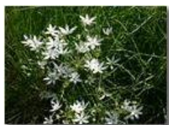
Ornithogalum umbellatum (latte di gallina)

Pietro Marcheselli - Canon EOS 300D 2005 - Estate - Savignone - Fiori&Fauna