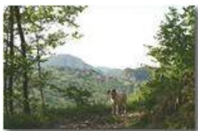
A passeggio nel bosco

Pietro Marcheselli - Canon EOS 300D 2006 - Estate - Savignone - Boschi