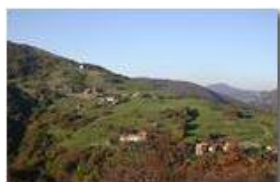
Luci di fine ottobre a Gualdrà

Pietro Marcheselli - Canon EOS 300D 2006 - Inverno - Savignone - Panorami