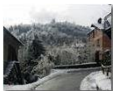
Inverno al Prelo

Pietro Marcheselli - HTC One S Nokia C7-00 (o altro cell) 2019 - Inverno - Savignone - Paesi