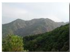
Agosto 2003: siccità nei boschi

Pietro Marcheselli - Olympus Camedia 3000 2003 - Estate - Savignone - Panorami