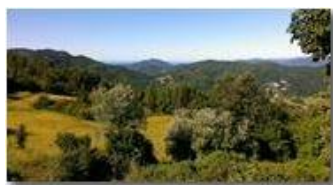
Cielo limpido sopra i forti di Genova, da Montemaggio

Guido Marcheselli - Canon EOS 300D 2014 - Estate - Savignone - Fiori&Fauna