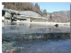
Il fiume Scrivia gelato

Pietro Marcheselli - Olympus Camedia 3000 2002 - Inverno - Savignone - Paesi