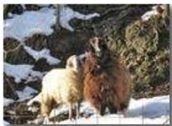
La strana coppia (in memoria di Aldo)

Pietro Marcheselli - Canon Ixus 980 IS 2010 - Inverno - Savignone - Paesi