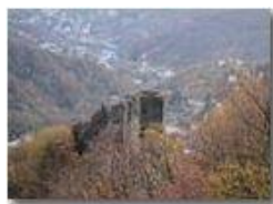
Il castello Fieschi domina sulla Valle Scivia

Pietro Marcheselli - Canon Ixus 980 IS 2012 - Inverno - Savignone - Altro