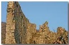
Savignone, Castello Fieschi: ruderi parzialmente restaurati (?)

Pietro Marcheselli - Canon EOS 300D 2006 - Inverno - Savignone - Panorami