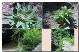
Lo sviluppo di una tasso barbasso (verbascum thapsus)

Pietro Marcheselli - Canon EOS 300D 2009 - Estate - Savignone - Fiori&Fauna