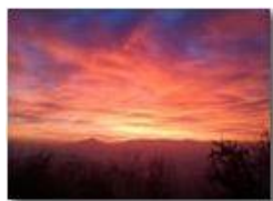
Rosso di sera

Pietro Marcheselli - Canon Ixus 980 IS 2013 - Estate - Savignone - Altro