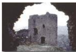
Castello Fieschi - Savignone

Pietro Marcheselli - Scanner <2001 - Inverno - Savignone - Paesi