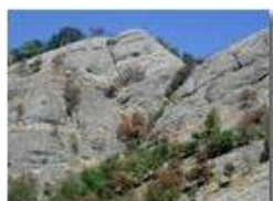
Il conglomerato di Savignone

Pietro Marcheselli - Olympus Camedia 3000 <2001 - Estate - Savignone - Fiori&Fauna