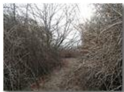
Ancora rovi sul M. Vittoria

Pietro Marcheselli - Olympus Camedia 3000 2002 - Inverno - Savignone - Boschi