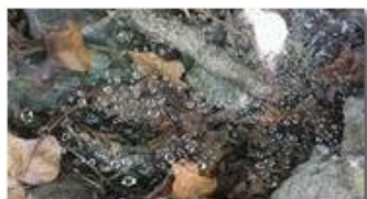
Ragnatela imperlata di rugiada

Guido Marcheselli - HTC One S Nokia C7-00 (o altro cell) 2013 - Estate - Savignone - Panorami