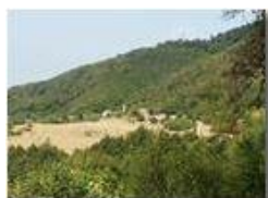
Frazione Montemaggio di Savignone

Pietro Marcheselli - Altro/Other 2017 - Estate - Savignone - Boschi