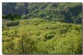
Trionfo dei verdi (i colori!) in Val Seminella

Pietro Marcheselli - Canon EOS 300D 2006 - Estate - Savignone - Fiori&Fauna