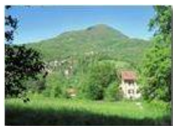
Monte Maggio versione tarda primavera

Pietro Marcheselli - Canon Ixus 980 IS 2010 - Estate - Savignone - Paesi