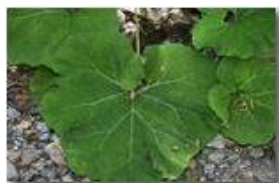
Le grandi foglie di una gunnera

Pietro Marcheselli - Canon Ixus 980 IS 2010 - Estate - Savignone - Fiori&Fauna