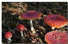
Famiglia di funghi amanita muscaria

Pietro Marcheselli - Canon EOS 300D 2006 - Inverno - Savignone - Panorami