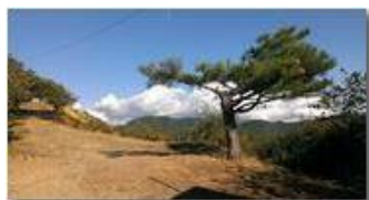
Il pino del monte Pianetto

Pietro Marcheselli - Canon Ixus 980 IS 2013 - Inverno - Savignone - Altro