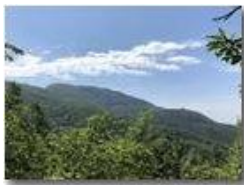
Monte Maggio e Colonia

Pietro Marcheselli - HTC One S Nokia C7-00 (o altro cell) 2018 - Estate - Savignone - Paesi