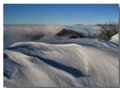
Neve e nebbia sul Monte Maggio

Pietro Marcheselli - Webcam 2010 - Inverno - Savignone - Altro