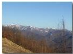
Monti Liguri: Neve sul M. Antola

Pietro Marcheselli - Canon Ixus 980 IS 2016 - Inverno - Savignone - Panorami