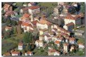
Il cuore storico del borgo di Savignone

Pietro Marcheselli - Canon EOS 300D 2008 - Inverno - Savignone - Paesi