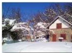
La baita sul poggio

Pietro Marcheselli - Canon Ixus 980 IS 2013 - Inverno - Savignone - Altro