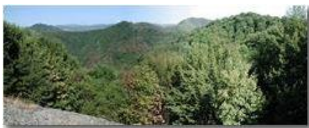
Siccità 2003: Savignone: I boschi del Pianetto

Pietro Marcheselli - Olympus Camedia 3000 2003 - Estate - Savignone - Panorami