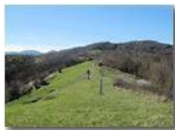
Costa dei Fontanini e Monte Vittoria

Pietro Marcheselli - Altro/Other 2011 - Estate - Savignone - Panorami