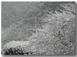
Neve novembrina a ponte di Savignone

Pietro Marcheselli - Canon EOS 300D 2006 - Inverno - Savignone - Fiori&Fauna