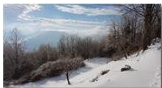
Neve, ghiaccio e sole

Guido Marcheselli - HTC One S Nokia C7-00 (o altro cell) 2018 - Inverno - Savignone - Panorami