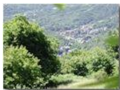
La fraz. San Bartolomeo di Vallecaldà

Pietro Marcheselli - Olympus Camedia 3000 <2001 - Estate - Savignone - Fiori&Fauna