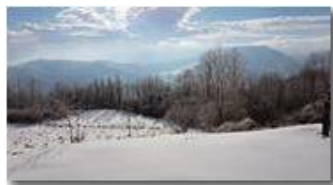
Il sole dopo la tormenta di neve

Guido Marcheselli - HTC One S Nokia C7-00 (o altro cell) 2018 - Inverno - Savignone - Panorami