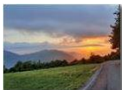
Tramonto scendendo da Montemaggio

Pietro Marcheselli - HTC One/Nokia C7/Samsung S7/S10 2020 - Estate - Savignone - Altro