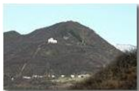
Monte Maggio a inizio marzo

Pietro Marcheselli - Canon EOS 300D 2009 - Inverno - Savignone - Panorami