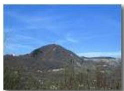
Luce di primavera e Monte Maggio

Pietro Marcheselli - Canon Ixus 980 IS 2011 - Estate - Savignone - Fiori&Fauna