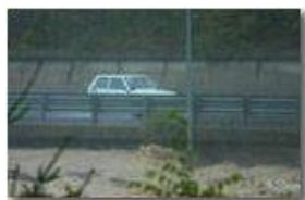
L'acqua insidia la statale 226

Pietro Marcheselli - Altro/Other 2011 - Inverno - Savignone - Altro