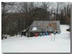
Il vecchio ovile sotto la neve

Pietro Marcheselli - Olympus Camedia 3000 2005 - Inverno - Savignone - Paesi