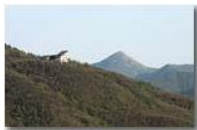
Colonia Montemaggio e Monte Alpesisa

Pietro Marcheselli - Canon EOS 300D 2009 - Estate - Savignone - Panorami