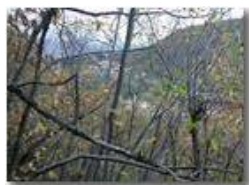
Cadono le foglie: Savignone appare oltre il bosco

Pietro Marcheselli - Olympus Camedia 3000 2002 - Inverno - Savignone - Paesi