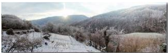
Capodanno con neve e ghiaccio a Ponte di Savignone

Pietro Marcheselli - Canon EOS 300D 2006 - Inverno - Savignone - Panorami