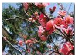
Cydonia (spina di Cristo)

Pietro Marcheselli - Olympus Camedia 3000 2004 - Estate - Savignone - Fiori&Fauna