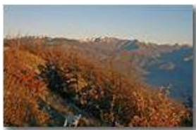
Un'altra foto dedicata al monte Antola

Pietro Marcheselli - Canon EOS 300D 2006 - Inverno - Savignone - Panorami