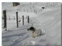
Pendici Monte Cappellino innevate

Pietro Marcheselli - Olympus Camedia 3000 2005 - Inverno - Savignone - Panorami