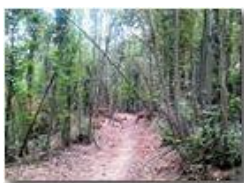
Le capre di Salvega

Pietro Marcheselli - Canon Ixus 980 IS 2011 - Estate - Savignone - Altro