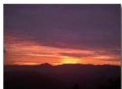
Da frazione Vittoria: luci del tramonto

Pietro Marcheselli - Canon Ixus 980 IS 2011 - Inverno - Savignone - Altro