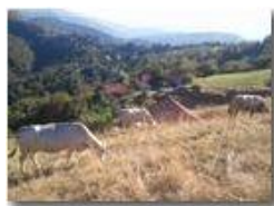
Pascoli di Maggetta

Pietro Marcheselli - Altro/Other 2012 - Estate - Savignone - Altro