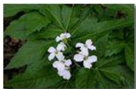
Fiore di Dentaria

Pietro Marcheselli - Canon EOS 300D 2009 - Estate - Savignone - Fiori&Fauna