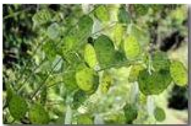
Frutto immaturo di lunaria annua: siliqua rotonda e appiattita, con semi

Pietro Marcheselli - Canon EOS 300D 2007 - Estate - Savignone - Panorami