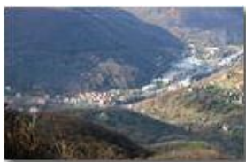
Zona commerciale, frazione Canalborzone

Pietro Marcheselli - Canon EOS 300D 2008 - Inverno - Savignone - Paesi