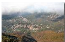
Autunno 2010 sui boschi di Savignone

Pietro Marcheselli - Canon Ixus 980 IS 2011 - Inverno - Savignone - Altro