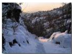
Piambertone: sentiero al tramonto

Pietro Marcheselli - Altro/Other 2012 - Inverno - Savignone - Panorami