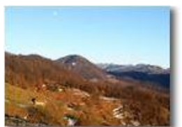
Tramonto con Monte Maggio

Pietro Marcheselli - Canon Ixus 980 IS 2015 - Inverno - Savignone - Paesi