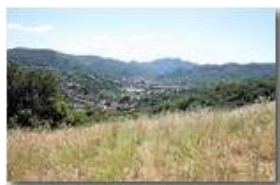
La Valle Scrivia a Casella

Pietro Marcheselli - Canon EOS 300D 2007 - Estate - Savignone - Fiori&Fauna