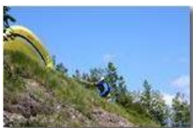
Parapendio: pronti per la partenza!

Pietro Marcheselli - Canon EOS 300D 2006 - Estate - Savignone - Fiori&Fauna