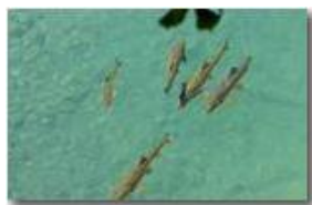
Trote(?) nel fiume Scrivia, Ponte di Savignone

Guido Marcheselli - HTC One S Nokia C7-00 (o altro cell) 2014 - Estate - Savignone - Fiori&Fauna