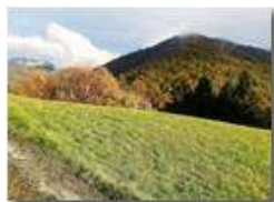
Pendici M. Cappellino: panorama autunnale

HTC One S Nokia C7-00 (o altro cell) 2018 - Inverno - Savignone - Boschi