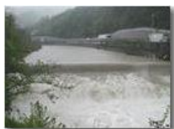
Il fiume Scrivia dopo una pioggia in maggio

Pietro Marcheselli - Olympus Camedia 3000 2002 - Estate - Savignone - Boschi