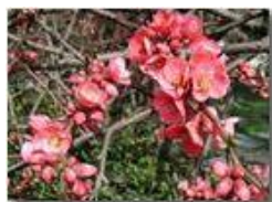
Fioritura di cydonia japonica

Pietro Marcheselli - Olympus Camedia 3000 2002 - Estate - Savignone - Fiori&Fauna