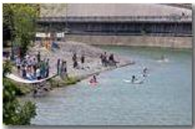
"Extreme kayak Valle Scrivia": staffetta di kayak, mbike, corsa di montagna, parapendio

Pietro Marcheselli - Canon EOS 300D 2007 - Estate - Savignone - Paesi