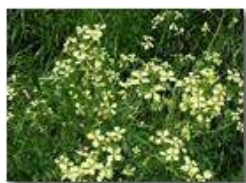
Una crucifera campestre

Pietro Marcheselli - Olympus Camedia 3000 2004 - Estate - Savignone - Fiori&Fauna