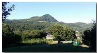
Il Monte Maggio visto da Besolagno

Pietro Marcheselli - Altro/Other 2017 - Estate - Savignone - Panorami