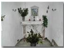
La Madonna della Guardia del Monte Pianetto

Pietro Marcheselli - Olympus Camedia 3000 2006 - Inverno - Savignone - Panorami