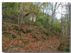
A passeggio nel bosco

Pietro Marcheselli - Olympus Camedia 3000 2002 - Inverno - Savignone - Panorami