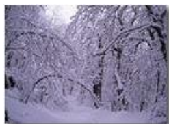
1 marzo: Bosco della Colonia

Pietro Marcheselli - Altro/Other 2014 - Inverno - Savignone - Boschi