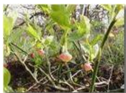
Fiori di mirtillo (videocamera Panasonic nv-gs70)

Pietro Marcheselli - Panasonic nv-gs70 (VideoCam) 2004 - Estate - Savignone - Fiori&Fauna