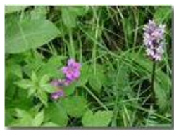
Geranio selvatico e orchidea

Pietro Marcheselli - Olympus Camedia 3000 2002 - Estate - Savignone - Fiori&Fauna