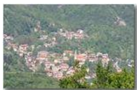
Variazioni stagionali: il paese di Savignone in maggio

Pietro Marcheselli - Canon EOS 300D 2007 - Estate - Savignone - Paesi