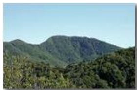
Monte Maggio da una insolita prospettiva

Pietro Marcheselli - Canon EOS 300D 2009 - Estate - Savignone - Altro