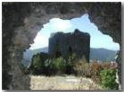
Savignone: ruderi del Castello Fieschi

Pietro Marcheselli - Olympus Camedia 3000 <2001 - Estate - Savignone - Paesi