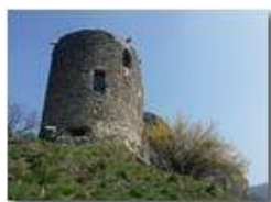
Primi accenni di primavera al Castello Fieschi

Pietro Marcheselli - Canon Ixus 980 IS 2018 - Inverno - Savignone - Panorami