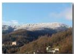
Brinata sul M. Vittoria

Pietro Marcheselli - Canon Ixus 980 IS 2015 - Inverno - Savignone - Panorami