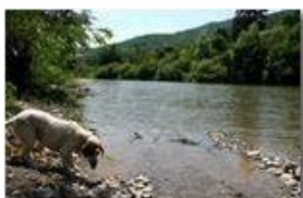
Fiume Scrivia a San Bartolomeo

Pietro Marcheselli - Canon EOS 300D 2005 - Estate - Savignone - Paesi