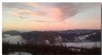
Alba da Montemaggio - Chiapazza

Guido Marcheselli - Nokia C7-00 (o altro Smartphone) 2013 - Inverno - Savignone - Paesi