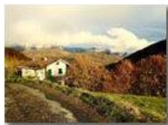
Pendici M. Cappellino: panorama autunnale

Pietro Marcheselli - HTC One S Nokia C7-00 (o altro cell) 2018 - Inverno - Savignone - Panorami