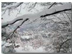
Besolagno tra i rami carichi di neve

Pietro Marcheselli - Olympus Camedia 3000 2006 - Inverno - Savignone - Altro