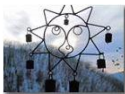
Incontro ravvicinato di tipo incognito

Pietro Marcheselli - Canon Ixus 980 IS 2010 - Inverno - Savignone - Panorami