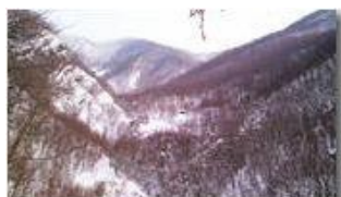
Valle del rio Maggione

Pietro Marcheselli - Canon Ixus 980 IS 2012 - Inverno - Savignone - Boschi