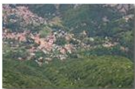
Il paese di Savignone, tra boschi e conglomerato

Pietro Marcheselli - Canon EOS 300D 2005 - Estate - Savignone - Panorami