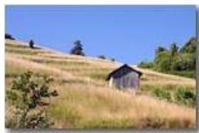
Variazioni stagionali: prati del Monte Cappellino in luglio

Pietro Marcheselli - Canon EOS 300D 2007 - Estate - Savignone - Panorami