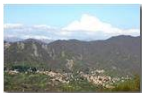
Savignone adagiato ai piedi del Monte Pianetto

Pietro Marcheselli - Canon EOS 300D 2006 - Estate - Savignone - Fiori&Fauna