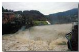
Disgelo: Fiume Scrivia in gennaio

Pietro Marcheselli - Canon EOS 300D 2009 - Inverno - Savignone - Paesi