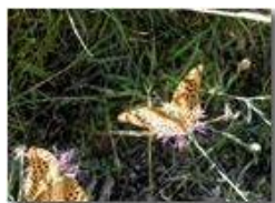
Esemplari di farfalla argynnis paphia

Pietro Marcheselli - Olympus Camedia 3000 <2001 - Estate - Savignone - Fiori&Fauna