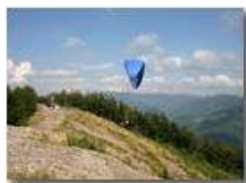
Partenza parapendio da Monte Maggio

Pietro Marcheselli - Canon EOS 300D 2005 - Estate - Savignone - Fiori&Fauna