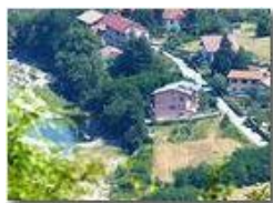
Fiume Scrivia in secca a Ponte di Savignone

Pietro Marcheselli - Altro/Other 2017 - Estate - Savignone - Altro