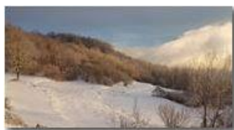
Sole, neve, e nebbie all'arrembaggio

Guido Marcheselli - HTC One S Nokia C7-00 (o altro cell) 2018 - Inverno - Savignone - Boschi