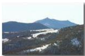
I forti di Genova: Diamante e Fratello Minore visti da nord

Pietro Marcheselli - Canon EOS 300D 2008 - Inverno - Savignone - Paesi