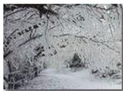
Brinata sul Monte Pianetto

Pietro Marcheselli - Canon Ixus 980 IS 2013 - Inverno - Savignone - Boschi