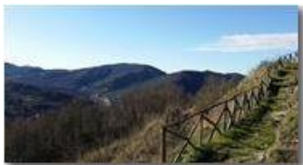
Veduta di San Bartolomeo di Vallecaldà dal Castello Fieschi

Pietro Marcheselli - Canon Ixus 980 IS 2017 - Inverno - Savignone - Altro