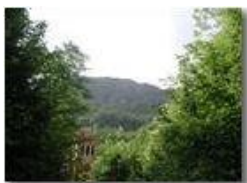
Il Castello dei Fieschi (Savignone)

Pietro Marcheselli - Olympus Camedia 3000 <2001 - Estate - Savignone - Fiori&Fauna