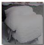
Modern design: poltroncina per l'estate

Pietro Marcheselli - Canon EOS 300D 2006 - Inverno - Savignone - Altro