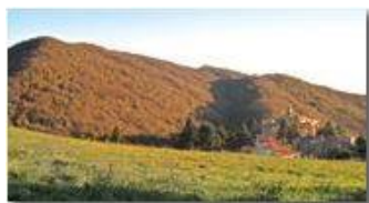
Tramonto autunnale sul Monte Maggio

Pietro Marcheselli - Canon Ixus 980 IS 2016 - Inverno - Savignone - Panorami