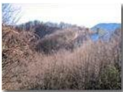
Pianetto: la cima della Cappelletta

Pietro Marcheselli - Canon Ixus 980 IS 2014 - Inverno - Savignone - Paesi