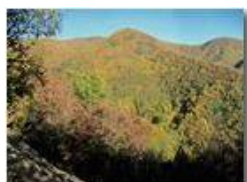
Colori d'autunno nei boschi di Savignone

Pietro Marcheselli - Canon Ixus 980 IS 2018 - Inverno - Savignone - Altro