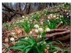
Primi segnali di primavera: Leucojum vernum (campanellino)

Pietro Marcheselli - Canon Ixus 980 IS 2016 - Inverno - Savignone - Panorami