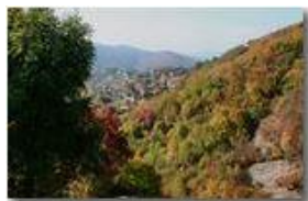
Autunno a Savignone

Pietro Marcheselli - Canon EOS 300D 2009 - Estate - Savignone - Boschi