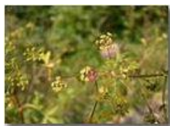
Una delle tante cimici che frequentano i vegetali

Pietro Marcheselli - Canon EOS 300D 2005 - Estate - Savignone - Fiori&Fauna