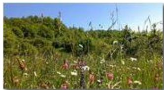
Prati fioriti a Chiappazza (Montemaggio)

Guido Marcheselli - Canon EOS 300D 2014 - Estate - Savignone - Fiori&Fauna