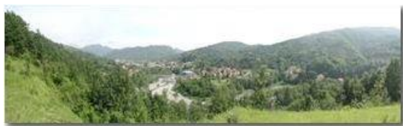
Besolagno e il ponte di Stabbio

Pietro Marcheselli - Olympus Camedia 3000 <2001 - Estate - Savignone - Panorami