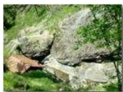
Un angolo del Rio Maggione

Pietro Marcheselli - HTC One S Nokia C7-00 (o altro cell) 2018 - Estate - Savignone - Panorami