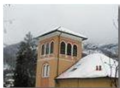
Frequente la presenza della torretta (anche detta mirador)

Pietro Marcheselli - Olympus Camedia 3000 2006 - Inverno - Savignone - Paesi