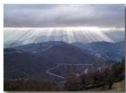
Effetto di luce sulla Val Polcevera

Pietro Marcheselli - Canon Ixus 980 IS 2011 - Inverno - Savignone - Altro