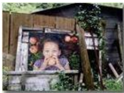
Bambina alla finestra?

Pietro Marcheselli - HTC One S Nokia C7-00 (o altro cell) 2018 - Estate - Savignone - Fiori&Fauna