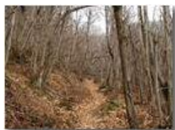
Bosco d' inverno

Pietro Marcheselli - Olympus Camedia 3000 2002 - Inverno - Savignone - Panorami