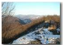
La prima neve

Pietro Marcheselli - Olympus Camedia 3000 2004 - Inverno - Savignone - Paesi