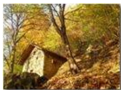
Colori d'autunno nei boschi di Savignone

Pietro Marcheselli - HTC One S Nokia C7-00 (o altro cell) 2018 - Inverno - Savignone - Boschi