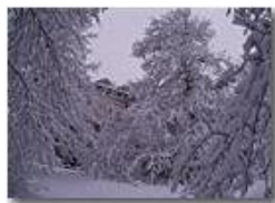
1 marzo: Bosco della Colonia

Pietro Marcheselli - Altro/Other 2014 - Inverno - Savignone - Boschi