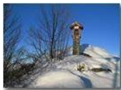
Monte Maggio: edicola votiva di vetta

Pietro Marcheselli - Webcam 2010 - Inverno - Savignone - Altro