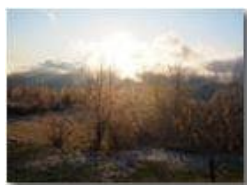
Tramonto e galaverna a Montemaggio

Guido Marcheselli - Olympus OM-D E-M10 Mark III 2020 - Inverno - Savignone - Panorami