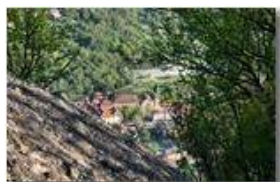
Veduta di Savignone dalle pareti di conglomerato del monte Pianetto

Pietro Marcheselli - Canon EOS 300D 2009 - Estate - Savignone - Panorami