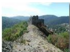
Savignone: ruderi del Castello Fieschi

Pietro Marcheselli - Olympus Camedia 3000 <2001 - Estate - Savignone - Paesi