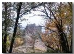
Savignone: Castello Fieschi

Pietro Marcheselli - Canon Ixus 980 IS 2011 - Inverno - Savignone - Boschi