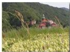
Fioritura al Sant. della Vittoria (Savignone)

Pietro Marcheselli - Olympus Camedia 3000 2004 - Estate - Savignone - Fiori&Fauna