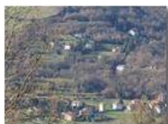
Frazione Besolagno da Chiapazza

Guido Marcheselli - Olympus OM-D E-M10 Mark III 2019 - Inverno - Savignone - Panorami