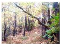
Bosco in autunno

Pietro Marcheselli - Canon Ixus 980 IS 2018 - Inverno - Savignone - Boschi