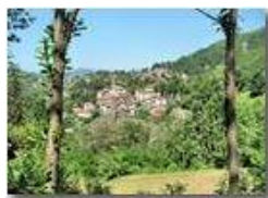
Savignone in estate

Pietro Marcheselli - Canon EOS 300D 2010 - Estate - Savignone - Paesi