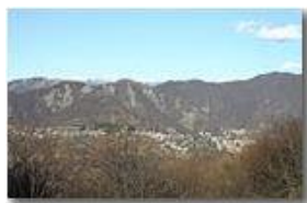
Savignone, la barriera di conglomerato e le ultime nevi

Pietro Marcheselli - Canon EOS 300D 2009 - Inverno - Savignone - Panorami