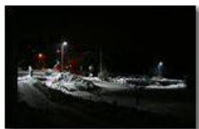
Notturmo con neve

Pietro Marcheselli - Canon Ixus 980 IS 2012 - Inverno - Savignone - Altro