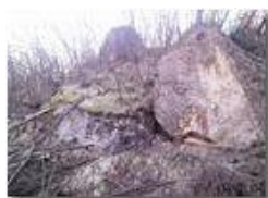
Boschi danneggiati dal gelo a inizio primavera

Pietro Marcheselli - Canon Ixus 980 IS 2011 - Inverno - Savignone - Panorami