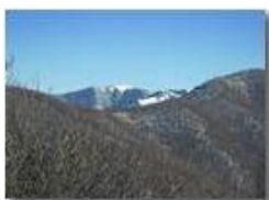
Monte Buio visto dal monte Pianetto

Pietro Marcheselli - Canon Ixus 980 IS 2010 - Inverno - Savignone - Panorami