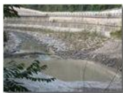
Fine lavori diga Savignone: l'acqua comincia a salire

Pietro Marcheselli - Canon Ixus 980 IS 2013 - Estate - Savignone - Altro