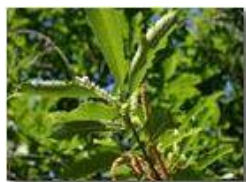
Fiori maschili e femminili di castagno

Pietro Marcheselli - Canon EOS 300D 2005 - Estate - Savignone - Fiori&Fauna