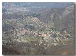
Savignone veduta aerea

Pietro Marcheselli - Olympus Camedia 3000 2005 - Inverno - Savignone - Panorami