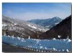
La Vittoria: uno sguardo sulla Vallecaldà

Pietro Marcheselli - Altro/Other 2012 - Inverno - Savignone - Panorami