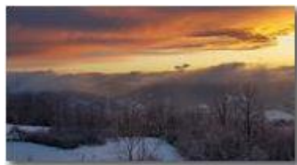
Tramonto: rosso di sera neve si spera (?)

Guido Marcheselli - HTC One S Nokia C7-00 (o altro cell) 2018 - Inverno - Savignone - Panorami