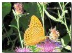
Una farfalla argynnis aglaia su fiore di centaurea

Pietro Marcheselli - Canon EOS 300D 2010 - Estate - Savignone - Fiori&Fauna