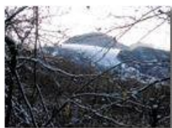
Si intravede il Monte Reale

Pietro Marcheselli - HTC One S Nokia C7-00 (o altro cell) 2013 - Inverno - Savignone - Fiori&Fauna