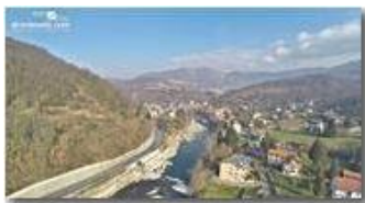
Ponte di Savignone: aerea

- Altro/Other 2015 - Inverno - Savignone - Paesi