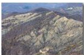
Castello Fieschi e Monte Pianetto

Pietro Marcheselli - Canon EOS 300D 2008 - Inverno - Savignone - Boschi