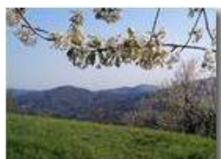
Veduta primaverile verso i forti di Genova

Pietro Marcheselli - Canon EOS 300D 2011 - Estate - Savignone - Panorami