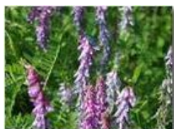
Cedrangola lupinella (Onobrychis sativa)

Pietro Marcheselli - Olympus Camedia 3000 <2001 - Estate - Savignone - Fiori&Fauna