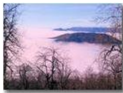
Inversione termica: Monte Vittoria e Figogna

Pietro Marcheselli - Altro/Other 2013 - Inverno - Savignone - Panorami