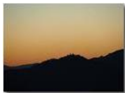
Santuario della Guardia al tramonto

Guido Marcheselli - Olympus OM-D E-M10 Mark III 2016 - Inverno - Savignone - Panorami