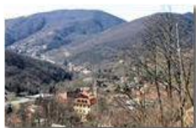
Veduta di Savignone a fine inverno

Pietro Marcheselli - Canon EOS 300D 2009 - Inverno - Savignone - Paesi