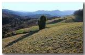
Panorama sulla Val Polcevera

Pietro Marcheselli - Canon EOS 300D 2009 - Inverno - Savignone - Fiori&Fauna