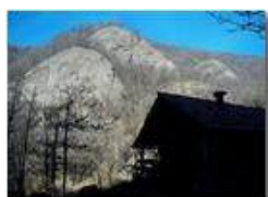
Chiaroscuri in Val Maggione

Pietro Marcheselli - Altro/Other 2013 - Inverno - Savignone - Panorami