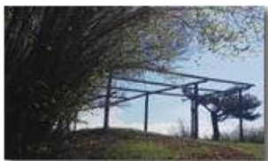
Salendo alla Cappelletta del Pianetto

Pietro Marcheselli - Canon Ixus 980 IS 2017 - Inverno - Savignone - Altro