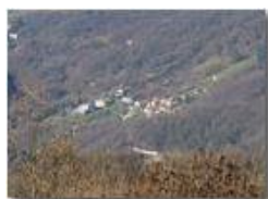
Frazione Vallecaldà da Montemaggio

Guido Marcheselli - Olympus OM-D E-M10 Mark III 2019 - Inverno - Savignone - Paesi