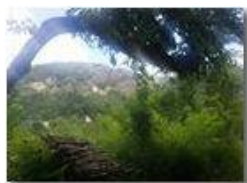
Castello e Monte Pianetto

Guido Marcheselli - Olympus OM-D E-M10 Mark III 2020 - Inverno - Savignone - Panorami