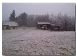
Ghiaccio a Costalovaia

Pietro Marcheselli - Canon Ixus 980 IS 2011 - Inverno - Savignone - Altro