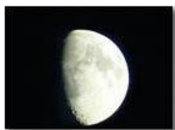
Che fai tu luna in ciel? Dimmi che fai...

Pietro Marcheselli - Canon Ixus 980 IS 2016 - Estate - Savignone - Panorami