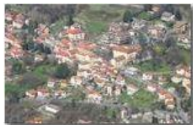
Ancora una zoomata su Savignone dal Monte Maggio

Pietro Marcheselli - Altro/Other 2011 - Estate - Savignone - Panorami