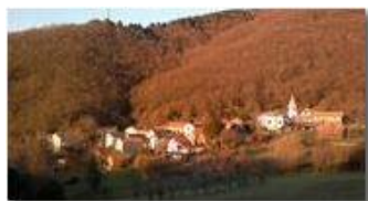
Il paese di Montemaggio al tramonto

Guido Marcheselli - Nokia C7-00 (o altro Smartphone) 2013 - Inverno - Savignone - Panorami