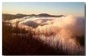
La valle annebbiata

Pietro Marcheselli - Canon Ixus 980 IS 2014 - Inverno - Savignone - Panorami