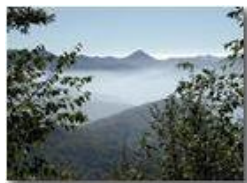
Alpe Sisa emerge dalle nebbie della Valle Scrivia

Pietro Marcheselli - Olympus Camedia 3000 2002 - Inverno - Savignone - Panorami