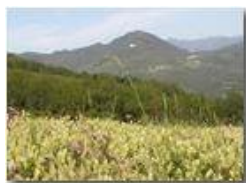
Cresta di gallo con M. Maggio

Pietro Marcheselli - Panasonic nv-gs70 (VideoCam) 2004 - Estate - Savignone - Paesi