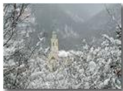
La chiesa di San Bartolomeo sotto la neve

Guido Marcheselli - Olympus Camedia 3000 2006 - Inverno - Savignone - Boschi