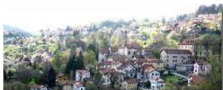
Savignone in primavera

Pietro Marcheselli - Canon EOS 300D 2010 - Estate - Savignone - Fiori&Fauna