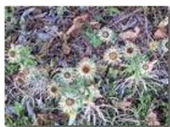
Una varietà di cirsium o una nuova costellazione?

Pietro Marcheselli - Altro/Other 2012 - Estate - Savignone - Boschi