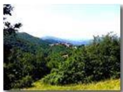
Santuario Regina della Vittoria

Pietro Marcheselli - HTC One S Nokia C7-00 (o altro cell) 2018 - Estate - Savignone - Paesi