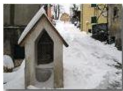
Il lungo inverno freddo: neve del 18 marzo

Guido Marcheselli - Nokia C7-00 (o altro Smartphone) 2013 - Inverno - Savignone - Boschi