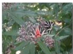
Callimorpha ad ali socchiuse: in volo mostra ali di color rosso vivo

Pietro Marcheselli - Olympus Camedia 3000 <2001 - Estate - Savignone - Fiori&Fauna