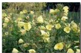
Oenothera biennis (Enotera o enagra o rapunzia). Pianta medicinale e ornamentale a facile diffusione: fiorisce la sera

Pietro Marcheselli - Canon EOS 300D 2008 - Estate - Savignone - Fiori&Fauna