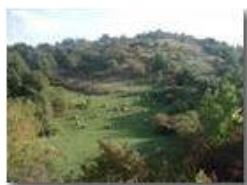
Fieno sul Monte Albarino

Pietro Marcheselli - Olympus Camedia 3000 <2001 - Estate - Savignone - Panorami