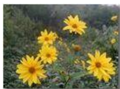
Heliantus tuberosum pianta ornamentale inselvaticata

Pietro Marcheselli - Olympus Camedia 3000 <2001 - Estate - Savignone - Panorami