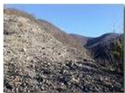
Salendo tra Rio Maggione e Rio Piambertone

Pietro Marcheselli - HTC One S Nokia C7-00 (o altro cell) 2019 - Inverno - Savignone - Panorami