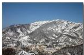
Savignone: panorama invernale con neve

Guido Marcheselli - Canon EOS 300D 2009 - Inverno - Savignone - Altro