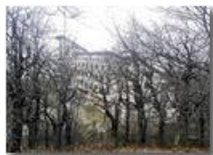
Colonia di Montemaggio tra nebbia e boschi spogli

Pietro Marcheselli - HTC One S Nokia C7-00 (o altro cell) 2018 - Inverno - Savignone - Boschi