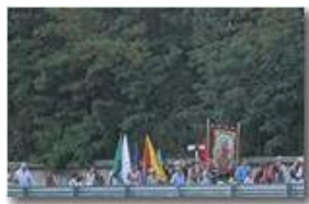
Tradizionale processione festa NS di Lourdes

Pietro Marcheselli - Altro/Other 2013 - Estate - Savignone - Altro