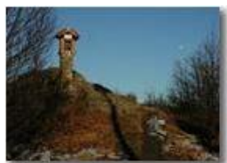
Inverno 2004 sul M. Maggio

Pietro Marcheselli - Olympus Camedia 3000 2004 - Inverno - Savignone - Panorami