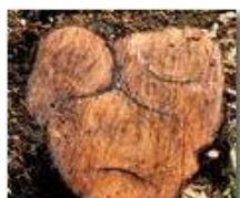
Il taglio del nocciolo: sindone sofferente

Pietro Marcheselli - Canon EOS 300D 2010 - Estate - Savignone - Fiori&Fauna