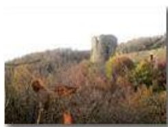
Un nuovo autunno è arrivato: castello Fieschi

Pietro Marcheselli - Canon Ixus 980 IS 2012 - Inverno - Savignone - Altro