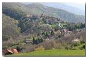
Ritorna la primavera al santuario Madonna della Vittoria

Pietro Marcheselli - Canon EOS 300D 2006 - Estate - Savignone - Paesi