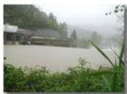
Fiume Scrivia 4-5-2002

Guido Marcheselli - Olympus Camedia 3000 2002 - Estate - Savignone - Paesi