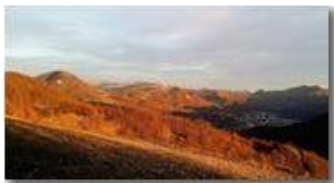
Tramonto su Casella e Monti circostanti

Pietro Marcheselli - Canon Ixus 980 IS 2017 - Inverno - Savignone - Boschi