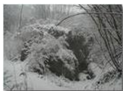
Savignone: nei boschi di Piambertone nella neve

Pietro Marcheselli - Olympus Camedia 3000 2005 - Inverno - Savignone - Altro