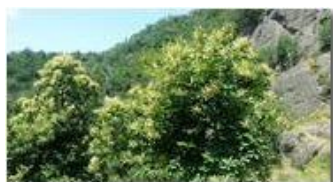
Castagni in fiore

Pietro Marcheselli - Altro/Other 2017 - Estate - Savignone - Boschi