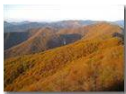
Monte Maggio: Autunno 2013

Pietro Marcheselli - Canon EOS 300D 2014 - Inverno - Savignone - Panorami