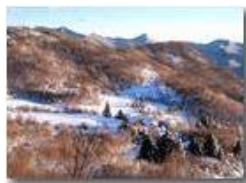
Montemaggio: le case di Inastrà

Pietro Marcheselli - Canon Ixus 980 IS 2013 - Inverno - Savignone - Paesi