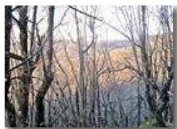
Ninte mi so de ciù triste de un bosco secco d'inverno...

Pietro Marcheselli - Canon Ixus 980 IS 2015 - Inverno - Savignone - Panorami