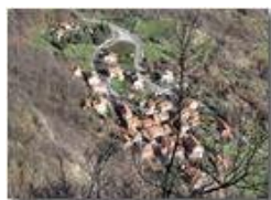
Sorrivi: frazione di Savignone

Pietro Marcheselli - Canon Ixus 980 IS 2010 - Inverno - Savignone - Panorami