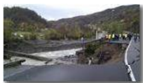
Crollo diga e strada provinciale a Ponte di Savignone: la voragine nella strada (foto di F.Medica)

Guido Marcheselli - Canon EOS 300D 2012 - Inverno - Savignone - Paesi