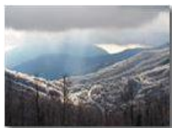
Neve, Galaverna e giudizio divino su Orero

Olympus OM-D E-M10 Mark III 2020 - Inverno - Savignone - Panorami