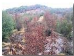
Ancora in attesa della pioggia

Pietro Marcheselli - Canon EOS 300D 2012 - Estate - Savignone - Altro