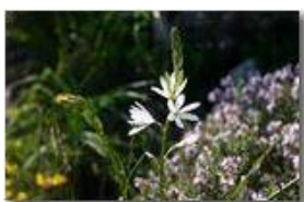
Per la serie, fiori di campo: un giglio di monte in fioritura

Pietro Marcheselli - Canon EOS 300D 2006 - Estate - Savignone - Fiori&Fauna