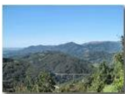
Valpolcevera: autostrade e Santuario Madonna della Guardia

Pietro Marcheselli - Canon Ixus 980 IS 2011 - Estate - Savignone - Panorami