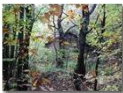
Autunno a Case Crosi - Savignone

Pietro Marcheselli - Olympus Camedia 3000 2005 - Inverno - Savignone - Boschi