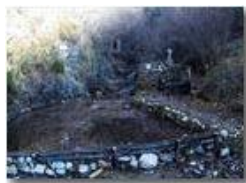
Un angolo di preghiera

Pietro Marcheselli - Altro/Other 2013 - Inverno - Savignone - Altro