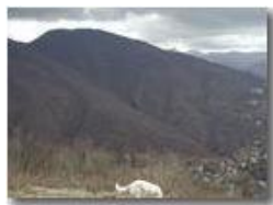
Nubi minacciose su M. Maggio

Pietro Marcheselli - Olympus Camedia 3000 2002 - Inverno - Savignone - Panorami