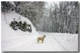
2007: niente neve. Qui un cane delle nevi... dell'anno precedente

Pietro Marcheselli - Canon EOS 300D 2007 - Inverno - Savignone - Altro