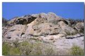
Le rocce precarie del Monte Maggio

Pietro Marcheselli - Canon EOS 300D 2010 - Estate - Savignone - Altro