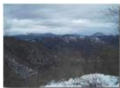
Dal Monte Alpe al Monte Reale

Pietro Marcheselli - Canon Ixus 980 IS 2014 - Inverno - Savignone - Panorami