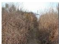
Invasione di rovi sulla vetta del M. Vittoria

Pietro Marcheselli - Olympus Camedia 3000 2002 - Inverno - Savignone - Panorami