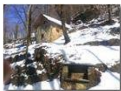
Neve di Marzo: nei boschi di Savignone

Pietro Marcheselli - HTC One S Nokia C7-00 (o altro cell) 2018 - Inverno - Savignone - Boschi