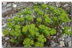
Euphorbia helioscopia nel greto del fiume

Pietro Marcheselli - Canon EOS 300D 2008 - Estate - Savignone - Fiori&Fauna