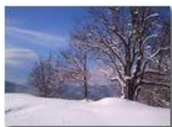
Salendo al Monte Pianetto

Pietro Marcheselli - Canon Ixus 980 IS 2013 - Inverno - Savignone - Altro