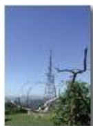
Incroci d'antenne a Monte Maggio

Pietro Marcheselli - Olympus Camedia 3000 <2001 - Estate - Savignone - Fiori&Fauna