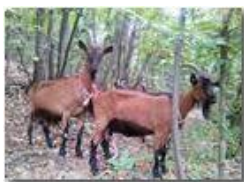
Le capre di Salvega

Pietro Marcheselli - Canon Ixus 980 IS 2011 - Estate - Savignone - Fiori&Fauna