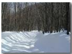
Costalovaia: una strada inenvata nel bosco

Pietro Marcheselli - Olympus Camedia 3000 2005 - Inverno - Savignone - Paesi