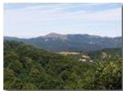
Monte Alpe del Porale

Pietro Marcheselli - Canon Ixus 980 IS 2016 - Estate - Savignone - Panorami