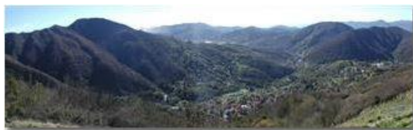
Panorama dal M. Pianetto

Pietro Marcheselli - Olympus Camedia 3000 2003 - Inverno - Savignone - Fiori&Fauna