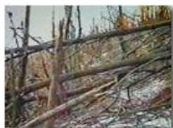
Il bosco dopo la galaverna (da vhs)

Pietro Marcheselli - Olympus Camedia 3000 2002 - Inverno - Savignone - Boschi