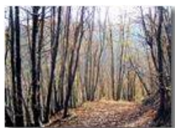
Autunno 2010: percorsi nel bosco

Pietro Marcheselli - Canon EOS 300D 2011 - Inverno - Savignone - Boschi