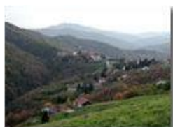
La frazione Vittoria di Savignone sullo spartiacque padano-tirrenico (in lontananza i Forti di Genova, Diamante e Estello, Mirage)

Pietro Marcheselli - Olympus Camedia 3000 2002 - Inverno - Savignone - Panorami