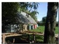
Ovile sulle pendici del M. Pianetto (Savignone)

Pietro Marcheselli - Olympus Camedia 3000 <2001 - Estate - Savignone - Panorami