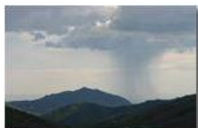
Nuvola di Fantozzi tra Orero e Genova

Guido Marcheselli - Canon EOS 300D 2014 - Estate - Savignone - Paesi