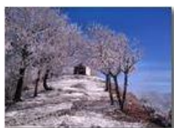
Inverno sul Monte Pianetto

Pietro Marcheselli - Canon Ixus 980 IS 2011 - Inverno - Savignone - Altro