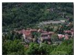
La piazza di Savignone dal Pianetto

Pietro Marcheselli - Olympus Camedia 3000 <2001 - Estate - Savignone - Paesi