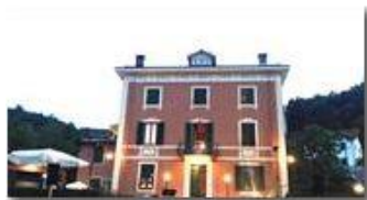
Lunedì musicali a Villa Pavanetto

Pietro Marcheselli - Altro/Other 2017 - Estate - Savignone - Panorami