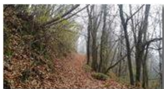
Sentieri in autunno

Pietro Marcheselli - Altro/Other 2017 - Inverno - Savignone - Boschi