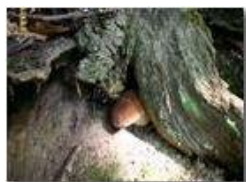
Fungo porcino che gioca a nascondino

Pietro Marcheselli - Canon EOS 300D 2005 - Estate - Savignone - Fiori&Fauna