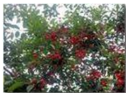
Le mie amarene

Pietro Marcheselli - Altro/Other 2016 - Estate - Savignone - Altro