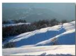
I prati di Maggetta

Pietro Marcheselli - Canon Ixus 980 IS 2013 - Inverno - Savignone - Panorami