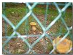
Funghi in giardino

Pietro Marcheselli - Canon EOS 300D 2005 - Estate - Savignone - Fiori&Fauna