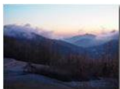
Tramonto con nevischio e nebbie da Montemaggio

Guido Marcheselli - Olympus OM-D E-M10 Mark III 2020 - Inverno - Savignone - Panorami