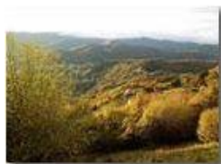
Pendici M. Cappellino: Passo dei Giovi

Pietro Marcheselli - HTC One S Nokia C7-00 (o altro cell) 2018 - Inverno - Savignone - Panorami