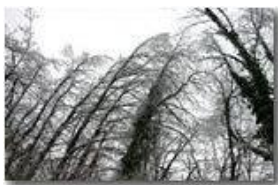
Alberi curvi per il gelo

Guido Marcheselli - Olympus Camedia 3000 2006 - Inverno - Savignone - Paesi