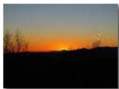
Tramonto da frazione Montemaggio

Guido Marcheselli - Olympus OM-D E-M10 Mark III 2019 - Inverno - Savignone - Panorami