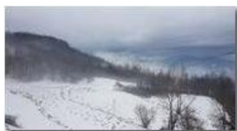
Neve che evapora a Montemaggio

Pietro Marcheselli - Canon Ixus 980 IS 2018 - Inverno - Savignone - Altro