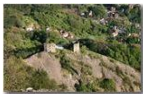
Le rovine del castello Fieschi (sec.XIII)

Pietro Marcheselli - Canon EOS 300D 2009 - Estate - Savignone - Paesi