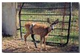
Capriolo con zampa fratturata e ferita da taglio, dopo le cure

Pietro Marcheselli - Canon EOS 300D 2009 - Estate - Savignone - Fiori&Fauna