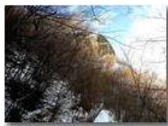
Neve di Maro: nella valle del Rio Maggione

Pietro Marcheselli - HTC One S Nokia C7-00 (o altro cell) 2018 - Inverno - Savignone - Paesi