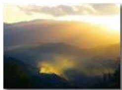
Controluce in Val Polcevera

Pietro Marcheselli - Altro/Other 2017 - Inverno - Savignone - Panorami