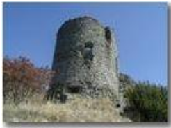
Savignone: ruderi del Castello Fieschi

Pietro Marcheselli - Olympus Camedia 3000 <2001 - Estate - Savignone - Paesi