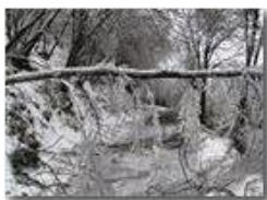
La gelata del 22 dicembre

Pietro Marcheselli - Canon Ixus 980 IS 2010 - Inverno - Savignone - Boschi