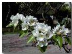
I fiori del pero

Pietro Marcheselli - Olympus Camedia 3000 2002 - Estate - Savignone - Fiori&Fauna