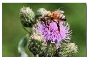
Ape su fiore di cardo

Pietro Marcheselli - Canon EOS 300D 2009 - Estate - Savignone - Fiori&Fauna