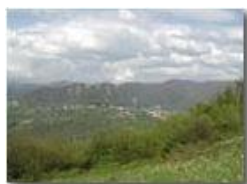
Savignone e la frazione Gabbie ai piedi del Pianetto dal M. Capellino

Pietro Marcheselli - Olympus Camedia 3000 <2001 - Estate - Savignone - Fiori&Fauna