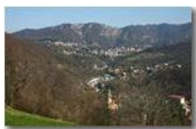
Savignone e la frazione Ponte

Pietro Marcheselli - Canon EOS 300D 2007 - Estate - Savignone - Paesi