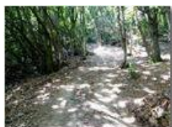
Passaggio tra Monte Fuea e Monte Vittoria

Pietro Marcheselli - Altro/Other 2017 - Estate - Savignone - Panorami