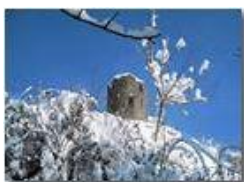
Castello Fieschi: il torrione di guardia

Pietro Marcheselli - Canon Ixus 980 IS 2012 - Inverno - Savignone - Altro