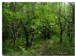
Il bosco di casa

Guido Marcheselli - Olympus Camedia 3000 <2001 - Estate - Savignone - Boschi