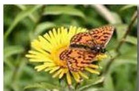
Farfalla argynnis paphia su inula

Pietro Marcheselli - Canon EOS 300D 2009 - Estate - Savignone - Fiori&Fauna