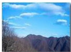
Panorama di fine inverno

Pietro Marcheselli - Altro/Other 2013 - Inverno - Savignone - Boschi