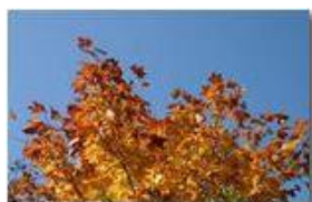
Colori di autunno: un acero

Pietro Marcheselli - Canon EOS 300D 2006 - Inverno - Savignone - Fiori&Fauna