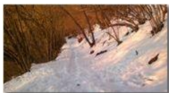
Scendendo nella neve da Montemaggio, al tramonto

Guido Marcheselli - Nokia C7-00 (o altro Smartphone) 2013 - Inverno - Savignone - Boschi