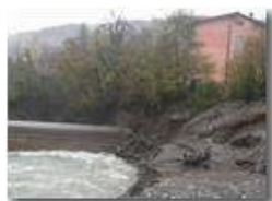
Crollo diga e strada provinciale a Ponte di Savignone: rive franose

Guido Marcheselli - Canon EOS 300D 2012 - Inverno - Savignone - Paesi