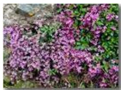
Cuscinetto di silene rupestris

Pietro Marcheselli - HTC One S Nokia C7-00 (o altro cell) 2018 - Estate - Savignone - Fiori&Fauna