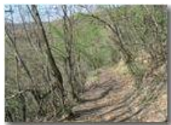
Sentiero nel bosco ad inizio primavera

Pietro Marcheselli - Canon Ixus 980 IS 2011 - Estate - Savignone - Boschi