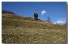
Il ginepro solitario

Pietro Marcheselli - Canon EOS 300D 2009 - Inverno - Savignone - Fiori&Fauna