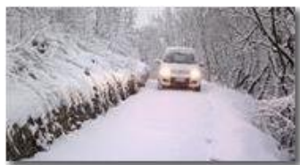
Panda (4x4) delle nevi tra Inastrà e Chiapazza

Guido Marcheselli - Nokia C7-00 (o altro Smartphone) 2013 - Inverno - Savignone - Boschi