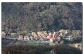
Frazione Ponte di Savignone

Pietro Marcheselli - Canon EOS 300D 2008 - Inverno - Savignone - Paesi