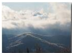
Galaverna e mare di nebbie verso Genova

Olympus OM-D E-M10 Mark III 2020 - Inverno - Savignone - Panorami