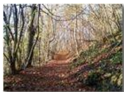
Sentieri in autunno

Pietro Marcheselli - Altro/Other 2017 - Inverno - Savignone - Boschi