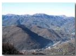
Frazione Ponte di Savignone

Pietro Marcheselli - Canon Ixus 980 IS 2010 - Inverno - Savignone - Panorami