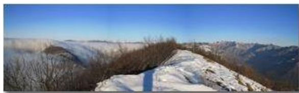
Panorama dal monte Maggio

Pietro Marcheselli - Canon Ixus 980 IS 2010 - Inverno - Savignone - Panorami