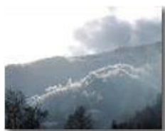
Neve e galaverna sopra a San Bartolomeo di Vallecaldà

Guido Marcheselli - Olympus Camedia 3000 2006 - Inverno - Savignone - Panorami