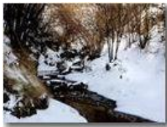
Neve di Marzo: rio Maggione

Pietro Marcheselli - HTC One S Nokia C7-00 (o altro cell) 2018 - Inverno - Savignone - Boschi