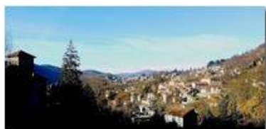
Veduta di Savignone da est

Pietro Marcheselli - HTC One S Nokia C7-00 (o altro cell) 2019 - Inverno - Savignone - Panorami