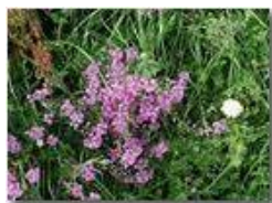
Infiorescenze di poligala

Pietro Marcheselli - Olympus Camedia 3000 2004 - Estate - Savignone - Fiori&Fauna