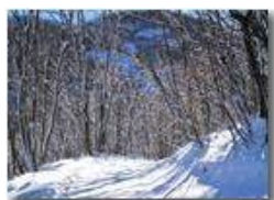
Neve di novembre

Pietro Marcheselli - Canon Ixus 980 IS 2011 - Inverno - Savignone - Boschi