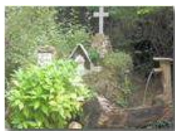
Rio Maggione: Angolo di preghiera

Guido Marcheselli - Canon EOS 300D 2012 - Inverno - Savignone - Altro