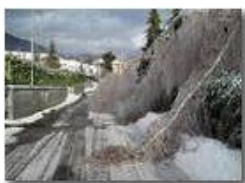
La gelata del 22 dicembre

Pietro Marcheselli - Canon Ixus 980 IS 2010 - Inverno - Savignone - Panorami