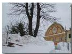
Neve di primavera alla Vittoria

Pietro Marcheselli - Canon Ixus 980 IS 2013 - Inverno - Savignone - Paesi