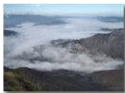
Lingue di nebbia dalla pianura padana

Pietro Marcheselli - Canon EOS 300D 2009 - Estate - Savignone - Panorami