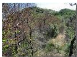
Sul crinale NW del Monte Pianetto

Pietro Marcheselli - Canon Ixus 980 IS 2012 - Estate - Savignone - Boschi