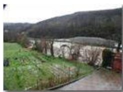
Piena del fiume Scrivia del 26-11

Guido Marcheselli - Olympus Camedia 3000 2003 - Inverno - Savignone - Altro