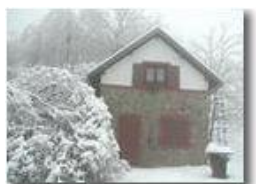
Alberi innevati pronti per la galaverna

Olympus Camedia 3000 2004 - Inverno - Savignone - Boschi