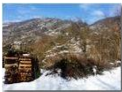
Neve di Marzo: Monte Pianetto

Pietro Marcheselli - HTC One S Nokia C7-00 (o altro cell) 2018 - Inverno - Savignone - Panorami