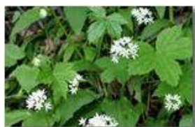
Fiori di Allium ursinum

Pietro Marcheselli - Canon Ixus 980 IS 2010 - Estate - Savignone - Fiori&Fauna