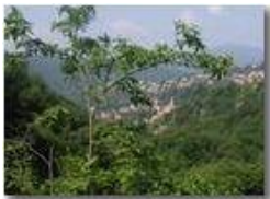
Savignone immerso nel verde dei boschi da Piambertone

Pietro Marcheselli - Olympus Camedia 3000 <2001 - Estate - Savignone - Fiori&Fauna