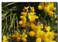
Ragnetto su fiori di coronilla

Pietro Marcheselli - Panasonic nv-gs70 (VideoCam) 2004 - Estate - Savignone - Fiori&Fauna