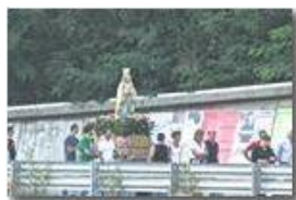
Tradizionale processione fesa NS di Lourdes

Pietro Marcheselli - Nokia C7-00 (o altro Smartphone) 2013 - Estate - Savignone - Panorami