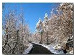
Montemaggio: la strada della Colonia

Pietro Marcheselli - Canon EOS 300D 2013 - Inverno - Savignone - Paesi