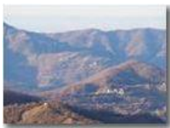
La cappelletta del Pianetto, frazioni Olivieri (Busalla) e Giacoboni (Ronco Scrivia)

Guido Marcheselli - Olympus OM-D E-M10 Mark III 2019 - Inverno - Savignone - Panorami