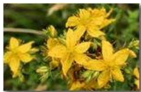
Fiore di Iperico

Pietro Marcheselli - Canon EOS 300D 2009 - Estate - Savignone - Fiori&Fauna