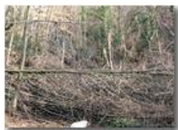
Effetto galaverna: transito vietato

Pietro Marcheselli - Canon EOS 300D 2011 - Inverno - Savignone - Panorami