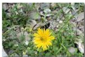
Insetti su inula

Guido Marcheselli - HTC One S Nokia C7-00 (o altro cell) 2014 - Estate - Savignone - Panorami