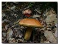
Boletus luridus e boletus satana (tossici)

Pietro Marcheselli - Canon EOS 300D 2005 - Estate - Savignone - Fiori&Fauna