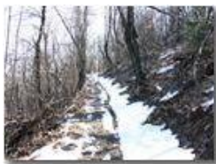
Neve di marzo sul M. Pianetto

Pietro Marcheselli - Olympus Camedia 3000 2005 - Inverno - Savignone - Boschi