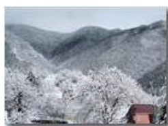
Un po' di colore nel paesaggio

Pietro Marcheselli - Canon EOS 300D 2013 - Inverno - Savignone - Altro