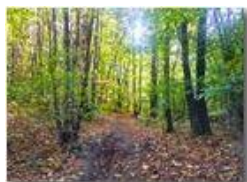
Sentieri in autunno

Pietro Marcheselli - Altro/Other 2017 - Inverno - Savignone - Panorami