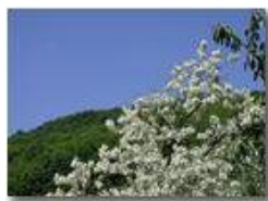
Fioritura di robinia pseudoacacia

Pietro Marcheselli - Olympus Camedia 3000 2004 - Estate - Savignone - Fiori&Fauna