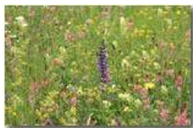
Prati di maggio: una tavolozza di colori

Pietro Marcheselli - Canon EOS 300D 2005 - Estate - Savignone - Fiori&Fauna