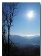
Mar ligure dal sentiero che scende da Monte Maggio

Pietro Marcheselli - HTC One S Nokia C7-00 (o altro cell) 2020 - Estate - Savignone - Panorami