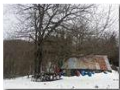
Neve di Marzo: salendo al monte Pianetto

Pietro Marcheselli - HTC One S Nokia C7-00 (o altro cell) 2018 - Inverno - Savignone - Boschi