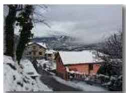
Inverno al Prelo

Pietro Marcheselli - HTC One S Nokia C7-00 (o altro cell) 2019 - Inverno - Savignone - Panorami