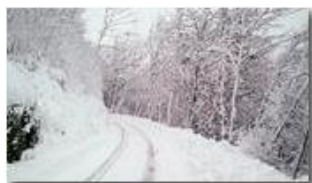
Stradina in bianco

Guido Marcheselli - Canon EOS 300D 2012 - Inverno - Savignone - Paesi