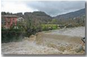
Dicembre 2006: Fiume Scrivia nel tardo autunno

Pietro Marcheselli - Altro/Other 2007 - Inverno - Savignone - Boschi