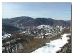
Una rara nevicata nel 2002

Pietro Marcheselli - Olympus Camedia 3000 2002 - Inverno - Savignone - Boschi