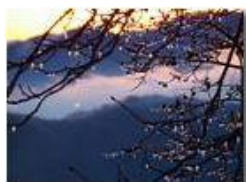
Galaverna al tramonto

Guido Marcheselli - Olympus OM-D E-M10 Mark III 2020 - Inverno - Savignone - Paesi