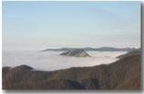
Un'isola nel mare di nebbia: il Monte Rocche del Reopasso

Pietro Marcheselli - Canon EOS 300D 2006 - Inverno - Savignone - Panorami