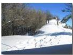
Neve sul monte Pianetto

Pietro Marcheselli - Canon Ixus 980 IS 2010 - Inverno - Savignone - Panorami