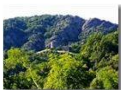
Castello Fieschi e Monte Pianetto

Pietro Marcheselli - HTC One S Nokia C7-00 (o altro cell) 2018 - Estate - Savignone - Panorami