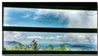
Colonia Montemaggio: camera con vista

Pietro Marcheselli - Altro/Other 2014 - Estate - Savignone - Panorami