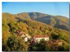
Colori d'autunno nei boschi di Savignone

Pietro Marcheselli - Canon Ixus 980 IS 2018 - Inverno - Savignone - Boschi