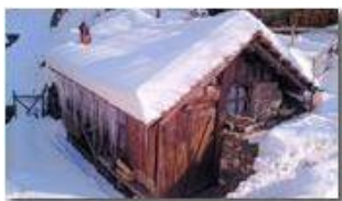
Residenza protetta per caprette

Pietro Marcheselli - Canon EOS 300D 2012 - Inverno - Savignone - Altro