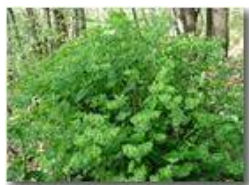
Euforbia delle faggete

Pietro Marcheselli - Olympus Camedia 3000 2002 - Estate - Savignone - Fiori&Fauna