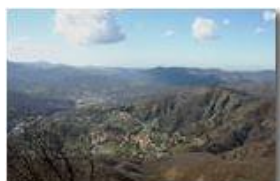
Una rara giornata di sole nel mese di marzo

Pietro Marcheselli - Panasonic nv-gs70 (VideoCam) 2006 - Inverno - Savignone - Panorami