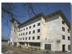
La ex colonia di Montemaggio

Pietro Marcheselli - Olympus Camedia 3000 2005 - Inverno - Savignone - Panorami