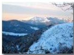
Monte Alpe al tramonto

Pietro Marcheselli - Canon Ixus 980 IS 2013 - Inverno - Savignone - Altro