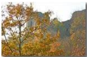
Castello Fieschi: un po' di colore sul grigio dei ruderi

Pietro Marcheselli - Canon EOS 300D 2007 - Inverno - Savignone - Boschi