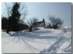
La chiesetta di Costalovaia ricoperta di neve

Pietro Marcheselli - Olympus Camedia 3000 2005 - Inverno - Savignone - Paesi