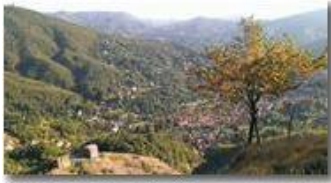
Castello e Savignone dal Pianetto

Guido Marcheselli - Nokia C7-00 (o altro Smartphone) 2014 - Inverno - Savignone - Paesi