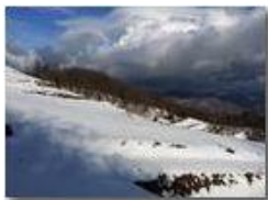
Neve di Marzo: i prati del Monte Cappellino

Pietro Marcheselli - HTC One S Nokia C7-00 (o altro cell) 2018 - Inverno - Savignone - Boschi