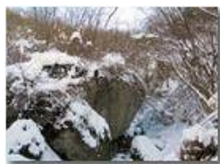
Resti di antiche frane in Piambertone

Pietro Marcheselli - Canon Ixus 980 IS 2012 - Inverno - Savignone - Boschi