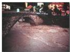
Fiume Scrivia in piena a Ponte di Savignone

Pietro Marcheselli - Olympus Camedia 3000 2003 - Inverno - Savignone - Fiori&Fauna