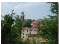
Il santuario della Vittoria

Pietro Marcheselli - Olympus Camedia 3000 <2001 - Estate - Savignone - Panorami