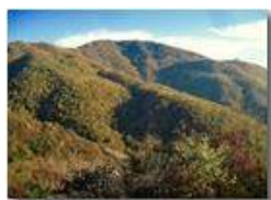
Colori d'autunno nei boschi di Savignone

Pietro Marcheselli - Canon Ixus 980 IS 2018 - Inverno - Savignone - Boschi