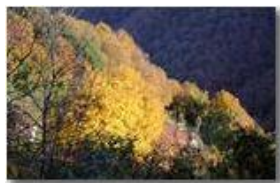
Pennellata di luce al tramonto

Pietro Marcheselli - Canon EOS 300D 2008 - Inverno - Savignone - Paesi