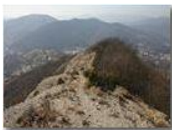
Sul conglomerato del M. Pianetto

Pietro Marcheselli - Olympus Camedia 3000 2005 - Inverno - Savignone - Paesi