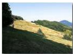
Estate sul Monte Cappellino

Pietro Marcheselli - Canon Ixus 980 IS 2015 - Estate - Savignone - Altro