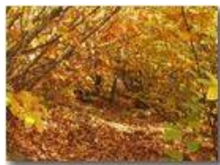
Interno di bosco in autunno

Pietro Marcheselli - Panasonic nv-gs70 (VideoCam) 2005 - Inverno - Savignone - Boschi