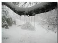
Neve e galaverna

Pietro Marcheselli - Olympus Camedia 3000 2004 - Inverno - Savignone - Boschi