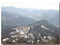
Ultima neve di marzo!

Pietro Marcheselli - Olympus Camedia 3000 2005 - Inverno - Savignone - Panorami