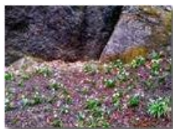
Fioritura di leucojum vernum

Pietro Marcheselli - HTC One S Nokia C7-00 (o altro cell) 2018 - Estate - Savignone - Fiori&Fauna