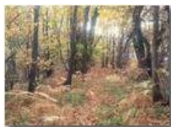
Bosco in autunno

Pietro Marcheselli - HTC One S Nokia C7-00 (o altro cell) 2018 - Inverno - Savignone - Boschi