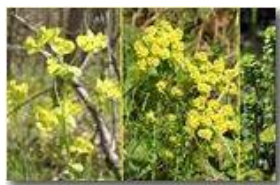
Tre diffusissime euphorbie : amigdaloides, cyparissias, helioscopica

Pietro Marcheselli - Canon EOS 300D 2008 - Estate - Savignone - Panorami