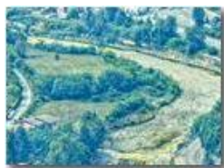
Scrvia in secca a San Bartolomeo

Pietro Marcheselli - Canon Ixus 980 IS 2016 - Estate - Savignone - Paesi