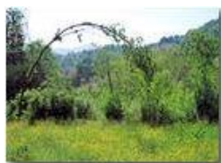
Prato di ranuncoli

Pietro Marcheselli - Canon Ixus 980 IS 2010 - Estate - Savignone - Fiori&Fauna