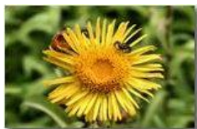
Ragno su inula

Pietro Marcheselli - Canon EOS 300D 2009 - Estate - Savignone - Fiori&Fauna