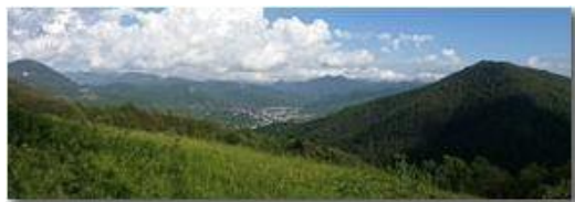
Casella: sullo sfondo la Catena dei Monti Liguri

Pietro Marcheselli - HTC One S Nokia C7-00 (o altro cell) 2020 - Estate - Savignone - Panorami