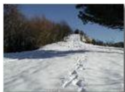
La cappelletta del M. Pianetto di Savignone innevata

Pietro Marcheselli - Olympus Camedia 3000 2003 - Inverno - Savignone - Panorami