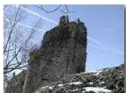
Ruderi del Castello Fieschi con neve

Pietro Marcheselli - Olympus Camedia 3000 2002 - Inverno - Savignone - Panorami