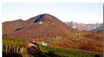
Tramonto autunnale sul Monte Maggio

Pietro Marcheselli - Canon Ixus 980 IS 2016 - Inverno - Savignone - Panorami