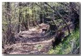
Incontro con giovane daino incuriosito nei boschi di Savignone

Pietro Marcheselli - HTC One S Nokia C7-00 (o altro cell) 2018 - Estate - Savignone - Fiori&Fauna