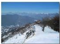
Salendo al Monte Pianetto

Pietro Marcheselli - Canon Ixus 980 IS 2012 - Inverno - Savignone - Altro