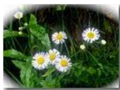
Cespica annua (Erigeron annuus)

Pietro Marcheselli - Altro/Other 2015 - Estate - Savignone - Fiori&Fauna