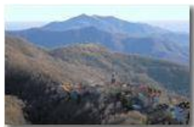
Frazione La Vittoria: sullo sfondo i Forti di Genova

Pietro Marcheselli - Canon EOS 300D 2009 - Inverno - Savignone - Panorami