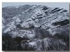
Ancora M. Pianetto spolverato di neve

Guido Marcheselli - Olympus Camedia 3000 2004 - Inverno - Savignone - Boschi