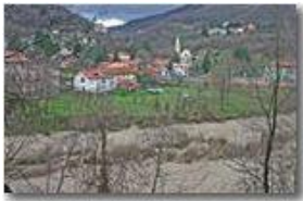
Fiume Scrivia a San Bartolomeo dopo le piogge autunnali

Pietro Marcheselli - Canon EOS 300D 2007 - Inverno - Savignone - Altro