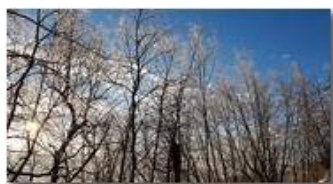
Ghiaccio, galaverna o gelicidio?

Guido Marcheselli - HTC One S Nokia C7-00 (o altro cell) 2018 - Inverno - Savignone - Panorami