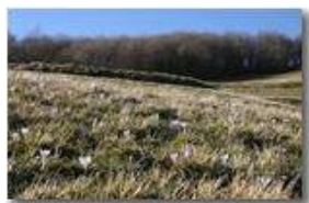
Preannuncio di primavera: i crochi

Pietro Marcheselli - Canon EOS 300D 2009 - Inverno - Savignone - Boschi