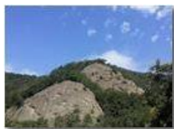
Boschi e conglomerato

Canon Ixus 980 IS 2014 - Estate - Savignone - Altro