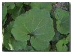
Le grandi foglie di una gunnera

Pietro Marcheselli - Canon Ixus 980 IS 2014 - Estate - Savignone - Fiori&Fauna