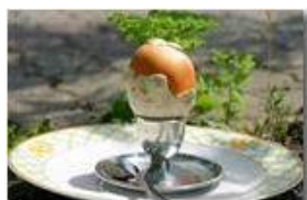
L amanita è servita! Fungo amanita cesarea, ovulo buono

Pietro Marcheselli - Canon EOS 300D 2008 - Estate - Savignone - Paesi