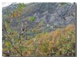
Ancora ruderi del Castello Fieschi di Savignone incorniciati dai tenui colori autunnali

Pietro Marcheselli - Olympus Camedia 3000 2002 - Inverno - Savignone - Fiori&Fauna