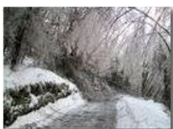
La galaverna del 22 dicembre

Pietro Marcheselli - Canon Ixus 980 IS 2010 - Inverno - Savignone - Panorami