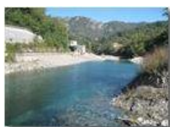
Il lago rinnovato

Pietro Marcheselli - Canon Ixus 980 IS 2012 - Estate - Savignone - Altro