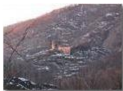
Luce al tramonto

Pietro Marcheselli - Canon Ixus 980 IS 2013 - Inverno - Savignone - Panorami