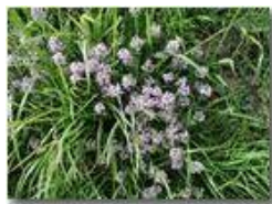
Variet di timo serpillio

Pietro Marcheselli - Olympus Camedia 3000 2004 - Estate - Savignone - Fiori&Fauna