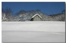
Il bianco mantello: neve

Pietro Marcheselli - Canon EOS 300D 2009 - Inverno - Savignone - Paesi