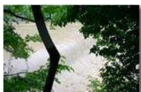
Giugno 2008: fiume Scrivia dopo le abbondanti precipitazioni

Pietro Marcheselli - Canon EOS 300D 2008 - Estate - Savignone - Altro