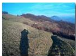
L'ombra: autoritratto del fotografo

Pietro Marcheselli - HTC One S Nokia C7-00 (o altro cell) 2013 - Inverno - Savignone - Altro