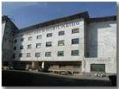
La colonia di Montemaggio (abbandonata): esempio di architettura moderna degli anni '30

Olympus Camedia 3000 <2001 - Estate - Savignone - Paesi