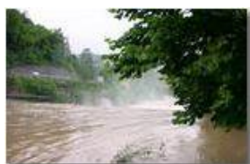
Giugno 2008: dopo le abbondanti precipitazioni

Pietro Marcheselli - Canon EOS 300D 2008 - Estate - Savignone - Fiori&Fauna