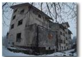
Colonia abbandonata: versante nor

Pietro Marcheselli - Canon Ixus 980 IS 2015 - Inverno - Savignone - Boschi