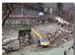
Lavori di consolidamento argine Scriveria, a Ponte di Savignone

Pietro Marcheselli - Altro/Other 2017 - Inverno - Savignone - Panorami