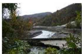
Crollo diga e strada provinciale a Ponte di Savignone

Guido Marcheselli - Canon Ixus 980 IS 2012 - Inverno - Savignone - Paesi