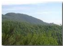
Monte Maggio e Colonia visti da nord

Pietro Marcheselli - Olympus Camedia 3000 2002 - Estate - Savignone - Fiori&Fauna