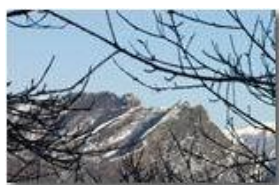
Monte Reo Passo con neve: Biurca e Carrega du Diaou

Pietro Marcheselli - Canon EOS 300D 2006 - Inverno - Savignone - Boschi