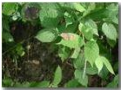
Esemplari di farfalla variet pararge

Pietro Marcheselli - Olympus Camedia 3000 <2001 - Estate - Savignone - Paesi