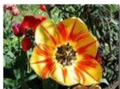
Fantasia di tulipano

Pietro Marcheselli - Olympus Camedia 3000 2002 - Estate - Savignone - Panorami