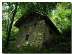
Cascina abbandonata nei boschi

Pietro Marcheselli - Olympus Camedia 3000 <2001 - Estate - Savignone - Paesi