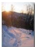
Piambertone: ultimi raggi

Pietro Marcheselli - Canon Ixus 980 IS 2012 - Inverno - Savignone - Boschi