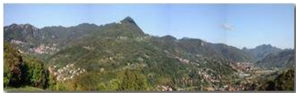
Autunno 2007: La Valle Scrivia da Savignone a Casella

Pietro Marcheselli - Canon EOS 300D 2008 - Inverno - Savignone - Panorami