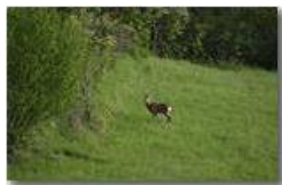
Daino al pascolo nei prati di Chiappazza (Montemaggio)

Guido Marcheselli - Canon EOS 300D 2014 - Estate - Savignone - Fiori&Fauna