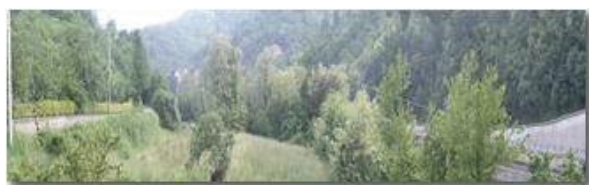
Visuale a 160 gradi dalla finestra del mio soggiorno (Savignone)

Pietro Marcheselli - Scanner <2001 - Inverno - Savignone - Paesi