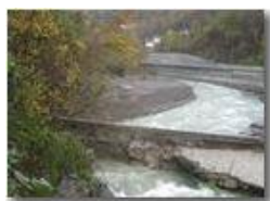
Crollo diga e strada provinciale a Ponte di Savignone: la nuova configurazione

Guido Marcheselli - Canon EOS 300D 2012 - Inverno - Savignone - Paesi