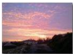
Frazione Vittoria: luci del tramonto

Pietro Marcheselli - Canon Ixus 980 IS 2011 - Inverno - Savignone - Panorami