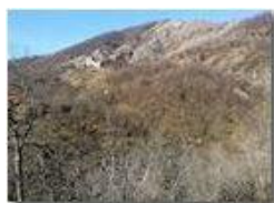
Ruderi castello Fieschi e conglomerato di Savignone

Pietro Marcheselli - Olympus OM-D E-M10 Mark III 2019 - Inverno - Savignone - Panorami