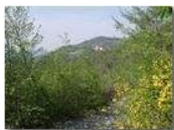
Località la Vittoria

Pietro Marcheselli - Olympus Camedia 3000 2002 - Estate - Savignone - Fiori&Fauna