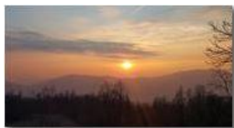
Tramonto verso Genova, da Montemaggio

Guido Marcheselli - HTC One S Nokia C7-00 (o altro cell) 2016 - Inverno - Savignone - Panorami