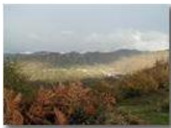
Luci e ombre su Savignone

Pietro Marcheselli - Olympus Camedia 3000 2005 - Inverno - Savignone - Panorami