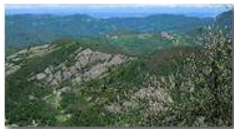
Dal M. Maggio alle Alpi

Pietro Marcheselli - Canon Ixus 980 IS 2014 - Estate - Savignone - Panorami