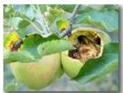
Le mie mele (e dei vesponi)

Pietro Marcheselli - Canon Ixus 980 IS 2016 - Estate - Savignone - Fiori&Fauna