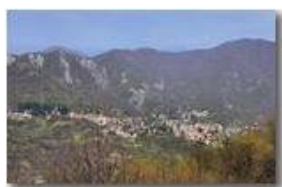
Variazioni stagionali: Savignone (marzo)

Pietro Marcheselli - Canon EOS 300D 2007 - Estate - Savignone - Paesi