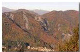
Autunno in Savignone 3

Pietro Marcheselli - Canon EOS 300D 2008 - Inverno - Savignone - Paesi