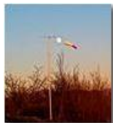
La manica a... luna

Pietro Marcheselli - Canon Ixus 980 IS 2014 - Inverno - Savignone - Panorami