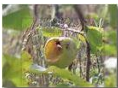
Il pasto di una vespa crabro

Pietro Marcheselli - Webcam 2011 - Estate - Savignone - Panorami