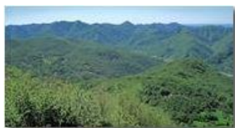
Boschi di Valle Scrivia

Pietro Marcheselli - Canon Ixus 980 IS 2014 - Estate - Savignone - Panorami