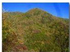
Colori d'autunno nei boschi di Savignone

Pietro Marcheselli - Canon Ixus 980 IS 2018 - Inverno - Savignone - Boschi