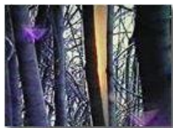
I danni della galaverna (1997): da vhs

Pietro Marcheselli - Olympus Camedia 3000 2002 - Inverno - Savignone - Boschi