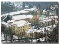
Savignone paese: veduta invernale

Pietro Marcheselli - Canon Ixus 980 IS 2010 - Inverno - Savignone - Paesi