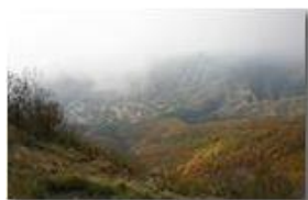
Savignone dal Monte Maggio: aut. 2005

Pietro Marcheselli - Canon EOS 300D 2006 - Inverno - Savignone - Fiori&Fauna