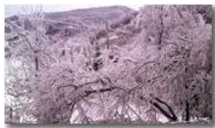
L'inchino del pesco

Pietro Marcheselli - Altro/Other 2013 - Estate - Savignone - Altro