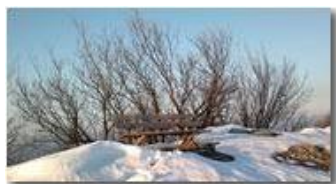
Panchina con neve sulla vetta di Montemaggio

Guido Marcheselli - Nokia C7-00 (o altro Smartphone) 2013 - Inverno - Savignone - Boschi