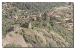
Ruderi del Castello Fieschi e il borgo di Savignone

Pietro Marcheselli - Olympus Camedia 3000 <2001 - Estate - Savignone - Paesi