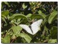
Una aporia crataegis ad ali aperte

Pietro Marcheselli - Olympus Camedia 3000 2004 - Estate - Savignone - Fiori&Fauna