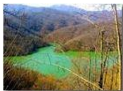
Il lago Busalietta finalmente colmo dopo le piogge di fine inverno

Pietro Marcheselli - Canon Ixus 980 IS 2016 - Inverno - Savignone - Panorami