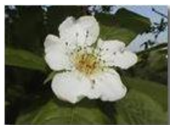
Fiore di nespolo selvatico

Pietro Marcheselli - Panasonic nv-gs70 (VideoCam) 2004 - Estate - Savignone - Paesi