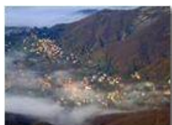
Savignone: Nebbia in diradamento

Pietro Marcheselli - Canon Ixus 980 IS 2010 - Inverno - Savignone - Panorami