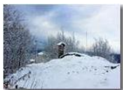
E' ritornata la neve

Pietro Marcheselli - Canon Ixus 980 IS 2015 - Inverno - Savignone - Panorami