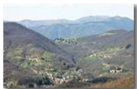
Savignone: le frazioni San Bartolomeo, Cerisola, Cereta, Vallecaldà e Vittoria

Pietro Marcheselli - Canon EOS 300D 2007 - Estate - Savignone - Panorami