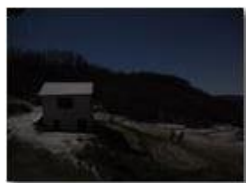
Spruzzata di neve sulla stalla - notturno

Guido Marcheselli - Olympus OM-D E-M10 Mark III 2020 - Inverno - Savignone - Panorami