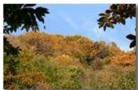
Autunno nei boschi di Savignone

Pietro Marcheselli - Canon EOS 300D 2009 - Inverno - Savignone - Altro