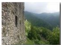
Mura del Castello Fieschi

Pietro Marcheselli - HTC One S Nokia C7-00 (o altro cell) 2018 - Estate - Savignone - Paesi