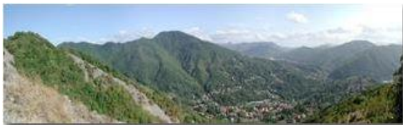
Savignone tra M. Pianetto e M. Maggio

Pietro Marcheselli - Olympus Camedia 3000 2003 - Estate - Savignone - Panorami