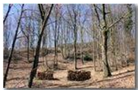
I boschi luminosi a fine inverno

Pietro Marcheselli - Canon EOS 300D 2008 - Inverno - Savignone - Boschi