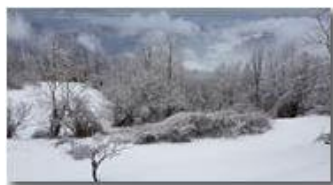
Risveglio innevato, 3 marzo 2018

Guido Marcheselli - HTC One S Nokia C7-00 (o altro cell) 2018 - Inverno - Savignone - Panorami