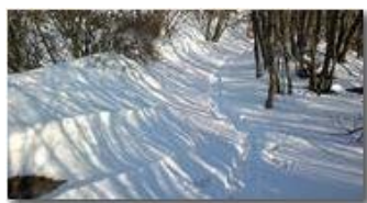
Boschi salendo a Montemaggio

Guido Marcheselli - Nokia C7-00 (o altro Smartphone) 2013 - Inverno - Savignone - Boschi