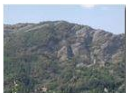
Siccità a Savignone

Pietro Marcheselli - Olympus Camedia 3000 2003 - Inverno - Savignone - Boschi