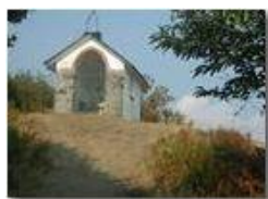
La Cappelletta del M. Pianetto

Pietro Marcheselli - Olympus Camedia 3000 <2001 - Estate - Savignone - Fiori&Fauna