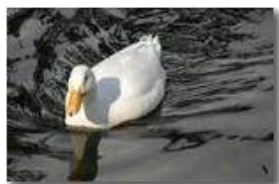
Papera in ammollo (anatra White-Campbell)

Pietro Marcheselli - Canon EOS 300D 2008 - Estate - Savignone - Fiori&Fauna