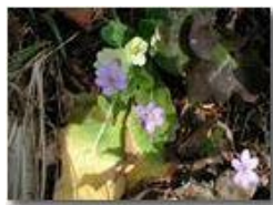
Primule e anemone epatica

Pietro Marcheselli - Olympus Camedia 3000 2002 - Estate - Savignone - Fiori&Fauna