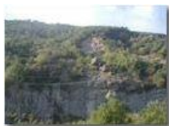
La vecchia frana di M. Maggio

Pietro Marcheselli - Olympus Camedia 3000 <2001 - Estate - Savignone - Panorami