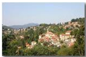
Savignone: il centro del paese

Pietro Marcheselli - Canon EOS 300D 2009 - Estate - Savignone - Fiori&Fauna