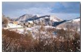
Costa di Montemaggio

Pietro Marcheselli - Canon Ixus 980 IS 2013 - Inverno - Savignone - Paesi