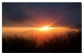
Finalmente si rivede il sole

Pietro Marcheselli - Altro/Other 2013 - Inverno - Savignone - Altro