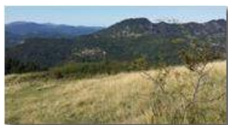
Vaccarezza e Costa di Montemaggio

Pietro Marcheselli - Canon Ixus 980 IS 2016 - Inverno - Savignone - Panorami