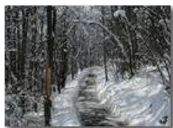
Savignone: strada innevata nel bosco a La Vittoria

Pietro Marcheselli - Olympus Camedia 3000 2005 - Inverno - Savignone - Boschi