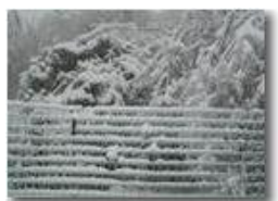
Neve ed effetto galaverna

Pietro Marcheselli - Olympus Camedia 3000 2004 - Inverno - Savignone - Boschi