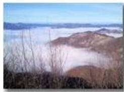
Nebbia in Liguria: Padania libera

Pietro Marcheselli - Canon Ixus 980 IS 2013 - Inverno - Savignone - Panorami