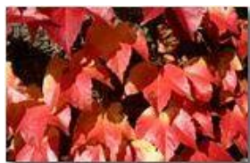
Vite americana: parthenocissus tricuspidatus

Pietro Marcheselli - Canon EOS 300D 2006 - Inverno - Savignone - Fiori&Fauna