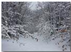
Sentiero nei boschi di Costalovaia

- Altro/Other 2015 - Inverno - Savignone - Paesi