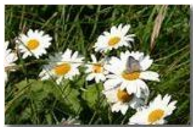
Farfalla polyommatus su capolini di margherita

Pietro Marcheselli - Canon EOS 300D 2009 - Estate - Savignone - Fiori&Fauna