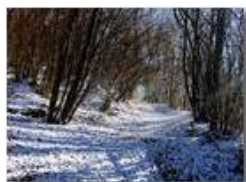
22 novembre 2015: si calpesta la prima neve

Pietro Marcheselli - Altro/Other 2016 - Inverno - Savignone - Altro