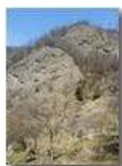
Conglomerato di Savignone

Guido Marcheselli - HTC One S Nokia C7-00 (o altro cell) 2018 - Inverno - Savignone - Fiori&Fauna