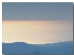
Riflessi sul Mar Ligure da Monte Maggio

Guido Marcheselli - Olympus OM-D E-M10 Mark III 2020 - Inverno - Savignone - Panorami