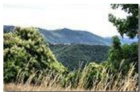
Costa di Orero

Pietro Marcheselli - Canon EOS 300D 2009 - Estate - Savignone - Fiori&Fauna