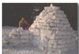
Neve e Igloo a Ponte di Savignone

Pietro Marcheselli - Scanner <2001 - Inverno - Savignone - Paesi