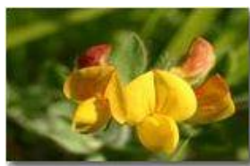
Un comune fiore dei prati: coronilla vaginalis

Pietro Marcheselli - Canon EOS 300D 2006 - Estate - Savignone - Altro