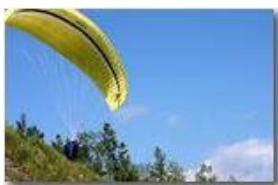
Parapendio fase 2: tutto a posto?

Pietro Marcheselli - Canon EOS 300D 2006 - Estate - Savignone - Altro