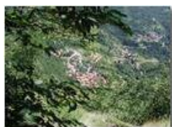
La frazione Sorrivi vista dalle rocce del M. Maggio

Pietro Marcheselli - Olympus Camedia 3000 <2001 - Estate - Savignone - Panorami