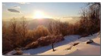
Neve tinta dal sole al tramonto

Guido Marcheselli - HTC One S Nokia C7-00 (o altro cell) 2018 - Inverno - Savignone - Panorami