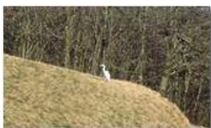
Ambientazione insolita per la sosta di un trampoliere

Pietro Marcheselli - Altro/Other 2015 - Inverno - Savignone - Panorami