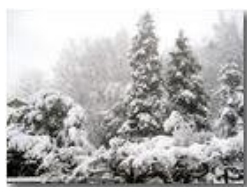
6 Febbraio: prima neve a Savignone

Pietro Marcheselli - Canon Ixus 980 IS 2018 - Inverno - Savignone - Altro