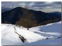
Neve di Marzo: luci e ombre sul Monte Fuea

Pietro Marcheselli - HTC One S Nokia C7-00 (o altro cell) 2018 - Inverno - Savignone - Panorami