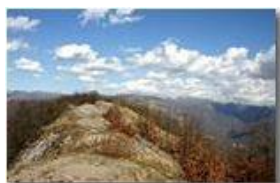
Cielo di primavera

Pietro Marcheselli - Canon EOS 300D 2006 - Estate - Savignone - Panorami