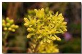
Infiorescenza di sedum acre (borracina)

Pietro Marcheselli - Canon EOS 300D 2009 - Estate - Savignone - Fiori&Fauna