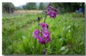
Una varietà spontanea di gladiolo

Pietro Marcheselli - Canon EOS 300D 2006 - Estate - Savignone - Panorami