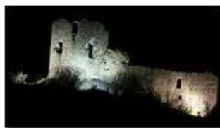
Castello Fieschi illuminato

Pietro Marcheselli - Canon Ixus 980 IS 2013 - Inverno - Savignone - Panorami