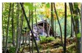
La casa di Pollicino?

Pietro Marcheselli - Canon EOS 300D 2009 - Inverno - Savignone - Boschi