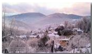
Savignone da Castello Rosso

Pietro Marcheselli - Altro/Other 2013 - Inverno - Savignone - Fiori&Fauna