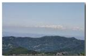
Monterosa e Pianura padana dal Monte Maggio

Pietro Marcheselli - Altro/Other 2011 - Estate - Savignone - Panorami