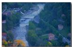
Parco fluviale e Oratorio di San Giacomo al tramonto

Canon EOS 300D 2009 - Estate - Savignone - Altro