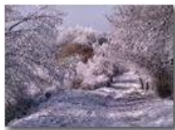
Inverno sul Monte Pianetto

Pietro Marcheselli - Canon Ixus 980 IS 2011 - Inverno - Savignone - Boschi