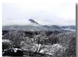
Inverno al Prelo

Pietro Marcheselli - HTC One S Nokia C7-00 (o altro cell) 2019 - Inverno - Savignone - Paesi