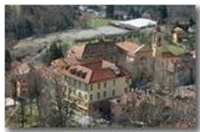
Savignone: Palazzo Fieschi e Parrocchia di San Pietro

Pietro Marcheselli - Canon EOS 300D 2009 - Inverno - Savignone - Paesi