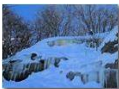
Salendo al Monte Pianetto

Pietro Marcheselli - Altro/Other 2012 - Inverno - Savignone - Altro