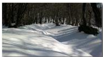
Boschi dietro la colonia di Montemaggio

Guido Marcheselli - Nokia C7-00 (o altro Smartphone) 2013 - Inverno - Savignone - Boschi