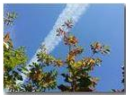
Castagni dopo la lunga estate secca

Pietro Marcheselli - Canon Ixus 980 IS 2016 - Estate - Savignone - Fiori&Fauna