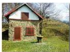
Ritorna la primavera alla casa sul poggio

Pietro Marcheselli - Altro/Other 2015 - Inverno - Savignone - Fiori&Fauna