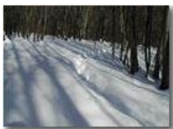
Tracce di cinghiale nella neve

Pietro Marcheselli - Olympus Camedia 3000 2005 - Inverno - Savignone - Boschi