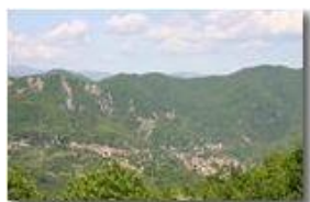
Variazioni stagionali - Savignone (maggio)

Pietro Marcheselli - Canon EOS 300D 2007 - Estate - Savignone - Paesi