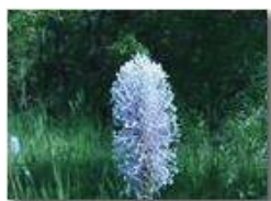
Il fiore di una comune piantaggine

Pietro Marcheselli - Olympus Camedia 3000 2004 - Estate - Savignone - Fiori&Fauna