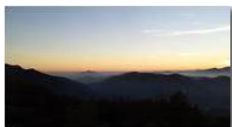
Tramonto da Montemaggio: i forti e il mare

Guido Marcheselli - HTC One S Nokia C7-00 (o altro cell) 2015 - Estate - Savignone - Panorami