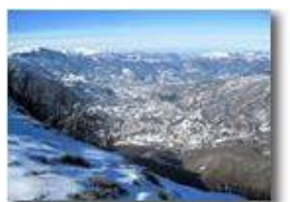
Valle Scrivia: paesaggio invernale

Pietro Marcheselli - Canon Ixus 980 IS 2015 - Inverno - Savignone - Panorami