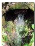
Sorgente nel bosco

Pietro Marcheselli - Canon Ixus 980 IS 2010 - Estate - Savignone - Panorami