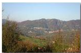
Savignone ai piedi del Monte Pianetto

Pietro Marcheselli - Canon EOS 300D 2006 - Inverno - Savignone - Fiori&Fauna