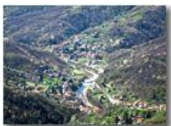
Frazioni Ponte di Savignone e San Bartolomeo

Pietro Marcheselli - Canon Ixus 980 IS 2014 - Estate - Savignone - Paesi