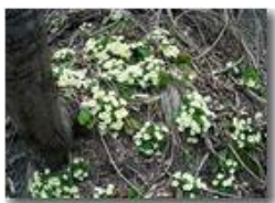
Annuncio di primavera: Primu

Pietro Marcheselli - Canon Ixus 980 IS 2014 - Estate - Savignone - Boschi