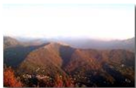
Ternano e Monte Banca

Pietro Marcheselli - Nokia C7-00 (o altro Smartphone) 2014 - Foto varie - Savignone - Altro