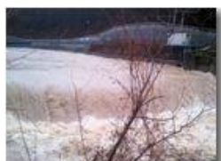
La pioggia di Natale

Pietro Marcheselli - Canon Ixus 980 IS 2014 - Inverno - Savignone - Paesi