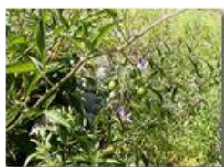
Solanum dulcamara: fiori e frutti

Pietro Marcheselli - Canon EOS 300D 2005 - Estate - Savignone - Panorami