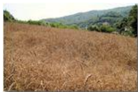
Grano a Savignone: varietà antica d'Abruzzo

Pietro Marcheselli - Altro/Other 2013 - Estate - Savignone - Fiori&Fauna