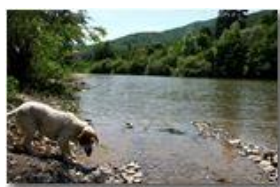
Fiume Scrivia a San Bartolomeo

Pietro Marcheselli - Canon EOS 300D 2005 - Estate - Savignone - Fiori&Fauna