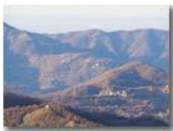
La cappelletta del Pianetto, frazioni Olivieri (Busalla) e Giacoboni (Ronco Scrivia)

Guido Marcheselli - Olympus OM-D E-M10 Mark III 2019 - Inverno - Savignone - Panorami