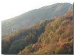
Veduta da Piambertone

Pietro Marcheselli - Olympus Camedia 3000 2002 - Inverno - Savignone - Panorami