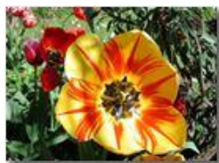
Fantasia di tulipano

Pietro Marcheselli - Olympus Camedia 3000 2002 - Estate - Savignone - Fiori&Fauna