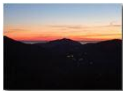
Tramonto sui Forti di Genova e il Mar Ligure, da Montemaggio

Guido Marcheselli - Olympus OM-D E-M10 Mark III 2021 - Inverno - Savignone - Panorami