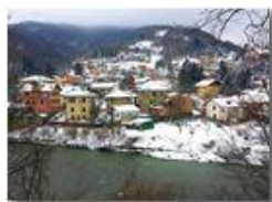
Neve di Marzo: Il Prelo

Pietro Marcheselli - HTC One S Nokia C7-00 (o altro cell) 2018 - Inverno - Savignone - Paesi