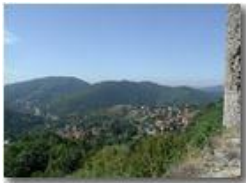
La frazione Gabbie di Savignone e la valle scrivina vista dal castello

Pietro Marcheselli - Olympus Camedia 3000 <2001 - Estate - Savignone - Fiori&Fauna