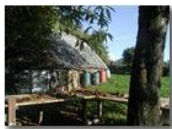
Ovile sulle pendici del M. Pianetto (Savignone)

Pietro Marcheselli - Olympus Camedia 3000 2002 - Inverno - Savignone - Fiori&Fauna