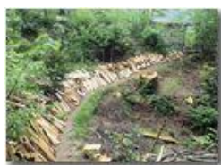
Taglio del bosco alla Cappelletta del Castello

Pietro Marcheselli - Canon Ixus 980 IS 2016 - Estate - Savignone - Panorami