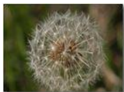
Pappi di tarassaco

Pietro Marcheselli - Olympus Camedia 3000 2004 - Estate - Savignone - Fiori&Fauna