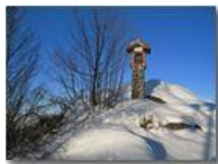
Monte Maggio: edicola votiva di vetta

Pietro Marcheselli - Webcam 2010 - Inverno - Savignone - Altro