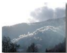
Neve e galaverna sopra a San Bartolomeo di Vallecaldà

Guido Marcheselli - Olympus Camedia 3000 2006 - Inverno - Savignone - Panorami