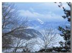
Monte Alpesisa con nebbie e neve

Pietro Marcheselli - Canon Ixus 980 IS 2010 - Inverno - Savignone - Paesi