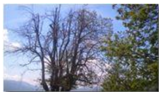
Anche quest'anno alberi di castagno danneggiati dal cinipede

Pietro Marcheselli - Canon Ixus 980 IS 2013 - Estate - Savignone - Fiori&Fauna