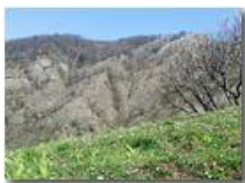
Primi accenni di primavera al Castello Fieschi

Pietro Marcheselli - Canon Ixus 980 IS 2018 - Inverno - Savignone - Paesi