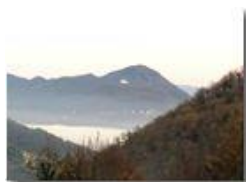
Nebbia in Valle Scrivia

Pietro Marcheselli - Canon Ixus 980 IS 2016 - Inverno - Savignone - Panorami