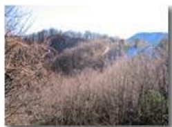
Pianetto: la cima della Cappelletta

Pietro Marcheselli - Canon Ixus 980 IS 2014 - Inverno - Savignone - Boschi