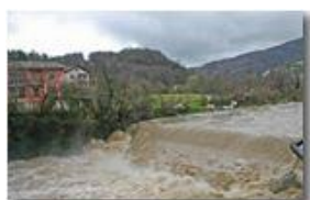
Dicembre 2006: Fiume Scrivia nel tardo autunno

Pietro Marcheselli - Canon EOS 300D 2007 - Inverno - Savignone - Altro