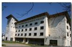
La Colonia di Montemaggio: architettura razionale dell'architetto Nardi Greco: a quando il recupero?

Pietro Marcheselli - Canon EOS 300D 2007 - Estate - Savignone - Paesi