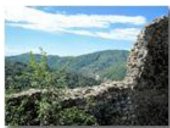
Castello fieschi: vista dalle mura

Pietro Marcheselli - Canon EOS 300D 2012 - Estate - Savignone - Altro