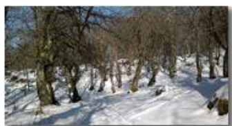
Boschi dietro la colonia di Montemaggio

Guido Marcheselli - Nokia C7-00 (o altro Smartphone) 2013 - Inverno - Savignone - Boschi