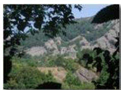
Mimetizzazione del cast. Fieschi di Savignone con il conglomerato

Pietro Marcheselli - Olympus Camedia 3000 <2001 - Estate - Savignone - Panorami