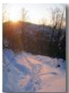
Piambertone: ultimi raggi

Pietro Marcheselli - Altro/Other 2012 - Inverno - Savignone - Panorami