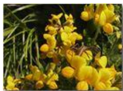
Raghetto su fiori di coronilla

Pietro Marcheselli - Olympus Camedia 3000 2004 - Estate - Savignone - Fiori&Fauna