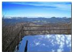
Dal balcone del Monte Maggio

Pietro Marcheselli - Canon Ixus 980 IS 2014 - Inverno - Savignone - Panorami