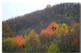
Novembre 2006: ultime pennellate

Pietro Marcheselli - Canon EOS 300D 2007 - Inverno - Savignone - Boschi