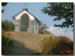
La Cappelletta del M. Pianetto

Pietro Marcheselli - Olympus Camedia 3000 <2001 - Estate - Savignone - Panorami