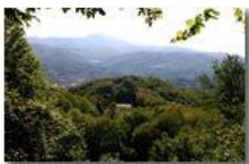
Boschi a Costalovaia

Pietro Marcheselli - Canon EOS 300D 2006 - Estate - Savignone - Boschi