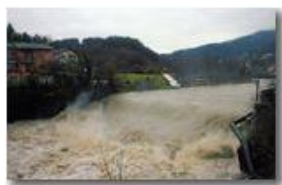
Disgelo: Fiume Scrivia in gennaio

Pietro Marcheselli - Canon EOS 300D 2009 - Inverno - Savignone - Paesi