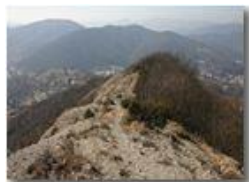
Sul conglomerato del M. Pianetto

Pietro Marcheselli - Olympus Camedia 3000 2005 - Inverno - Savignone - Panorami