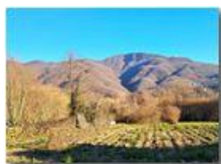
Monte Maggio, versante ovest

Pietro Marcheselli - Altro/Other 2023 - Inverno - Savignone - Panorami