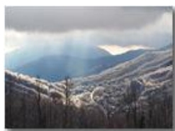
Neve, Galaverna e giudizio divino su Orero

Pietro Marcheselli - HTC One/Nokia C7/Samsung S7/S10 2020 - Estate - Savignone - Paesi