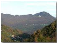
Frazione Vallecaldà di Savignone: a fronte Colonia e M. Maggio

Pietro Marcheselli - Olympus Camedia 3000 2002 - Inverno - Savignone - Panorami