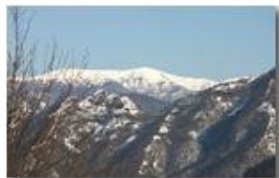
Monte Ebro con neve

Pietro Marcheselli - Olympus Camedia 3000 2006 - Inverno - Savignone - Altro