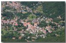
Savignone dal Monte Maggio

Pietro Marcheselli - Canon Ixus 980 IS 2010 - Estate - Savignone - Paesi