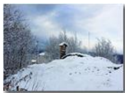
E' ritornata la neve

Pietro Marcheselli - Canon Ixus 980 IS 2015 - Inverno - Savignone - Altro