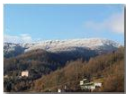
Brinata sul M. Vittoria

Pietro Marcheselli - Canon Ixus 980 IS 2015 - Inverno - Savignone - Panorami