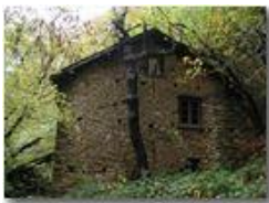
Autunno a Case Crosi - Savignone

Pietro Marcheselli - Olympus Camedia 3000 2005 - Inverno - Savignone - Boschi