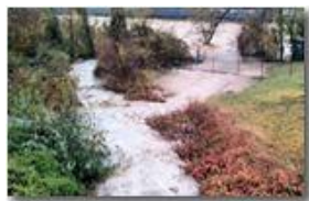
Contributo del ruscello Ramà alla piena del fiume Scrivia

Pietro Marcheselli - Altro/Other 2011 - Inverno - Savignone - Altro