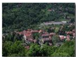
La piazza di Savignone dal Pianetto

Pietro Marcheselli - Scanner <2001 - Estate - Savignone - Paesi