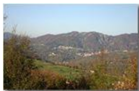
Savignone ai piedi del Monte Pianetto

Pietro Marcheselli - Canon EOS 300D 2006 - Inverno - Savignone - Panorami