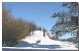
Neve sul M. Pianetto

Pietro Marcheselli - Canon EOS 300D 2006 - Inverno - Savignone - Boschi