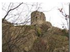
Castello Fieschi Savignone

Pietro Marcheselli - Canon Ixus 980 IS 2010 - Inverno - Savignone - Panorami