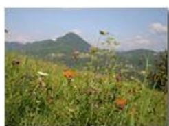
Farfalle che si godono il sole di fine estate

Pietro Marcheselli - Canon EOS 300D 2005 - Estate - Savignone - Panorami