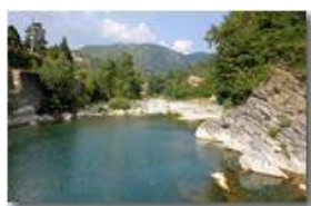
Fiume Scrivia a metà settembre

Pietro Marcheselli - Canon EOS 300D 2009 - Estate - Savignone - Altro