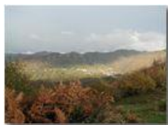
Luci e ombre su Savignone

Pietro Marcheselli - Olympus Camedia 3000 2005 - Inverno - Savignone - Fiori&Fauna