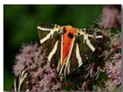
Farfalla callymorpha quadripunctaria

Pietro Marcheselli - Canon EOS 300D 2005 - Estate - Savignone - Fiori&Fauna