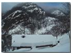
Dopo la nevicata

Pietro Marcheselli - Canon Ixus 980 IS 2014 - Inverno - Savignone - Altro