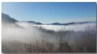
Nebbie di fine inverno

Guido Marcheselli - HTC One S Nokia C7-00 (o altro cell) 2016 - Inverno - Savignone - Panorami