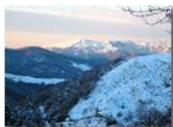
Monte Alpe al tramonto

Pietro Marcheselli - Canon Ixus 980 IS 2013 - Inverno - Savignone - Altro