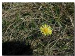
Fiore di Farfara

Pietro Marcheselli - Olympus Camedia 3000 2002 - Estate - Savignone - Fiori&Fauna