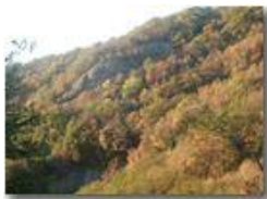
Autunno a Piambertone

Pietro Marcheselli - Olympus Camedia 3000 2002 - Inverno - Savignone - Boschi