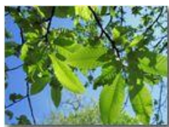
Effetti sul castagno del cinipede galligeno Dryocosmus kuriphilus

Pietro Marcheselli - Canon Ixus 980 IS 2010 - Estate - Savignone - Altro