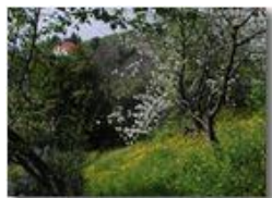
Angolo fiorito alla Vittoria ranuncoli ecc.

Pietro Marcheselli - Olympus Camedia 3000 2002 - Estate - Savignone - Fiori&Fauna