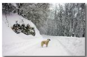
2007: niente neve. Qui un cane delle nevi... dell'anno precedente

Pietro Marcheselli - Canon EOS 300D 2007 - Inverno - Savignone - Boschi