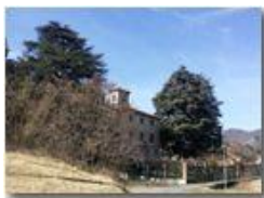
Villa a frazione Besolagno

Pietro Marcheselli - HTC One S Nokia C7-00 (o altro cell) 2019 - Inverno - Savignone - Paesi