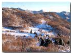
Montemaggio: le case di Inastrà

Pietro Marcheselli - Canon Ixus 980 IS 2013 - Inverno - Savignone - Paesi