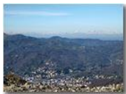
Busalla e le Alpi Cozie

Pietro Marcheselli - Canon Ixus 980 IS 2010 - Inverno - Savignone - Paesi