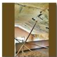
Colonia Montemaggio: interno n 3, i sostegni della volta

Pietro Marcheselli - Altro/Other 2014 - Estate - Savignone - Paesi