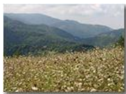
Prati d'agosto: l'invasione delle ombrellifere

Pietro Marcheselli - Canon EOS 300D 2005 - Estate - Savignone - Fiori&Fauna