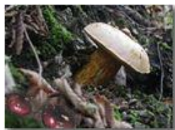
Esemplari di russule e boletus satana

Pietro Marcheselli - Olympus Camedia 3000 2002 - Inverno - Savignone - Fiori&Fauna