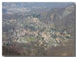
Savignone veduta aerea

Pietro Marcheselli - Olympus Camedia 3000 2005 - Inverno - Savignone - Panorami