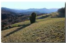
Panorama sulla Val Polcevera

Pietro Marcheselli - Canon EOS 300D 2009 - Inverno - Savignone - Paesi