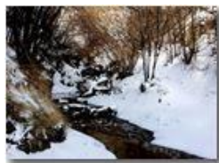
Neve di Marzo: rio Maggione

Pietro Marcheselli - HTC One S Nokia C7-00 (o altro cell) 2018 - Inverno - Savignone - Boschi