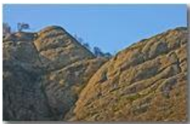
Conglomerato di Savignone: rocce sedimentarie depositate nell'Oligocene (circa 25 milioni di anni fa)

Pietro Marcheselli - Canon EOS 300D 2007 - Inverno - Savignone - Altro