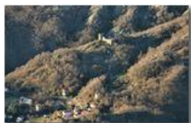
Frazione Castello Rosso e ruderi Castello Fieschi

Pietro Marcheselli - Canon Ixus 980 IS 2011 - Inverno - Savignone - Altro