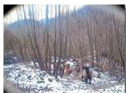
Incontri nella Valle Rio Maggione

Pietro Marcheselli - Altro/Other 2015 - Inverno - Savignone - Panorami