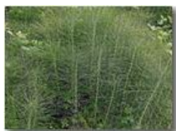
Coda di cavallo (equisetum arvensis)

Pietro Marcheselli - Altro/Other 2015 - Estate - Savignone - Fiori&Fauna