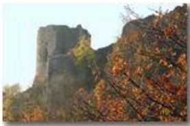
Castello Fieschi: particolare

Pietro Marcheselli - Canon EOS 300D 2007 - Inverno - Savignone - Boschi