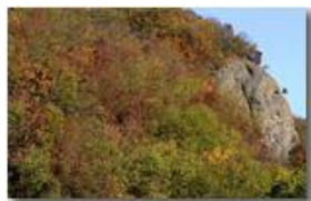
Autunno 2008: Boschi e conglomerato di Savignone

Pietro Marcheselli - Canon EOS 300D 2009 - Inverno - Savignone - Boschi