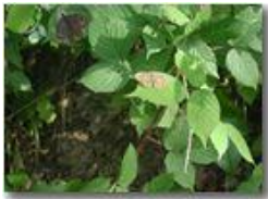
Esemplari di farfalla variet pararge

Pietro Marcheselli - Olympus Camedia 3000 <2001 - Estate - Savignone - Paesi