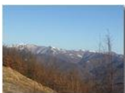
Monti Liguri: Neve sul M. Antola

Pietro Marcheselli - Canon Ixus 980 IS 2016 - Inverno - Savignone - Panorami