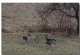
Daini che chiacchierano

Guido Marcheselli - Olympus OM-D E-M10 Mark III 2019 - Inverno - Savignone - Fiori&Fauna