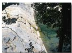
Fiume Scrivia in secca a Ponte di Savignone

Pietro Marcheselli - Altro/Other 2017 - Estate - Savignone - Boschi