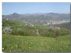
Un'altra primavera a Gualdrà

Pietro Marcheselli - Olympus Camedia 3000 2002 - Estate - Savignone - Fiori&Fauna