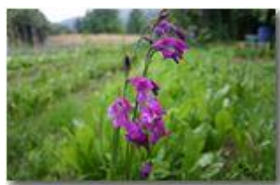
Una varietà spontanea di gladiolo

Pietro Marcheselli - Canon EOS 300D 2007 - Estate - Savignone - Panorami