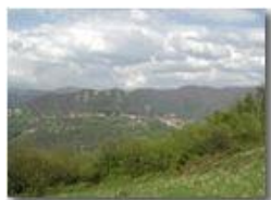
Savignone e la frazione Gabbie ai piedi del Pianetto dal M. Capellino

Pietro Marcheselli - Olympus Camedia 3000 <2001 - Estate - Savignone - Fiori&Fauna