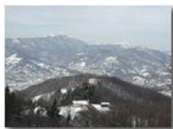
Costalovaia con neve

Pietro Marcheselli - Olympus Camedia 3000 2004 - Estate - Savignone - Fiori&Fauna