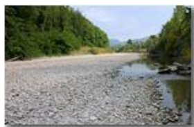
Fiume Scrivia a metà settembre

Pietro Marcheselli - Canon EOS 300D 2009 - Estate - Savignone - Fiori&Fauna