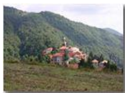
Santuario della Vittoria a fine estate

Pietro Marcheselli - Canon EOS 300D 2005 - Estate - Savignone - Panorami