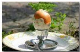
L amanita è servita! Fungo amanita cesarea, ovulo buono

Pietro Marcheselli - Canon EOS 300D 2009 - Inverno - Savignone - Boschi