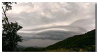
Ufo tra le nuvole?

Guido Marcheselli - HTC One S Nokia C7-00 (o altro cell) 2014 - Inverno - Savignone - Panorami