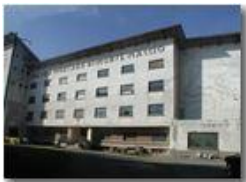
La colonia di Montemaggio (abbandonata): esempio di architettura moderna degli anni '30

Pietro Marcheselli - Olympus Camedia 3000 <2001 - Estate - Savignone - Paesi