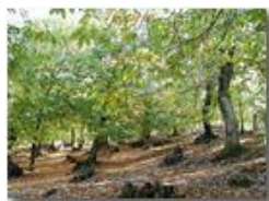
Bosco a Montemaggio

Pietro Marcheselli - Olympus Camedia 3000 2004 - Inverno - Savignone - Panorami