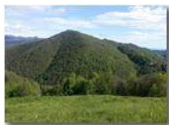
Monte Fuea e Santuario N.S. della Vittoria

Pietro Marcheselli - Canon Ixus 980 IS 2016 - Estate - Savignone - Paesi