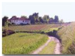
Campo di patate alla Vittoria

Pietro Marcheselli - Altro/Other 2015 - Estate - Savignone - Panorami