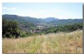
La Valle Scrivia a Casella

Pietro Marcheselli - Canon EOS 300D 2007 - Estate - Savignone - Panorami