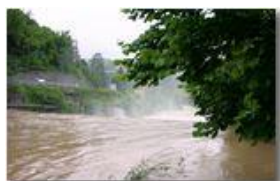
Giugno 2008: dopo le abbondanti precipitazioni

Pietro Marcheselli - Canon EOS 300D 2008 - Estate - Savignone - Altro