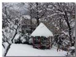
Neve a Savignone

Pietro Marcheselli - Canon Ixus 980 IS 2015 - Inverno - Savignone - Panorami