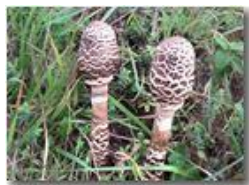
Fungo del genere lepiota

Pietro Marcheselli - Canon Ixus 980 IS 2011 - Inverno - Savignone - Fiori&Fauna