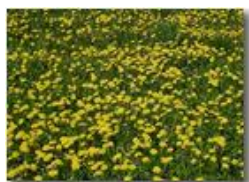
L'invasione del tarassaco

Pietro Marcheselli - HTC One S Nokia C7-00 (o altro cell) 2018 - Estate - Savignone - Boschi