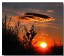
Il tramonto del solstizio

Pietro Marcheselli - Canon Ixus 980 IS 2013 - Inverno - Savignone - Altro