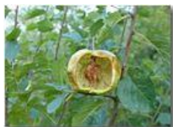
Mela cava: quel che lasciano le vespe

Pietro Marcheselli - Canon Ixus 980 IS 2016 - Estate - Savignone - Fiori&Fauna