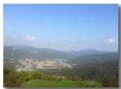
Casella nella foschia serale, vista dai prati di Gualdrà

Pietro Marcheselli - HTC One S Nokia C7-00 (o altro cell) 2018 - Estate - Savignone - Altro