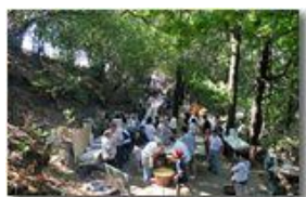
Festa del Monte Pianetto (prima domenica settembre)

Pietro Marcheselli - Canon EOS 300D 2009 - Estate - Savignone - Panorami