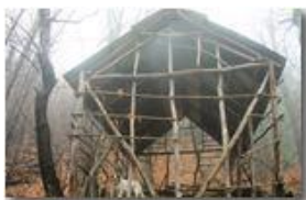
Tracce di un mondo contadino scomparso

Pietro Marcheselli - Canon EOS 300D 2008 - Inverno - Savignone - Panorami