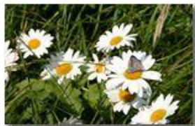
Farfalla polyommatus su capolini di margherita

Pietro Marcheselli - Canon EOS 300D 2009 - Estate - Savignone - Fiori&Fauna