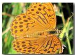
Una farfalla argynnis aglaia

Pietro Marcheselli - Canon Ixus 980 IS 2011 - Inverno - Savignone - Fiori&Fauna