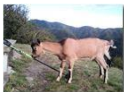
Può essermi utile?

Pietro Marcheselli - Canon Ixus 980 IS 2011 - Estate - Savignone - Altro