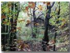
Autunno a Case Crosi - Savignone

Pietro Marcheselli - Olympus Camedia 3000 2005 - Inverno - Savignone - Boschi