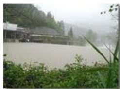
Fiume Scrivia 4-5-2002

Pietro Marcheselli - Olympus Camedia 3000 2002 - Estate - Savignone - Fiori&Fauna