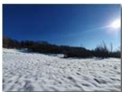
Montemaggio, tundra innevata

Guido Marcheselli - Olympus OM-D E-M10 Mark III 2021 - Inverno - Savignone - Fiori&Fauna