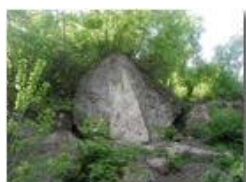
Masso di puddinga nei boschi di Savignone

Pietro Marcheselli - Olympus Camedia 3000 <2001 - Estate - Savignone - Fiori&Fauna