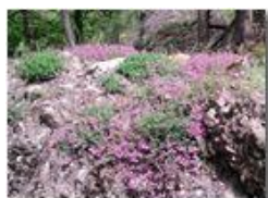
Silene rupestris su conglomerato

Pietro Marcheselli - Altro/Other 2011 - Estate - Savignone - Fiori&Fauna