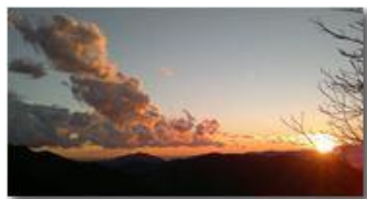
Tramonto da Montemaggio

Guido Marcheselli - Nokia C7-00 (o altro Smartphone) 2013 - Inverno - Savignone - Panorami