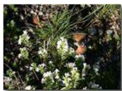
Rifornimento in volo: farfalla che succhia il nettare

Pietro Marcheselli - Canon EOS 300D 2005 - Estate - Savignone - Fiori&Fauna