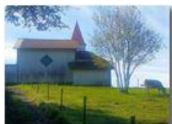
La cappella di Costalovaia

Pietro Marcheselli - Altro/Other 2017 - Inverno - Savignone - Panorami