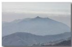
Veduta verso i forti di Genova da Monte Maggio

Pietro Marcheselli - Canon EOS 300D 2011 - Estate - Savignone - Panorami