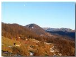
Tramonto con Monte Maggio

- Altro/Other 2015 - Inverno - Savignone - Paesi