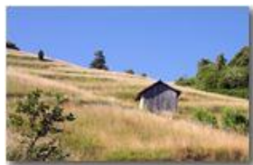
Variazioni stagionali: prati del Monte Cappellino in luglio

Pietro Marcheselli - Canon EOS 300D 2007 - Estate - Savignone - Panorami