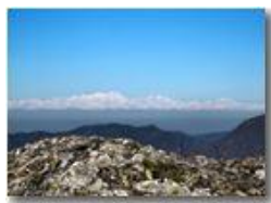
Dal Monte Maggio al Monte Rosa

Pietro Marcheselli - Canon Ixus 980 IS 2010 - Inverno - Savignone - Panorami