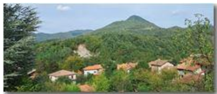
Veduta dal Prelo

Pietro Marcheselli - Altro/Other 2023 - Inverno - Savignone - Paesi