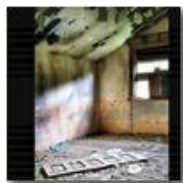
Colonia Montemaggio: interno n 1, urge restauro

Pietro Marcheselli - Altro/Other 2014 - Estate - Savignone - Paesi