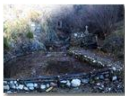
Un angolo di preghiera

Pietro Marcheselli - Altro/Other 2013 - Inverno - Savignone - Altro