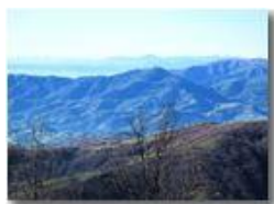
Santuario Madonna della Guardia sul Monte Figogn

Pietro Marcheselli - Canon Ixus 980 IS 2010 - Inverno - Savignone - Panorami