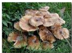
Un fungo del genere armillaria

Pietro Marcheselli - Olympus Camedia 3000 2005 - Inverno - Savignone - Panorami