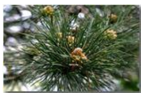
Fiore di conifera

Pietro Marcheselli - Canon EOS 300D 2009 - Estate - Savignone - Fiori&Fauna