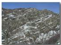
Le rocce del M. Pianetto spolverate di neve

Pietro Marcheselli - Olympus Camedia 3000 2002 - Inverno - Savignone - Boschi