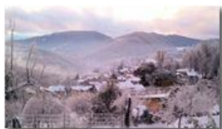
Savignone da Castello Rosso

Pietro Marcheselli - Altro/Other 2013 - Inverno - Savignone - Panorami