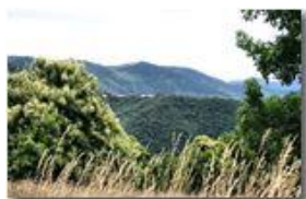
Costa di Orero

Pietro Marcheselli - Canon EOS 300D 2009 - Estate - Savignone - Altro