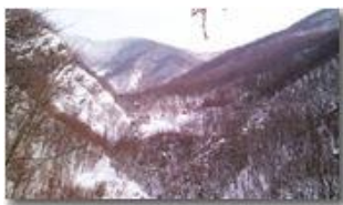
Valle del rio Maggione

Pietro Marcheselli - Canon Ixus 980 IS 2012 - Inverno - Savignone - Altro