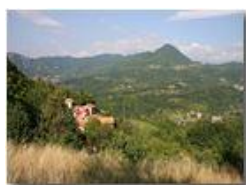
Savignone: frazione Cerisola

Pietro Marcheselli - Canon EOS 300D 2005 - Estate - Savignone - Panorami