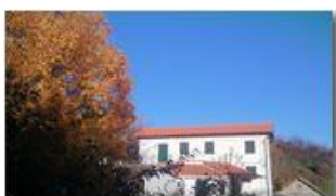
Autunno alla Maggetta

Pietro Marcheselli - Canon Ixus 980 IS 2013 - Inverno - Savignone - Altro