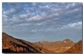
Monte Maggio al tramonto

Pietro Marcheselli - Altro/Other 2015 - Inverno - Savignone - Fiori&Fauna