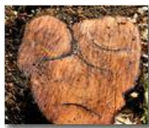
Il taglio del nocciolo: sindone sofferente

Pietro Marcheselli - Canon EOS 300D 2010 - Estate - Savignone - Panorami