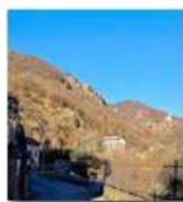
Altire di Savignone

Pietro Marcheselli - Altro/Other 2023 - Inverno - Savignone - Panorami