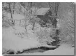
Savignone: nei boschi di Piambertone nella neve

Pietro Marcheselli - Olympus Camedia 3000 2005 - Inverno - Savignone - Boschi