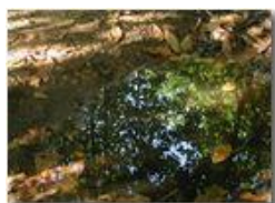
Riflessi in autunno

Pietro Marcheselli - Olympus Camedia 3000 2002 - Inverno - Savignone - Fiori&Fauna