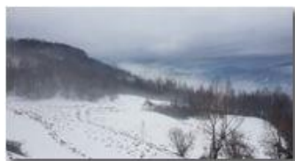
Neve che evapora a Montemaggio

Guido Marcheselli - HTC One S Nokia C7-00 (o altro cell) 2018 - Inverno - Savignone - Panorami