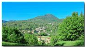
Casella fraz. Carpeneta e M. Maggio

Pietro Marcheselli - HTC One/Nokia C7/Samsung S7/S10 2022 - Estate - Savignone - Panorami