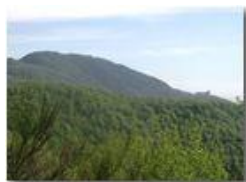
Monte Maggio e Colonia visti da nord

Pietro Marcheselli - Olympus Camedia 3000 2002 - Estate - Savignone - Fiori&Fauna