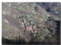
Sorrivi fraz. di Savignone dal M. Maggio (dic. 2001)

Guido Marcheselli - Olympus Camedia 3000 2002 - Inverno - Savignone - Paesi