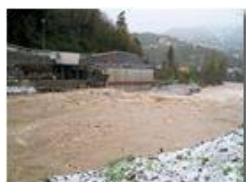
10 aprile: primavera in ritardo con pioggia e nevischio

Pietro Marcheselli - Canon Ixus 980 IS 2012 - Estate - Savignone - Boschi