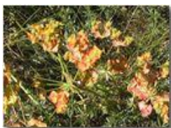
Una euforbia cipressina

Pietro Marcheselli - Olympus Camedia 3000 2004 - Estate - Savignone - Fiori&Fauna