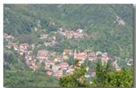
Variazioni stagionali: il paese di Savignone in maggio

Pietro Marcheselli - Canon EOS 300D 2007 - Estate - Savignone - Panorami