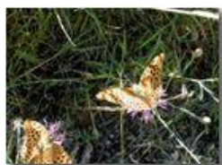
Esemplari di farfalla argynnis paphia

Pietro Marcheselli - Olympus Camedia 3000 <2001 - Estate - Savignone - Panorami