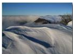
Neve e nebbia sul Monte Maggio

Canon Ixus 980 IS 2010 - Inverno - Savignone - Panorami