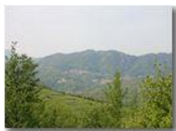
Savignone e Gabbie ai piedi del M. Pianetto

Pietro Marcheselli - Canon EOS 300D 2005 - Estate - Savignone - Panorami