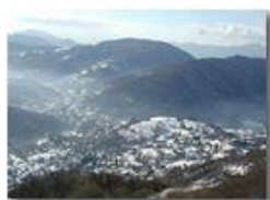
Alta Valle Scrivia: Savignone sotto la neve

Pietro Marcheselli - Olympus Camedia 3000 2003 - Inverno - Savignone - Boschi