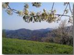
Veduta primaverile verso i forti di Genova

Pietro Marcheselli - Canon Ixus 980 IS 2011 - Estate - Savignone - Panorami