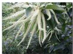
Amenti di castagno

Pietro Marcheselli - Olympus Camedia 3000 <2001 - Estate - Savignone - Fiori&Fauna