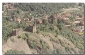
Ruderi del Castello Fieschi e il borgo di Savignone

Pietro Marcheselli - Olympus Camedia 3000 <2001 - Estate - Savignone - Panorami