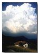
Cumulo pomeridiano temporalesco

Pietro Marcheselli - Canon Ixus 980 IS 2015 - Estate - Savignone - Panorami