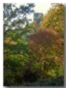
Autunno al Castello Fieschi

Pietro Marcheselli - Canon Ixus 980 IS 2018 - Inverno - Savignone - Altro