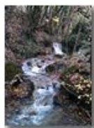
Verso le sorgenti del rio Piambertone

Pietro Marcheselli - Canon Ixus 980 IS 2011 - Inverno - Savignone - Boschi