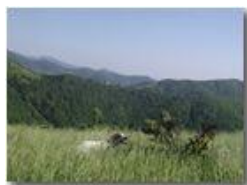
Il mio cane, Brina

Pietro Marcheselli - Olympus Camedia 3000 2002 - Inverno - Savignone - Boschi