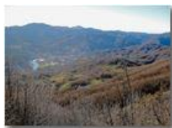
Salendo al M. Pianetto: panorama verso Busalla

Pietro Marcheselli - Canon Ixus 980 IS 2016 - Inverno - Savignone - Panorami