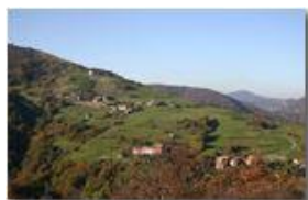
Luci di fine ottobre a Gualdrà

Pietro Marcheselli - Canon EOS 300D 2006 - Inverno - Savignone - Panorami