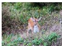
Piccoli daini al pascolo

Guido Marcheselli - Olympus OM-D E-M10 Mark III 2021 - Inverno - Savignone - Fiori&Fauna