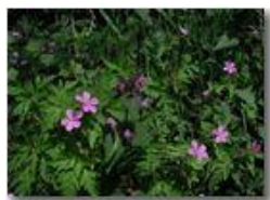
Geranio selvatico (g. robertianum)

Pietro Marcheselli - Olympus Camedia 3000 2002 - Estate - Savignone - Fiori&Fauna