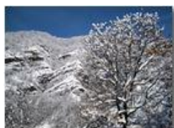
Sulle pendici del Castello Fieschi

Pietro Marcheselli - Canon Ixus 980 IS 2012 - Inverno - Savignone - Altro