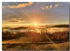
Nebbie a fondovalle al tramonto - Montemaggio

Guido Marcheselli - HTC One/Nokia C7/Samsung S7/S10 2021 - Inverno - Savignone - Panorami