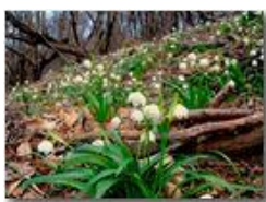
Primi segnali di primavera: Leucojum vernum (campanellino)

Pietro Marcheselli - Canon Ixus 980 IS 2016 - Estate - Savignone - Fiori&Fauna