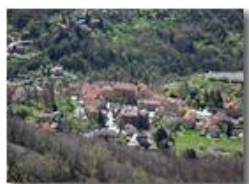
Savignone: la Chiesa Parrocchiale e la Piazza

Pietro Marcheselli - Canon EOS 300D 2005 - Estate - Savignone - Panorami