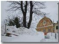
Neve di primavera alla Vittoria

Pietro Marcheselli - Canon Ixus 980 IS 2013 - Inverno - Savignone - Paesi