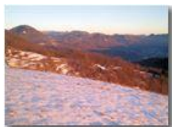
Neve sul Monte Cappellino

Pietro Marcheselli - Canon Ixus 980 IS 2013 - Inverno - Savignone - Panorami