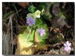
Primule e anemone epatica

Pietro Marcheselli - Olympus Camedia 3000 2002 - Estate - Savignone - Fiori&Fauna