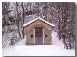
La cappelletta del Castello

Pietro Marcheselli - Canon Ixus 980 IS 2011 - Inverno - Savignone - Panorami