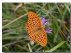
Farfalla argynnis aglais

Pietro Marcheselli - Canon EOS 300D 2005 - Estate - Savignone - Fiori&Fauna