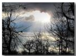
Luci ed ombre in paesaggio invernale

Pietro Marcheselli - Canon Ixus 980 IS 2010 - Inverno - Savignone - Panorami