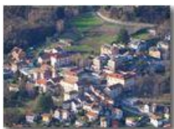
Savignone dal Monte Maggio

Guido Marcheselli - Olympus OM-D E-M10 Mark III 2019 - Inverno - Savignone - Panorami