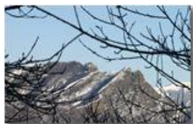
Monte Reo Passo con neve: Biurca e Carrega du Diaou

Pietro Marcheselli - Canon EOS 300D 2006 - Inverno - Savignone - Paesi