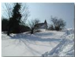
La chiesetta di Costalovaia ricoperta di neve

Pietro Marcheselli - Olympus Camedia 3000 2005 - Inverno - Savignone - Boschi