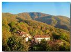
Colori d'autunno nei boschi di Savignone

Pietro Marcheselli - Canon Ixus 980 IS 2018 - Inverno - Savignone - Boschi