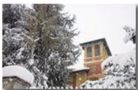
Nevicata sul "mirador"

rattoPernugo - Canon EOS 300D 2006 - Inverno - Savignone - Boschi