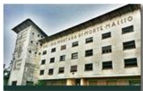
La Colonia abbandonata: la facciata

Pietro Marcheselli - Altro/Other 2014 - Estate - Savignone - Paesi