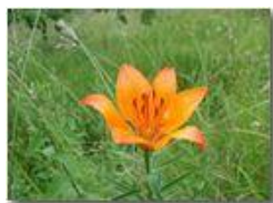
Giglio rosso (lilium bulbiferum)

Pietro Marcheselli - Olympus Camedia 3000 <2001 - Estate - Savignone - Fiori&Fauna