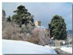
La gelata del 22 dicembre

Pietro Marcheselli - Canon Ixus 980 IS 2010 - Inverno - Savignone - Panorami