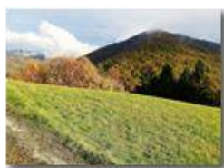
Pendici M. Cappellino: panorama autunnale

Pietro Marcheselli - HTC One S Nokia C7-00 (o altro cell) 2018 - Inverno - Savignone - Panorami