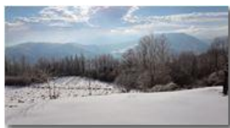
Il sole dopo la tempesta di neve

Guido Marcheselli - HTC One S Nokia C7-00 (o altro cell) 2018 - Inverno - Savignone - Panorami