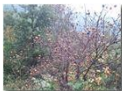
Nespolo comune (Mespilus germanica)

Pietro Marcheselli - Altro/Other 2014 - Inverno - Savignone - Panorami