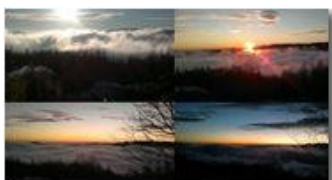
Fasi del tramonto con nebbie, da Montemaggio-Chiapazza

Guido Marcheselli - Canon EOS 300D 2013 - Inverno - Savignone - Boschi