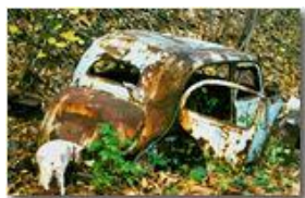
In attesa della prossima rottamazione?

Pietro Marcheselli - Canon EOS 300D 2007 - Inverno - Savignone - Altro