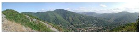
Savignone tra M. Pianetto e M. Maggio

Pietro Marcheselli - Olympus Camedia 3000 2003 - Estate - Savignone - Panorami