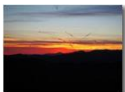
Tramonto da Montemaggio

Pietro Marcheselli - HTC One S Nokia C7-00 (o altro cell) 2019 - Inverno - Savignone - Panorami