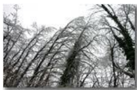
Alberi curvi per il gelo

Pietro Marcheselli - Olympus Camedia 3000 2006 - Inverno - Savignone - Boschi