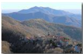
Frazione La Vittoria: sullo sfondo i Forti di Genova

Pietro Marcheselli - Canon EOS 300D 2009 - Inverno - Savignone - Panorami