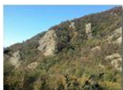
Autunno a Savignone

Pietro Marcheselli - HTC One S Nokia C7-00 (o altro cell) 2018 - Estate - Savignone - Panorami