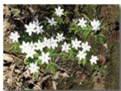
Fiori di anemone nemorosa

Pietro Marcheselli - Canon EOS 300D 2010 - Estate - Savignone - Fiori&Fauna