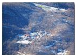
Frazione Autra spolverata di neve

Guido Marcheselli - Olympus OM-D E-M10 Mark III 2021 - Inverno - Savignone - Paesi