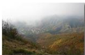
Savignone dal Monte Maggio: aut. 2005

Pietro Marcheselli - Canon EOS 300D 2006 - Inverno - Savignone - Fiori&Fauna