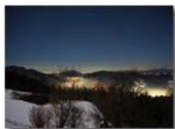
Panorama notturno innevato verso Genova e Santuario della Guardia

Guido Marcheselli - Olympus OM-D E-M10 Mark III 2022 - Inverno - Savignone - Paesi