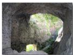
Castello fieschi: Interno

Pietro Marcheselli - Canon Ixus 980 IS 2012 - Estate - Savignone - Boschi