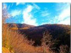
Pendici M: Maggio

Pietro Marcheselli - Altro/Other 2014 - Inverno - Savignone - Panorami