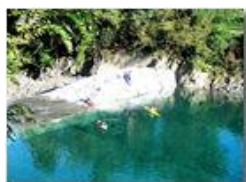
Il ritorno delle canoe

Pietro Marcheselli - Altro/Other 2014 - Inverno - Savignone - Fiori&Fauna