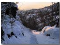
Piambertone: sentiero al tramonto

Pietro Marcheselli - Altro/Other 2012 - Inverno - Savignone - Panorami