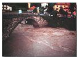
Fiume Scrivia in piena a Ponte di Savignone

Pietro Marcheselli - Olympus Camedia 3000 2003 - Inverno - Savignone - Fiori&Fauna