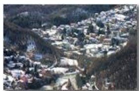
Frazioni Ponte, San Bartolomeo e Prelo sotto la neve

Pietro Marcheselli - Canon EOS 300D 2007 - Inverno - Savignone - Panorami