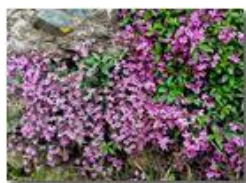
Cuscinetto di silene rupestris

Pietro Marcheselli - HTC One S Nokia C7-00 (o altro cell) 2018 - Estate - Savignone - Paesi