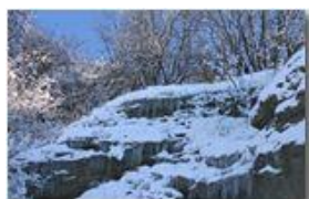
Ghiaccio e neve salendo al M. Pianetto

Pietro Marcheselli - Canon EOS 300D 2006 - Inverno - Savignone - Panorami