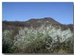
Prunus spinosa e M. Maggio

Pietro Marcheselli - Olympus Camedia 3000 2002 - Estate - Savignone - Fiori&Fauna