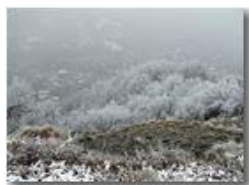
I boschi del monte Pianetto brizzolati dal freddo

Pietro Marcheselli - Olympus Camedia 3000 2006 - Inverno - Savignone - Altro