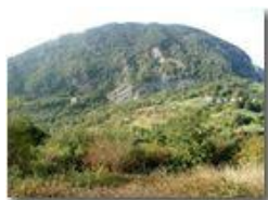
Monte Maggio visto dal M. Albarino

Pietro Marcheselli - Olympus Camedia 3000 <2001 - Estate - Savignone - Panorami