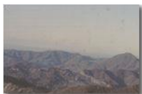
Bastia e Monte Reale (m. 902) dal M. Maggio

Pietro Marcheselli - Olympus Camedia 3000 <2001 - Estate - Savignone - Panorami