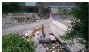
Diga: avanzamento lavori

Pietro Marcheselli - Canon Ixus 980 IS 2013 - Estate - Savignone - Altro