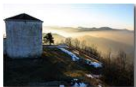
Nebbie al tramonto sul Passo Giovi e Bocchetta, dal Monte Maggio

Pietro Marcheselli - Canon EOS 300D 2006 - Inverno - Savignone - Panorami