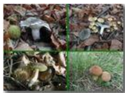
Russula chiodini boletus versicolor vescia

Pietro Marcheselli - Olympus Camedia 3000 2002 - Inverno - Savignone - Panorami