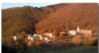
Il paese di Montemaggio al tramonto

Guido Marcheselli - Nokia C7-00 (o altro Smartphone) 2013 - Inverno - Savignone - Panorami