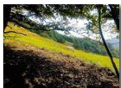
Pascolo sul M. Cappellino

Pietro Marcheselli - Altro/Other 2017 - Inverno - Savignone - Fiori&Fauna