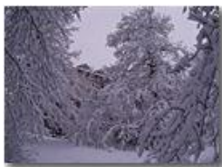
1 marzo: Bosco della Colonia

Pietro Marcheselli - Altro/Other 2014 - Inverno - Savignone - Boschi