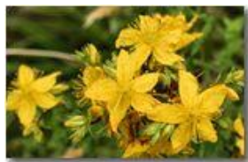
Fiore di Iperico

Pietro Marcheselli - Canon EOS 300D 2009 - Estate - Savignone - Fiori&Fauna