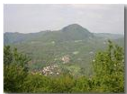
Ancora M. Maggio

Pietro Marcheselli - Canon EOS 300D 2005 - Estate - Savignone - Fiori&Fauna