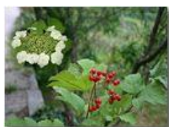
Fiore, foglia e frutto di Hydrangea sargentiana

Pietro Marcheselli - Canon EOS 300D 2005 - Estate - Savignone - Fiori&Fauna