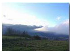
Nebbie dalla Val Padana

Guido Marcheselli - HTC One S Nokia C7-00 (o altro cell) 2019 - Inverno - Savignone - Panorami