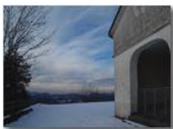
M.Maggio: la cappella "Maria Immacolata"

Pietro Marcheselli - Altro/Other 2014 - Inverno - Savignone - Boschi