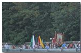
Tradizionale processione festa NS di Lourdes

Pietro Marcheselli - Altro/Other 2013 - Estate - Savignone - Altro