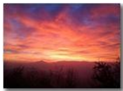
Rosso di sera

Pietro Marcheselli - Canon Ixus 980 IS 2013 - Estate - Savignone - Panorami