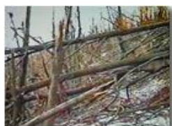
Il bosco dopo la galaverna (da vhs)

Pietro Marcheselli - Olympus Camedia 3000 2002 - Inverno - Savignone - Paesi