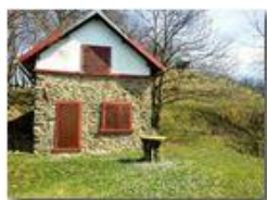
Ritorna la primavera alla casa sul poggio

Guido Marcheselli - HTC One S Nokia C7-00 (o altro cell) 2015 - Estate - Savignone - Fiori&Fauna