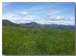
Monte Maggio dalle pendici del Monte Cappellino

Pietro Marcheselli - Canon Ixus 980 IS 2016 - Estate - Savignone - Panorami