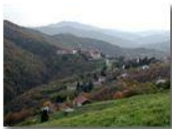
La frazione Vittoria di Savignone sullo spartiacque padano-tirrenico (in lontananza i Forti di Genova, Diamante e Estelle Miasse)

Pietro Marcheselli - Olympus Camedia 3000 2002 - Inverno - Savignone - Panorami