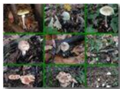
123: amanita phalloide; 45: ammanita pantherina; 6: cortinario; 789: altre famigliole

Pietro Marcheselli - Olympus Camedia 3000 2002 - Inverno - Savignone - Fiori&Fauna