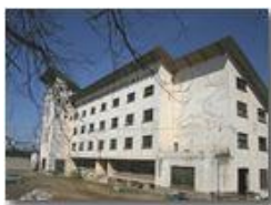
La ex colonia di Montemaggio

Pietro Marcheselli - Olympus Camedia 3000 2005 - Inverno - Savignone - Paesi