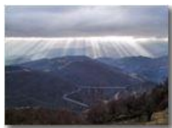
Effetto di luce sulla Val Polcevera

Pietro Marcheselli - Canon Ixus 980 IS 2011 - Estate - Savignone - Boschi