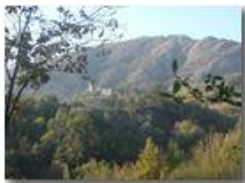
Ruderi del Castello Fieschi di Savignone

Pietro Marcheselli - Olympus Camedia 3000 2002 - Inverno - Savignone - Boschi