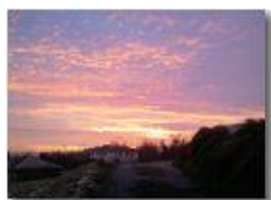
Frazione Vittoria: luci del tramonto

Pietro Marcheselli - Canon Ixus 980 IS 2011 - Inverno - Savignone - Altro