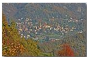
Autunno in Savignone 1

Pietro Marcheselli - Canon EOS 300D 2008 - Inverno - Savignone - Paesi