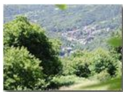
La fraz. San Bartolomeo di Vallecaldà

Pietro Marcheselli - Olympus Camedia 3000 <2001 - Estate - Savignone - Panorami