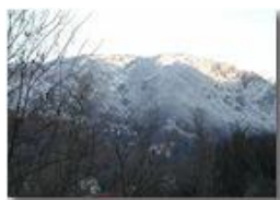
Neve sul Pianetto

Pietro Marcheselli - Olympus Camedia 3000 2004 - Inverno - Savignone - Panorami