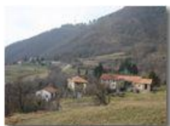
Savignone: frazione Inastr di M. Maggio

Pietro Marcheselli - Olympus Camedia 3000 2005 - Inverno - Savignone - Paesi