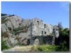
Savignone: ruderi del Castello Fieschi

Pietro Marcheselli - Olympus Camedia 3000 <2001 - Estate - Savignone - Paesi