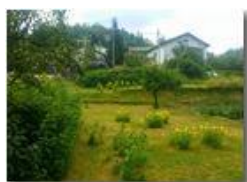
Fioritura di Oenothera

Pietro Marcheselli - Altro/Other 2016 - Estate - Savignone - Fiori&Fauna