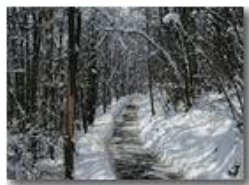
Savignone: strada innevata nel bosco a La Vittoria

Pietro Marcheselli - Olympus Camedia 3000 2005 - Inverno - Savignone - Paesi