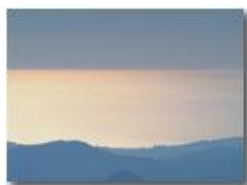
Riflessi sul Mar Ligure da Monte Maggio

Guido Marcheselli - Olympus OM-D E-M10 Mark III 2020 - Inverno - Savignone - Paesi