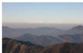
Aguzzando la vista, al di là dell'Appennino e delle nebbie della Padania, appaiono i monti tra il Cervino e il Rosa

Pietro Marcheselli - Canon EOS 300D 2006 - Inverno - Savignone - Panorami