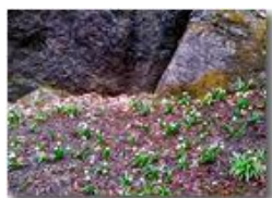
Fioritura di leucojum vernalis

Pietro Marcheselli - Canon Ixus 980 IS 2018 - Estate - Savignone - Fiori&Fauna