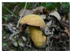
Fungo boletus luridus (tossico)

Pietro Marcheselli - Canon EOS 300D 2005 - Estate - Savignone - Fiori&Fauna