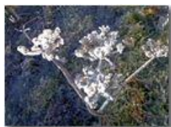
Peucedanum (ombrellifera): fioritura invernale (Nokia 70)

Pietro Marcheselli - Canon EOS 300D 2009 - Inverno - Savignone - Panorami