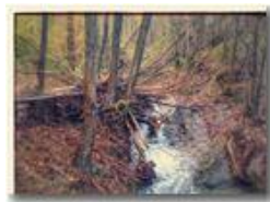
Effetti collaterali delle piogge autunnali

Pietro Marcheselli - Canon Ixus 980 IS 2015 - Inverno - Savignone - Panorami