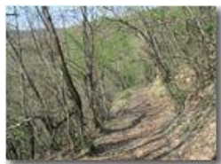
Sentiero nel bosco ad inizio primavera

Pietro Marcheselli - Canon Ixus 980 IS 2011 - Estate - Savignone - Boschi