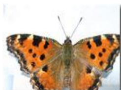
Una farfalla vanessa (aglais urticae)

Pietro Marcheselli - Canon EOS 300D 2005 - Estate - Savignone - Fiori&Fauna