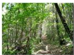
Effetti del dryocosmus kuriphilus : più luce nel castagneto

Pietro Marcheselli - Canon Ixus 980 IS 2010 - Estate - Savignone - Boschi