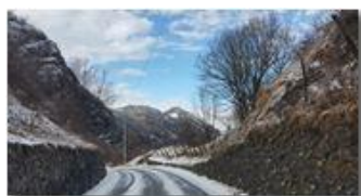
Neve tra Costa di Montemaggio e Sorriivi

Guido Marcheselli - HTC One S Nokia C7-00 (o altro cell) 2016 - Inverno - Savignone - Panorami