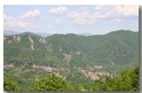
Variazioni stagionali - Savignone (maggio)

Pietro Marcheselli - Canon EOS 300D 2007 - Estate - Savignone - Paesi