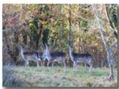
Daini: foto di gruppo

Guido Marcheselli - Olympus OM-D E-M10 Mark III 2021 - Inverno - Savignone - Panorami