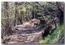
Incontro con giovane daino incuriosito nei boschi di Savignone

Pietro Marcheselli - HTC One S Nokia C7-00 (o altro cell) 2018 - Estate - Savignone - Fiori&Fauna