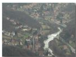
Riflessi del fiume Scrvia in inverno

Pietro Marcheselli - Olympus Camedia 3000 2002 - Inverno - Savignone - Panorami