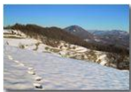
Veduta dal Monte Cappellino

Pietro Marcheselli - Canon Ixus 980 IS 2015 - Inverno - Savignone - Panorami