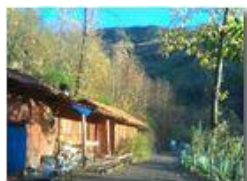
Autunno 2008: "isba" nel bosco (Nokia N70)

Guido Marcheselli - Canon EOS 300D 2009 - Inverno - Savignone - Boschi