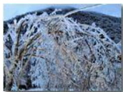
Ghiaccio sul Monte Fuea

Pietro Marcheselli - Canon Ixus 980 IS 2011 - Inverno - Savignone - Altro