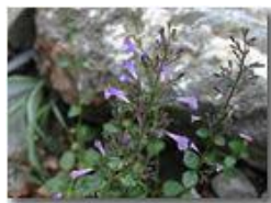
Fiore che distilla l'intenso profumo dall'arido conglomerato

Pietro Marcheselli - Canon EOS 300D 2005 - Estate - Savignone - Fiori&Fauna