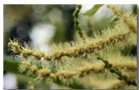
Gli amenti (fiori maschili) del castagno

Pietro Marcheselli - Canon EOS 300D 2009 - Estate - Savignone - Fiori&Fauna