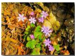
Fiori di epatica

Pietro Marcheselli - Canon Ixus 980 IS 2016 - Estate - Savignone - Fiori&Fauna