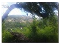
Castello e Monte Pianetto

Pietro Marcheselli - HTC One/Nokia C7/Samsung S7/S10 2020 - Estate - Savignone - Altro