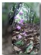
Cefalantera rossa (orchidacea)

Pietro Marcheselli - Canon Ixus 980 IS 2011 - Estate - Savignone - Altro