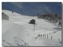
Pendici Monte Cappellino innevate

Pietro Marcheselli - Olympus Camedia 3000 2005 - Inverno - Savignone - Panorami