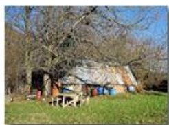
Salendo al M. Pianetto

Pietro Marcheselli - Canon Ixus 980 IS 2016 - Inverno - Savignone - Panorami