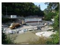
Cantiere per centrale idroelettrica sullo Scrivia. Ponte di Savignone

Pietro Marcheselli - HTC One/Nokia C7/Samsung S7/S10 2020 - Estate - Savignone - Altro