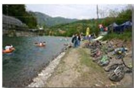
Manifestazione sportiva lungo il fiume Scrivia

Pietro Marcheselli - Canon EOS 300D 2006 - Estate - Savignone - Altro