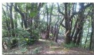
La boscosa sommità del Monte Moro (detto anche Monte Crosi)

Pietro Marcheselli - Altro/Other 2012 - Estate - Savignone - Panorami