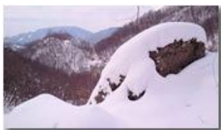
Valle del rio Maggione

Pietro Marcheselli - Altro/Other 2012 - Inverno - Savignone - Altro