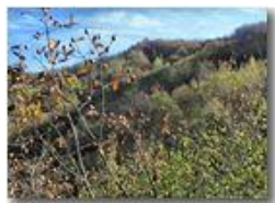
Nel bosco dietro al Monte Pianetto

Pietro Marcheselli - Canon EOS 300D 2011 - Inverno - Savignone - Boschi