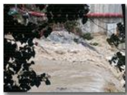
Cantiere nello Scrivia il 2 ottobre

Guido Marcheselli - HTC One/Nokia C7/Samsung S7/S10 2020 - Estate - Savignone - Panorami