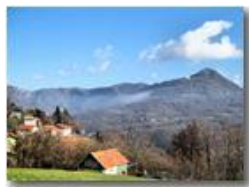
Cerisola, frazione di Savignone

Pietro Marcheselli - Canon Ixus 980 IS 2010 - Inverno - Savignone - Paesi