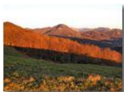
Pendici Monte Cappellino

Pietro Marcheselli - Canon Ixus 980 IS 2010 - Inverno - Savignone - Paesi