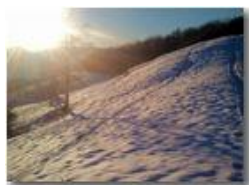
Neve sul Monte Cappellino

Pietro Marcheselli - Canon Ixus 980 IS 2013 - Inverno - Savignone - Panorami