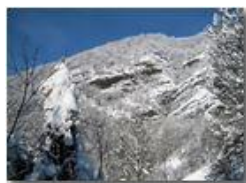
Pendii del Monte Pianetto

Canon Ixus 980 IS 2012 - Estate - Savignone - Paesi