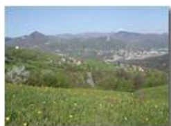
Un'altra primavera a Gualdrà

Pietro Marcheselli - Olympus Camedia 3000 2002 - Estate - Savignone - Fiori&Fauna