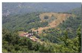
Pascoli a Costa di Montemaggio

Pietro Marcheselli - Canon EOS 300D 2005 - Estate - Savignone - Paesi