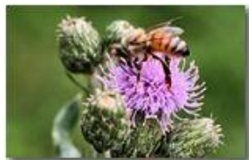
Ape su fiore di cardo

Pietro Marcheselli - Canon EOS 300D 2009 - Estate - Savignone - Fiori&Fauna