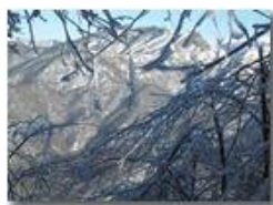
Le Rocche Reopasso schermate dalla brina del monte Pianetto

Pietro Marcheselli - Canon Ixus 980 IS 2010 - Inverno - Savignone - Panorami