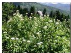
Fioritura di corniolo (cornus mas)

Pietro Marcheselli - Olympus Camedia 3000 2002 - Estate - Savignone - Fiori&Fauna