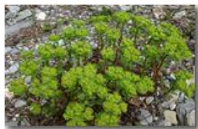
Euphorbia helioscopia nel greto del fiume

Pietro Marcheselli - Canon EOS 300D 2008 - Estate - Savignone - Fiori&Fauna