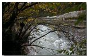
Crollo diga e strada provinciale a Ponte di Savignone

Guido Marcheselli - Canon EOS 300D 2012 - Inverno - Savignone - Paesi