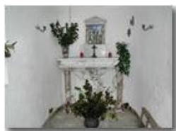
La Madonna della Guardia del Monte Pianetto

Guido Marcheselli - Olympus Camedia 3000 2006 - Inverno - Savignone - Boschi