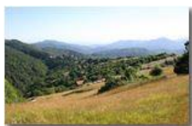
Uno sguardo verso il lontano mare dal Monte Cappellino

Pietro Marcheselli - Canon EOS 300D 2007 - Estate - Savignone - Fiori&Fauna