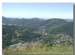
Questo il paesaggio di casa mia accanto alla diga sul fiume.

Pietro Marcheselli - Olympus Camedia 3000 <2001 - Estate - Savignone - Panorami