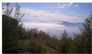
Nebbie dal Mar Ligure

Pietro Marcheselli - Canon Ixus 980 IS 2013 - Estate - Savignone - Altro