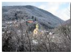
La gelata del 22 dicembre

Pietro Marcheselli - Canon Ixus 980 IS 2010 - Inverno - Savignone - Panorami