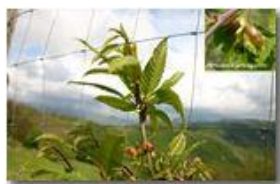
Effetti sul castagno del cinipede galligeno Dryocosmus kuriphilus

Pietro Marcheselli - Canon Ixus 980 IS 2010 - Estate - Savignone - Fiori&Fauna