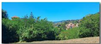
Savignone, versione estiva

Pietro Marcheselli - HTC One/Nokia C7/Samsung S7/S10 2022 - Estate - Savignone - Altro