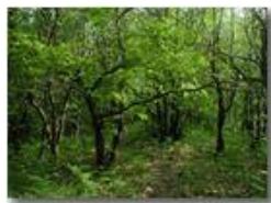
Il bosco di casa

Guido Marcheselli - Olympus Camedia 3000 <2001 - Estate - Savignone - Boschi