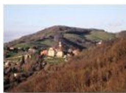
Il santuario della Vittoria

Pietro Marcheselli - Canon Ixus 980 IS 2010 - Inverno - Savignone - Panorami