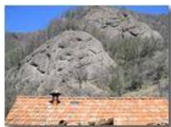
Rocce di conglomerato di Savignone

Pietro Marcheselli - Canon Ixus 980 IS 2010 - Estate - Savignone - Panorami