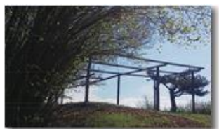
Salendo alla Cappelletta del Pianetto

Pietro Marcheselli - Altro/Other 2017 - Inverno - Savignone - Altro