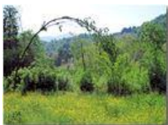
Prato di ranuncoli

Pietro Marcheselli - Canon EOS 300D 2010 - Estate - Savignone - Paesi