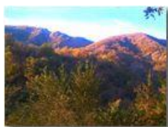
Pendici M: Pianetto

Pietro Marcheselli - Canon Ixus 980 IS 2014 - Inverno - Savignone - Panorami