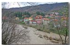
Frazione San Bartolomeo di Savignone e fiume Scrivia

Pietro Marcheselli - Canon EOS 300D 2007 - Inverno - Savignone - Altro