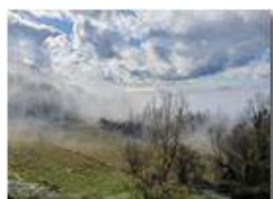
Nebbie mattutine - Montemaggio

Guido Marcheselli - Olympus OM-D E-M10 Mark III 2021 - Inverno - Savignone - Panorami