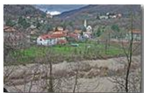
Fiume Scrivia a San Bartolomeo dopo le piogge autunnali

Pietro Marcheselli - Canon EOS 300D 2006 - Inverno - Savignone - Altro