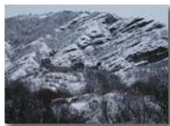
Ancora M. Pianetto spolverato di neve

Pietro Marcheselli - Olympus Camedia 3000 2004 - Inverno - Savignone - Paesi