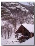
Nella valle del rio Maggione

Pietro Marcheselli - Altro/Other 2012 - Inverno - Savignone - Altro