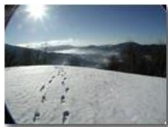
Controluce invernale con neve

Pietro Marcheselli - Olympus Camedia 3000 2003 - Inverno - Savignone - Panorami