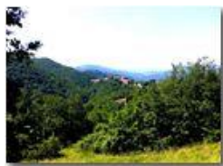
Santuario Regina della Vittoria

Pietro Marcheselli - HTC One S Nokia C7-00 (o altro cell) 2018 - Estate - Savignone - Panorami