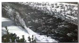
Fiume Scrivia a Ponte di Savignone

Guido Marcheselli - Nokia C7-00 (o altro Smartphone) 2013 - Inverno - Savignone - Boschi