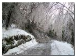
La galaverna del 22 dicembre

Canon Ixus 980 IS 2010 - Inverno - Savignone - Panorami