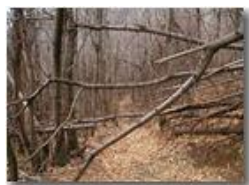
Bosco d' inverno

Pietro Marcheselli - Olympus Camedia 3000 2002 - Inverno - Savignone - Panorami