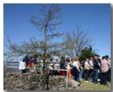
Monte Maggio : Fedeli che assistono alla Santa Messa

Pietro Marcheselli - Canon EOS 300D 2005 - Estate - Savignone - Panorami