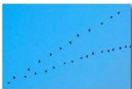
Altri migranti dall'Africa: gru accolte dal nord Europa

Pietro Marcheselli - HTC One S Nokia C7-00 (o altro cell) 2019 - Inverno - Savignone - Paesi