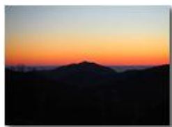
Tramonto sui Forti di Genova

Guido Marcheselli - Canon EOS 300D 2019 - Inverno - Savignone - Panorami