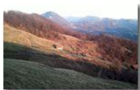
Luce del solstizio inverno 2011: dal Monte Cappellino

Pietro Marcheselli - Altro/Other 2012 - Inverno - Savignone - Altro