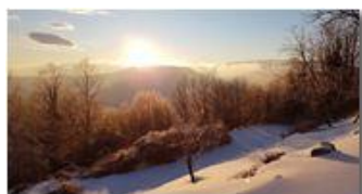
Neve tinta dal sole al tramonto

Pietro Marcheselli - HTC One S Nokia C7-00 (o altro cell) 2018 - Inverno - Savignone - Paesi