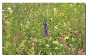
Prati di maggio: una tavolozza di colori

Pietro Marcheselli - Canon EOS 300D 2008 - Estate - Savignone - Fiori&Fauna