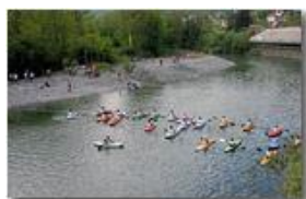
Partenza della gara di tetrathlon

Pietro Marcheselli - Canon EOS 300D 2007 - Estate - Savignone - Altro