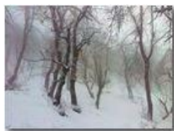
Nel Bosco della Colonia di Montemaggio

Pietro Marcheselli - Canon Ixus 980 IS 2013 - Inverno - Savignone - Altro