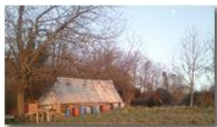
Luce del solstizio: inverno 2011

Pietro Marcheselli - Canon Ixus 980 IS 2012 - Inverno - Savignone - Panorami