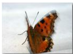
Battito d'ali di farfalla

Pietro Marcheselli - Canon EOS 300D 2005 - Estate - Savignone - Panorami