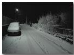
Prima timida nevicata

Pietro Marcheselli - HTC One S Nokia C7-00 (o altro cell) 2019 - Inverno - Savignone - Paesi