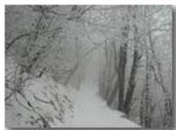
Il vento spolvera la brina dagli alberi

Pietro Marcheselli - Olympus Camedia 3000 2006 - Inverno - Savignone - Panorami