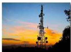
Vibrazioni elettromagnetiche celesti e terrestri

Guido Marcheselli - Nokia C7-00 (o altro Smartphone) 2013 - Estate - Savignone - Panorami