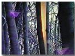
I danni della galaverna (1997): da vhs

Pietro Marcheselli - Olympus Camedia 3000 2002 - Inverno - Savignone - Boschi