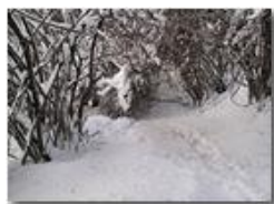
Sentiero Casella-Monte Maggio: chiuso per neve

Pietro Marcheselli - Webcam 2010 - Inverno - Savignone - Altro