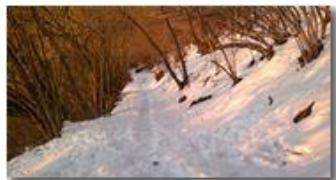
Scendendo nella neve da Montemaggio, al tramonto

Guido Marcheselli - Nokia C7-00 (o altro Smartphone) 2013 - Inverno - Savignone - Boschi