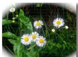
Cespica annua (Erigeron annuus)

Pietro Marcheselli - Altro/Other 2015 - Estate - Savignone - Fiori&Fauna