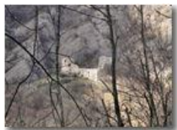
Mimetismo: Conglomerato e rovine del castello

Pietro Marcheselli - Canon Ixus 980 IS 2011 - Inverno - Savignone - Altro