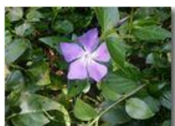
Fiore di pervinca

Pietro Marcheselli - Altro/Other 2016 - Estate - Savignone - Fiori&Fauna