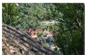
Veduta di Savignone dalle pareti di conglomerato del monte Pianetto

Pietro Marcheselli - Canon EOS 300D 2009 - Estate - Savignone - Panorami