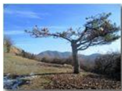
Processionaria: la lenta agonia del pino solitario del M.Pianetto

Pietro Marcheselli - Altro/Other 2012 - Inverno - Savignone - Altro