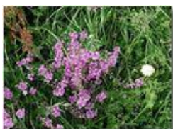
Infiorescenze di poligala

Guido Marcheselli - Olympus Camedia 3000 2004 - Estate - Savignone - Fiori&Fauna