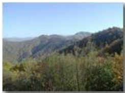
Versante settentrionale del M. Pianetto

Pietro Marcheselli - Olympus Camedia 3000 2002 - Inverno - Savignone - Panorami