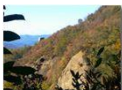
Autunno a Savignone

Pietro Marcheselli - HTC One S Nokia C7-00 (o altro cell) 2018 - Estate - Savignone - Panorami