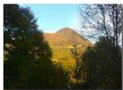
Autunno a Savignone – Monte Maggio

Pietro Marcheselli - HTC One S Nokia C7-00 (o altro cell) 2018 - Estate - Savignone - Fiori&Fauna