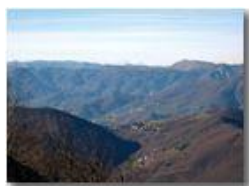
Il valico della Vittoria

Pietro Marcheselli - Canon Ixus 980 IS 2010 - Inverno - Savignone - Boschi