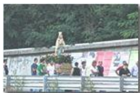
Tradizionale processione fesa NS di Lourdes

Pietro Marcheselli - Altro/Other 2013 - Estate - Savignone - Altro