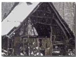
Seconda casa o pertinenza? IMU o NO_IMU?

Pietro Marcheselli - Altro/Other 2014 - Inverno - Savignone - Altro