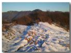
Neve sul Monte Cappellino

Pietro Marcheselli - Canon Ixus 980 IS 2013 - Estate - Savignone - Panorami