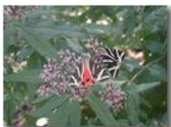
Callimorpha ad ali socchiuse: in volo mostra ali di color rosso vivo

Pietro Marcheselli - Olympus Camedia 3000 <2001 - Estate - Savignone - Paesi