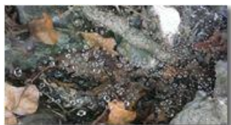
Ragnatela imperlata di rugiada

Guido Marcheselli - Nokia C7-00 (o altro Smartphone) 2014 - Inverno - Savignone - Paesi