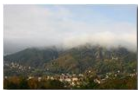
Savignone, autunno 2005

Pietro Marcheselli - Canon EOS 300D 2006 - Inverno - Savignone - Panorami