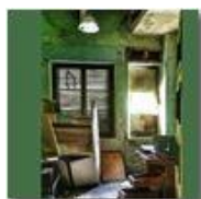
Colonia Montemaggio: inquadrature per film horror

Pietro Marcheselli - Altro/Other 2013 - Estate - Savignone - Paesi