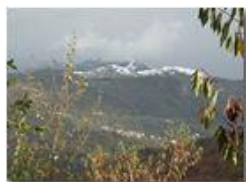
Un breve anticipo di inverno

Pietro Marcheselli - Olympus Camedia 3000 2005 - Inverno - Savignone - Panorami