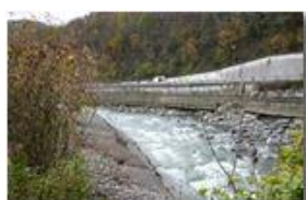
Crollo diga e frana strada provinciale a Ponte di Savignone: il nuovo corso

Guido Marcheselli - Canon Ixus 980 IS 2012 - Inverno - Savignone - Paesi