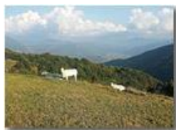
Pascolo sul M. Cappellino

Pietro Marcheselli - Altro/Other 2017 - Inverno - Savignone - Panorami