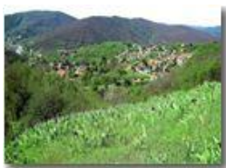
Le Gabbie di Savignone, dal Castello Fieschi

Pietro Marcheselli - Canon Ixus 980 IS 2014 - Estate - Savignone - Paesi