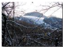
Si intravede il Monte Reale

Pietro Marcheselli - Altro/Other 2014 - Inverno - Savignone - Altro