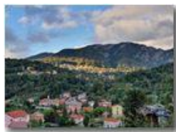
Ultimo raggio di sole al tramonto su Savignone

Guido Marcheselli - HTC One/Nokia C7/Samsung S7/S10 2020 - Estate - Savignone - Paesi