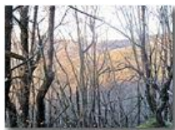
Ninte mi so de ciù triste de un bosco secco d'inverno...

Pietro Marcheselli - Canon Ixus 980 IS 2015 - Inverno - Savignone - Boschi