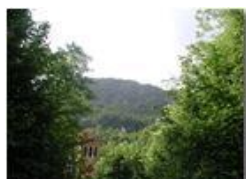
Il Castello dei Fieschi (Savignone)

Pietro Marcheselli - Olympus Camedia 3000 <2001 - Estate - Savignone - Fiori&Fauna