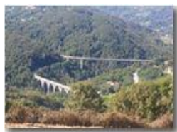
Autostrada dei Giovi

Pietro Marcheselli - Altro/Other 2015 - Estate - Savignone - Boschi