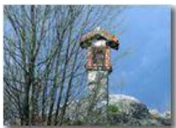
Monte Maggio: sulla cima

Pietro Marcheselli - Canon Ixus 980 IS 2014 - Estate - Savignone - Paesi