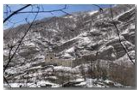
Rovine del Castello Fieschi e Monte Pianetto

Pietro Marcheselli - Canon Ixus 980 IS 2011 - Inverno - Savignone - Altro