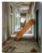
Colonia Montemaggio: inquadrature per film horror

Pietro Marcheselli - Altro/Other 2014 - Estate - Savignone - Panorami