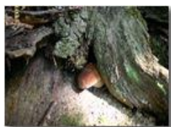
Fungo porcino che gioca a nascondino

Pietro Marcheselli - Canon EOS 300D 2005 - Estate - Savignone - Fiori&Fauna