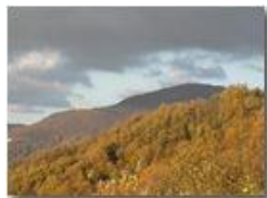
Monte Maggio in autunno

Pietro Marcheselli - Panasonic nv-gs70 (VideoCam) 2005 - Inverno - Savignone - Boschi