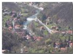
Fiume scrivia in località Ponte di Savignone

Pietro Marcheselli - Panasonic nv-gs70 (VideoCam) 2004 - Estate - Savignone - Fiori&Fauna