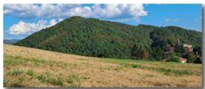
Fienagione pendici Monte Capellino

Pietro Marcheselli - HTC One/Nokia C7/Samsung S7/S10 2022 - Estate - Savignone - Panorami