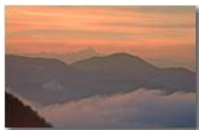
Autunno 2006: Il Monviso e il Monte Tobbio nella foschia al tramonto

Pietro Marcheselli - Canon EOS 300D 2007 - Inverno - Savignone - Altro