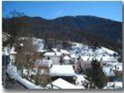
C'è del bianco a Castello Rosso

Pietro Marcheselli - Canon Ixus 980 IS 2013 - Inverno - Savignone - Boschi