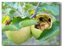
Le mie mele (e dei vesponi)

Pietro Marcheselli - Canon Ixus 980 IS 2016 - Estate - Savignone - Fiori&Fauna