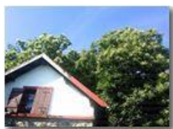
Rifiorisce il castagno: sconfitto il cinipede dryocosmus kuriphilus?

Pietro Marcheselli - Canon Ixus 980 IS 2015 - Estate - Savignone - Altro