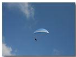
Parapendio in volo

Pietro Marcheselli - Canon EOS 300D 2005 - Estate - Savignone - Altro