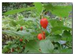
Frutto di alkekengi

Pietro Marcheselli - Olympus Camedia 3000 2002 - Inverno - Savignone - Boschi