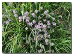
Variet di timo serpillio

Pietro Marcheselli - Olympus Camedia 3000 2004 - Estate - Savignone - Fiori&Fauna