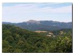
Monte Alpe del Porale

Pietro Marcheselli - Altro/Other 2016 - Estate - Savignone - Altro