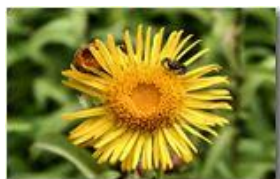
Ragno su inula

Pietro Marcheselli - Canon EOS 300D 2009 - Estate - Savignone - Fiori&Fauna