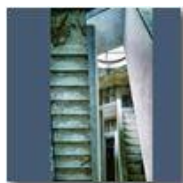
Colonia Montemaggio: inquadrature per film horror

Pietro Marcheselli - Altro/Other 2014 - Estate - Savignone - Paesi