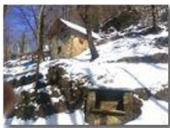
Neve di Marzo: nei boschi di Savignone

Pietro Marcheselli - HTC One S Nokia C7-00 (o altro cell) 2018 - Inverno - Savignone - Boschi