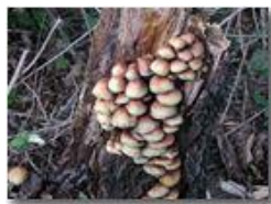
Famigliola di funghi

Pietro Marcheselli - Olympus Camedia 3000 2003 - Inverno - Savignone - Fiori&Fauna