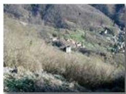
Il torrione del Castello Fieschi di Savignone

Pietro Marcheselli - Olympus Camedia 3000 2002 - Estate - Savignone - Panorami