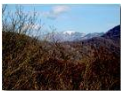
Il Monte Buio visto dalla Cappelletta del Pianetto

Pietro Marcheselli - Canon Ixus 980 IS 2016 - Inverno - Savignone - Panorami