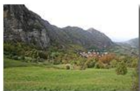
Frazione Sorrivi in ottobre

Pietro Marcheselli - Canon EOS 300D 2006 - Inverno - Savignone - Panorami