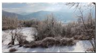
Neve, ghiaccio, sole.. forti di Genova, Madonna della Guardia e monte Vittoria

Guido Marcheselli - HTC One S Nokia C7-00 (o altro cell) 2018 - Inverno - Savignone - Panorami