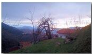
Albero alla Maggetta deformato dal gelo

Pietro Marcheselli - Altro/Other 2013 - Inverno - Savignone - Altro