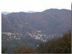
Savignone in novembre al tramonto

Pietro Marcheselli - Olympus Camedia 3000 2002 - Inverno - Savignone - Panorami