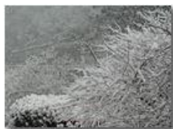
Neve novembrina a ponte di Savignone

Guido Marcheselli - Olympus Camedia 3000 2006 - Inverno - Savignone - Panorami