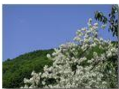
Fioritura di robinia pseudoacacia

Pietro Marcheselli - Olympus Camedia 3000 2004 - Estate - Savignone - Fiori&Fauna