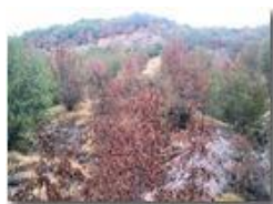
Ancora in attesa della pioggia

Pietro Marcheselli - Altro/Other 2012 - Estate - Savignone - Boschi