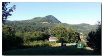
Il Monte Maggio visto da Besolagno

Pietro Marcheselli - Altro/Other 2017 - Estate - Savignone - Panorami