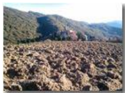
Aratura alla frazione Vittoria

Pietro Marcheselli - Canon Ixus 980 IS 2013 - Inverno - Savignone - Panorami