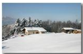
Neve a Costalovaia

Pietro Marcheselli - Canon EOS 300D 2009 - Inverno - Savignone - Paesi