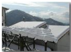
Pendici Monte Cappellino innevate

Pietro Marcheselli - Olympus Camedia 3000 2005 - Inverno - Savignone - Panorami