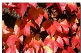
Vite americana: parthenocissus tricuspidatus

Pietro Marcheselli - Canon EOS 300D 2006 - Inverno - Savignone - Fiori&Fauna