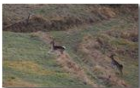
Daini: salto in alto

Guido Marcheselli - Olympus OM-D E-M10 Mark III 2019 - Inverno - Savignone - Panorami