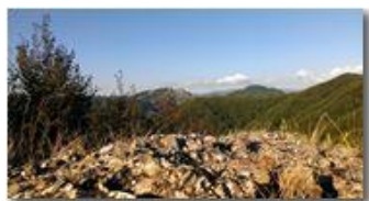
Rocche del reopasso dal monte Pianetto

Guido Marcheselli - Nokia C7-00 (o altro Smartphone) 2014 - Inverno - Savignone - Boschi