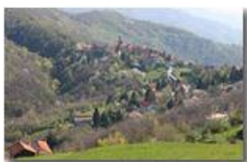
Ritorna la primavera al santuario Madonna della Vittoria

Pietro Marcheselli - Canon EOS 300D 2006 - Estate - Savignone - Altro