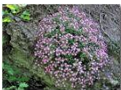
Cuscinetto di silene rupestris

Pietro Marcheselli - Canon Ixus 980 IS 2010 - Estate - Savignone - Fiori&Fauna