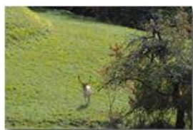
Daino in posa

Guido Marcheselli - Olympus OM-D E-M10 Mark III 2021 - Inverno - Savignone - Fiori&Fauna