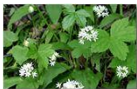
Fiori di Allium ursinum

Pietro Marcheselli - Canon EOS 300D 2010 - Estate - Savignone - Altro