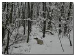
Savignone: nei boschi di Piambertone nella neve

Pietro Marcheselli - Olympus Camedia 3000 2005 - Inverno - Savignone - Boschi