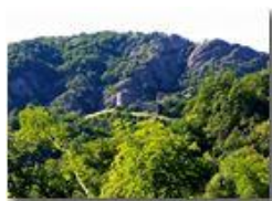
Castello Fieschi e Monte Pianetto

Pietro Marcheselli - HTC One S Nokia C7-00 (o altro cell) 2018 - Estate - Savignone - Fiori&Fauna