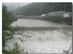
Il fiume Scrivia dopo una pioggia in maggio

Guido Marcheselli - Olympus Camedia 3000 2002 - Estate - Savignone - Paesi