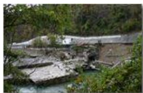
Crollo diga e strada provinciale a Ponte di Savignone

Guido Marcheselli - Canon EOS 300D 2012 - Inverno - Savignone - Paesi