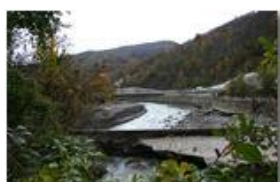
Crollo diga e strada provinciale a Ponte di Savignone

Guido Marcheselli - Canon EOS 300D 2012 - Inverno - Savignone - Paesi