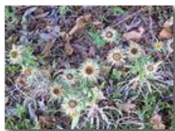
Una varietà di cirsium o una nuova costellazione?

Pietro Marcheselli - Altro/Other 2012 - Estate - Savignone - Panorami