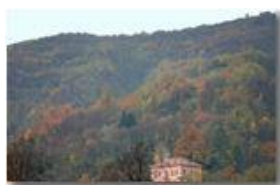
Autunno 2006: ancora qualche macchia di colore

Pietro Marcheselli - Canon EOS 300D 2007 - Inverno - Savignone - Panorami