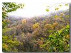
Colori autunnali in Valle Piambertone

Pietro Marcheselli - Altro/Other 2016 - Estate - Savignone - Boschi