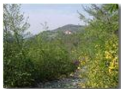
Località la Vittoria

Pietro Marcheselli - Olympus Camedia 3000 2002 - Estate - Savignone - Fiori&Fauna