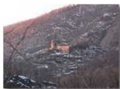
Luce al tramonto

Pietro Marcheselli - Canon Ixus 980 IS 2013 - Inverno - Savignone - Altro