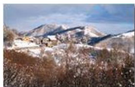
Costa di Montemaggio

Pietro Marcheselli - Canon Ixus 980 IS 2013 - Inverno - Savignone - Panorami