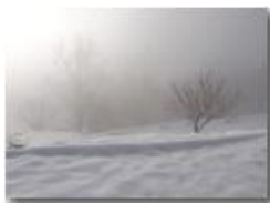
Neve e Nebbia a Montemaggio

Guido Marcheselli - HTC One/Nokia C7/Samsung S7/S10 2021 - Inverno - Savignone - Paesi