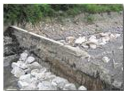
Diga: avanzamento lavori

Pietro Marcheselli - Canon Ixus 980 IS 2013 - Estate - Savignone - Boschi