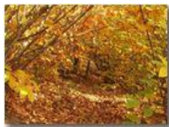
Interno di bosco in autunno

Pietro Marcheselli - Panasonic nv-gs70 (VideoCam) 2005 - Inverno - Savignone - Boschi