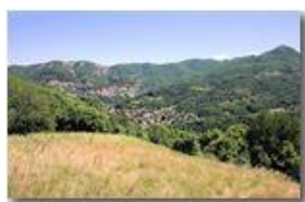
La Valle Scrivia a Savignone

Pietro Marcheselli - Canon EOS 300D 2007 - Estate - Savignone - Fiori&Fauna