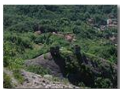
Il Castello dei Fieschi (Savignone) visto dal Pianetto

Pietro Marcheselli - Olympus Camedia 3000 <2001 - Estate - Savignone - Fiori&Fauna