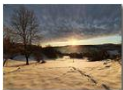
Ombre del tramonto sui prati innevati a Montemaggio

Guido Marcheselli - Olympus OM-D E-M10 Mark III 2022 - Inverno - Savignone - Boschi