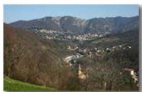
Savignone e la frazione Ponte

Pietro Marcheselli - Canon EOS 300D 2007 - Estate - Savignone - Paesi