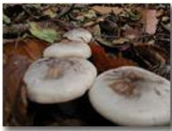
Fungo pevein ( Clitocybe nebularis )

Pietro Marcheselli - Olympus Camedia 3000 2005 - Inverno - Savignone - Fiori&Fauna