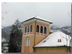
Frequente la presenza della torretta (anche detta mirador)

Pietro Marcheselli - Canon EOS 300D 2006 - Inverno - Savignone - Paesi