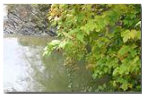
Un angolo pescoso del fiume Scrivia

Guido Marcheselli - Olympus Camedia 3000 2006 - Inverno - Savignone - Paesi