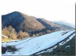
Veduta dal Monte Cappellino

Pietro Marcheselli - Canon Ixus 980 IS 2015 - Inverno - Savignone - Panorami