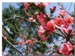
Cydonia (spina di Cristo)

Pietro Marcheselli - Panasonic nv-gs70 (VideoCam) 2004 - Estate - Savignone - Paesi