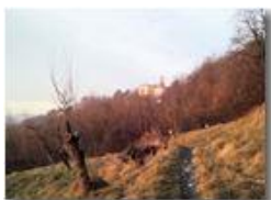
Santuario della Vittoria

Pietro Marcheselli - Altro/Other 2013 - Inverno - Savignone - Altro