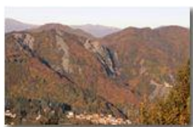
Autunno in Savignone 3

Pietro Marcheselli - Canon EOS 300D 2008 - Inverno - Savignone - Boschi