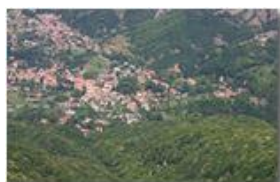
Il paese di Savignone, tra boschi e conglomerato

Pietro Marcheselli - Canon EOS 300D 2005 - Estate - Savignone - Panorami