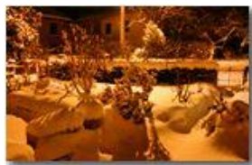
La neve della Befana

Guido Marcheselli - Canon EOS 300D 2009 - Inverno - Savignone - Altro