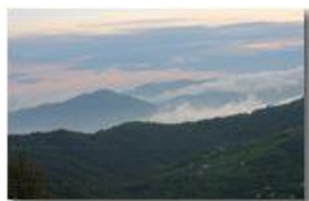
La frazione Gualdrà e il Santuario della Guaria tra le nebbie al tramonto. Da Montemaggio (Chiappazza)

Guido Marcheselli - Canon EOS 300D 2014 - Estate - Savignone - Paesi