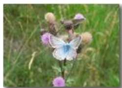
Farfalla su fiore di cirsium arvensis

Pietro Marcheselli - Canon Ixus 980 IS 2016 - Estate - Savignone - Fiori&Fauna