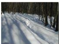
Tracce di cinghiale nella neve

Pietro Marcheselli - Olympus Camedia 3000 2005 - Inverno - Savignone - Panorami