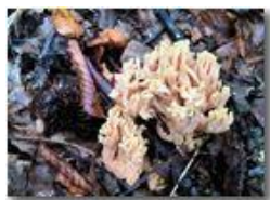
Fungo clavaria (ditola)

Pietro Marcheselli - Canon EOS 300D 2011 - Inverno - Savignone - Fiori&Fauna