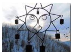
Incontro ravvicinato di tipo incognito

Pietro Marcheselli - Canon EOS 300D 2010 - Inverno - Savignone - Panorami