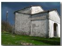
Monte Maggio: in attesa del temporal

Pietro Marcheselli - Canon Ixus 980 IS 2014 - Estate - Savignone - Panorami