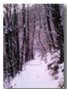
Costalovaia: la prima lieve nevicata

Pietro Marcheselli - Altro/Other 2013 - Inverno - Savignone - Panorami