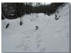
Il cane in difficoltà nella neve

Pietro Marcheselli - Olympus Camedia 3000 2005 - Inverno - Savignone - Panorami