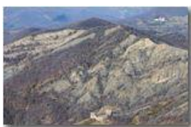
Castello Fieschi e Monte Pianetto

Pietro Marcheselli - Canon EOS 300D 2008 - Inverno - Savignone - Paesi