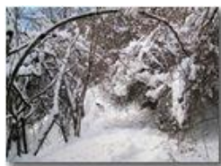
Sentiero Casella-Monte Maggio: chiuso per neve

Pietro Marcheselli - Canon Ixus 980 IS 2010 - Inverno - Savignone - Boschi