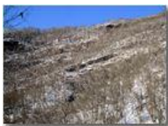
Bosco su conglomerato

Pietro Marcheselli - Canon Ixus 980 IS 2012 - Inverno - Savignone - Boschi