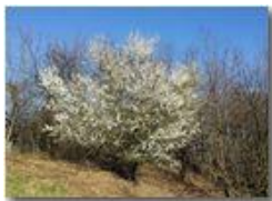
Ritorna la primavera

Pietro Marcheselli - HTC One S Nokia C7-00 (o altro cell) 2020 - Estate - Savignone - Boschi