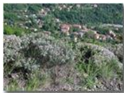
Fiori di timo

Pietro Marcheselli - Olympus Camedia 3000 2002 - Estate - Savignone - Fiori&Fauna