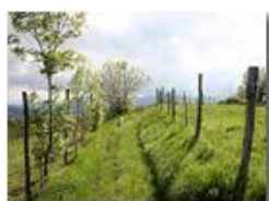
Sentiero tra pascoli

Pietro Marcheselli - Canon Ixus 980 IS 2010 - Estate - Savignone - Boschi