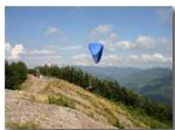
Partenza parapendio da Monte Maggio

Pietro Marcheselli - Canon EOS 300D 2005 - Estate - Savignone - Altro