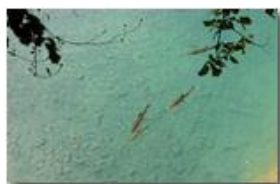
Trote(?) nel fiume Scrivia, Ponte di Savignone

Guido Marcheselli - Canon EOS 300D 2014 - Estate - Savignone - Fiori&Fauna