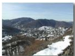
Una rara nevicata nel 2002

Pietro Marcheselli - Olympus Camedia 3000 2002 - Inverno - Savignone - Panorami