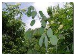
I frutti della Lunaria

Pietro Marcheselli - Olympus Camedia 3000 2004 - Estate - Savignone - Fiori&Fauna