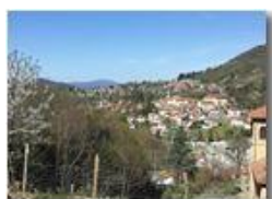
Savignone e in lontananza M. Leco

Pietro Marcheselli - HTC One/Nokia C7/Samsung S7/S10 2022 - Estate - Savignone - Panorami