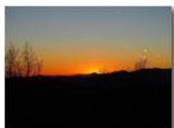
Tramonto da frazione Montemaggio

Guido Marcheselli - Olympus OM-D E-M10 Mark III 2019 - Inverno - Savignone - Paesi