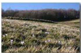
Preannuncio di primavera: i crochi

Pietro Marcheselli - Canon EOS 300D 2009 - Inverno - Savignone - Fiori&Fauna