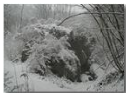
Savignone: nei boschi di Piambertone nella neve

Pietro Marcheselli - Olympus Camedia 3000 2005 - Inverno - Savignone - Boschi