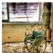
Colonia Montemaggio: interno n 2, quarto piano con carrozzella

Pietro Marcheselli - Altro/Other 2014 - Estate - Savignone - Paesi