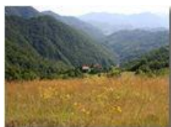
Prato estivo in località Fontanini

Pietro Marcheselli - Canon EOS 300D 2005 - Estate - Savignone - Fiori&Fauna