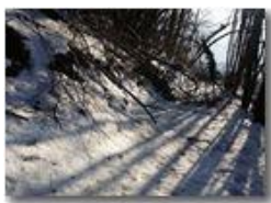
Sulla via del Pianetto

Guido Marcheselli - Olympus OM-D E-M10 Mark III 2019 - Inverno - Savignone - Paesi