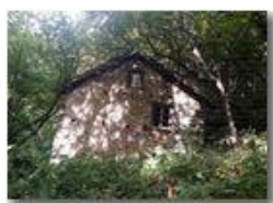
Ruderi di Case Crosti sperdute nel bosco

Pietro Marcheselli - Altro/Other 2015 - Estate - Savignone - Panorami