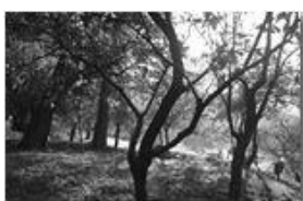
Alba a Vaccarezza

Pietro Marcheselli - Canon EOS 300D 2006 - Inverno - Savignone - Altro