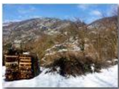
Neve di Marzo: Monte Pianetto

Pietro Marcheselli - HTC One S Nokia C7-00 (o altro cell) 2018 - Inverno - Savignone - Panorami