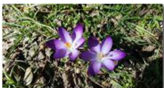
Primavera - Crocus viola

Pietro Marcheselli - HTC One S Nokia C7-00 (o altro cell) 2018 - Inverno - Savignone - Panorami