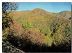
Colori d'autunno nei boschi di Savignone

Pietro Marcheselli - Canon Ixus 980 IS 2018 - Inverno - Savignone - Boschi