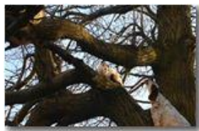
Gatto e cane

Pietro Marcheselli - Canon EOS 300D 2006 - Inverno - Savignone - Boschi