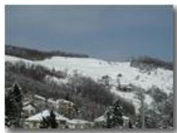
I prati di Monte Cappellino ricoperti di neve

Pietro Marcheselli - Olympus Camedia 3000 2005 - Inverno - Savignone - Panorami