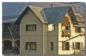
Savignone: Villa Solaro

Pietro Marcheselli - Canon EOS 300D 2007 - Inverno - Savignone - Altro