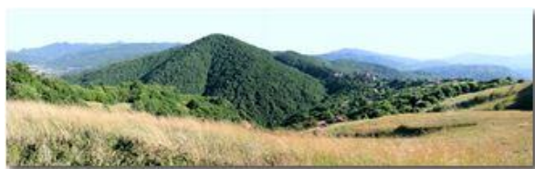
Panoramica dal Monte Cappellino: da Casella al Santuario della Vittoria

Pietro Marcheselli - Canon EOS 300D 2008 - Estate - Savignone - Paesi