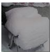
Modern design: poltroncina per l'estate

Pietro Marcheselli - Olympus Camedia 3000 2006 - Inverno - Savignone - Paesi