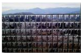
Ghiaccio alla Vittoria

Pietro Marcheselli - Altro/Other 2014 - Inverno - Savignone - Fiori&Fauna