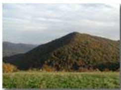
Tramonto sul M. Vittoria

Pietro Marcheselli - Olympus Camedia 3000 2002 - Inverno - Savignone - Panorami