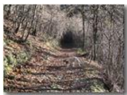
Sentiero Casella - Monte Maggio

Pietro Marcheselli - Canon Ixus 980 IS 2010 - Inverno - Savignone - Panorami