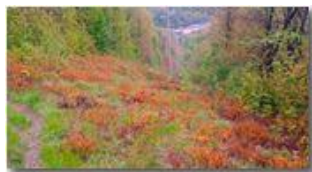
Danni al bosco dopo una tardiva gelata in aprile

Pietro Marcheselli - Altro/Other 2017 - Inverno - Savignone - Altro