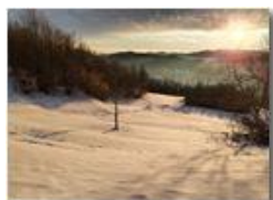
Neve a Montemaggio

Guido Marcheselli - Olympus OM-D E-M10 Mark III 2022 - Inverno - Savignone - Panorami