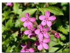
Particolare di Silene rupestris

Canon EOS 300D 2010 - Estate - Savignone - Fiori&Fauna