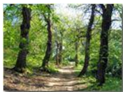
Effetti del dryocosmus kuriphilus : più luce nel castagneto

Pietro Marcheselli - Canon EOS 300D 2010 - Estate - Savignone - Fiori&Fauna