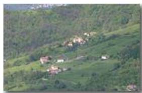
I prati di Gualdrà da Montemaggio (Chiappazza)

Guido Marcheselli - Canon EOS 300D 2014 - Estate - Savignone - Panorami