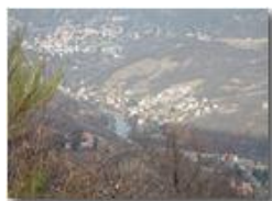
Il Ponte di Savignone dal M. Vittoria

Pietro Marcheselli - Olympus Camedia 3000 2002 - Inverno - Savignone - Boschi