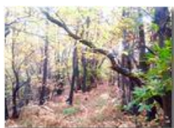
Bosco in autunno

Pietro Marcheselli - HTC One S Nokia C7-00 (o altro cell) 2018 - Inverno - Savignone - Boschi