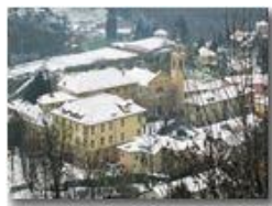
Savignone paese: veduta invernale

Pietro Marcheselli - Canon Ixus 980 IS 2010 - Inverno - Savignone - Paesi