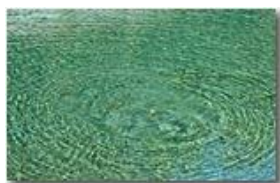
Vibrazioni sullo Scrivia

Pietro Marcheselli - Canon EOS 300D 2007 - Inverno - Savignone - Boschi