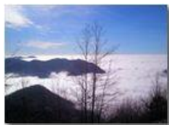
Mar Ligure: nuova versione

Pietro Marcheselli - Canon Ixus 980 IS 2013 - Inverno - Savignone - Panorami