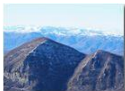
Monte Maggio e Sorrivi

Guido Marcheselli - Olympus OM-D E-M10 Mark III 2021 - Inverno - Savignone - Paesi