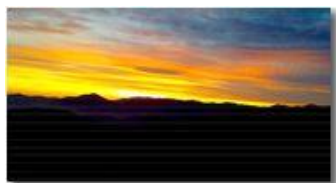
Tramonto al solstizio d'inverno: profilo dei monti a ovest della Val Polcevera (NS della Guardia, M. Pennello, M. Dorno, Piani di Dorno, M. Boccia)

Pietro Marcheselli - Canon Ixus 980 IS 2017 - Inverno - Savignone - Altro