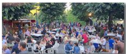
San Bartolomeo, serate gastronomiche

Pietro Marcheselli - HTC One/Nokia C7/Samsung S7/S10 2022 - Estate - Savignone - Altro