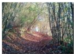
Sentiero del Monte Maggio

Pietro Marcheselli - Canon EOS 300D 2014 - Inverno - Savignone - Panorami