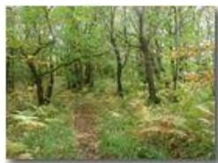
Il mio bosco in ottobre

Pietro Marcheselli - Olympus Camedia 3000 2002 - Inverno - Savignone - Boschi