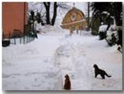
Neve di primavera alla Vittoria

Pietro Marcheselli - Canon Ixus 980 IS 2013 - Inverno - Savignone - Paesi