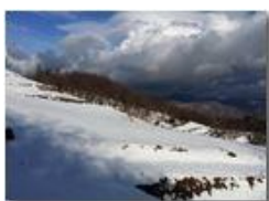
Neve di Marzo: i prati del Monte Cappellino

Pietro Marcheselli - HTC One S Nokia C7-00 (o altro cell) 2018 - Inverno - Savignone - Panorami