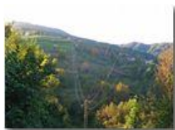
Tramonto a Gualdrà

Pietro Marcheselli - Altro/Other 2014 - Inverno - Savignone - Altro