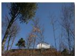
La cappella sulla vetta di M. Maggio

Pietro Marcheselli - Olympus Camedia 3000 2005 - Inverno - Savignone - Boschi