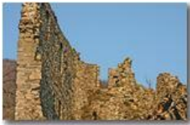
Savignone, Castello Fieschi: ruderi parzialmente restaurati (?)

Pietro Marcheselli - Canon EOS 300D 2007 - Inverno - Savignone - Boschi