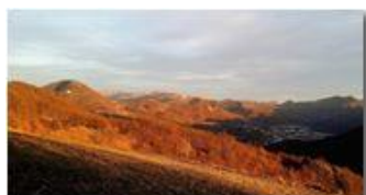
Tramonto su Casella e Monti circostanti

Pietro Marcheselli - Canon Ixus 980 IS 2017 - Inverno - Savignone - Panorami