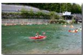
Kajak in gara

Pietro Marcheselli - Canon EOS 300D 2006 - Estate - Savignone - Fiori&Fauna