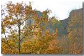
Castello Fieschi: un po' di colore sul grigio dei ruderi

Pietro Marcheselli - Canon EOS 300D 2007 - Inverno - Savignone - Paesi