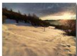
TRamonto sui prati innevati

Guido Marcheselli - Olympus OM-D E-M10 Mark III 2022 - Inverno - Savignone - Panorami