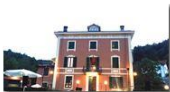
Lunedì musicali a Villa Pavanetto

Pietro Marcheselli - Altro/Other 2017 - Estate - Savignone - Panorami