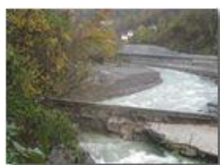
Crollo diga e strada provinciale a Ponte di Savignone: la nuova configurazione

Guido Marcheselli - Altro/Other 2012 - Inverno - Savignone - Paesi