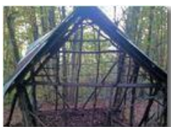
Antica struttura antisismica

Pietro Marcheselli - Canon Ixus 980 IS 2013 - Inverno - Savignone - Panorami