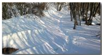
Boschi salendo a Montemaggio

Guido Marcheselli - Nokia C7-00 (o altro Smartphone) 2013 - Inverno - Savignone - Boschi