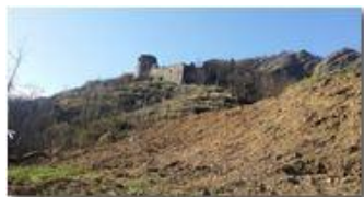
Castello Fieschi a fine inverno

Pietro Marcheselli - Altro/Other 2017 - Inverno - Savignone - Altro