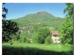
Monte Maggio versione tarda primavera

Pietro Marcheselli - Canon Ixus 980 IS 2010 - Estate - Savignone - Panorami