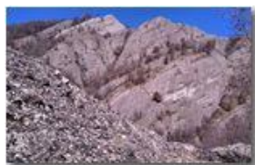
Le scoscese pareti del... M. Pianetto

Pietro Marcheselli - Canon Ixus 980 IS 2012 - Inverno - Savignone - Altro