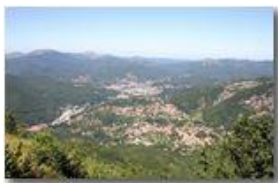
Savignone e Busalla dal Monte Maggio

Pietro Marcheselli - Canon Ixus 980 IS 2010 - Estate - Savignone - Paesi