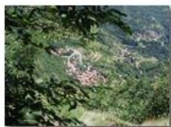
La frazione Sorrivi vista dalle rocce del M. Maggio

Pietro Marcheselli - Olympus Camedia 3000 <2001 - Estate - Savignone - Fiori&Fauna