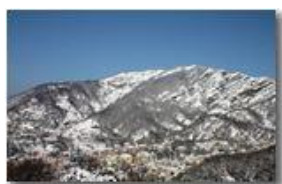
Savignone: panorama invernale con neve

Pietro Marcheselli - Canon EOS 300D 2009 - Inverno - Savignone - Paesi