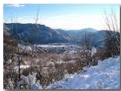
Veduta verso Casella e il mare

Pietro Marcheselli - Canon Ixus 980 IS 2013 - Inverno - Savignone - Altro