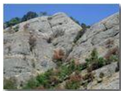
Il conglomerato di Savignone

Pietro Marcheselli - Olympus Camedia 3000 <2001 - Estate - Savignone - Fiori&Fauna