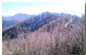
Il versante nord del Monte Pianetto

Pietro Marcheselli - Canon Ixus 980 IS 2012 - Estate - Savignone - Altro