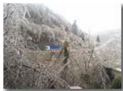
Gelicidio dell'11 dicembre

Pietro Marcheselli - Canon Ixus 980 IS 2018 - Inverno - Savignone - Altro