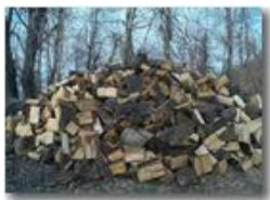
Lavori nel bosco

Pietro Marcheselli - Canon Ixus 980 IS 2014 - Estate - Savignone - Panorami