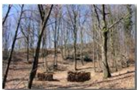
I boschi luminosi a fine inverno

Pietro Marcheselli - Canon EOS 300D 2009 - Inverno - Savignone - Fiori&Fauna