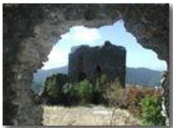
Savignone: ruderi del Castello Fieschi

Pietro Marcheselli - Olympus Camedia 3000 <2001 - Estate - Savignone - Paesi