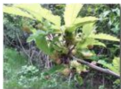
Con la primavera riappare il cinipede gallegno parassita del castagno

Pietro Marcheselli - Canon Ixus 980 IS 2012 - Estate - Savignone - Panorami