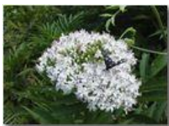
Farfalla Amata Phegea su infiorescenza

Pietro Marcheselli - Olympus Camedia 3000 2004 - Estate - Savignone - Fiori&Fauna