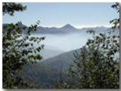
Alpe Sisa emerge dalle nebbie della Valle Scivia

Pietro Marcheselli - Olympus Camedia 3000 2002 - Inverno - Savignone - Panorami