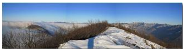
Panorama dal monte Maggio

Pietro Marcheselli - Canon Ixus 980 IS 2010 - Inverno - Savignone - Altro