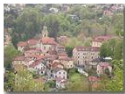
Savignone Genoa Italy

Panasonic nv-gs70 (VideoCam) 2004 - Estate - Savignone - Paesi