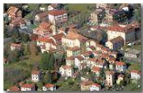
Il cuore storico del borgo di Savignone

Pietro Marcheselli - Canon EOS 300D 2008 - Inverno - Savignone - Paesi