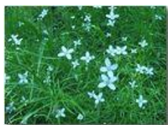
Una piccola crucifera dei boschi

Pietro Marcheselli - Panasonic nv-gs70 (VideoCam) 2004 - Estate - Savignone - Fiori&Fauna