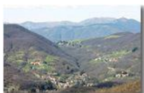
Savignone: le frazioni San Bartolomeo, Cerisola, Cereta, Vallecaldà e Vittoria

Pietro Marcheselli - Canon EOS 300D 2007 - Estate - Savignone - Paesi