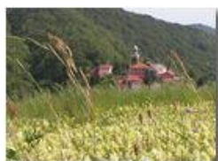
Fioritura al Sant. della Vittoria (Savignone)

Pietro Marcheselli - Panasonic nv-gs70 (VideoCam) 2004 - Estate - Savignone - Fiori&Fauna