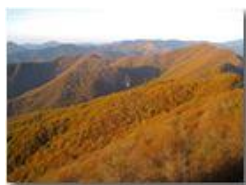
Monte Maggio: Autunno 2013

Pietro Marcheselli - Canon EOS 300D 2014 - Inverno - Savignone - Panorami