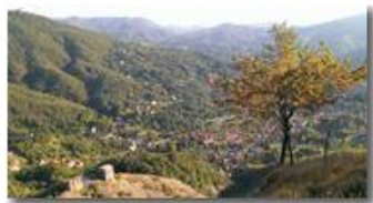
Castello e Savignone dal Pianetto

Guido Marcheselli - Nokia C7-00 (o altro Smartphone) 2014 - Inverno - Savignone - Paesi