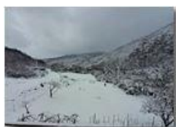
Un po' di neve in anni di scarse precipitazioni

Pietro Marcheselli - HTC One/Nokia C7/Samsung S7/S10 2023 - Inverno - Savignone - Panorami