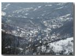
Ponte di Savignone e Besolagno innevati

Pietro Marcheselli - Olympus Camedia 3000 2005 - Inverno - Savignone - Paesi