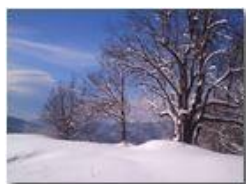
Salendo al Monte Pianetto

Pietro Marcheselli - Canon Ixus 980 IS 2013 - Inverno - Savignone - Boschi