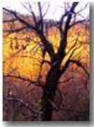
Bosco d'inverno: luci al tramonto (cellulare Nokia 70)

Pietro Marcheselli - Altro/Other 2007 - Inverno - Savignone - Boschi