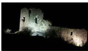
Castello Fieschi illuminato

Pietro Marcheselli - Altro/Other 2013 - Inverno - Savignone - Panorami