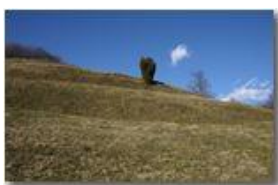
Il ginepro solitario

Pietro Marcheselli - Canon EOS 300D 2009 - Inverno - Savignone - Panorami