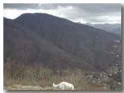
Nubi minacciose su M. Maggio

Pietro Marcheselli - Olympus Camedia 3000 2002 - Inverno - Savignone - Panorami