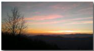
Tramonto da Montemaggio

Guido Marcheselli - Nokia C7-00 (o altro Smartphone) 2013 - Inverno - Savignone - Panorami