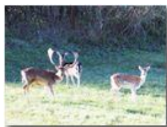
Daini al pascolo

Guido Marcheselli - Olympus OM-D E-M10 Mark III 2021 - Inverno - Savignone - Panorami