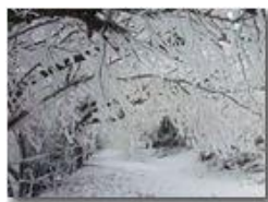
Brinata sul Monte Pianetto

Pietro Marcheselli - Canon Ixus 980 IS 2011 - Inverno - Savignone - Altro