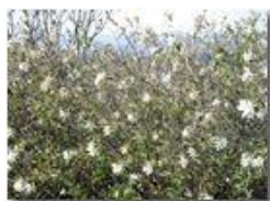
Caprifogliacea fiorita sul Monte Maggio

Pietro Marcheselli - Canon Ixus 980 IS 2011 - Estate - Savignone - Fiori&Fauna