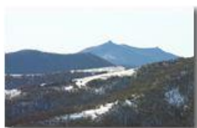
I forti di Genova: Diamante e Fratello Minore visti da nord

Pietro Marcheselli - Canon EOS 300D 2008 - Estate - Savignone - Panorami