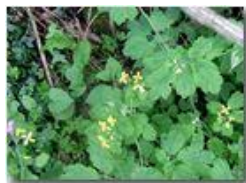
Fiori e foglie di chelidonia

Pietro Marcheselli - Olympus Camedia 3000 2002 - Estate - Savignone - Panorami