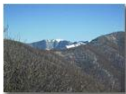
Monte Buio visto dal monte Pianetto

Pietro Marcheselli - Canon Ixus 980 IS 2010 - Inverno - Savignone - Boschi