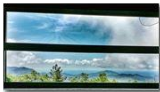
Colonia Montemaggio: camera con vista

Pietro Marcheselli - Altro/Other 2014 - Estate - Savignone - Panorami