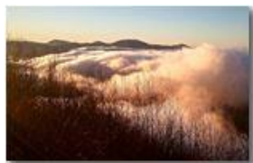
La valle annebbiata

Pietro Marcheselli - Canon Ixus 980 IS 2014 - Inverno - Savignone - Panorami