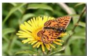
Farfalla argynnis paphia su inula

Pietro Marcheselli - Canon EOS 300D 2009 - Estate - Savignone - Fiori&Fauna