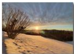
Vista al tramonto verso santuario della Guardia e monte Tobio con neve

Guido Marcheselli - Olympus OM-D E-M10 Mark III 2022 - Inverno - Savignone - Panorami