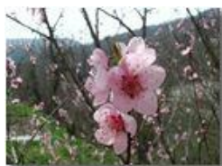
Arriva una nuova primavera

Pietro Marcheselli - Panasonic nv-gs70 (VideoCam) 2004 - Estate - Savignone - Paesi