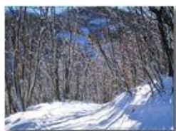
Neve di novembre

Guido Marcheselli - Canon Ixus 980 IS 2011 - Inverno - Savignone - Altro