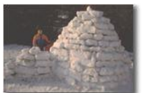
Neve e Igloo a Ponte di Savignone

Pietro Marcheselli - Scanner <2001 - Inverno - Savignone - Paesi