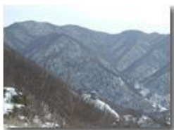
Ruderi del castello Fieschi e Costa Suià nella neve

Pietro Marcheselli - Olympus Camedia 3000 2005 - Inverno - Savignone - Panorami