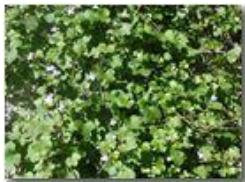
Autunno caldo: rifiorisce sui muri la Lynaria cymbalaria

Pietro Marcheselli - Olympus Camedia 3000 2002 - Inverno - Savignone - Paesi