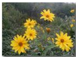
Heliantus tuberosum pianta ornamentale inselvaticata

Pietro Marcheselli - Olympus Camedia 3000 <2001 - Estate - Savignone - Panorami