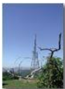
Incroci d'antenne a Monte Maggio

Pietro Marcheselli - Olympus Camedia 3000 <2001 - Estate - Savignone - Altro