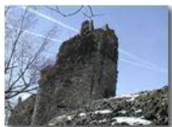
Ruderi del Castello Fieschi con neve

Pietro Marcheselli - Olympus Camedia 3000 2002 - Inverno - Savignone - Panorami