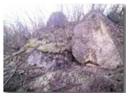
Boschi danneggiati dal gelo a inizio primavera

Pietro Marcheselli - Canon Ixus 980 IS 2011 - Estate - Savignone - Boschi