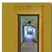
Colonia Montemaggio: inquadrature per film horror

Pietro Marcheselli - Altro/Other 2014 - Estate - Savignone - Paesi