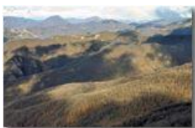
Luci ed ombre sui boschi spogli di Savignone in dicembre

Pietro Marcheselli - Canon EOS 300D 2008 - Inverno - Savignone - Panorami