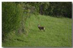
Daino al pascolo nei prati di Chiappazza (Montemaggio)

Guido Marcheselli - Canon EOS 300D 2014 - Estate - Savignone - Fiori&Fauna