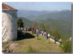
Festa della Ascensione sul M. Maggio

Pietro Marcheselli - Canon EOS 300D 2005 - Estate - Savignone - Altro