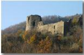
Castello Fieschi: una veduta d'insieme

Pietro Marcheselli - Altro/Other 2007 - Inverno - Savignone - Boschi