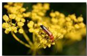
Coleottero (Rhagonyca fulva)

Pietro Marcheselli - Canon EOS 300D 2005 - Estate - Savignone - Fiori&Fauna