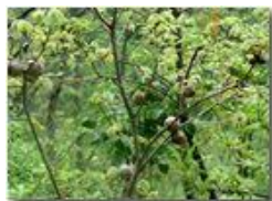
Galle su roverella

Pietro Marcheselli - Olympus Camedia 3000 2002 - Estate - Savignone - Fiori&Fauna