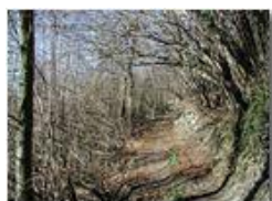
Prime luci della primavera nei boschi

Pietro Marcheselli - Olympus Camedia 3000 2002 - Estate - Savignone - Fiori&Fauna