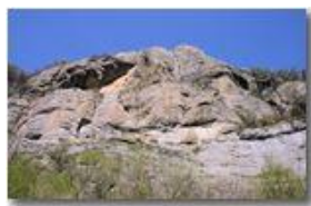
Le rocce precarie del Monte Maggio

Pietro Marcheselli - Canon Ixus 980 IS 2010 - Estate - Savignone - Panorami