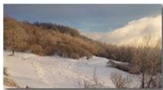
Sole, neve, e nebbie all'arrembaggio

Guido Marcheselli - HTC One S Nokia C7-00 (o altro cell) 2018 - Inverno - Savignone - Panorami