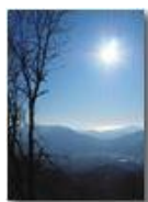
Mar ligure dal sentiero che scende da Monte Maggio

Guido Marcheselli - Olympus OM-D E-M10 Mark III 2020 - Inverno - Savignone - Panorami