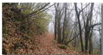
Sentieri in autunno

Pietro Marcheselli - Altro/Other 2017 - Inverno - Savignone - Panorami