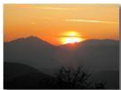
Santuario della Guardia: il tramonto al solstizio d'inverno

Pietro Marcheselli - Canon Ixus 980 IS 2010 - Inverno - Savignone - Altro