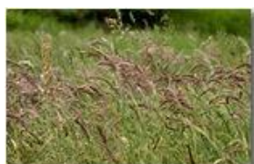
Prati di maggio: l'angolo delle graminacee

Pietro Marcheselli - Canon EOS 300D 2008 - Estate - Savignone - Fiori&Fauna