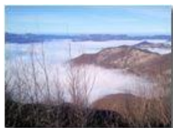
Nebbia in Liguria: Padania libera

Pietro Marcheselli - Canon Ixus 980 IS 2013 - Inverno - Savignone - Panorami