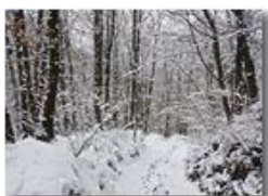
A passeggio nel bosco

Pietro Marcheselli - HTC One S Nokia C7-00 (o altro cell) 2019 - Inverno - Savignone - Boschi