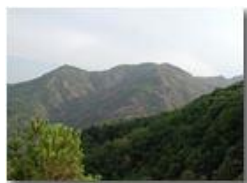
Agosto 2003: siccità nei boschi

Guido Marcheselli - Olympus Camedia 3000 2003 - Estate - Savignone - Paesi