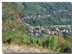
Agosto 2003: Savignone

Pietro Marcheselli - Olympus Camedia 3000 2003 - Estate - Savignone - Panorami