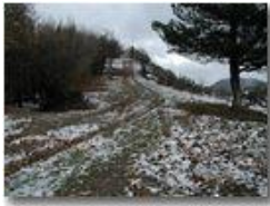
Novembre: si rivede la neve

Pietro Marcheselli - Olympus Camedia 3000 2005 - Inverno - Savignone - Panorami