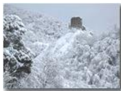
La torre del Castello

Pietro Marcheselli - Canon EOS 300D 2013 - Inverno - Savignone - Altro