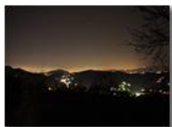
Notturmo da Chiapazza verso i forti

Pietro Marcheselli - HTC One S Nokia C7-00 (o altro cell) 2019 - Inverno - Savignone - Paesi