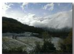
Prima neve in Valle Scivia

Pietro Marcheselli - Altro/Other 2014 - Inverno - Savignone - Altro