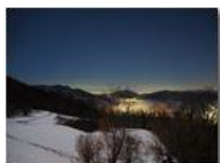
Panorama innevato notturno verso i forti di Genova

Guido Marcheselli - Olympus OM-D E-M10 Mark III 2022 - Inverno - Savignone - Panorami