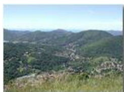
Savignone le sue frazioni e l'Alta Valle Scrivia dal M. Pianetto

Pietro Marcheselli - Olympus Camedia 3000 <2001 - Estate - Savignone - Paesi