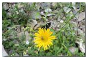
Insetti su inula

Pietro Marcheselli - Canon Ixus 980 IS 2014 - Estate - Savignone - Fiori&Fauna