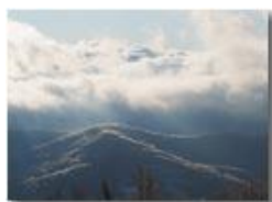
Galaverna e mare di nebbie verso Genova

Guido Marcheselli - Olympus OM-D E-M10 Mark III 2020 - Inverno - Savignone - Panorami