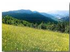
Valpolcevera (da Costa Fontanini)

Pietro Marcheselli - Altro/Other 2015 - Estate - Savignone - Fiori&Fauna