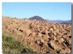
Monte Maggio, oltre le zolle

Pietro Marcheselli - Canon Ixus 980 IS 2013 - Inverno - Savignone - Panorami