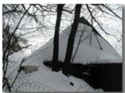
Cumuli di neve

Pietro Marcheselli - Olympus Camedia 3000 2005 - Inverno - Savignone - Paesi