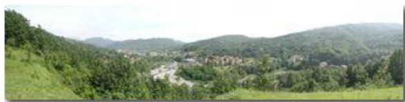
Besolagno e il ponte di Stabbio

Guido Marcheselli - Olympus Camedia 3000 <2001 - Estate - Savignone - Boschi