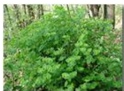
Euforbia delle faggete

Guido Marcheselli - Olympus Camedia 3000 2002 - Estate - Savignone - Paesi