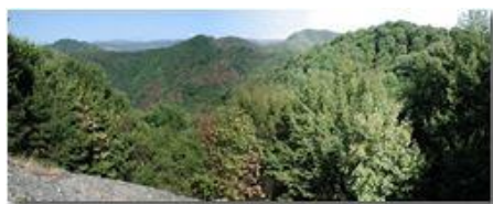
Siccità 2003: Savignone: I boschi del Pianetto

Pietro Marcheselli - Olympus Camedia 3000 2003 - Estate - Savignone - Panorami