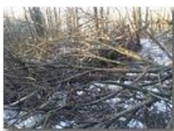
Effetto gelo: sentieri invernali

Pietro Marcheselli - HTC One S Nokia C7-00 (o altro cell) 2019 - Inverno - Savignone - Boschi