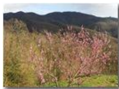
Vista primaverile su M. Maggio

Pietro Marcheselli - HTC One/Nokia C7/Samsung S7/S10 2022 - Estate - Savignone - Boschi