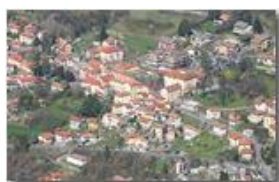
Ancora una zoomata su Savignone dal Monte Maggio

Pietro Marcheselli - Canon Ixus 980 IS 2011 - Estate - Savignone - Fiori&Fauna