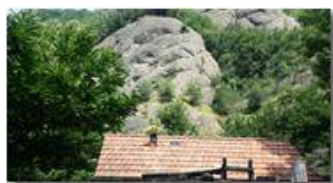
Nella valle del Rio Maggione

Pietro Marcheselli - Altro/Other 2017 - Estate - Savignone - Fiori&Fauna