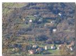
Frazione Besolagno da Chiapazza

Guido Marcheselli - Olympus OM-D E-M10 Mark III 2019 - Inverno - Savignone - Paesi