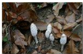
Fungo coprino chiomato

Pietro Marcheselli - Canon EOS 300D 2006 - Inverno - Savignone - Fiori&Fauna