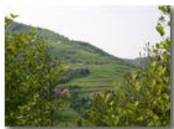
Savignone: I prati di Gualdrà

Pietro Marcheselli - Canon EOS 300D 2005 - Estate - Savignone - Panorami