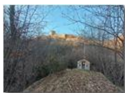
Savignone: il Castello e la Cappelletta

Pietro Marcheselli - Altro/Other 2023 - Inverno - Savignone - Boschi