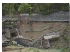
Crollo diga e strada provinciale a Ponte di Savignone: la frana

Guido Marcheselli - Canon EOS 300D 2012 - Inverno - Savignone - Paesi