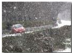
Fiocca la neve, lenta, lenta, lenta...

Pietro Marcheselli - Canon Ixus 980 IS 2010 - Inverno - Savignone - Paesi