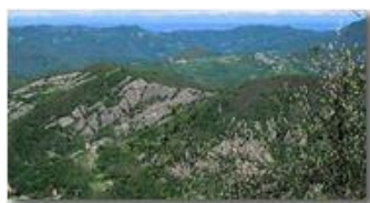
Dal M. Maggio alle Alpi

Pietro Marcheselli - Canon Ixus 980 IS 2014 - Estate - Savignone - Panorami