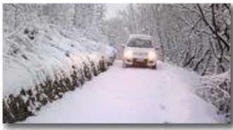
Panda (4x4) delle nevi tra Inastrà e Chiapazza

Pietro Marcheselli - Canon Ixus 980 IS 2013 - Inverno - Savignone - Paesi