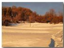
Luce al tramonto sui prati innevati

Guido Marcheselli - Olympus OM-D E-M10 Mark III 2022 - Inverno - Savignone - Panorami