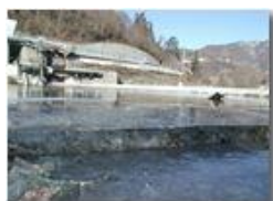
Il fiume Scrivia gelato

Pietro Marcheselli - Olympus Camedia 3000 2002 - Inverno - Savignone - Panorami