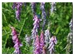
Cedrangola lupinella (Onobrychis sativa)

Pietro Marcheselli - Olympus Camedia 3000 <2001 - Estate - Savignone - Fiori&Fauna