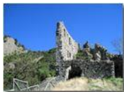
Castello Fieschi: rovine

Pietro Marcheselli - Canon Ixus 980 IS 2012 - Estate - Savignone - Altro