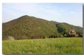
Il santuario e il Monte Vittoria

Pietro Marcheselli - Canon EOS 300D 2008 - Estate - Savignone - Fiori&Fauna