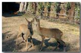
Centro accoglienza caprioli abbandonati (maschio e femmina)

Pietro Marcheselli - Canon EOS 300D 2009 - Estate - Savignone - Fiori&Fauna