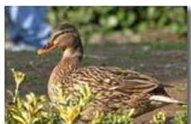
Papera (femmina di germano reale)

Pietro Marcheselli - Canon EOS 300D 2008 - Estate - Savignone - Fiori&Fauna