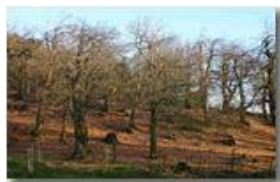
Il castagneto, ormai spoglio, della Colonia di Montemaggio

Pietro Marcheselli - Canon EOS 300D 2006 - Inverno - Savignone - Panorami