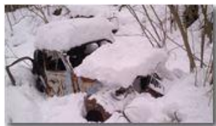
Divieto di sosta...

Pietro Marcheselli - Altro/Other 2012 - Inverno - Savignone - Altro