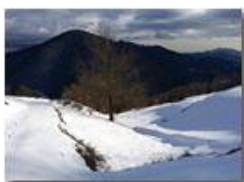
Neve di Marzo: luci e ombre sul Monte Fuea

Pietro Marcheselli - HTC One S Nokia C7-00 (o altro cell) 2018 - Inverno - Savignone - Panorami