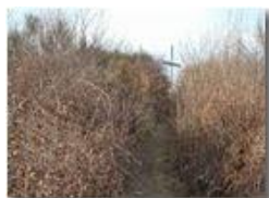
Invasione di rovi sulla vetta del M. Vittoria

Pietro Marcheselli - Olympus Camedia 3000 2002 - Inverno - Savignone - Boschi