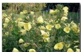
Oenothera biennis (Enoteria o enagra o rapunzia). Pianta medicinale e ornamentale a facile diffusione: fiorisce la sera

Pietro Marcheselli - Canon EOS 300D 2008 - Estate - Savignone - Altro