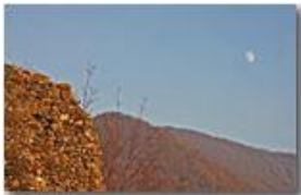
Che fai tu luna in ciel, dimmi che fai silenziosa luna?...

Pietro Marcheselli - Canon EOS 300D 2007 - Inverno - Savignone - Boschi