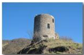
Castello Fieschi: la torre restaurata

Pietro Marcheselli - Altro/Other 2014 - Inverno - Savignone - Boschi