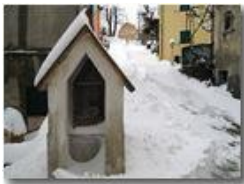
Il lungo inverno freddo: neve del 18 marzo

Pietro Marcheselli - Canon Ixus 980 IS 2013 - Inverno - Savignone - Paesi