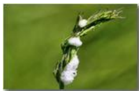
Schiuma depositata da un insetto per la difesa delle uova

Pietro Marcheselli - Canon EOS 300D 2009 - Estate - Savignone - Fiori&Fauna