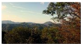
Autunno 2016: Bastia e M. Reale

Pietro Marcheselli - Altro/Other 2017 - Inverno - Savignone - Fiori&Fauna