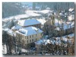
Savignone: Palazzo Fieschi e Parrocchia di San Pietro

Pietro Marcheselli - Canon Ixus 980 IS 2010 - Inverno - Savignone - Paesi