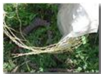
Sorpresa raccogliendo i lamponi.. una biscia

Guido Marcheselli - Olympus Camedia 3000 2005 - Estate - Savignone - Fiori&Fauna