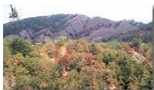
La lunga estate calda: siccità nei boschi

Pietro Marcheselli - Canon Ixus 980 IS 2012 - Estate - Savignone - Altro