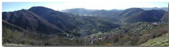
Panorama dal M. Pianetto

Guido Marcheselli - Olympus Camedia 3000 2003 - Inverno - Savignone - Altro