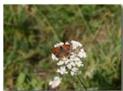
Farfalla aglais urticae

Pietro Marcheselli - Canon EOS 300D 2005 - Estate - Savignone - Fiori&Fauna