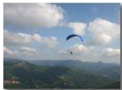
Parapendio in volo

Pietro Marcheselli - Canon EOS 300D 2005 - Estate - Savignone - Altro