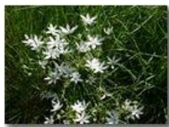
Ornithogalum umbellatum (latte di gallina)

Pietro Marcheselli - Canon EOS 300D 2005 - Estate - Savignone - Fiori&Fauna