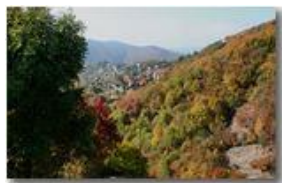
Autunno a Savignone

Pietro Marcheselli - Canon EOS 300D 2009 - Estate - Savignone - Boschi