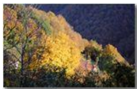
Pennellata di luce al tramonto

Pietro Marcheselli - Canon EOS 300D 2008 - Inverno - Savignone - Fiori&Fauna