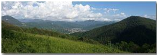
Casella: sullo sfondo la Catena dei Monti Liguri

Pietro Marcheselli - HTC One S Nokia C7-00 (o altro cell) 2020 - Estate - Savignone - Panorami