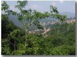
Savignone immerso nel verde dei boschi da Piambertone

Pietro Marcheselli - Olympus Camedia 3000 <2001 - Estate - Savignone - Paesi