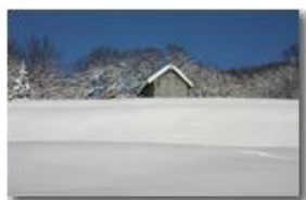
Il bianco mantello: neve

Pietro Marcheselli - Canon EOS 300D 2009 - Inverno - Savignone - Paesi