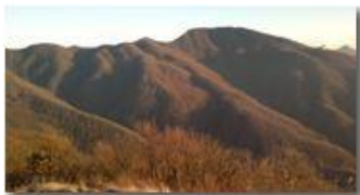
Montemaggio dal Pianetto

Guido Marcheselli - Nokia C7-00 (o altro Smartphone) 2013 - Inverno - Savignone - Paesi