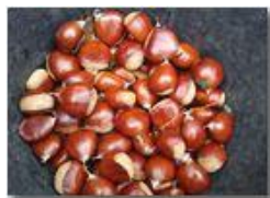
Autunno a Savignone – Frutti di stagione

Pietro Marcheselli - HTC One S Nokia C7-00 (o altro cell) 2018 - Estate - Savignone - Fiori&Fauna