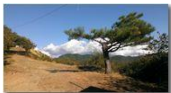
Il pino del monte Pianetto

Guido Marcheselli - HTC One S Nokia C7-00 (o altro cell) 2013 - Estate - Savignone - Panorami