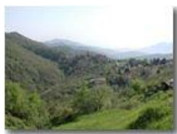
La frazione Vittoria vista dai prati del M. Cappellino

Pietro Marcheselli - Olympus Camedia 3000 <2001 - Estate - Savignone - Fiori&Fauna