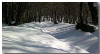
Boschi dietro la colonia di Montemaggio

Guido Marcheselli - Nokia C7-00 (o altro Smartphone) 2013 - Inverno - Savignone - Boschi