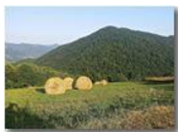
Estate sul Monte Cappellino

Pietro Marcheselli - Canon Ixus 980 IS 2015 - Estate - Savignone - Panorami