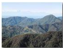
Monte Reale e Monte Rosa

Pietro Marcheselli - Canon Ixus 980 IS 2011 - Estate - Savignone - Panorami