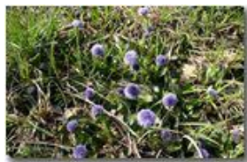
Fiori di globularia

Pietro Marcheselli - Canon EOS 300D 2006 - Estate - Savignone - Fiori&Fauna