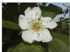
Fiore di nespole selvatico

Olympus Camedia 3000 2004 - Estate - Savignone - Fiori&Fauna