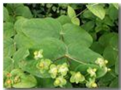
Una euphorbia erbacea

Pietro Marcheselli - Canon Ixus 980 IS 2014 - Estate - Savignone - Fiori&Fauna