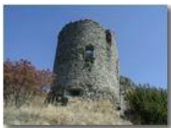
Savignone: ruderi del Castello Fieschi

Pietro Marcheselli - Olympus Camedia 3000 <2001 - Estate - Savignone - Paesi