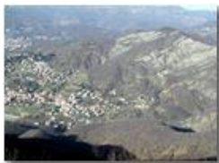
Savignone dal M. Maggio ad inizio inverno

Pietro Marcheselli - Olympus Camedia 3000 2002 - Inverno - Savignone - Boschi