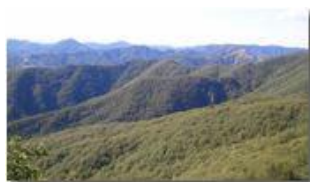
Ritornano verdi i boschi di Savignone

Pietro Marcheselli - Canon Ixus 980 IS 2013 - Estate - Savignone - Panorami