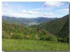
L'apertura della Valle Scivia a Casella

Pietro Marcheselli - Canon Ixus 980 IS 2016 - Estate - Savignone - Panorami