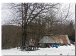
Neve di Marzo: salendo al monte Pianetto

Guido Marcheselli - HTC One S Nokia C7-00 (o altro cell) 2018 - Inverno - Savignone - Panorami