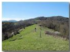
Costa dei Fontanini e Monte Vittoria

Pietro Marcheselli - Altro/Other 2011 - Estate - Savignone - Panorami