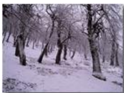
Il bosco della Colonia di Montemaggio

Pietro Marcheselli - Canon Ixus 980 IS 2015 - Inverno - Savignone - Paesi