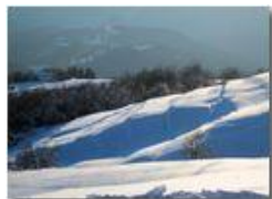
I prati di Maggetta

Guido Marcheselli - Nokia C7-00 (o altro Smartphone) 2013 - Inverno - Savignone - Panorami