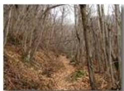
Bosco d' inverno

Pietro Marcheselli - Olympus Camedia 3000 2002 - Inverno - Savignone - Boschi