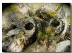
Le occhiaie vuote di un vecchio ceppo di castagno

Pietro Marcheselli - HTC One S Nokia C7-00 (o altro cell) 2018 - Estate - Savignone - Panorami