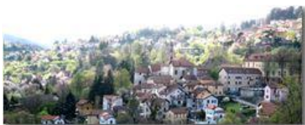
Savignone in primavera

Pietro Marcheselli - Canon EOS 300D 2010 - Estate - Savignone - Paesi