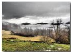
Luci da tempesta

Guido Marcheselli - Olympus OM-D E-M10 Mark III 2021 - Inverno - Savignone - Paesi