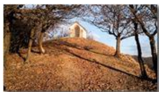
Luce del solstizio del secco inverno 2011: Monte Pianetto

Pietro Marcheselli - Canon Ixus 980 IS 2012 - Inverno - Savignone - Altro