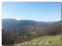
Veduta dal Castello Fieschi

Pietro Marcheselli - Canon Ixus 980 IS 2014 - Inverno - Savignone - Panorami