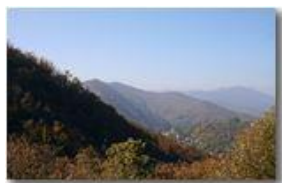
Autunno a Savignone

Pietro Marcheselli - Canon EOS 300D 2009 - Estate - Savignone - Boschi