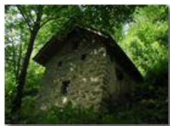
Cascina abbandonata nei boschi

Pietro Marcheselli - Olympus Camedia 3000 <2001 - Estate - Savignone - Paesi