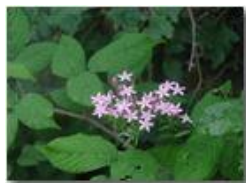
Centaurea minore (erythraea centaurium)

Pietro Marcheselli - Olympus Camedia 3000 <2001 - Estate - Savignone - Fiori&Fauna