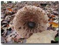
Mazza di tamburo

Pietro Marcheselli - Olympus Camedia 3000 2005 - Inverno - Savignone - Panorami