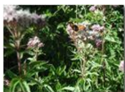
Canapa acquatica (eupatorium)

Pietro Marcheselli - Olympus Camedia 3000 <2001 - Estate - Savignone - Panorami