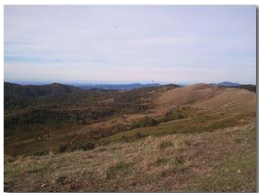
Autunno 2012 al Castello

Pietro Marcheselli - Altro/Other 2013 - Inverno - Savignone - Paesi