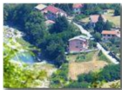
Fiume Scrivia in secca a Ponte di Savignone

Pietro Marcheselli - Altro/Other 2017 - Estate - Savignone - Panorami