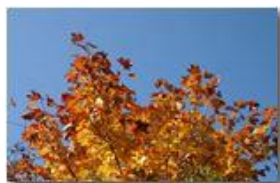
Colori di autunno: un acero

Pietro Marcheselli - Canon EOS 300D 2006 - Inverno - Savignone - Panorami