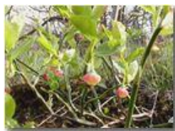
Fiori di mirtillo (videocamera Panasonic nv-gs70)

Pietro Marcheselli - Olympus Camedia 3000 2004 - Estate - Savignone - Fiori&Fauna