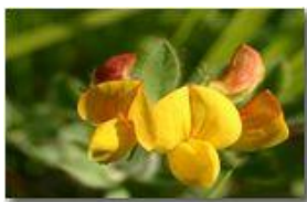
Un comune fiore dei prati: coronilla vaginalis

Pietro Marcheselli - Canon EOS 300D 2006 - Estate - Savignone - Boschi