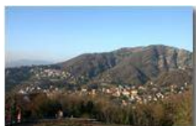
Savignone e monte Pianetto, dicembre 2005

Pietro Marcheselli - Canon EOS 300D 2006 - Inverno - Savignone - Panorami