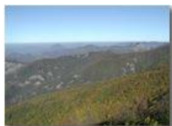
Dal M. Maggio: oltre le nebbie padane un indistinto M. Rosa

Pietro Marcheselli - Olympus Camedia 3000 2002 - Inverno - Savignone - Fiori&Fauna