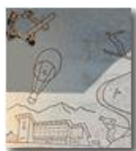
Colonia di Montemaggio: particolare futurista della facciata

Pietro Marcheselli - Canon EOS 300D 2007 - Estate - Savignone - Altro