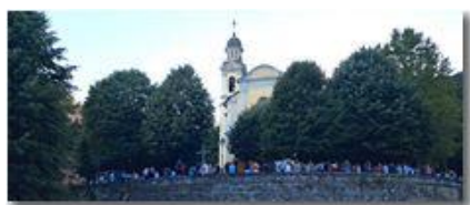
San Bartolomeo, serate gastronomiche

Pietro Marcheselli - HTC One/Nokia C7/Samsung S7/S10 2022 - Estate - Savignone - Panorami