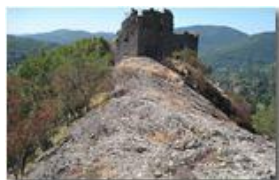
La lunga estate calda: Castello Fieschi

Pietro Marcheselli - Canon Ixus 980 IS 2012 - Estate - Savignone - Altro