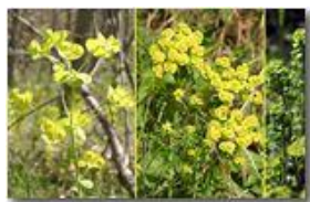
Tre diffusissime euphorbie : amigdaloides, cyparissias, helioscopia

Pietro Marcheselli - Canon EOS 300D 2008 - Estate - Savignone - Fiori&Fauna