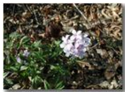
Il fiore della Dentaria

Pietro Marcheselli - Olympus Camedia 3000 2002 - Estate - Savignone - Fiori&Fauna