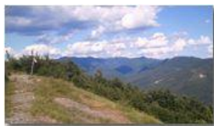
Val Brevenna da Monte Maggio

Pietro Marcheselli - Altro/Other 2013 - Estate - Savignone - Altro