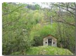
Cappelletta del Castello

Pietro Marcheselli - HTC One/Nokia C7/Samsung S7/S10 2022 - Estate - Savignone - Fiori&Fauna