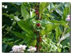
Bacche di tamus communis su castagno

Pietro Marcheselli - Canon EOS 300D 2005 - Estate - Savignone - Fiori&Fauna