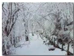
Brinata sul Monte Pianetto

Pietro Marcheselli - Canon Ixus 980 IS 2013 - Inverno - Savignone - Altro