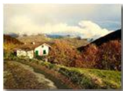
Pendici M. Cappellino: panorama autunnale

Pietro Marcheselli - HTC One S Nokia C7-00 (o altro cell) 2018 - Inverno - Savignone - Panorami