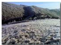
Capodanno 2009 al santuario Vittoria: inizio era glaciale (Nokia 70)

Pietro Marcheselli - Canon EOS 300D 2009 - Inverno - Savignone - Boschi