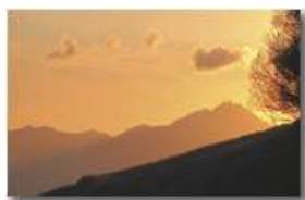
Santuario N.S. Guardia: luci al tramonto

Pietro Marcheselli - Canon Ixus 980 IS 2011 - Inverno - Savignone - Boschi