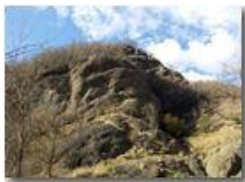
Conglomerato nella valle del rio Maggione

Pietro Marcheselli - HTC One S Nokia C7-00 (o altro cell) 2020 - Estate - Savignone - Fiori&Fauna