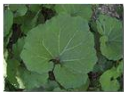
Le grandi foglie di una gunnera

Pietro Marcheselli - Canon Ixus 980 IS 2014 - Estate - Savignone - Fiori&Fauna