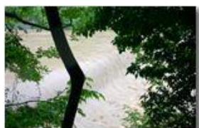
Giugno 2008: fiume Scrivia dopo le abbondanti precipitazioni

Pietro Marcheselli - Canon EOS 300D 2008 - Estate - Savignone - Panorami