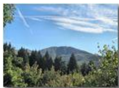
Cielo sul Monte Maggio

Guido Marcheselli - Canon EOS 300D 2012 - Inverno - Savignone - Paesi