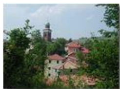
Il santuario della Vittoria

Pietro Marcheselli - Olympus Camedia 3000 <2001 - Estate - Savignone - Paesi