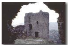
Castello Fieschi - Savignone

Guido Marcheselli - Olympus Camedia 3000 <2001 - Foto varie - Savignone - Paesi