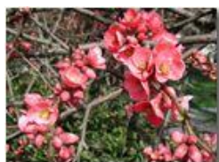
Fioritura di cydonia japonica

Pietro Marcheselli - Olympus Camedia 3000 2002 - Estate - Savignone - Fiori&Fauna