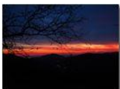
Tramonto invernale verso i forti di Genova e il mare

Pietro Marcheselli - HTC One S Nokia C7-00 (o altro cell) 2019 - Inverno - Savignone - Boschi