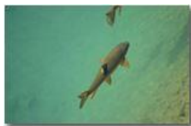
Trota(?) nel fiume Scrivia, Ponte di Savignone

Guido Marcheselli - HTC One S Nokia C7-00 (o altro cell) 2014 - Estate - Savignone - Panorami