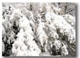
6 Febbraio: prima neve a Savignone

Pietro Marcheselli - Canon Ixus 980 IS 2018 - Inverno - Savignone - Altro