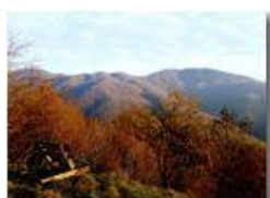
Boschi di Savignone

Pietro Marcheselli - HTC One S Nokia C7-00 (o altro cell) 2019 - Inverno - Savignone - Panorami