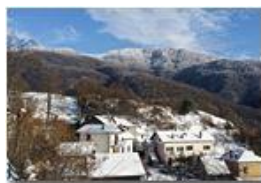
Neve di Marzo: Castello Rosso e Monte Maggio

Pietro Marcheselli - HTC One S Nokia C7-00 (o altro cell) 2018 - Inverno - Savignone - Paesi