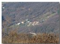
Frazione Vallecaldà da Montemaggio

Guido Marcheselli - Olympus OM-D E-M10 Mark III 2019 - Inverno - Savignone - Paesi