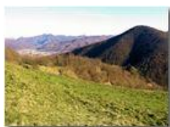
Casella e l'Appennino: Monte Acuto, Monte Bano, Monte Vittoria

Pietro Marcheselli - Altro/Other 2015 - Inverno - Savignone - Fiori&Fauna