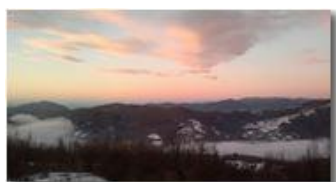
Alba da Montemaggio - Chiapazza

Guido Marcheselli - Nokia C7-00 (o altro Smartphone) 2013 - Inverno - Savignone - Panorami