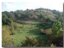
Fieno sul Monte Albarino

Pietro Marcheselli - Olympus Camedia 3000 <2001 - Estate - Savignone - Panorami