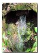
Sorgente nel bosco

Pietro Marcheselli - Canon EOS 300D 2010 - Estate - Savignone - Boschi