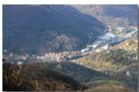
Zona commerciale, frazione Canalborzone

Pietro Marcheselli - Canon EOS 300D 2008 - Inverno - Savignone - Boschi