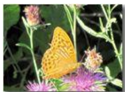
Una farfalla argynnis aglaia su fiore di centaurea

Pietro Marcheselli - Canon Ixus 980 IS 2010 - Estate - Savignone - Fiori&Fauna