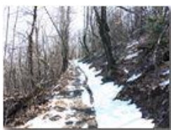
Neve di marzo sul M. Pianetto

Pietro Marcheselli - Olympus Camedia 3000 2005 - Inverno - Savignone - Boschi