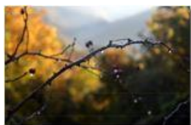
Rovo e rugiada

Pietro Marcheselli - Olympus Camedia 3000 2006 - Inverno - Savignone - Panorami