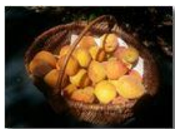
Le mie albicocche

Pietro Marcheselli - Canon Ixus 980 IS 2016 - Estate - Savignone - Fiori&Fauna