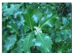
Fiori di agrifoglio

Pietro Marcheselli - Olympus Camedia 3000 2004 - Estate - Savignone - Fiori&Fauna