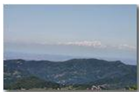
Monterosa e Pianura padana dal Monte Maggio

Pietro Marcheselli - Canon EOS 300D 2011 - Estate - Savignone - Panorami