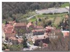
Savignone: La Piazza della Chiesa

Pietro Marcheselli - Panasonic nv-gs70 (VideoCam) 2004 - Estate - Savignone - Paesi