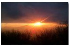
Finalmente si rivede il sole

Pietro Marcheselli - HTC One S Nokia C7-00 (o altro cell) 2013 - Inverno - Savignone - Altro