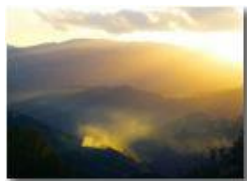
Controluce in Val Polcevera

Pietro Marcheselli - Altro/Other 2017 - Inverno - Savignone - Panorami