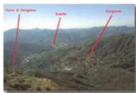
Panorama dal Monte Maggio m. 978

Pietro Marcheselli - Olympus Camedia 3000 <2001 - Estate - Savignone - Paesi