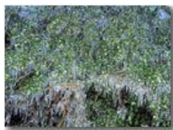
Siepe con decorazioni di ghiaccio

Pietro Marcheselli - Canon Ixus 980 IS 2011 - Inverno - Savignone - Altro