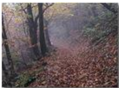
Autunno nel bosco

Pietro Marcheselli - Olympus Camedia 3000 2005 - Inverno - Savignone - Fiori&Fauna