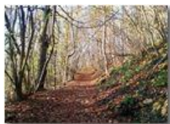
Sentieri in autunno

Pietro Marcheselli - Altro/Other 2017 - Inverno - Savignone - Boschi