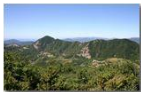
Il Monte Maggio con la Costa Suia

Guido Marcheselli - Olympus Camedia 3000 2005 - Estate - Savignone - Fiori&Fauna