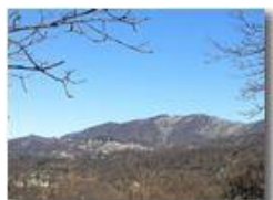
Savignone e il Monte Pianetto

Pietro Marcheselli - Altro/Other 2016 - Inverno - Savignone - Altro