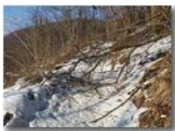
Passeggiata con ostacoli

Pietro Marcheselli - HTC One S Nokia C7-00 (o altro cell) 2019 - Inverno - Savignone - Boschi