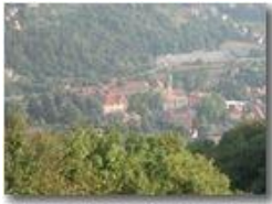
La piazza di Savignone ripresa verso sera a fine agosto dal M. Pianetto

Pietro Marcheselli - Olympus Camedia 3000 <2001 - Estate - Savignone - Paesi