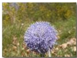
Globularia (videocamera Panasonic nv-gs70)

Pietro Marcheselli - Olympus Camedia 3000 2004 - Estate - Savignone - Fiori&Fauna