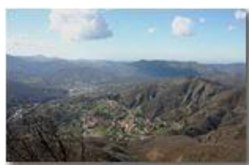
Una rara giornata di sole nel mese di marzo

Pietro Marcheselli - Canon EOS 300D 2006 - Estate - Savignone - Panorami