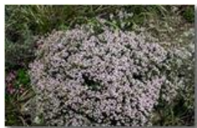
Cuscinetto di timo serpillio

Pietro Marcheselli - Canon EOS 300D 2008 - Estate - Savignone - Fiori&Fauna