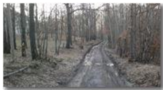
Da Ramà a Ponte di Savignone

Guido Marcheselli - Nokia C7-00 (o altro Smartphone) 2013 - Inverno - Savignone - Boschi