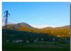
Monte Maggio da Besolagno

Pietro Marcheselli - Altro/Other 2017 - Inverno - Savignone - Fiori&Fauna