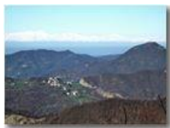
Dal Monte Reale al Monte Rosa

Pietro Marcheselli - Canon Ixus 980 IS 2010 - Inverno - Savignone - Panorami