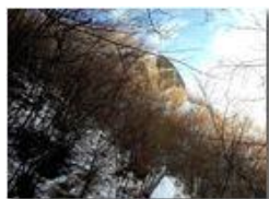
Neve di Maro: nella valle del Rio Maggione

Pietro Marcheselli - HTC One S Nokia C7-00 (o altro cell) 2018 - Inverno - Savignone - Boschi