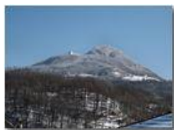
Un brizzolato Monte Maggio

Pietro Marcheselli - Canon Ixus 980 IS 2010 - Inverno - Savignone - Panorami