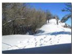
Neve sul monte Pianetto

Pietro Marcheselli - Altro/Other 2010 - Inverno - Savignone - Panorami