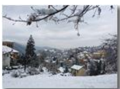
Savignone: cartolina invernale

Pietro Marcheselli - HTC One S Nokia C7-00 (o altro cell) 2019 - Inverno - Savignone - Panorami