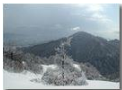
Monte Vittoria ricoperto di neve

Pietro Marcheselli - Olympus Camedia 3000 2005 - Inverno - Savignone - Panorami