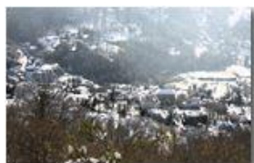
Neve novembrina sui tetti di Savignone

Pietro Marcheselli - Canon EOS 300D 2006 - Inverno - Savignone - Panorami