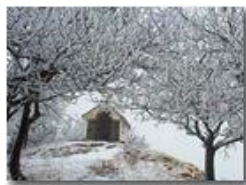
Brinata sul Monte Pianetto

Pietro Marcheselli - Canon Ixus 980 IS 2013 - Inverno - Savignone - Altro