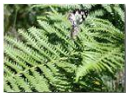
Farfalla del genere arctia su felci

Pietro Marcheselli - Olympus Camedia 3000 <2001 - Estate - Savignone - Panorami