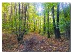
Sentieri in autunno

Pietro Marcheselli - Altro/Other 2017 - Inverno - Savignone - Boschi