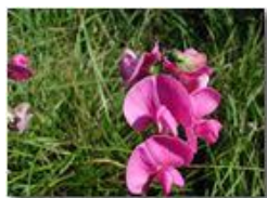
Lathirus silvestris (Cicerchione Pisello odoroso)

Pietro Marcheselli - Olympus Camedia 3000 <2001 - Estate - Savignone - Fiori&Fauna