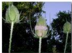
Infiorescenze di dipsacus silvester

Pietro Marcheselli - Olympus Camedia 3000 2003 - Inverno - Savignone - Fiori&Fauna