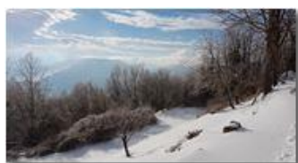
Neve, ghiaccio e sole

Guido Marcheselli - HTC One S Nokia C7-00 (o altro cell) 2018 - Inverno - Savignone - Panorami