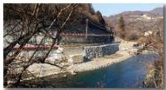
Lavori di consolidamento argine Scrivia, a Ponte di Savignone

Pietro Marcheselli - Canon Ixus 980 IS 2017 - Inverno - Savignone - Altro