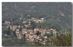
Variazioni stagionali: il paese di Savignone in marzo

Pietro Marcheselli - Canon EOS 300D 2007 - Estate - Savignone - Paesi