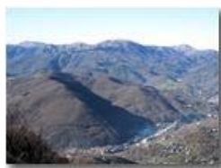
Frazione Ponte di Savignone

Pietro Marcheselli - Canon Ixus 980 IS 2010 - Inverno - Savignone - Panorami