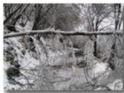
La gelata del 22 dicembre

Pietro Marcheselli - Canon Ixus 980 IS 2010 - Inverno - Savignone - Panorami