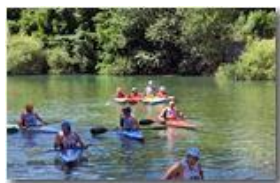
Canoisti nel fiume Scivia

Pietro Marcheselli - Canon EOS 300D 2007 - Estate - Savignone - Panorami