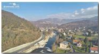
Ponte di Savignone

- Altro/Other 2015 - Inverno - Savignone - Paesi