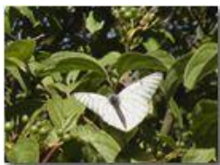
Una aporia crataegis ad ali aperte

Pietro Marcheselli - Olympus Camedia 3000 2004 - Estate - Savignone - Fiori&Fauna