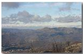
Veduta sulle Alpi dal Monte Maggio

Pietro Marcheselli - Canon EOS 300D 2008 - Inverno - Savignone - Panorami