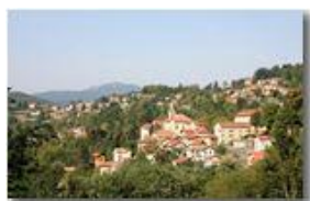
Savignone: il centro del paese

Pietro Marcheselli - Canon EOS 300D 2009 - Estate - Savignone - Altro