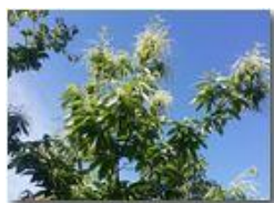
Amenti di castagno: il cinipede sembra sconfitto

Pietro Marcheselli - Canon Ixus 980 IS 2016 - Estate - Savignone - Panorami