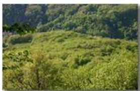
Trionfo dei verdi (i colori!) in Val Seminella

Pietro Marcheselli - Canon EOS 300D 2006 - Estate - Savignone - Boschi