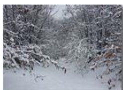
Sentiero nei boschi di Costalovaia

Pietro Marcheselli - Altro/Other 2015 - Inverno - Savignone - Altro