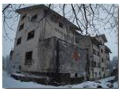
Colonia abbandonata: versante nor

Pietro Marcheselli - Canon Ixus 980 IS 2015 - Inverno - Savignone - Panorami