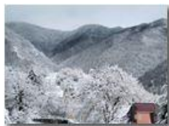
Un po' di colore nel paesaggio

Pietro Marcheselli - Canon EOS 300D 2013 - Inverno - Savignone - Paesi