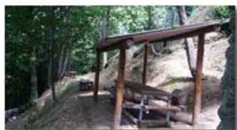
Un invito alla sosta

Pietro Marcheselli - Altro/Other 2017 - Estate - Savignone - Panorami