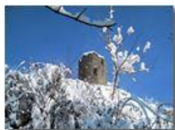
Castello Fieschi: il torrione di guardia

Pietro Marcheselli - Canon Ixus 980 IS 2012 - Inverno - Savignone - Panorami