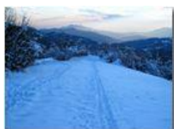
Vista sulla Val Polcevera

Pietro Marcheselli - Canon Ixus 980 IS 2013 - Inverno - Savignone - Panorami