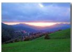
Contrasti di luce sulla Val Polcevera

Guido Marcheselli - Canon EOS 300D 2013 - Inverno - Savignone - Paesi