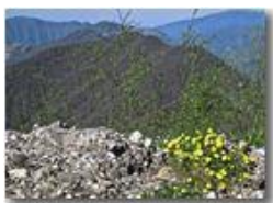
Fioritura sul conglomerato

Pietro Marcheselli - Canon Ixus 980 IS 2014 - Estate - Savignone - Paesi