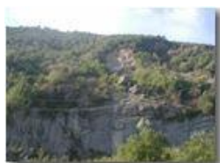
La vecchia frana di M. Maggio

Pietro Marcheselli - Olympus Camedia 3000 <2001 - Estate - Savignone - Fiori&Fauna