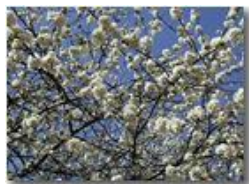
Amareno in fiore

Pietro Marcheselli - Olympus Camedia 3000 2002 - Estate - Savignone - Fiori&Fauna