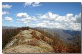
Cielo di primavera

Pietro Marcheselli - Canon EOS 300D 2006 - Estate - Savignone - Fiori&Fauna