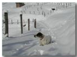
Pendici Monte Cappellino innevate

Pietro Marcheselli - Olympus Camedia 3000 2005 - Inverno - Savignone - Panorami