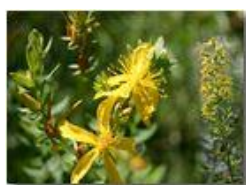
Il fiore dell'iperico e una pianticella di solidago virga aurea

Pietro Marcheselli - Canon EOS 300D 2005 - Estate - Savignone - Fiori&Fauna