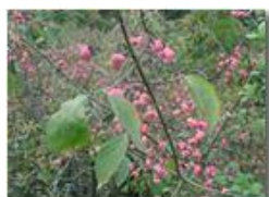
Evonio (Cappello da prete)

Pietro Marcheselli - Olympus Camedia 3000 2002 - Inverno - Savignone - Fiori&Fauna