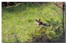
Volpe sorpresa sopra la frazione Cerisola

Pietro Marcheselli - Canon EOS 300D 2008 - Inverno - Savignone - Paesi