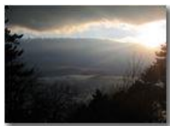
Ombre e luci in paesaggio invernale

Pietro Marcheselli - Altro/Other 2010 - Inverno - Savignone - Panorami