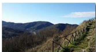
Veduta di San Bartolomeo di Vallecaldà dal Castello Fieschi

Pietro Marcheselli - Canon Ixus 980 IS 2017 - Inverno - Savignone - Boschi