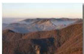
Mancano pochi giorni al solstizio d'inverno: luci al tramonto sul monte Reopasso

Pietro Marcheselli - Canon EOS 300D 2006 - Inverno - Savignone - Panorami