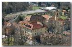
Savignone: Palazzo Fieschi e Parrocchia di San Pietro

Pietro Marcheselli - Canon EOS 300D 2009 - Inverno - Savignone - Paesi