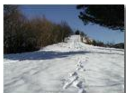
La cappelletta del M. Pianetto di Savignone innevata

Pietro Marcheselli - Olympus Camedia 3000 2003 - Inverno - Savignone - Panorami