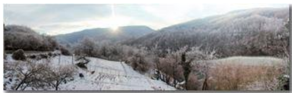
Capodanno con neve e ghiaccio a Ponte di Savignone

Pietro Marcheselli - Canon EOS 300D 2006 - Inverno - Savignone - Boschi