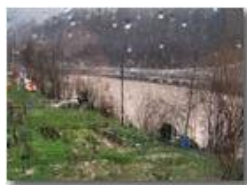
Pioggia oltre i vetri

Canon Ixus 980 IS 2010 - Inverno - Savignone - Altro