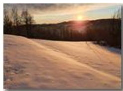
Vista su Gualdra' innevata da Montemaggio

Guido Marcheselli - Olympus OM-D E-M10 Mark III 2022 - Inverno - Savignone - Panorami