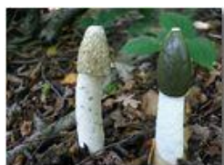
Fungo Phallus impudicus (satirione)

Pietro Marcheselli - Canon EOS 300D 2006 - Inverno - Savignone - Panorami