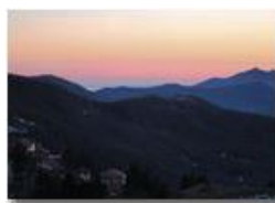
Corsica: c'è...non c'è?

Pietro Marcheselli - Canon Ixus 980 IS 2013 - Inverno - Savignone - Altro