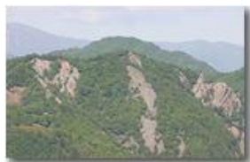
Il conglomerato del Monte Pianetto

Pietro Marcheselli - Canon EOS 300D 2007 - Estate - Savignone - Panorami