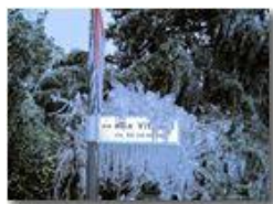
Segnaletica nell' Era glaciale

Pietro Marcheselli - Canon Ixus 980 IS 2009 - Estate - Savignone - Altro