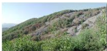
Siccità 2003: Savignone: I boschi del Pianetto

Pietro Marcheselli - Olympus Camedia 3000 2004 - Inverno - Savignone - Altro