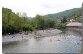
Kayak in gara

Pietro Marcheselli - Canon EOS 300D 2007 - Estate - Savignone - Altro