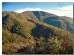
Colori d'autunno nei boschi di Savignone

Pietro Marcheselli - Canon Ixus 980 IS 2018 - Inverno - Savignone - Boschi