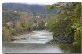
Autunno lungo il fiume Scrivia a Ponte di Savignone

Pietro Marcheselli - Canon EOS 300D 2006 - Inverno - Savignone - Fiori&Fauna