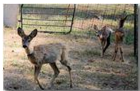
Centro accoglienza caprioli abbandonati (in libertà momentaneamente vigilata)

Pietro Marcheselli - Canon EOS 300D 2009 - Estate - Savignone - Fiori&Fauna