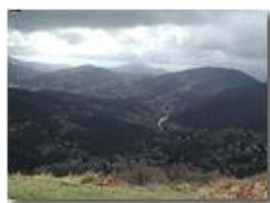
Luci ed ombre dal M. Pianetto

Pietro Marcheselli - Olympus Camedia 3000 2002 - Estate - Savignone - Boschi