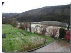
Piena del fiume Scrivia del 26-11

Pietro Marcheselli - Olympus Camedia 3000 2003 - Inverno - Savignone - Panorami