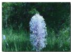
Il fiore di una comune piantaggine

Pietro Marcheselli - Olympus Camedia 3000 2004 - Estate - Savignone - Fiori&Fauna