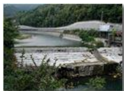
Agosto 2003: il fiume Scrivia con portata minima

Pietro Marcheselli - Olympus Camedia 3000 2003 - Estate - Savignone - Panorami