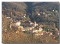
Veduta di Savignone da NO

Pietro Marcheselli - HTC One S Nokia C7-00 (o altro cell) 2019 - Inverno - Savignone - Paesi