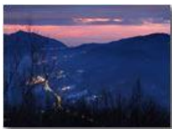
Tramonto con neve verso il mar Ligure

Guido Marcheselli - Olympus OM-D E-M10 Mark III 2021 - Inverno - Savignone - Panorami