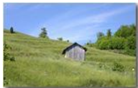
Variazioni stagionali: prati del Monte Cappellino in maggio

Pietro Marcheselli - Canon EOS 300D 2007 - Estate - Savignone - Panorami