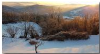
Neve e tramonto

Guido Marcheselli - HTC One S Nokia C7-00 (o altro cell) 2018 - Inverno - Savignone - Panorami