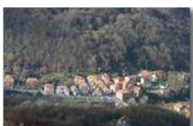
Frazione Ponte di Savignone

Pietro Marcheselli - Canon EOS 300D 2008 - Inverno - Savignone - Paesi