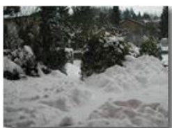
Sorpresa aprendo l'uscio: la neve!

Guido Marcheselli - Olympus Camedia 3000 2005 - Inverno - Savignone - Paesi