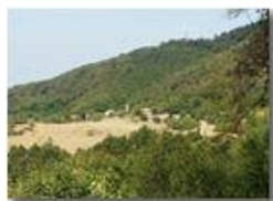
Frazione Montemaggio di Savignone

Pietro Marcheselli - Canon Ixus 980 IS 2017 - Estate - Savignone - Boschi