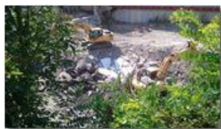
Sono iniziati i lavori alla diga della ex "Filanda"

Pietro Marcheselli - Canon Ixus 980 IS 2013 - Estate - Savignone - Altro