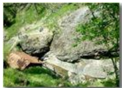
Un angolo del Rio Maggione

Pietro Marcheselli - HTC One S Nokia C7-00 (o altro cell) 2018 - Estate - Savignone - Boschi