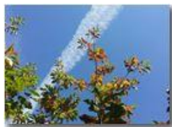
Castagni dopo la lunga estate secca

Pietro Marcheselli - Canon Ixus 980 IS 2016 - Estate - Savignone - Fiori&Fauna