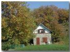
Pendici M. Pianetto

Pietro Marcheselli - Olympus Camedia 3000 2002 - Inverno - Savignone - Panorami