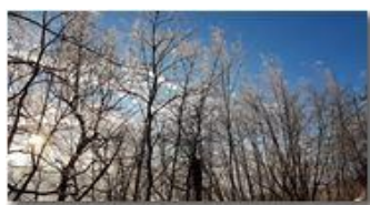
Ghiaccio, galaverna o gelicidio?

Guido Marcheselli - HTC One S Nokia C7-00 (o altro cell) 2018 - Inverno - Savignone - Panorami