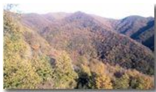
Il Monte Carmo tra Rio Maggione e Rio Piambertone

Pietro Marcheselli - Canon Ixus 980 IS 2013 - Inverno - Savignone - Panorami