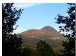
Autunno a Savignone – Monte Maggio

Pietro Marcheselli - HTC One S Nokia C7-00 (o altro cell) 2018 - Estate - Savignone - Panorami