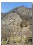
Conglomerato di Savignone

Pietro Marcheselli - Canon Ixus 980 IS 2018 - Inverno - Savignone - Panorami