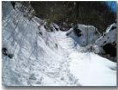
Salendo la Valle del rio Maggione

Pietro Marcheselli - Canon Ixus 980 IS 2013 - Inverno - Savignone - Boschi