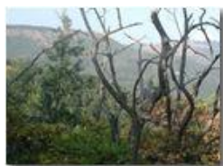
Siccità agosto 2001. Sullo sfondo M. Proventino e Buio

Pietro Marcheselli - Olympus Camedia 3000 <2001 - Estate - Savignone - Fiori&Fauna