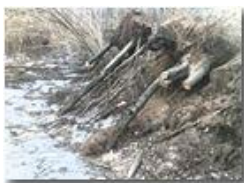
Effetto gelo: "Gli sradicati"

Pietro Marcheselli - Olympus OM-D E-M10 Mark III 2019 - Inverno - Savignone - Altro