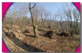
Lavori nel bosco in attesa della ripresa vegetativa

Pietro Marcheselli - Canon EOS 300D 2007 - Inverno - Savignone - Boschi