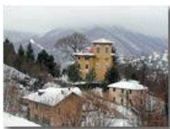
Savignone: numerose le ville per residenza estiva di inizio novecento in stile vagamente liberty

Pietro Marcheselli - Olympus Camedia 3000 2006 - Inverno - Savignone - Paesi