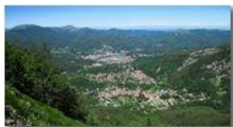
Savignone e Busalla: accorpamento comuni fase 1

Pietro Marcheselli - Canon Ixus 980 IS 2014 - Estate - Savignone - Panorami