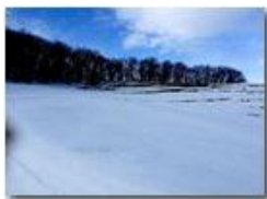
Neve di Marzo: i pascoli del Monte Cappellino

Pietro Marcheselli - HTC One S Nokia C7-00 (o altro cell) 2018 - Inverno - Savignone - Panorami