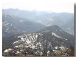
Ultima neve di marzo!

Pietro Marcheselli - Olympus Camedia 3000 2005 - Inverno - Savignone - Paesi