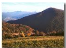
Dalle pendici del Monte Cappellino

Pietro Marcheselli - Canon Ixus 980 IS 2011 - Inverno - Savignone - Panorami