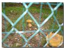
Funghi in giardino

Pietro Marcheselli - Canon EOS 300D 2005 - Estate - Savignone - Altro