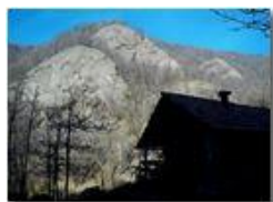
Chiaroscuri in Val Maggione

Pietro Marcheselli - Altro/Other 2013 - Inverno - Savignone - Altro