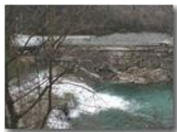
La maledizione del collettore ha colpito ancora: crollo al Ponte di Savignone (dicembre 2005)

Pietro Marcheselli - Olympus Camedia 3000 2006 - Inverno - Savignone - Altro