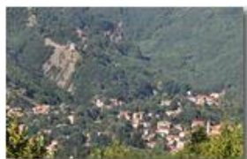
Teleobiettivo su Savignone e Castello Fieschi

Pietro Marcheselli - Canon EOS 300D 2008 - Estate - Savignone - Fiori&Fauna