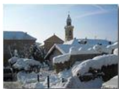
Savignone: neve in centro

Pietro Marcheselli - Canon Ixus 980 IS 2012 - Inverno - Savignone - Altro