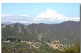
Savignone adagiato ai piedi del Monte Pianetto

Pietro Marcheselli - Canon EOS 300D 2006 - Estate - Savignone - Paesi