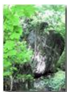
Resti di antica frana nel bosco

Pietro Marcheselli - Canon EOS 300D 2010 - Estate - Savignone - Fiori&Fauna