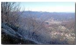
Tra autunno e inverno sul Monte Maggio

Pietro Marcheselli - Canon Ixus 980 IS 2013 - Inverno - Savignone - Panorami