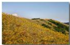
Libellula: Calopteryx virgo

Pietro Marcheselli - Canon EOS 300D 2010 - Estate - Savignone - Fiori&Fauna