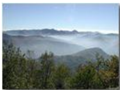
Panorama autunnale sulla Valle Scivia da M. Maggio

Pietro Marcheselli - Olympus Camedia 3000 2002 - Inverno - Savignone - Panorami