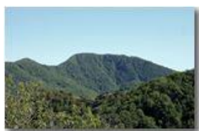
Monte Maggio da una insolita prospettiva

Pietro Marcheselli - Canon EOS 300D 2009 - Estate - Savignone - Panorami