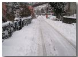
Nevicata a Ponte di Savignone

Pietro Marcheselli - Canon Ixus 980 IS 2010 - Inverno - Savignone - Paesi