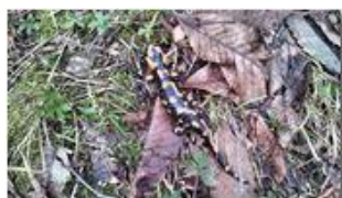
Salamandra: il simbolo di questa primavera piovosa

Pietro Marcheselli - Canon Ixus 980 IS 2013 - Estate - Savignone - Boschi