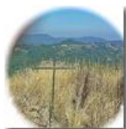
Una croce solitaria nel bosco dietro al Pianetto

Pietro Marcheselli - Canon Ixus 980 IS 2015 - Estate - Savignone - Panorami