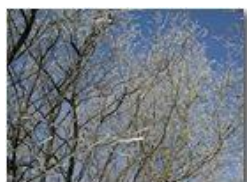
Galaverna: I fiori dell'inverno

Pietro Marcheselli - Olympus Camedia 3000 2003 - Estate - Savignone - Panorami