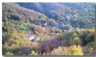
Savignone: la periferia...

Pietro Marcheselli - Altro/Other 2013 - Inverno - Savignone - Boschi