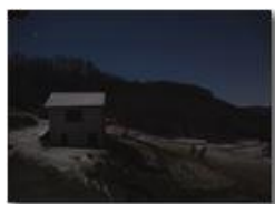
Spruzzata di neve sulla stalla - notturno

Guido Marcheselli - Olympus OM-D E-M10 Mark III 2020 - Inverno - Savignone - Boschi