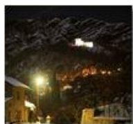
Castello di Savignone innevato in notturna

Pietro Marcheselli - HTC One/Nokia C7/Samsung S7/S10 2022 - Estate - Savignone - Panorami