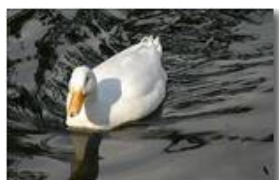
Papera in ammollo (anatra White-Campbell)

Pietro Marcheselli - Canon EOS 300D 2005 - Estate - Savignone - Fiori&Fauna