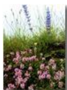
Fioriture di inizio estate

Pietro Marcheselli - Canon Ixus 980 IS 2016 - Estate - Savignone - Fiori&Fauna