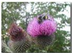
Bombice su fiore di cardo (Cirsium eriophorum)

Pietro Marcheselli - Olympus Camedia 3000 <2001 - Estate - Savignone - Fiori&Fauna