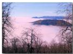
Inversione termica: Monte Vittoria e Figogna

Pietro Marcheselli - Canon Ixus 980 IS 2013 - Inverno - Savignone - Panorami