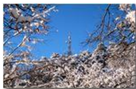
Montemaggio: antenna nel bosco

Pietro Marcheselli - Canon Ixus 980 IS 2013 - Inverno - Savignone - Paesi