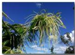
Copiosa fioritura di castagno

Pietro Marcheselli - HTC One S Nokia C7-00 (o altro cell) 2018 - Estate - Savignone - Fiori&Fauna