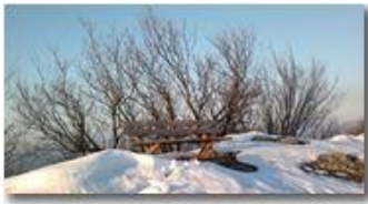
Panchina con neve sulla vetta di Montemaggio

Guido Marcheselli - Nokia C7-00 (o altro Smartphone) 2013 - Inverno - Savignone - Boschi