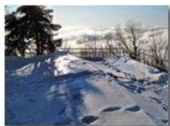
Monte Maggio: sopra le nuvole

Pietro Marcheselli - Canon Ixus 980 IS 2010 - Estate - Savignone - Fiori&Fauna