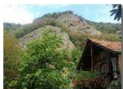
Nella Valle del rio Maggione

Pietro Marcheselli - Altro/Other 2017 - Inverno - Savignone - Panorami