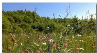
Prati fioriti a Chiappazza (Montemaggio)

Guido Marcheselli - Canon EOS 300D 2014 - Estate - Savignone - Fiori&Fauna