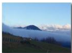
Nebbie attorno a Monte Maggio

Pietro Marcheselli - HTC One S Nokia C7-00 (o altro cell) 2019 - Inverno - Savignone - Panorami