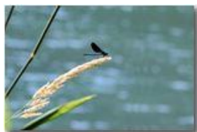
Libellula della specie Calopteryx virgo

Pietro Marcheselli - Canon EOS 300D 2008 - Inverno - Savignone - Panorami