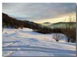
Neve a Montemaggio

Guido Marcheselli - Olympus OM-D E-M10 Mark III 2022 - Inverno - Savignone - Panorami