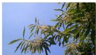
Nonostante il cinipede qualche amento riappare

Pietro Marcheselli - Canon Ixus 980 IS 2013 - Estate - Savignone - Panorami