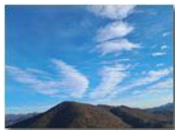
Sfilata di nubi sopra il Monte Vittoria

Pietro Marcheselli - HTC One/Nokia C7/Samsung S7/S10 2023 - Inverno - Savignone - Panorami