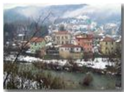
San Bartolomeo di Vallecaldà

Pietro Marcheselli - Canon Ixus 980 IS 2010 - Inverno - Savignone - Panorami