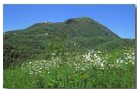
Monte Maggio versione estate

Pietro Marcheselli - Canon Ixus 980 IS 2010 - Estate - Savignone - Panorami