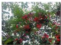
Le mie amarene

Pietro Marcheselli - Canon Ixus 980 IS 2016 - Estate - Savignone - Fiori&Fauna