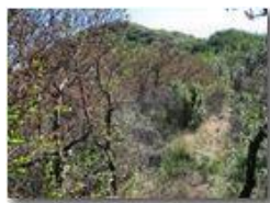
Sul crinale NW del Monte Pianetto

Pietro Marcheselli - Canon Ixus 980 IS 2012 - Estate - Savignone - Fiori&Fauna