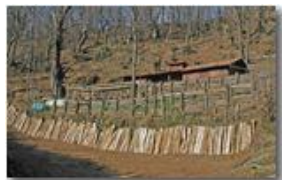
Lavori nel bosco

Pietro Marcheselli - Canon EOS 300D 2007 - Estate - Savignone - Panorami