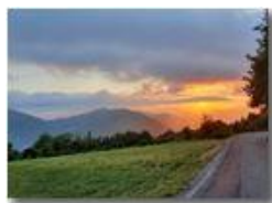
Tramonto scendendo da Montemaggio

Guido Marcheselli - HTC One/Nokia C7/Samsung S7/S10 2020 - Estate - Savignone - Paesi