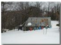
Il vecchio ovile sotto la neve

Pietro Marcheselli - Olympus Camedia 3000 2005 - Inverno - Savignone - Paesi