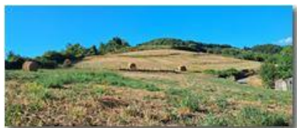
Fienagione pendici Monte Capellino

Pietro Marcheselli - Altro/Other 2023 - Inverno - Savignone - Paesi