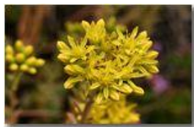
Infiorescenza di sedum acre (borracina)

Pietro Marcheselli - Canon EOS 300D 2009 - Estate - Savignone - Fiori&Fauna