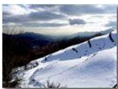
Neve di Marzo: veduta sulla Val Polcevera

Pietro Marcheselli - HTC One S Nokia C7-00 (o altro cell) 2018 - Inverno - Savignone - Panorami