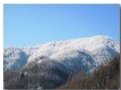
Monte Fuea: ultimi brividi dell inverno

Pietro Marcheselli - Canon Ixus 980 IS 2010 - Inverno - Savignone - Panorami