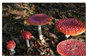
Famiglia di funghi amanita muscaria

Canon EOS 300D 2006 - Inverno - Savignone - Fiori&Fauna