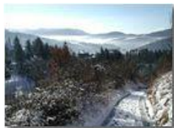
Debole nevicata su Savignone

Pietro Marcheselli - Olympus Camedia 3000 2003 - Inverno - Savignone - Panorami