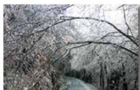
Gelo: "mi piego ma non mi spezzo"

Pietro Marcheselli - Canon EOS 300D 2009 - Inverno - Savignone - Fiori&Fauna