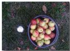
Autunno a Savignone – Frutti di stagione

Pietro Marcheselli - HTC One S Nokia C7-00 (o altro cell) 2018 - Estate - Savignone - Fiori&Fauna