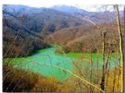
Il lago Busalietta finalmente colmo dopo le piogge di fine inverno

Pietro Marcheselli - Canon Ixus 980 IS 2016 - Estate - Savignone - Fiori&Fauna