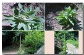
Lo sviluppo di una tasso barbasso ( verbascum thapsus )

Pietro Marcheselli - Canon EOS 300D 2009 - Estate - Savignone - Panorami