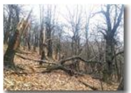
Natura matrigna: continua il degrado dei boschi per il gelo

Pietro Marcheselli - Canon Ixus 980 IS 2018 - Inverno - Savignone - Altro