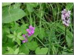
Geranio selvatico e orchidea

Pietro Marcheselli - Olympus Camedia 3000 2002 - Estate - Savignone - Fiori&Fauna