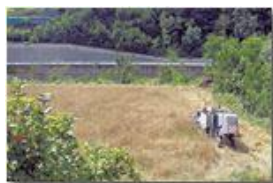
Tra un acquazzone e l'altro: la mietitura

Pietro Marcheselli - Canon Ixus 980 IS 2014 - Estate - Savignone - Fiori&Fauna