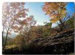
Autunno al Castello

Pietro Marcheselli - Canon Ixus 980 IS 2018 - Inverno - Savignone - Boschi