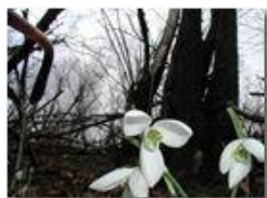
Galantus nivalis bucaneve

Pietro Marcheselli - Olympus Camedia 3000 2002 - Estate - Savignone - Fiori&Fauna