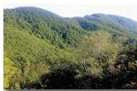
La verde conca di Piambertone; in fondo il Monte Maggio

Pietro Marcheselli - Canon Ixus 980 IS 2015 - Estate - Savignone - Altro