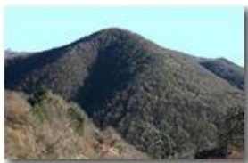
Il monte Fueba

Pietro Marcheselli - Canon EOS 300D 2009 - Inverno - Savignone - Panorami