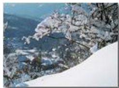
Savignone: uno sguardo dall'alto

Pietro Marcheselli - Altro/Other 2012 - Inverno - Savignone - Altro