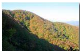
Nel bosco dietro al Monte Pianetto

Pietro Marcheselli - Canon Ixus 980 IS 2011 - Inverno - Savignone - Panorami