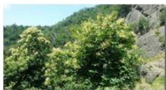
Castagni in fiore

Pietro Marcheselli - Altro/Other 2017 - Estate - Savignone - Fiori&Fauna