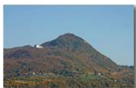
Il Monte Maggio e la Colonia (arch. Nardi Greco, 1933)

Pietro Marcheselli - Canon EOS 300D 2008 - Inverno - Savignone - Paesi