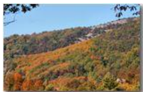
Autunno a Savignone

Pietro Marcheselli - Canon EOS 300D 2009 - Estate - Savignone - Boschi