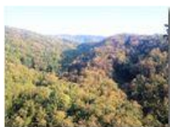
Boschi riarsi dalla siccità e dal cinipede

Pietro Marcheselli - Canon Ixus 980 IS 2011 - Estate - Savignone - Panorami