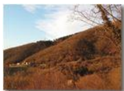
Tramonto invernale alla frazione Montemaggio

Pietro Marcheselli - HTC One S Nokia C7-00 (o altro cell) 2019 - Inverno - Savignone - Panorami