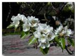
I fiori del pero

Pietro Marcheselli - Olympus Camedia 3000 2002 - Estate - Savignone - Fiori&Fauna