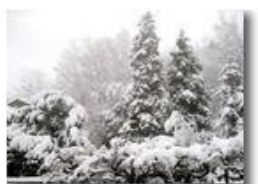
6 Febbraio: prima neve a Savignone

Pietro Marcheselli - Canon Ixus 980 IS 2018 - Inverno - Savignone - Altro