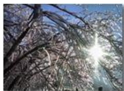
Alberi vetrificati (Nokia 70)

Guido Marcheselli - Canon EOS 300D 2009 - Inverno - Savignone - Altro