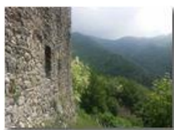
Mura del Castello Fieschi

Pietro Marcheselli - HTC One S Nokia C7-00 (o altro cell) 2018 - Estate - Savignone - Panorami