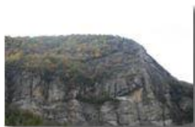
La frana del Monte Maggio: strati arenacei e conglomerato

Pietro Marcheselli - Canon EOS 300D 2006 - Inverno - Savignone - Fiori&Fauna