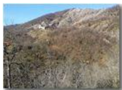
Ruderi castello Fieschi e conglomerato di Savignone

Pietro Marcheselli - HTC One S Nokia C7-00 (o altro cell) 2019 - Inverno - Savignone - Paesi