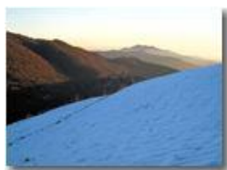
Neve sul Monte Cappellino

Pietro Marcheselli - Canon Ixus 980 IS 2013 - Inverno - Savignone - Panorami