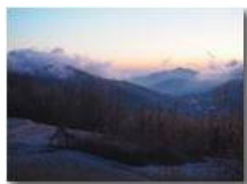
Tramonto con nevischio e nebbie da Montemaggio

Guido Marcheselli - Olympus OM-D E-M10 Mark III 2020 - Inverno - Savignone - Panorami