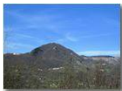
Luce di primavera e Monte Maggio

Pietro Marcheselli - Altro/Other 2011 - Estate - Savignone - Paesi