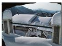
La Vittoria: Case Maggetta

Pietro Marcheselli - Canon Ixus 980 IS 2012 - Inverno - Savignone - Paesi