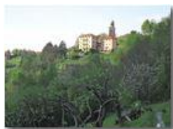
Frazione La Vittoria in luce serale

Pietro Marcheselli - Altro/Other 2011 - Estate - Savignone - Panorami