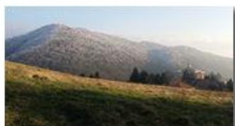
Timidi accenni d'inverno sul Monte Fueba

Pietro Marcheselli - Canon Ixus 980 IS 2017 - Inverno - Savignone - Altro