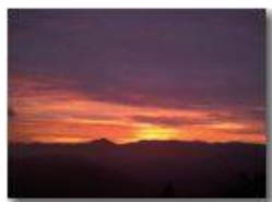
Da frazione Vittoria: luci del tramonto

Pietro Marcheselli - Canon Ixus 980 IS 2011 - Inverno - Savignone - Panorami