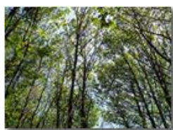
Effetti del dryocosmus kuriphilus : più luce nel castagneto

Pietro Marcheselli - Canon Ixus 980 IS 2010 - Estate - Savignone - Boschi