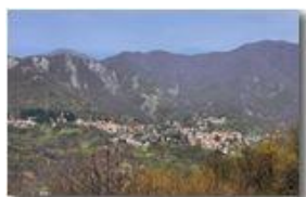
Variazioni stagionali: Savignone (marzo)

Pietro Marcheselli - Canon EOS 300D 2007 - Estate - Savignone - Paesi