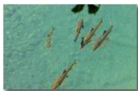
Trote(?) nel fiume Scrivia, Ponte di Savignone

Guido Marcheselli - Canon EOS 300D 2014 - Estate - Savignone - Fiori&Fauna