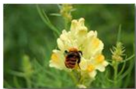
Ape su Bocca di leone gialla ( antirrhinum latifolium )

Pietro Marcheselli - Canon EOS 300D 2009 - Estate - Savignone - Fiori&Fauna