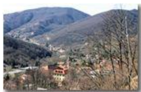
Veduta di Savignone a fine inverno

Pietro Marcheselli - Canon EOS 300D 2009 - Inverno - Savignone - Paesi