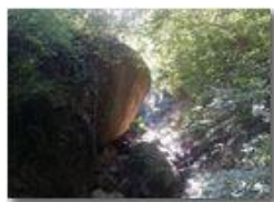
Sentiero della valletta Rio Piambertone

Pietro Marcheselli - Canon Ixus 980 IS 2016 - Estate - Savignone - Fiori&Fauna