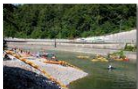
Parco fluviale di Savignone

Pietro Marcheselli - Canon Ixus 980 IS 2011 - Estate - Savignone - Panorami