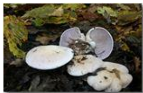
Un fungo del genere clitocybe

Pietro Marcheselli - Canon EOS 300D 2006 - Inverno - Savignone - Fiori&Fauna