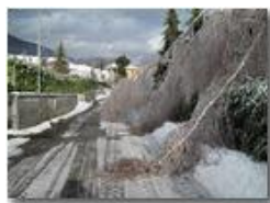
La gelata del 22 dicembre

Pietro Marcheselli - Canon Ixus 980 IS 2010 - Inverno - Savignone - Boschi