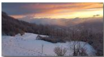
Tramonto sulla neve, da Montemaggio verso i forti di Genova

Guido Marcheselli - HTC One S Nokia C7-00 (o altro cell) 2018 - Inverno - Savignone - Fiori&Fauna