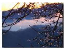
Galaverna al tramonto

Guido Marcheselli - Olympus OM-D E-M10 Mark III 2020 - Inverno - Savignone - Panorami