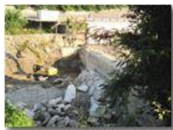
Diga: avanzamento lavori

Pietro Marcheselli - Canon Ixus 980 IS 2013 - Estate - Savignone - Altro