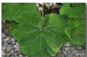
Le grandi foglie di una gunnera

Pietro Marcheselli - Canon EOS 300D 2010 - Estate - Savignone - Fiori&Fauna