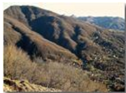
Salendo al M. Pianetto: Il M. Maggio

Pietro Marcheselli - Canon Ixus 980 IS 2016 - Inverno - Savignone - Panorami