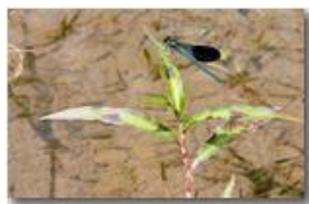
Libellula della specie Calopteryx virgo

Pietro Marcheselli - Canon EOS 300D 2007 - Estate - Savignone - Fiori&Fauna