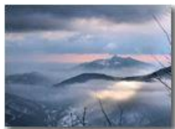
I forti di Genova tra nebbie e sole, dal Monte Maggio

Guido Marcheselli - Canon Ixus 980 IS 2010 - Inverno - Savignone - Panorami