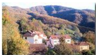
Frazione Castello Rosso

Pietro Marcheselli - Altro/Other 2013 - Inverno - Savignone - Paesi