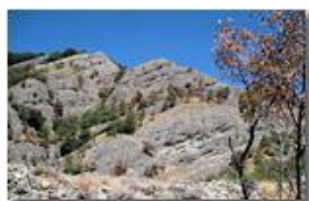
La lunga estate calda: siccità pendici monte Pianetto

Pietro Marcheselli - Canon Ixus 980 IS 2012 - Estate - Savignone - Boschi