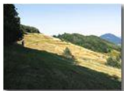
Estate sul Monte Cappellino

Pietro Marcheselli - Canon Ixus 980 IS 2015 - Estate - Savignone - Panorami