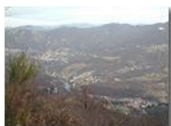
Savignone e alcune sue frazioni dal M. Vittoria

Pietro Marcheselli - Olympus Camedia 3000 2002 - Inverno - Savignone - Panorami