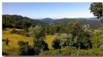
Cielo limpido sopra i forti di Genova, da Montemaggio

Pietro Marcheselli - Altro/Other 2014 - Estate - Savignone - Fiori&Fauna