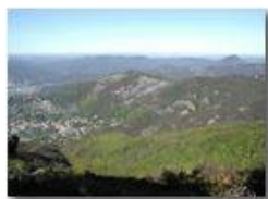
Boschi di Savignone Ottobre 2003

Pietro Marcheselli - Olympus Camedia 3000 2004 - Inverno - Savignone - Boschi