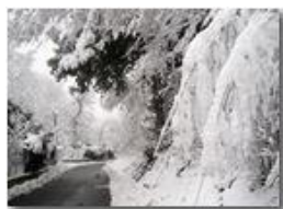
6 Febbraio: prima neve a Savignone

Guido Marcheselli - HTC One S Nokia C7-00 (o altro cell) 2018 - Inverno - Savignone - Panorami