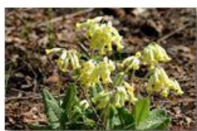
Fiori di primula officinalis

Pietro Marcheselli - Canon Ixus 980 IS 2010 - Estate - Savignone - Fiori&Fauna