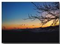
Tramonto da Montemaggio

Guido Marcheselli - Olympus OM-D E-M10 Mark III 2020 - Inverno - Savignone - Panorami