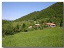
Inastrà di Montemaggio

Pietro Marcheselli - Canon EOS 300D 2005 - Estate - Savignone - Panorami