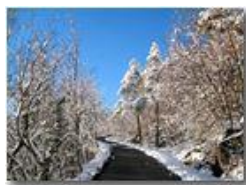
Montemaggio: la strada della Colonia

Pietro Marcheselli - Canon Ixus 980 IS 2013 - Inverno - Savignone - Boschi