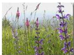
Prati in maggio

Pietro Marcheselli - Olympus Camedia 3000 2004 - Estate - Savignone - Fiori&Fauna