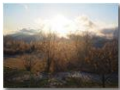
Tramonto e galaverna a Montemaggio

Guido Marcheselli - Olympus OM-D E-M10 Mark III 2020 - Inverno - Savignone - Panorami