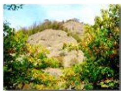
Colori d'autunno, tra siccità e cambio di stagione

Pietro Marcheselli - Canon Ixus 980 IS 2017 - Estate - Savignone - Boschi