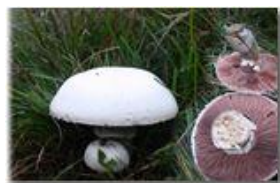
Fungo prataiolo: psaliota campestris

Pietro Marcheselli - Canon EOS 300D 2006 - Inverno - Savignone - Fiori&Fauna