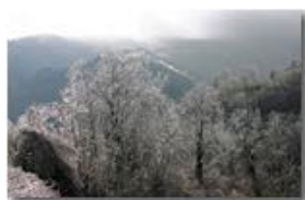
Boschi di cristallo

Pietro Marcheselli - Canon EOS 300D 2009 - Inverno - Savignone - Boschi