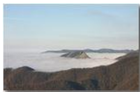
Un'isola nel mare di nebbia: il Monte Rocche del Reopasso

Pietro Marcheselli - Canon EOS 300D 2006 - Inverno - Savignone - Fiori&Fauna