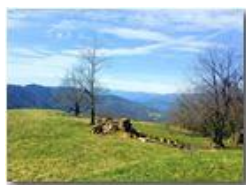
Dov'era l'ombra or sè la quercia spande morta, ne più coi turbini tenzona...

Pietro Marcheselli - Altro/Other 2013 - Inverno - Savignone - Altro