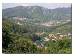
Ponte di Savignone: L'alveo del fiume Scrivia dopo i lavori di pulizia (agosto 2005)

Pietro Marcheselli - Canon EOS 300D 2005 - Estate - Savignone - Fiori&Fauna