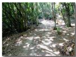
Passaggio tra Monte Fuea e Monte Vittoria

Pietro Marcheselli - Altro/Other 2017 - Estate - Savignone - Boschi