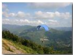
Parapendio in volo

Pietro Marcheselli - Canon EOS 300D 2005 - Estate - Savignone - Altro