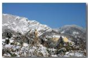
Savignone sotto la neve: Parrocchia San Pietro e ruderi del Castello

Pietro Marcheselli - Canon EOS 300D 2009 - Inverno - Savignone - Altro