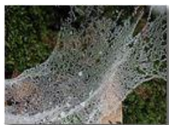
Decorazioni: Tela di ragno

Pietro Marcheselli - Olympus Camedia 3000 2005 - Inverno - Savignone - Boschi