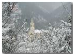
La chiesa di San Bartolomeo sotto la neve

Guido Marcheselli - Olympus Camedia 3000 2006 - Inverno - Savignone - Boschi