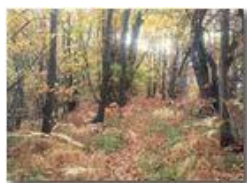
Bosco in autunno

Pietro Marcheselli - HTC One S Nokia C7-00 (o altro cell) 2018 - Inverno - Savignone - Boschi