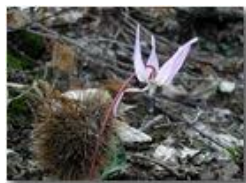
Dente di cane

Pietro Marcheselli - Olympus Camedia 3000 2002 - Estate - Savignone - Fiori&Fauna