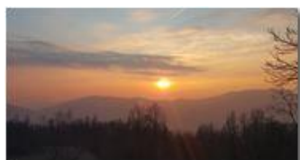
Tramonto verso Genova, da Montemaggio

Pietro Marcheselli - Canon Ixus 980 IS 2016 - Estate - Savignone - Fiori&Fauna