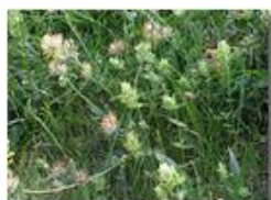
Cresta di gallo e vulneraria

Pietro Marcheselli - Olympus Camedia 3000 2002 - Estate - Savignone - Fiori&Fauna