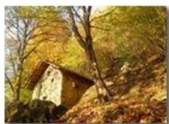
Colori d'autunno nei boschi di Savignone

Pietro Marcheselli - HTC One S Nokia C7-00 (o altro cell) 2018 - Inverno - Savignone - Panorami