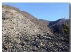
Salendo tra Rio Maggione e Rio Piambertone

Pietro Marcheselli - Olympus OM-D E-M10 Mark III 2019 - Inverno - Savignone - Panorami