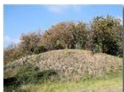
La siccità ed il cinipede: poche le castagne

Pietro Marcheselli - Canon Ixus 980 IS 2011 - Estate - Savignone - Boschi