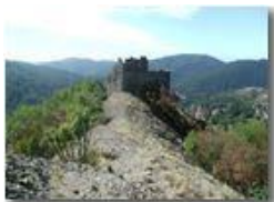
Savignone: ruderi del Castello Fieschi

Pietro Marcheselli - Olympus Camedia 3000 <2001 - Estate - Savignone - Paesi