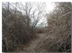
Ancora rovi sul M. Vittoria

Pietro Marcheselli - Olympus Camedia 3000 2002 - Inverno - Savignone - Boschi