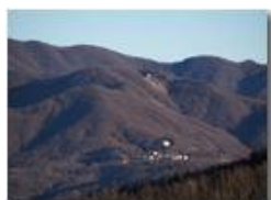
Frazione Costalovaia e il monte Pianetto

Guido Marcheselli - Olympus OM-D E-M10 Mark III 2019 - Inverno - Savignone - Panorami