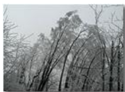
Brinata nel bosco

Pietro Marcheselli - Olympus Camedia 3000 2005 - Inverno - Savignone - Altro