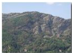
Siccità a Savignone

Pietro Marcheselli - Olympus Camedia 3000 2003 - Estate - Savignone - Panorami