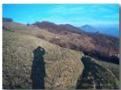
L'ombra: autoritratto del fotografo

Pietro Marcheselli - Altro/Other 2014 - Inverno - Savignone - Altro