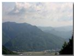
Parapendii in discesa sulla piana di Casella

Pietro Marcheselli - Canon EOS 300D 2005 - Estate - Savignone - Altro