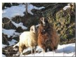
La strana coppia (in memoria di Aldo)

Pietro Marcheselli - Canon Ixus 980 IS 2010 - Inverno - Savignone - Panorami