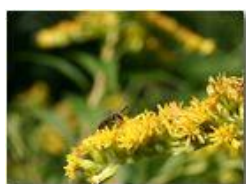
Formica alata su fiore di solidago canadensis

Pietro Marcheselli - Canon EOS 300D 2005 - Estate - Savignone - Fiori&Fauna