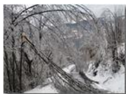
Gelicidio/galaverna: mi piego ma mi spezzo...

Pietro Marcheselli - Canon Ixus 980 IS 2010 - Inverno - Savignone - Boschi