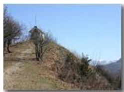
Cappella del M. Pianetto

Pietro Marcheselli - Olympus Camedia 3000 2005 - Inverno - Savignone - Panorami