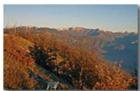
Un'altra foto dedicata al monte Antola

Pietro Marcheselli - Canon EOS 300D 2006 - Inverno - Savignone - Panorami