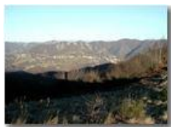
Savignone dal M. Cappellino

Pietro Marcheselli - Olympus Camedia 3000 2002 - Inverno - Savignone - Paesi