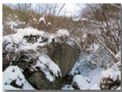
Resti di antiche frane in Piambertone

Pietro Marcheselli - Canon Ixus 980 IS 2012 - Inverno - Savignone - Boschi