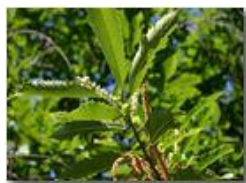
Fiori maschili e femminili di castagno

Pietro Marcheselli - Canon EOS 300D 2005 - Estate - Savignone - Fiori&Fauna