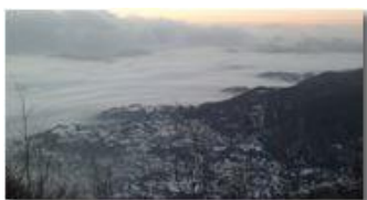
Savignone aggredita dalla nebbia

Guido Marcheselli - Nokia C7-00 (o altro Smartphone) 2013 - Inverno - Savignone - Panorami