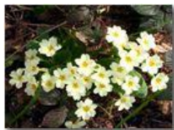
Fiori di primula acaulis

Pietro Marcheselli - Canon Ixus 980 IS 2010 - Estate - Savignone - Fiori&Fauna