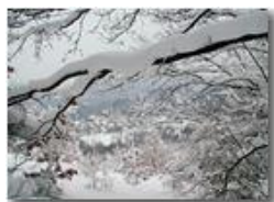
Besolagno tra i rami carichi di neve

Guido Marcheselli - Olympus Camedia 3000 2006 - Inverno - Savignone - Boschi