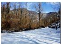
Neve di Marzo: crinale monti Pianetto-Brughea-Carmo

Pietro Marcheselli - HTC One S Nokia C7-00 (o altro cell) 2018 - Inverno - Savignone - Boschi