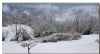
Risveglio innevato, 3 marzo 2018

Guido Marcheselli - HTC One S Nokia C7-00 (o altro cell) 2018 - Inverno - Savignone - Boschi