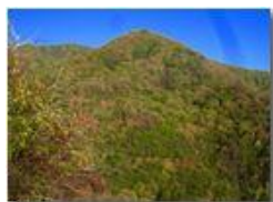
Colori d'autunno nei boschi di Savignone

Canon Ixus 980 IS 2018 - Inverno - Savignone - Boschi