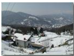
Panorama innevato da Costalovaia

Pietro Marcheselli - Olympus Camedia 3000 2005 - Inverno - Savignone - Paesi