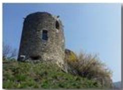
Primi accenni di primavera al Castello Fieschi

Pietro Marcheselli - HTC One S Nokia C7-00 (o altro cell) 2018 - Estate - Savignone - Fiori&Fauna