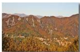
Autunno in Savignone 2

Pietro Marcheselli - Canon EOS 300D 2008 - Inverno - Savignone - Paesi