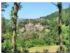
Savignone in estate

Pietro Marcheselli - Canon Ixus 980 IS 2010 - Estate - Savignone - Paesi