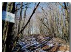
Pianetto: la vetta cartografica

Pietro Marcheselli - Canon Ixus 980 IS 2014 - Inverno - Savignone - Panorami