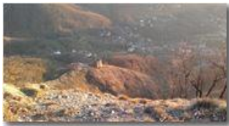
Castello di Savignone dal Pianetto

Guido Marcheselli - Nokia C7-00 (o altro Smartphone) 2013 - Inverno - Savignone - Paesi