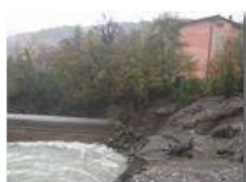
Crollo diga e strada provinciale a Ponte di Savignone: rive franose

Guido Marcheselli - Canon EOS 300D 2012 - Inverno - Savignone - Paesi