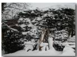
Resisterà la legnaia sotto la neve?

Olympus Camedia 3000 2005 - Inverno - Savignone - Boschi