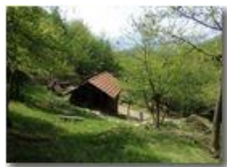
Un angolo della valle del rio Maggione

Pietro Marcheselli - HTC One S Nokia C7-00 (o altro cell) 2018 - Estate - Savignone - Boschi