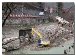
Lavori di consolidamento argine Scrivia, a Ponte di Savignone

Pietro Marcheselli - Canon Ixus 980 IS 2017 - Inverno - Savignone - Altro