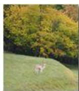
Daino in posa

Guido Marcheselli - Olympus OM-D E-M10 Mark III 2021 - Inverno - Savignone - Boschi