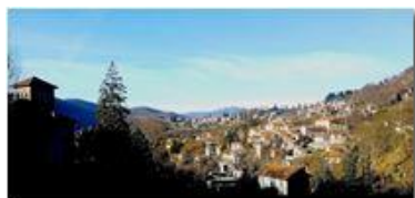
Veduta di Savignone da est

Pietro Marcheselli - HTC One S Nokia C7-00 (o altro cell) 2019 - Inverno - Savignone - Paesi