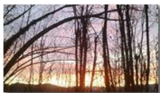
Luce del solstizio invernale 2011

Pietro Marcheselli - Altro/Other 2012 - Inverno - Savignone - Altro