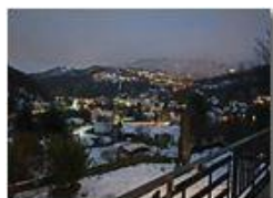
Ponte di savignone e Savignone innevati

Guido Marcheselli - Olympus OM-D E-M10 Mark III 2021 - Inverno - Savignone - Panorami