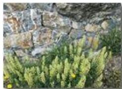
Fiori di reseda

Pietro Marcheselli - HTC One/Nokia C7/Samsung S7/S10 2022 - Estate - Savignone - Panorami