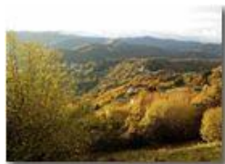
Pendici M. Cappellino: Passo dei Giovi

Pietro Marcheselli - Canon Ixus 980 IS 2018 - Inverno - Savignone - Altro