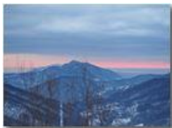
Neve e nuvole verso il mar Ligure

Guido Marcheselli - Olympus OM-D E-M10 Mark III 2021 - Inverno - Savignone - Panorami