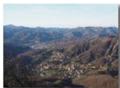
Savingone dal Monte Maggio

Guido Marcheselli - Olympus OM-D E-M10 Mark III 2016 - Inverno - Savignone - Panorami