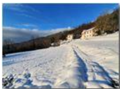
Montemaggio: prati innevati

Guido Marcheselli - HTC One/Nokia C7/Samsung S7/S10 2021 - Inverno - Savignone - Panorami