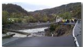
Crollo diga e strada provinciale a Ponte di Savignone: la voragine nella strada

Pietro Marcheselli - Altro/Other 2011 - Inverno - Savignone - Altro