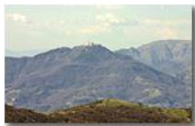
Il santuario della Madonna della Guardia sul monte Figogna

Pietro Marcheselli - Canon EOS 300D 2007 - Estate - Savignone - Panorami