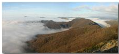
Panorama con nebbia dal Monte Maggio

Pietro Marcheselli - Canon EOS 300D 2006 - Inverno - Savignone - Panorami