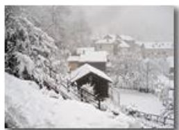
6 Febbraio: prima neve a Savignone

Pietro Marcheselli - Canon Ixus 980 IS 2018 - Inverno - Savignone - Altro