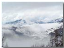
Frazione Gualdrà tra nebbia e neve

Guido Marcheselli - Olympus OM-D E-M10 Mark III 2021 - Inverno - Savignone - Paesi