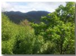
Ombre su M. Maggio

Pietro Marcheselli - HTC One S Nokia C7-00 (o altro cell) 2020 - Estate - Savignone - Fiori&Fauna