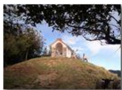
La cappella del Pianetto

Pietro Marcheselli - Canon Ixus 980 IS 2011 - Estate - Savignone - Boschi