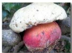
Autunno 2010: fungo boletus satanas (Ferrando)

Pietro Marcheselli - Canon Ixus 980 IS 2011 - Inverno - Savignone - Fiori&Fauna