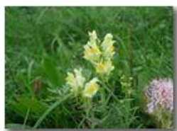
Una scrophulariaceae e una scabiosa a fine estate

Pietro Marcheselli - Olympus Camedia 3000 <2001 - Estate - Savignone - Paesi