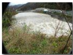
Piena del fiume Scrivia del 24-11

Guido Marcheselli - Olympus Camedia 3000 2003 - Inverno - Savignone - Panorami