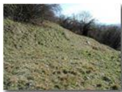
Prato con crochi

Pietro Marcheselli - Olympus Camedia 3000 2002 - Estate - Savignone - Fiori&Fauna