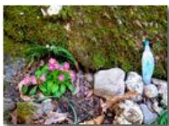
Un'apparizione nel bosco

Guido Marcheselli - HTC One S Nokia C7-00 (o altro cell) 2016 - Inverno - Savignone - Panorami