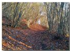
Sentieri in autunno

Pietro Marcheselli - Altro/Other 2017 - Inverno - Savignone - Boschi