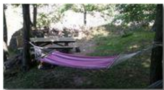
Un invito alla siesta

Pietro Marcheselli - Altro/Other 2017 - Estate - Savignone - Altro