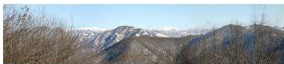
Al di là del Monte Pianetto di Savignone: boschi con neve nel Parco dell'Antola; sullo sfondo Catena dei Monti Liguri

Pietro Marcheselli - Canon EOS 300D 2006 - Inverno - Savignone - Panorami