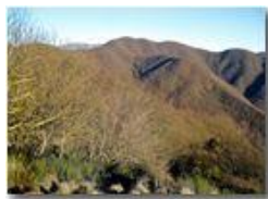
Salendo al M. Pianetto: Il M. Carmo, La Suia e sullo sfondo il M. Buio

Pietro Marcheselli - Canon Ixus 980 IS 2016 - Inverno - Savignone - Panorami