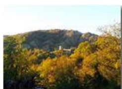
Autunno a Savignone – Monte Pianetto

Pietro Marcheselli - HTC One S Nokia C7-00 (o altro cell) 2018 - Estate - Savignone - Panorami