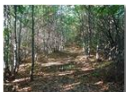
Bosco in autunno in Val Seminella

Pietro Marcheselli - Olympus Camedia 3000 2002 - Inverno - Savignone - Boschi