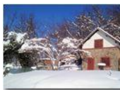
La baita sul poggio

Pietro Marcheselli - Canon Ixus 980 IS 2013 - Inverno - Savignone - Altro