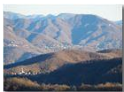
Montemaggio, Gabbie e Tegli da Fraconalto

Guido Marcheselli - Olympus OM-D E-M10 Mark III 2019 - Inverno - Savignone - Panorami