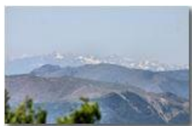
Appennino di Ponente (Monti Rama, Reixa e Beigua) e Alpi Liguri

Pietro Marcheselli - Canon Ixus 980 IS 2011 - Estate - Savignone - Fiori&Fauna