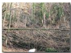
Effetto galaverna: transito vietato

Guido Marcheselli - Canon Ixus 980 IS 2011 - Inverno - Savignone - Boschi