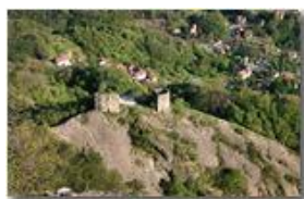
Le rovine del castello Fieschi (sec.XIII)

Pietro Marcheselli - Canon EOS 300D 2009 - Estate - Savignone - Fiori&Fauna