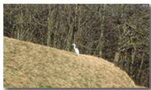
Ambientazione insolita per la sosta di un trampoliere

Pietro Marcheselli - Canon Ixus 980 IS 2015 - Inverno - Savignone - Panorami