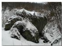
Masso di conglomerato spruzzato di neve

Pietro Marcheselli - Olympus Camedia 3000 2004 - Inverno - Savignone - Paesi