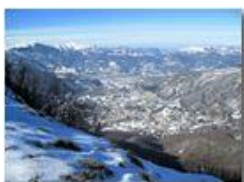
Valle Scrivia: paesaggio invernale

Pietro Marcheselli - Canon Ixus 980 IS 2015 - Inverno - Savignone - Boschi