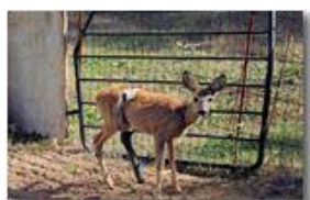
Capriolo con zampa fratturata e ferita da taglio, dopo le cure

Pietro Marcheselli - Canon EOS 300D 2009 - Estate - Savignone - Paesi