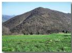
Un po' di verde dopo il lungo e rigido inverno

Pietro Marcheselli - Canon Ixus 980 IS 2010 - Estate - Savignone - Panorami