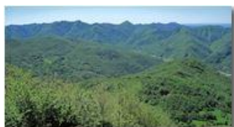
Boschi di Valle Scrivia

Guido Marcheselli - Canon EOS 300D 2014 - Estate - Savignone - Panorami