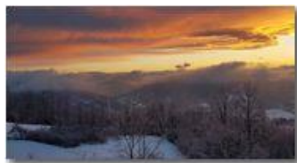
Tramonto: rosso di sera neve si spera (?)

Guido Marcheselli - HTC One S Nokia C7-00 (o altro cell) 2018 - Inverno - Savignone - Panorami