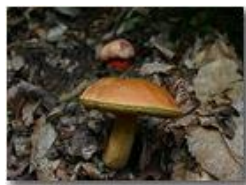
Boletus luridus e boletus satana (tossici)

Pietro Marcheselli - Canon EOS 300D 2005 - Estate - Savignone - Fiori&Fauna