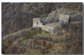
Una zoomata sulle rovine del Castello Fieschi di Savignone

Pietro Marcheselli - Canon EOS 300D 2008 - Inverno - Savignone - Paesi