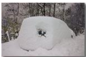
Blocco della circolazione per polveri sottili... bianche

Pietro Marcheselli - Olympus Camedia 3000 2006 - Inverno - Savignone - Altro