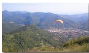
In volo verso la piana di Casella

Pietro Marcheselli - Nokia C7-00 (o altro Smartphone) 2013 - Estate - Savignone - Panorami