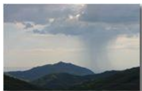
Nuvola di Fantozzi tra Orero e Genova

Guido Marcheselli - Canon EOS 300D 2014 - Estate - Savignone - Fiori&Fauna