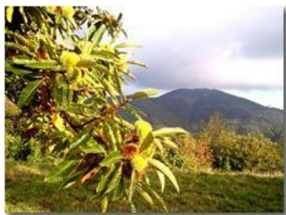
Autunno 2012 al Castello

Pietro Marcheselli - Canon Ixus 980 IS 2013 - Inverno - Savignone - Altro