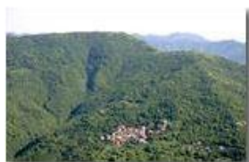
Il paese di Frassinello, in Val Brevenna

Pietro Marcheselli - Canon EOS 300D 2006 - Estate - ValBrevenna - Panorami