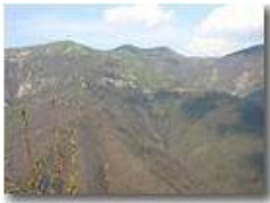
Val Brevenna: frazione Porcile

Pietro Marcheselli - Canon EOS 300D 2005 - Estate - ValBrevenna - Panorami