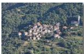
Val Brevenna, frazioni di mezzacosta: Frassinello

Pietro Marcheselli - Canon EOS 300D 2010 - Estate - ValBrevenna - Paesi