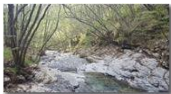
Rio di Tonno sotto al mulino

HTC One S Nokia C7-00 (o altro cell) 2016 - Estate - ValBrevenna - Paesi