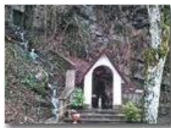
Salus Infirmorum: cappelletta degli ex voto

Pietro Marcheselli - Altro/Other 2013 - Inverno - ValBrevenna - Altro