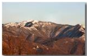
Tramonto invernale con neve sul Monte Antola

Pietro Marcheselli - Canon EOS 300D 2009 - Inverno - ValBrevenna - Panorami