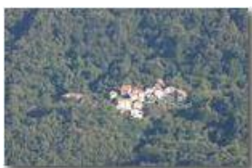
Val Brevenna, frazioni di mezzacosta: I Piani

Pietro Marcheselli - Canon EOS 300D 2010 - Estate - ValBrevenna - Paesi