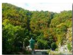
Boschi sofferenti per siccità

Pietro Marcheselli - HTC One S Nokia C7-00 (o altro cell) 2017 - Estate - ValBrevenna - Paesi