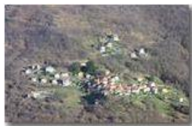
Valbrevenna, sinistra orografica: frazione Ternano

Pietro Marcheselli - Canon EOS 300D 2006 - Inverno - ValBrevenna - Paesi