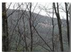
Frassinello: Val Brevenna

Pietro Marcheselli - Olympus Camedia 3000 2002 - Estate - ValBrevenna - Paesi