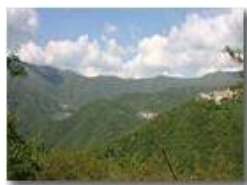
Frazioni di Valbrevenna: Cerviasca, Chiappa e Tonno

Pietro Marcheselli - Canon EOS 300D 2005 - Estate - ValBrevenna - Boschi