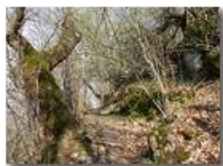
Sentiero tra Crosi e Carsi

Pietro Marcheselli - Canon EOS 300D 2005 - Estate - ValBrevenna - Paesi