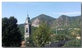
Campanile di Nenno e Monte Maggio

Pietro Marcheselli - HTC One S Nokia C7-00 (o altro cell) 2017 - Estate - ValBrevenna - Paesi