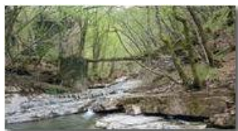
Il mulino di Tonno

Guido Marcheselli - HTC One S Nokia C7-00 (o altro cell) 2016 - Estate - ValBrevenna - Paesi