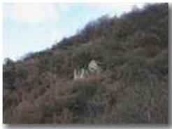
Ruderi verso i Crosi di Val Brevenna

Pietro Marcheselli - Canon EOS 300D 2005 - Estate - ValBrevenna - Panorami