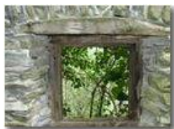
Finestra con vista

Pietro Marcheselli - Olympus Camedia 3000 2002 - Estate - ValBrevenna - Paesi