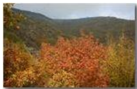
Colori d'autunno in Valbrevenna

Pietro Marcheselli - Canon EOS 300D 2005 - Estate - ValBrevenna - Paesi