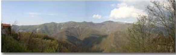
Val Brevenna: destra orografica da Crosi

Pietro Marcheselli - Canon EOS 300D 2005 - Estate - ValBrevenna - Panorami