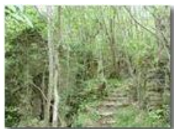
Villaggio abbandonato in V. Brevenna

Pietro Marcheselli - Olympus Camedia 3000 2002 - Estate - ValBrevenna - Panorami