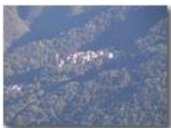
Carsi di Valbrenna

Pietro Marcheselli - Panasonic nv-gs70 (VideoCam) 2004 - Estate - ValBrenna - Paesi