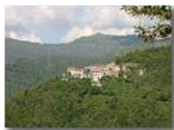
Frazione Cerviasca di Valbrevenna

Pietro Marcheselli - Canon EOS 300D 2005 - Estate - ValBrevenna - Panorami