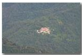
Val Brevenna, frazioni di mezzacosta: Cerviasca

Pietro Marcheselli - Canon EOS 300D 2010 - Estate - ValBrevenna - Paesi