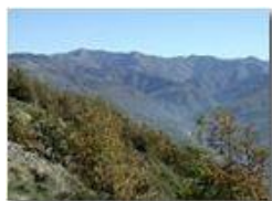
M. Antola alla testata della Val Brevenna

Pietro Marcheselli - Scanner <2001 - Estate - ValBrevenna - Panorami