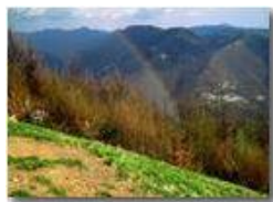
Passata è la tempesta

Pietro Marcheselli - Canon Ixus 980 IS 2014 - Inverno - ValBrevenna - Panorami