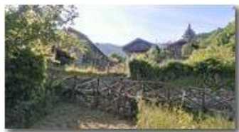
Il paese di Tonno

Guido Marcheselli - Nokia C7-00 (o altro Smartphone) 2013 - Estate - ValBrevenna - Paesi