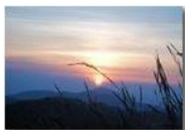
Alba sul monte Antola

Guido Marcheselli - Altro/Other 2007 - Estate - ValBrevenna - Panorami