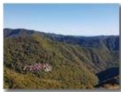
Il paese di Pareto e il mare a Levante

Guido Marcheselli - HTC One S Nokia C7-00 (o altro cell) 2017 - Estate - ValBrevenna - Panorami