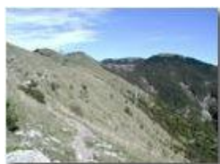
Sentiero del Monte Buio

Pietro Marcheselli - Olympus Camedia 3000 2003 - Inverno - ValBrevenna - Panorami