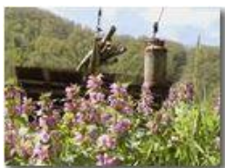
Lamio o Milzadella (videocamera Panasonic nv-gs70)

Pietro Marcheselli - Panasonic nv-gs70 (VideoCam) 2004 - Estate - ValBrenna - Paesi