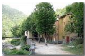
Santuario Madonna dell'Acqua

Pietro Marcheselli - Canon EOS 300D 2007 - Estate - ValBrevenna - Altro