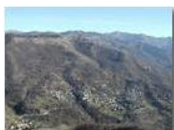
Neno di Val Brevenna (M. Antola sullo sfondo)

Pietro Marcheselli - Olympus Camedia 3000 2002 - Inverno - ValBrevenna - Panorami