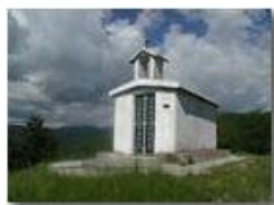
La cappelletta di Gorra (Val Brevenna)

Pietro Marcheselli - Olympus Camedia 3000 2002 - Estate - ValBrevenna - Fiori&Fauna