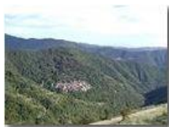
Val Brevenna Pareto e Carsi

Pietro Marcheselli - Olympus Camedia 3000 2003 - Inverno - ValBrevenna - Paesi