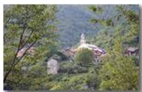
Panoramica sul paese di Tonno

Guido Marcheselli - Canon EOS 300D 2014 - Estate - ValBrevenna - Boschi