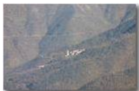
Valbrevenna, sinistra orografica: frazione Carsi

Pietro Marcheselli - Canon EOS 300D 2008 - Inverno - ValBrevenna - Paesi