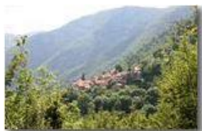
La frazione Cerviasca

Guido Marcheselli - Canon EOS 300D 2014 - Estate - ValBrevenna - Boschi