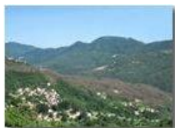
Nenno di Valbrevenna: boschi infestati da lymantria

Pietro Marcheselli - Canon Ixus 980 IS 2012 - Estate - ValBrevenna - Panorami