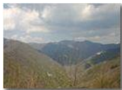
Alta Val Brevenna

Pietro Marcheselli - Canon EOS 300D 2005 - Estate - ValBrevenna - Paesi