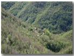
Case isolate in Val Brevenna: Canneville

Pietro Marcheselli - Canon EOS 300D 2005 - Estate - ValBrevenna - Panorami