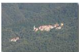
Val Brevenna, frazioni di mezzacosta: Carsi

Pietro Marcheselli - Canon EOS 300D 2010 - Estate - ValBrevenna - Paesi