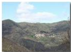
Uno dei tanti paesini di mezzacosta: Frazione Clavarezza in Val Brevenna

Pietro Marcheselli - Canon EOS 300D 2005 - Estate - ValBrevenna - Paesi