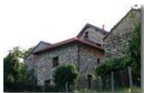
Frazione Tonno, case ristrutturate da poco

Guido Marcheselli - Canon EOS 300D 2014 - Estate - ValBrevenna - Paesi