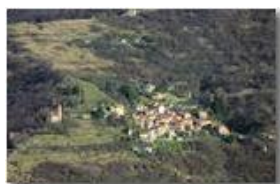
Valbrevenna, sinistra orografica: frazione Frassineto

Pietro Marcheselli - Canon EOS 300D 2008 - Inverno - ValBrevenna - Paesi