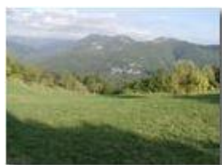
Ternano e Frassineto in Val Brevenna

Pietro Marcheselli - Olympus Camedia 3000 <2001 - Estate - ValBrevenna - Panorami