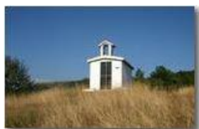
Cappelletta di Gorra

Pietro Marcheselli - Canon Ixus 980 IS 2012 - Estate - ValBrevenna - Panorami