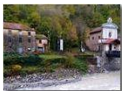
Autunno in Valbrevenna: Madonna dell'Acqua

Guido Marcheselli - HTC One S Nokia C7-00 (o altro cell) 2017 - Estate - ValBrevenna - Panorami