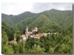
Alta Val Brevenna: frazione Senarega

Pietro Marcheselli - Canon EOS 300D 2009 - Estate - ValBrevenna - Paesi