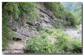
Strati di marne calcaree in Val Brevenna

Pietro Marcheselli - Canon EOS 300D 2007 - Estate - ValBrevenna - Altro