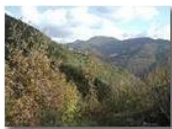
Pendici sud del M. Schigonzo: Caserza Frassinello Crosi

Pietro Marcheselli - Olympus Camedia 3000 2003 - Inverno - ValBrevenna - Panorami