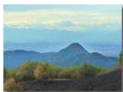
Incendio sul Monte Proventino, Valbrevenna

Pietro Marcheselli - HTC One S Nokia C7-00 (o altro cell) 2017 - Estate - ValBrevenna - Paesi