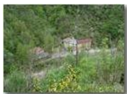
Santuario Madonna dell'Acqua o della Salute: Val Brevenna

Pietro Marcheselli - Olympus Camedia 3000 2002 - Estate - ValBrevenna - Paesi