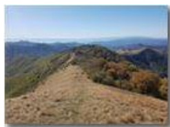
Dalla vetta del Monte Buio, riviera di Ponente (Capi Mele e Noli)

Guido Marcheselli - HTC One S Nokia C7-00 (o altro cell) 2017 - Estate - ValBrevenna - Panorami