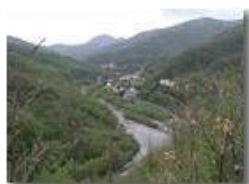
Molino Vecchio di Val Brevenna

Pietro Marcheselli - Olympus Camedia 3000 2002 - Estate - ValBrevenna - Paesi