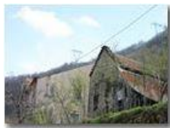
Frazione Crosi di Val Brevenna

Pietro Marcheselli - Canon EOS 300D 2005 - Estate - ValBrevenna - Paesi