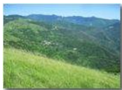
Boschi con i primi segnali del parassita lymantria in Val Brevenna

Pietro Marcheselli - Canon Ixus 980 IS 2010 - Inverno - ValBrevenna - Panorami