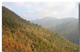
Colori d'autunno in Valbrevenna

Pietro Marcheselli - Canon EOS 300D 2006 - Inverno - ValBrevenna - Boschi