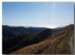
Riviera ligure di Ponente (Capo Noli, Capo Mele) dalla strada per il Monte Buio

Guido Marcheselli - HTC One S Nokia C7-00 (o altro cell) 2017 - Estate - ValBrevenna - Panorami