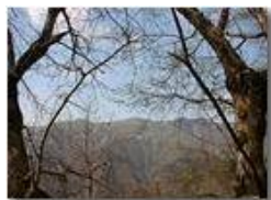
Val Brevenna (fraz. Porcile)

Pietro Marcheselli - Canon EOS 300D 2005 - Estate - ValBrevenna - Panorami