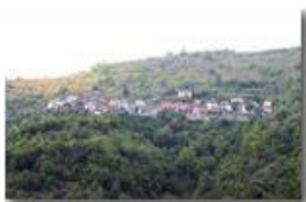
Alta Val Brevenna: frazione Chiappa

Pietro Marcheselli - Canon EOS 300D 2009 - Estate - ValBrevenna - Paesi