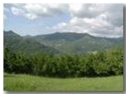
Paesini di Valbrevenna: Nenno Caserza e Ternano

Pietro Marcheselli - Olympus Camedia 3000 2002 - Estate - ValBrevenna - Panorami