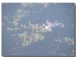
Frazione Piani, Valbrenna

Pietro Marcheselli - Panasonic nv-gs70 (VideoCam) 2005 - Inverno - ValBrenna - Paesi