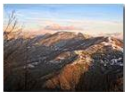
Monte Castello, Monte Liprando ecc: tra le Valli Brevenna e Pentemina

Pietro Marcheselli - Altro/Other 2013 - Inverno - ValBrevenna - Altro