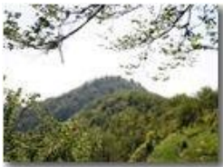
Val Brevenna: Monte Penzo

Pietro Marcheselli - Canon EOS 300D 2005 - Estate - ValBrevenna - Panorami