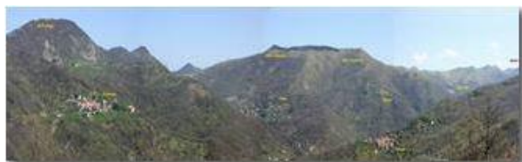
Monti e villaggi di Valbrevenna

Pietro Marcheselli - Olympus Camedia 3000 2006 - Inverno - ValBrevenna - Paesi