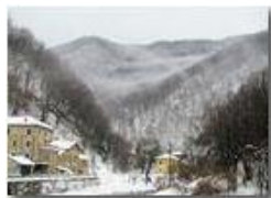
Inverno nevoso in Valbrevenna

Pietro Marcheselli - Olympus Camedia 3000 2006 - Inverno - ValBrevenna - Paesi