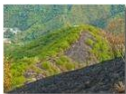
Incendio sul Monte Proventino, Valbrevenna

Pietro Marcheselli - Canon EOS 300D 2017 - Estate - ValBrevenna - Panorami