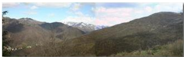
Panorama di Val Brevenna

Pietro Marcheselli - Canon EOS 300D 2005 - Estate - ValBrevenna - Paesi