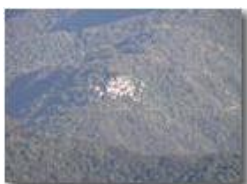
Cerviasca - Valbrenna

Pietro Marcheselli - Panasonic nv-gs70 (VideoCam) 2005 - Inverno - ValBrenna - Paesi