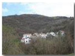
Frazione "I Piani" di Val Brevenna

Pietro Marcheselli - Canon EOS 300D 2005 - Estate - ValBrevenna - Panorami