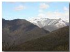
Nevicata tardiva in aprile sul Monte Antola

Pietro Marcheselli - Canon EOS 300D 2005 - Estate - ValBrevenna - Paesi