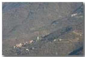
Valbrevenna, sinistra orografica: frazione Frassinello

Pietro Marcheselli - Canon EOS 300D 2008 - Inverno - ValBrevenna - Paesi