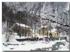
Valbrevenna : Santuario Madonna dell'Acqua sotto la neve

Pietro Marcheselli - Olympus Camedia 3000 2006 - Inverno - ValBrevenna - Paesi