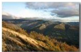
Ultime luci della sera in Valbrevenna

Pietro Marcheselli - Canon EOS 300D 2008 - Inverno - ValBrevenna - Paesi