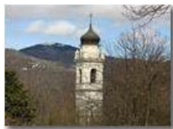
Il campanile di Frassinello (Val Brevenna)

Pietro Marcheselli - Canon EOS 300D 2005 - Estate - ValBrevenna - Paesi