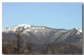
Marzo: neve sul Monte Antola

Pietro Marcheselli - Canon EOS 300D 2008 - Inverno - ValBrevenna - Paesi