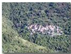
Pareto Val Brevenna

Pietro Marcheselli - Olympus Camedia 3000 2002 - Estate - ValBrevenna - Paesi