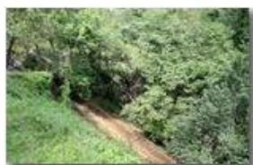
Scivolo calcareo vicino a Tonno

Pietro Marcheselli - Canon Ixus 980 IS 2014 - Estate - ValBrevenna - Panorami