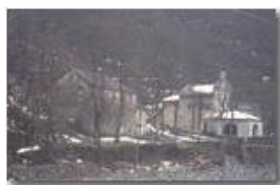
Santuario Madonna dell'Acqua (Val Brevenna)

Pietro Marcheselli - Scanner <2001 - Inverno - ValBrevenna - Paesi