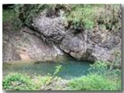
Un angolo del torrente Brevenna

Pietro Marcheselli - Canon EOS 300D 2009 - Estate - ValBrevenna - Paesi