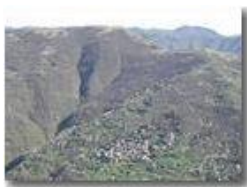
Frassinello in Valbrenna

Pietro Marcheselli - Panasonic nv-gs70 (VideoCam) 2004 - Estate - ValBrenna - Paesi