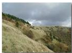
Val Brevenna: versante sud del M. Proventino

Pietro Marcheselli - Olympus Camedia 3000 2003 - Inverno - ValBrevenna - Panorami