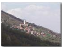
Val Brenna: Frassinello (videocamera Panasonic nv-gs70)

Pietro Marcheselli - Panasonic nv-gs70 (VideoCam) 2004 - Estate - ValBrenna - Fiori&Fauna