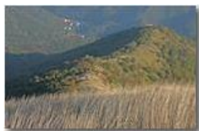
Molino Vecchio di Valbrevenna, dal M. Proventino

Pietro Marcheselli - Canon EOS 300D 2007 - Estate - ValBrevenna - Paesi