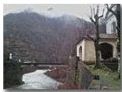
Al Santuario Madonna dell'Acqua

Pietro Marcheselli - Altro/Other 2014 - Inverno - ValBrevenna - Paesi