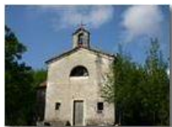
Madonna della Guardia tra le valli Brevenna e Pentemina

Pietro Marcheselli - Canon EOS 300D 2005 - Estate - ValBrevenna - Paesi