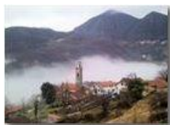
Nenno in una giornata piovosa

Guido Marcheselli - Nokia C7-00 (o altro Smartphone) 2013 - Estate - ValBrevenna - Paesi