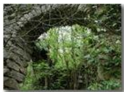
Ruderi in Val Brevenna

Pietro Marcheselli - Olympus Camedia 3000 2002 - Estate - ValBrevenna - Paesi