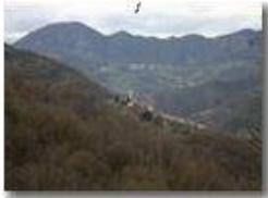
Val Brevenna: le frazioni Frassinello e M. Maggio e Sorrivi

Pietro Marcheselli - Canon EOS 300D 2005 - Estate - ValBrevenna - Panorami