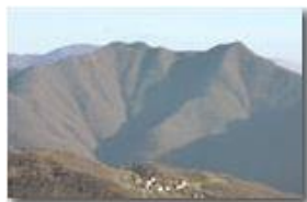
Valbrevenna: sinistra orografica: frazione Cascinette e Monte Bano

Pietro Marcheselli - Canon EOS 300D 2008 - Inverno - ValBrevenna - Panorami