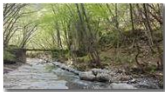
Tonno, il mulino

Guido Marcheselli - HTC One S Nokia C7-00 (o altro cell) 2016 - Estate - ValBrevenna - Paesi