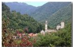
Alta Val Brevenna: frazione Senarega

Pietro Marcheselli - Canon EOS 300D 2009 - Inverno - ValBrevenna - Panorami