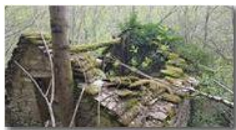
Edifici vicino al mulino di Tonno: tetto sfondato

Guido Marcheselli - HTC One S Nokia C7-00 (o altro cell) 2016 - Estate - ValBrevenna - Paesi