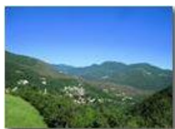
Nenno di Valbrevenna: boschi infestati da lymantria

Pietro Marcheselli - Canon Ixus 980 IS 2012 - Estate - ValBrevenna - Panorami