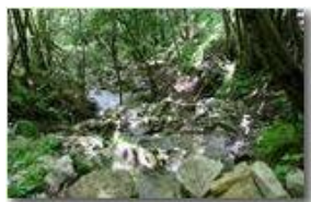
Ruscelli selvaggi tra Tonno e Chiappa

Guido Marcheselli - Canon EOS 300D 2014 - Estate - ValBrevenna - Boschi