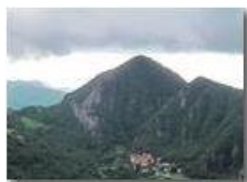
Sipario di nubi sospeso sul Monte Maggio

Pietro Marcheselli - Canon EOS 300D 2010 - Estate - ValBrevenna - Paesi