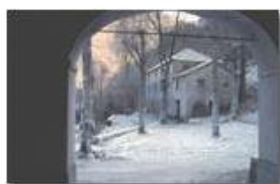
Santuario Madonna dell'Acqua (Val Brevenna)

Pietro Marcheselli - Scanner <2001 - Inverno - ValBrevenna - Paesi