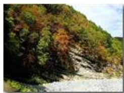
Boschi sofferenti per siccità prolungata

Pietro Marcheselli - HTC One S Nokia C7-00 (o altro cell) 2017 - Estate - ValBrevenna - Paesi