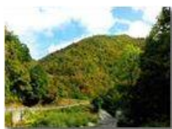
Boschi sofferenti per siccità

Pietro Marcheselli - HTC One S Nokia C7-00 (o altro cell) 2017 - Estate - ValBrevenna - Boschi