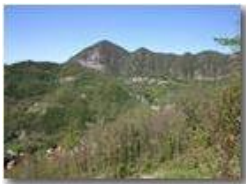
Nenzo, Sorrivi e Monte Maggio

Pietro Marcheselli - Canon EOS 300D 2005 - Estate - ValBrevenna - Panorami