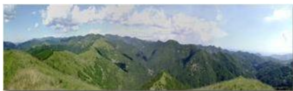
La Val Brevenna dal Monte Proventino

Pietro Marcheselli - Scanner <2001 - Inverno - ValBrevenna - Paesi