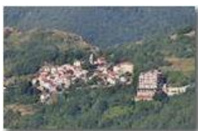
Val Vobbia: l'abitato di Alpe

Pietro Marcheselli - Canon Ixus 980 IS 2010 - Estate - ValBrevenna - Altro