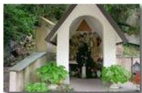
Salus infirmorum: cappella con fonte al Santuario Madonna dell'Acqua

Pietro Marcheselli - Canon EOS 300D 2007 - Estate - ValBrevenna - Altro