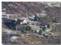
Tra le chiazze di neve spunta il campanile del paese di Clavarezza

Pietro Marcheselli - HTC One S Nokia C7-00 (o altro cell) 2018 - Estate - ValBrevenna - Paesi