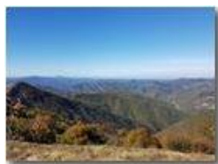
Dalla vetta del Monte Buio: Crocefieschi, Rocche del Reopasso, Pianura Padana e Alpi (Monviso)

Guido Marcheselli - HTC One S Nokia C7-00 (o altro cell) 2017 - Estate - ValBrevenna - Panorami