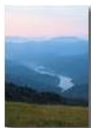
Panorama all'alba dal monte Antola sul lago del Brugneto

Guido Marcheselli - Altro/Other 2007 - Estate - ValBrevenna - Panorami