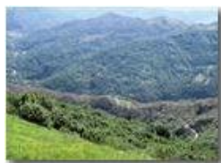
Boschi infestati da lymantria in Val Brevenna

Pietro Marcheselli - Canon Ixus 980 IS 2012 - Estate - ValBrevenna - Panorami