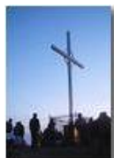
Inaugurazione del rifugio sul monte antola: alba in vetta.

Pietro Marcheselli - Canon EOS 300D 2007 - Estate - ValBrevenna - Paesi