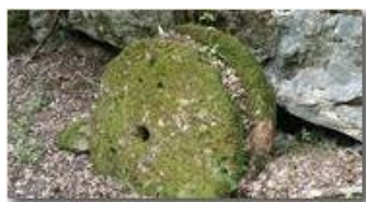
La macina del vecchio mulino di Tonno

Guido Marcheselli - HTC One S Nokia C7-00 (o altro cell) 2016 - Estate - ValBrevenna - Paesi