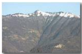
Frazioni Cerviasca, Roiale, Piancassina e Lavazzuoli

Pietro Marcheselli - Canon EOS 300D 2008 - Inverno - ValBrevenna - Paesi