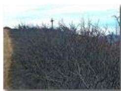
Incendio sul Monte Proventino, Valbrevenna

Pietro Marcheselli - Canon EOS 300D 2017 - Estate - ValBrevenna - Panorami